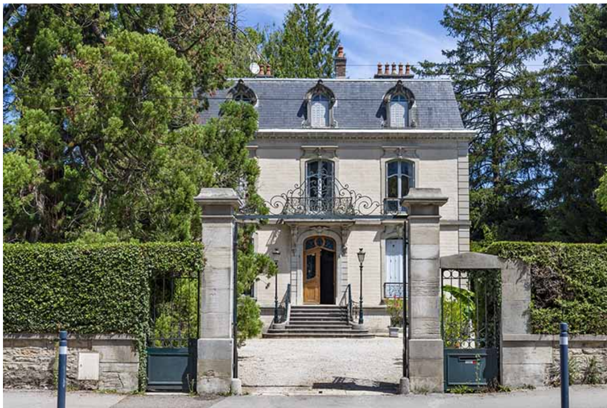
Maison, 25 avenue Camille Prost.

39, Lons-le-Saunier, 13 avenue Camille Prost