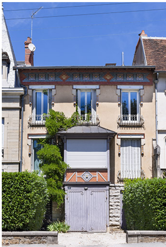
Maison, 15 avenue Camille Prost.

39, Lons-le-Saunier, 13 avenue Camille Prost