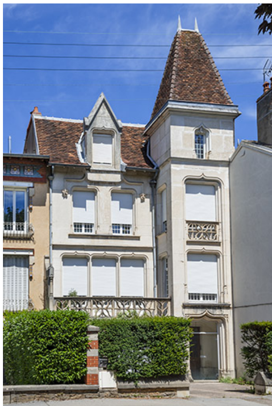
Maison, 17 avenue Camille Prost.

39, Lons-le-Saunier, 13 avenue Camille Prost