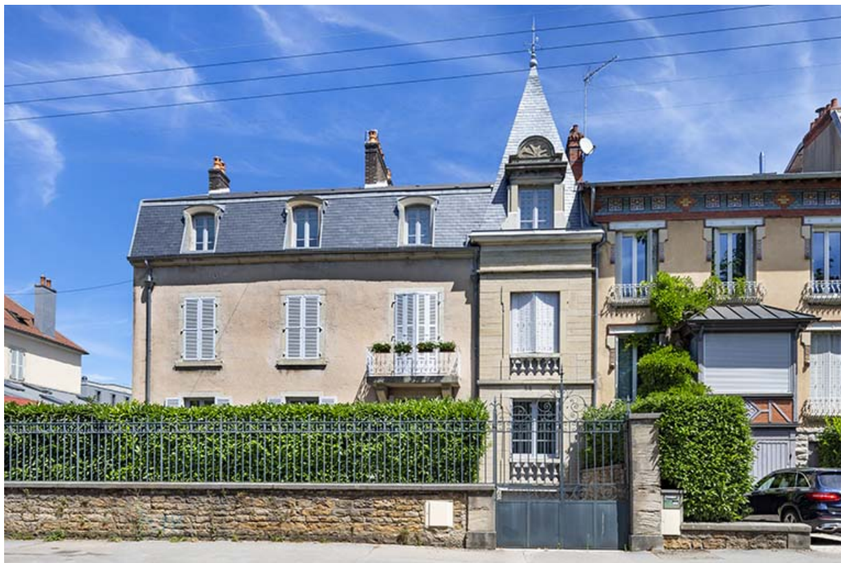
Maison, 13 avenue Camille Prost.

39, Lons-le-Saunier, 13 avenue Camille Prost