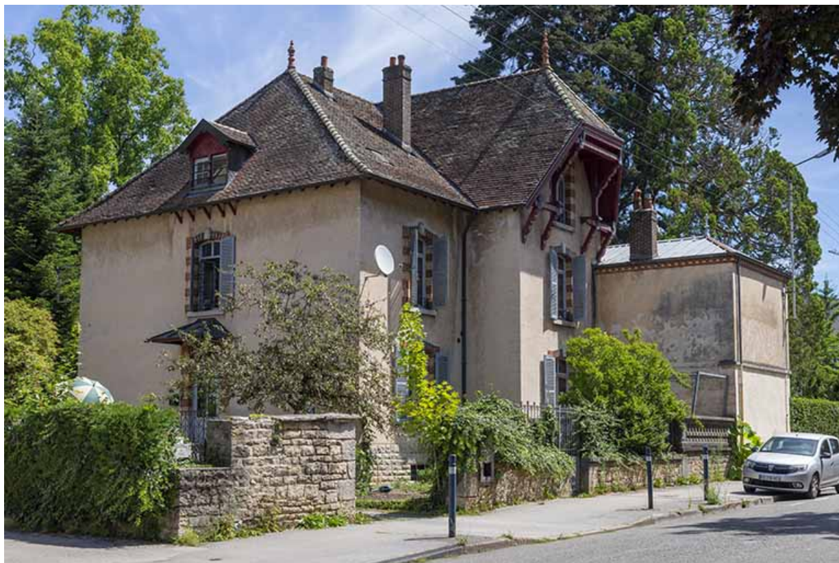
Maison, 23 avenue Camille Prost.

39, Lons-le-Saunier, 13 avenue Camille Prost