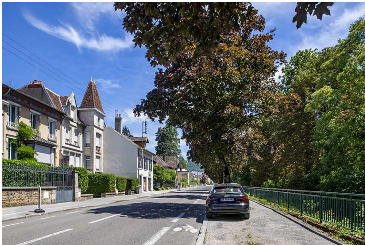
Vue de l'avenue en direction de l'est.

39, Lons-le-Saunier, 13 avenue Camille Prost