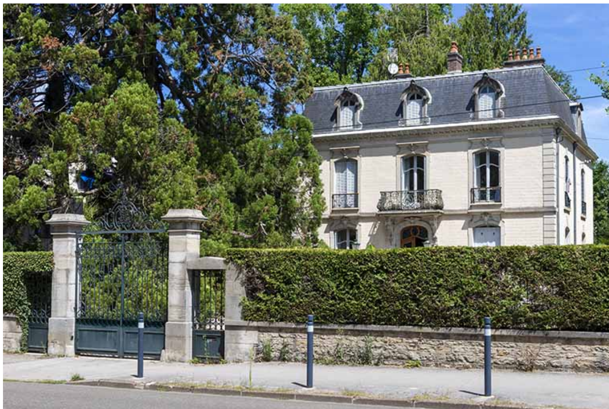
Maison, 25 avenue Camille Prost.

39, Lons-le-Saunier, 13 avenue Camille Prost