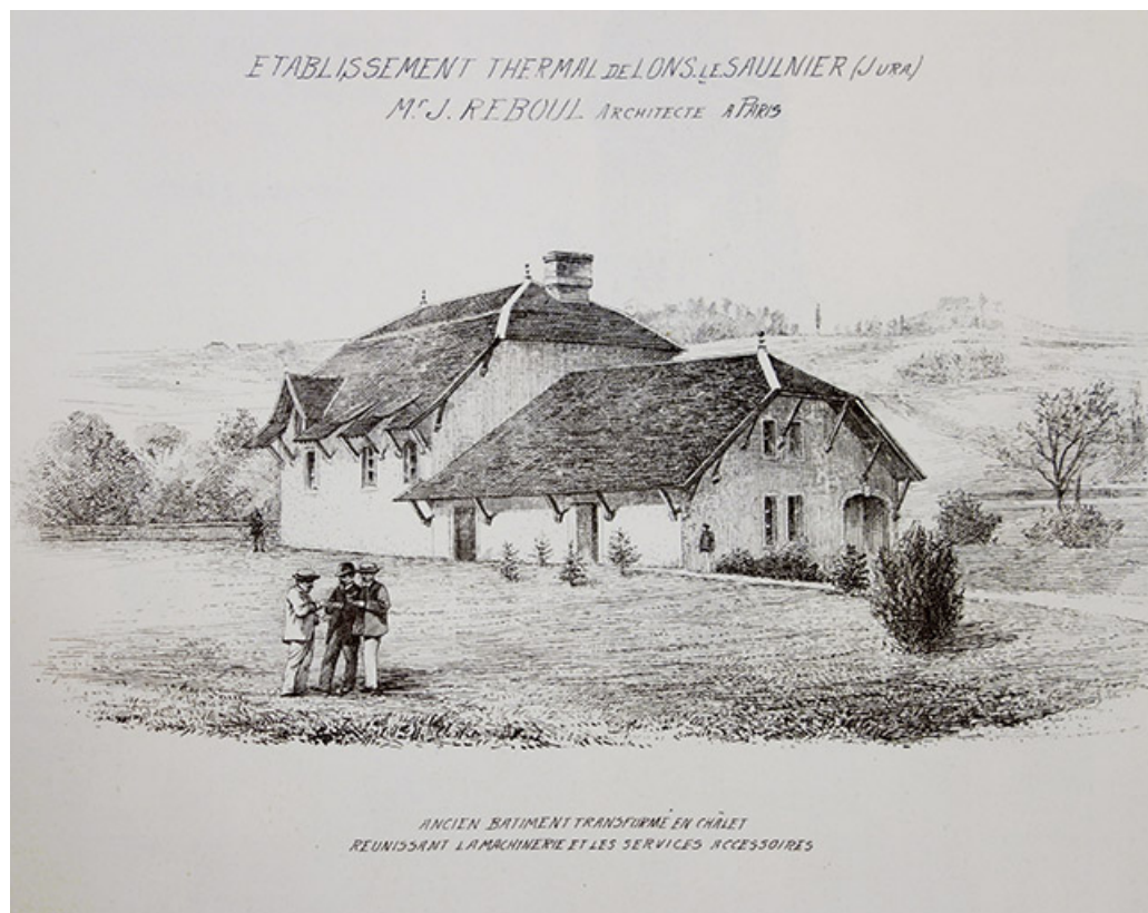
Vue ancienne (1896).