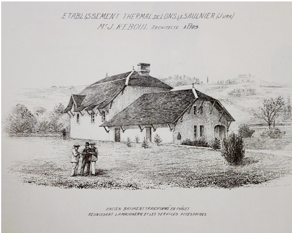
Vue ancienne (1896). 39, Lons-le-Saunier, 2 rue de Pavigny