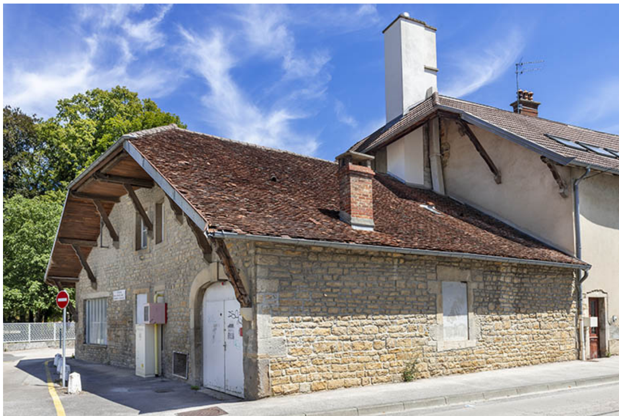
Vue depuis le sud-ouest.