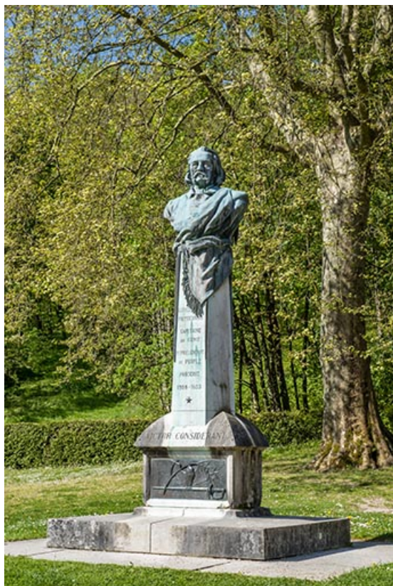
Monument composé d'un emmarchement, d'un soubassement et d'un piédestal surmonté d'un buste. 39, Salins-les-Bains rue Béchet