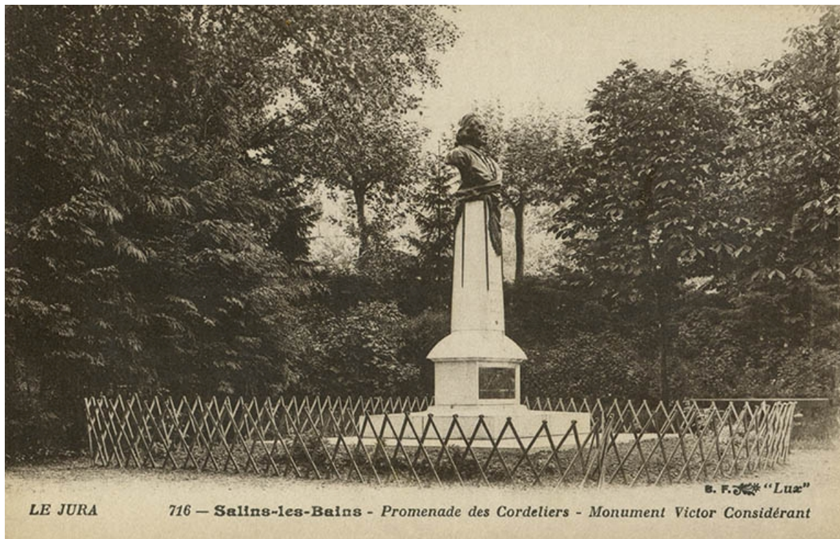
Vue ancienne du monument dans le parc des Cordeliers.