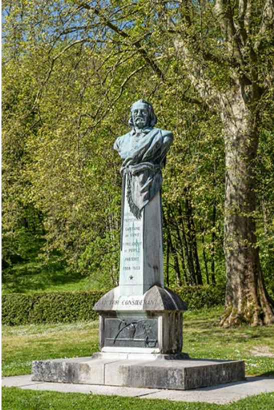
Monument composé d'un emmarchement, d'un soubassement et d'un piédestal surmonté d'un buste. 39, Salins-les-Bains rue Béchet