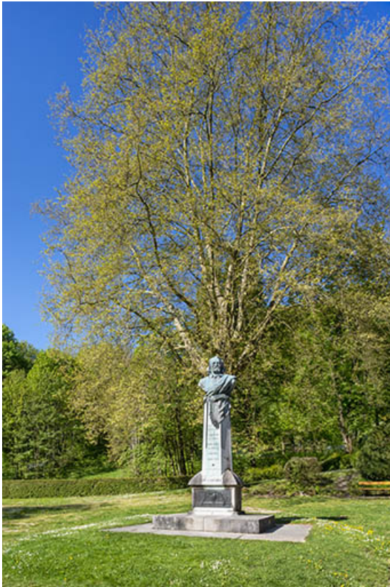
Vue actuelle du monument dans le parc des Cordeliers.