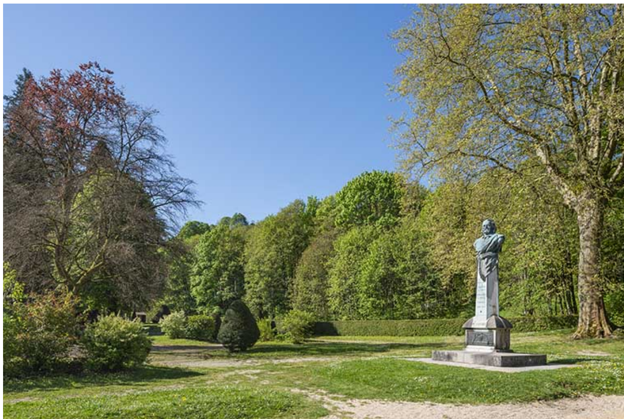
Abords du monument à Victor Considerant.