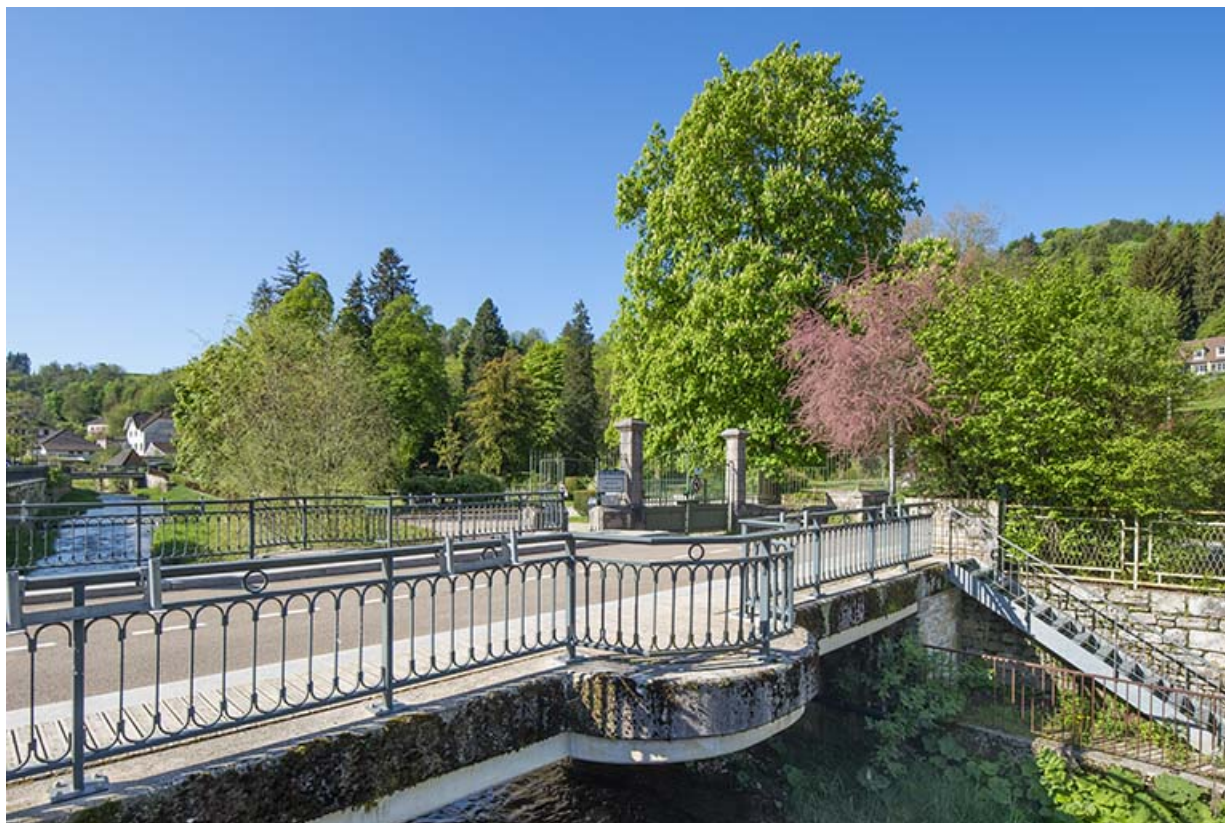
Vue depuis le pont de la rue Béchet.