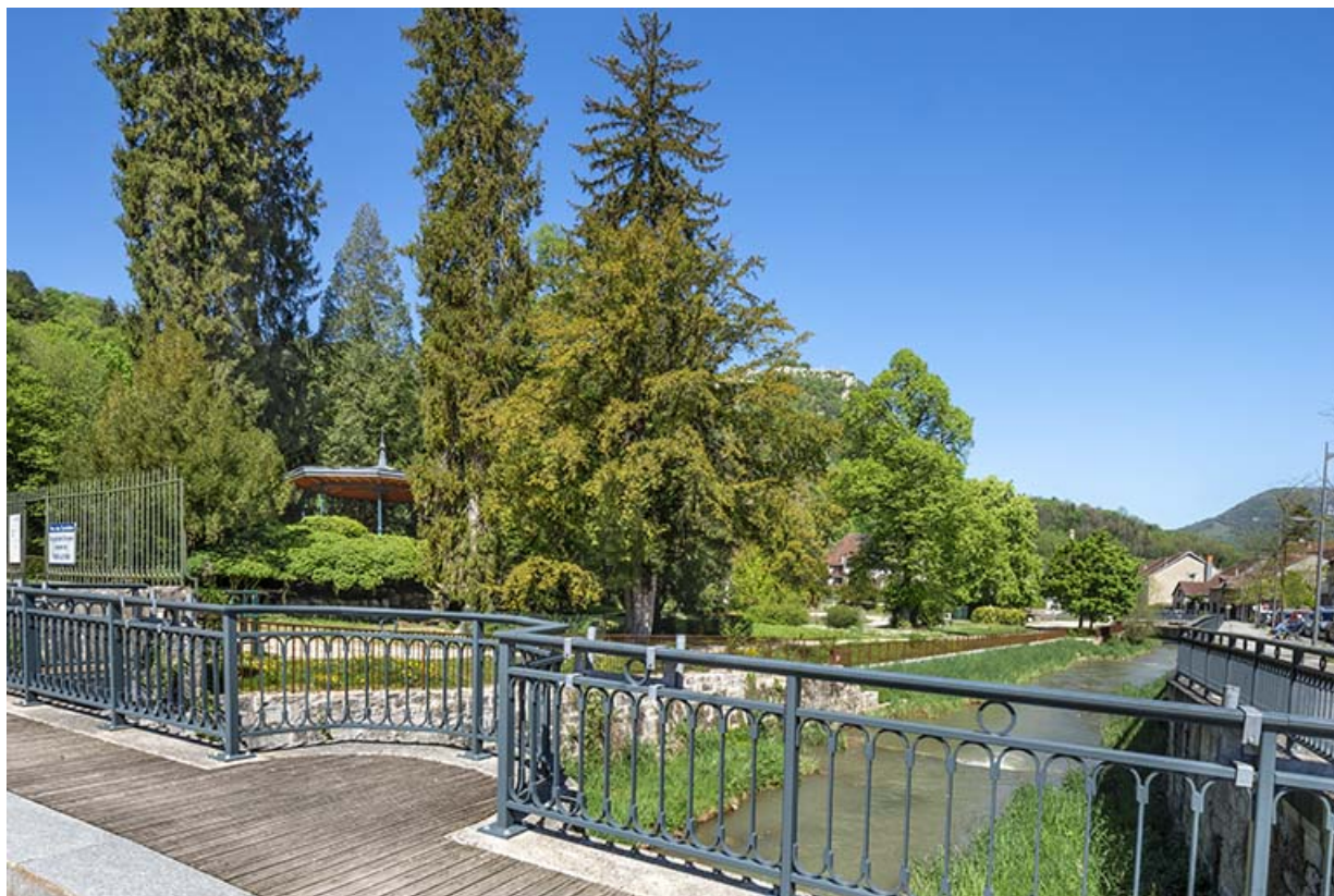
Vue depuis le pont de la rue du faubourg Saint-Nicolas.