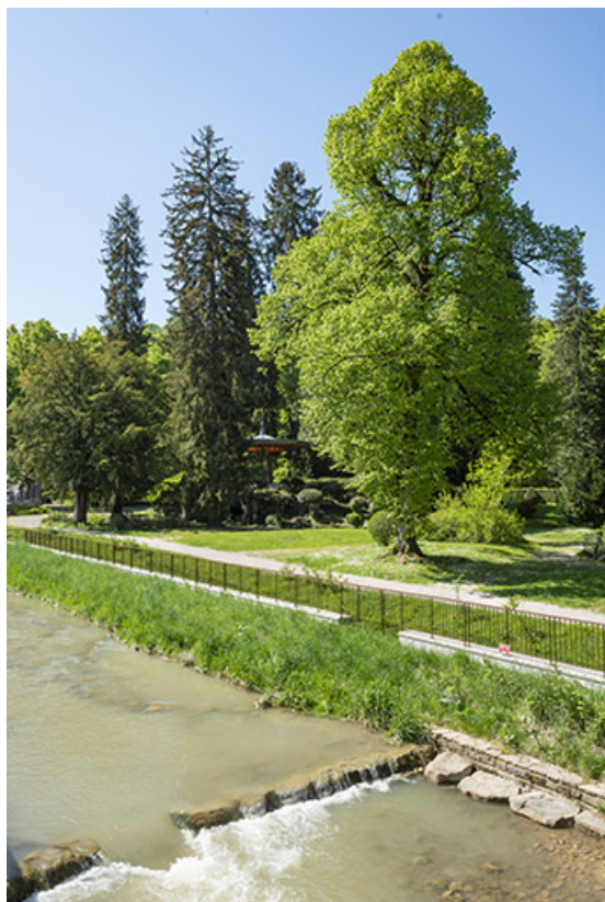
Berges de la Furieuse réaménagées en 2019.