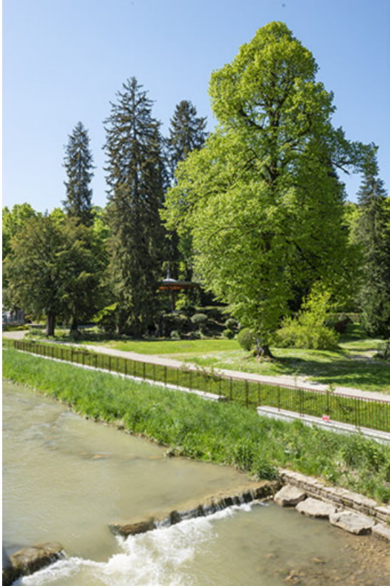
Berges de la Furieuse réaménagées en 2019.