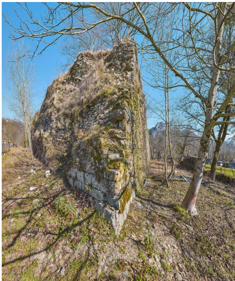
"Pointe" de la lunette tournée vers le sud.