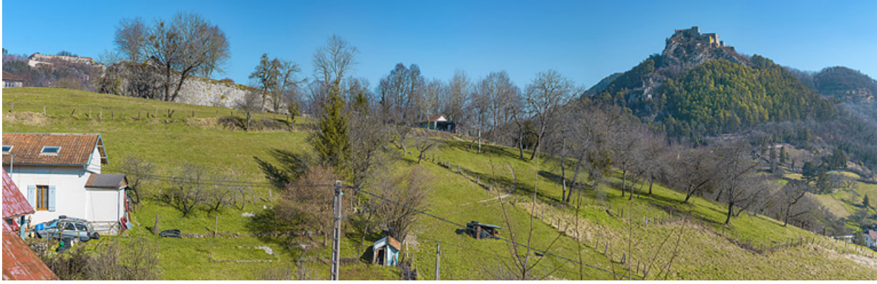
Le fort Bracon à gauche.