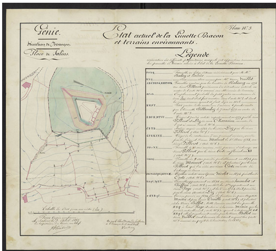
Place de Salins. État actuel de la lunette Bracon et terrains environnants. 1858. 39, Bracon rue du Fort Bracon