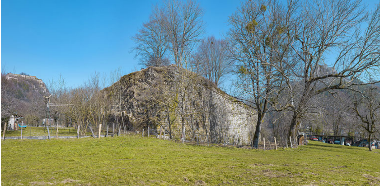
Vue depuis le sud.