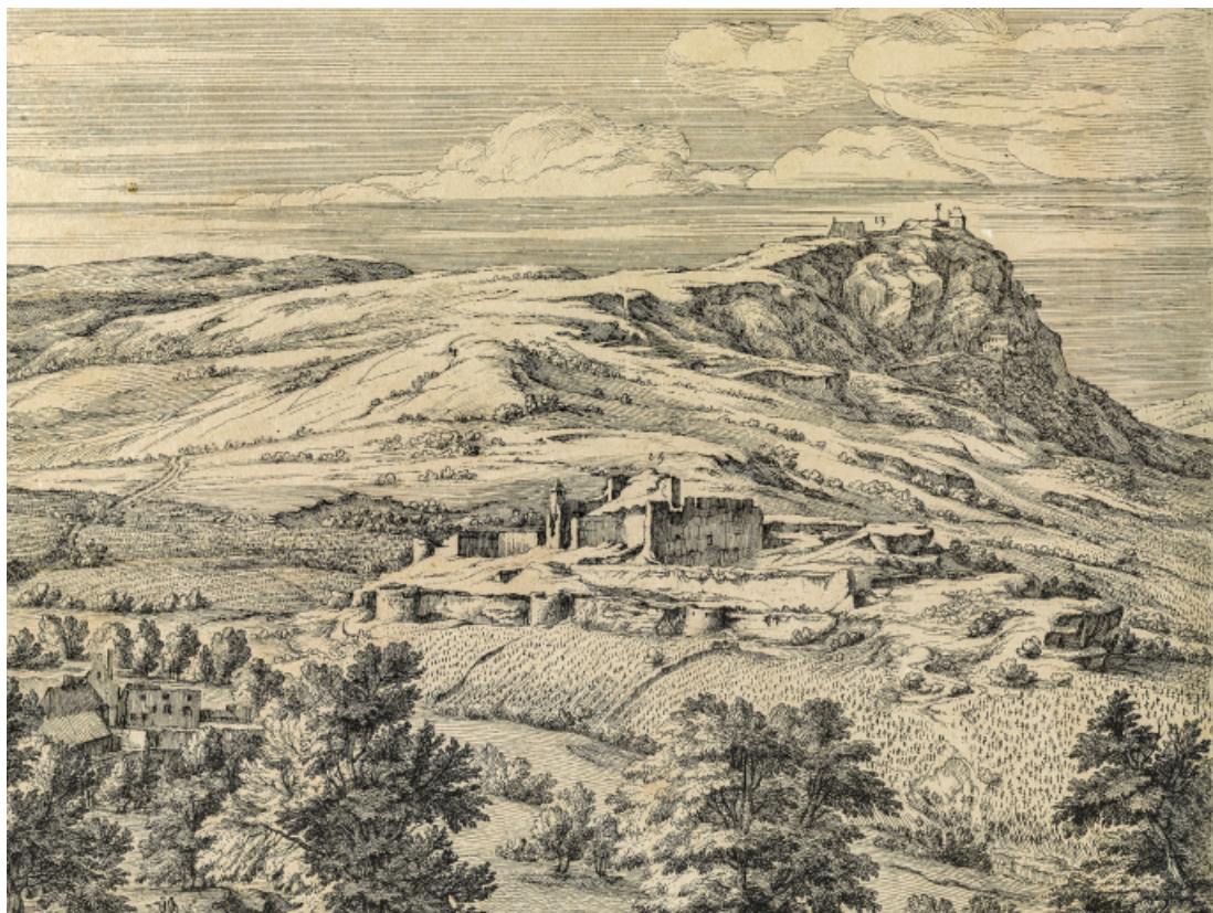
Siège de Salins : détail de la croix de Saint-André et du donjon. [vers 1674].

39, Salins-les-Bains chemin du Fort Saint-André, lieudit : Fort Saint-André