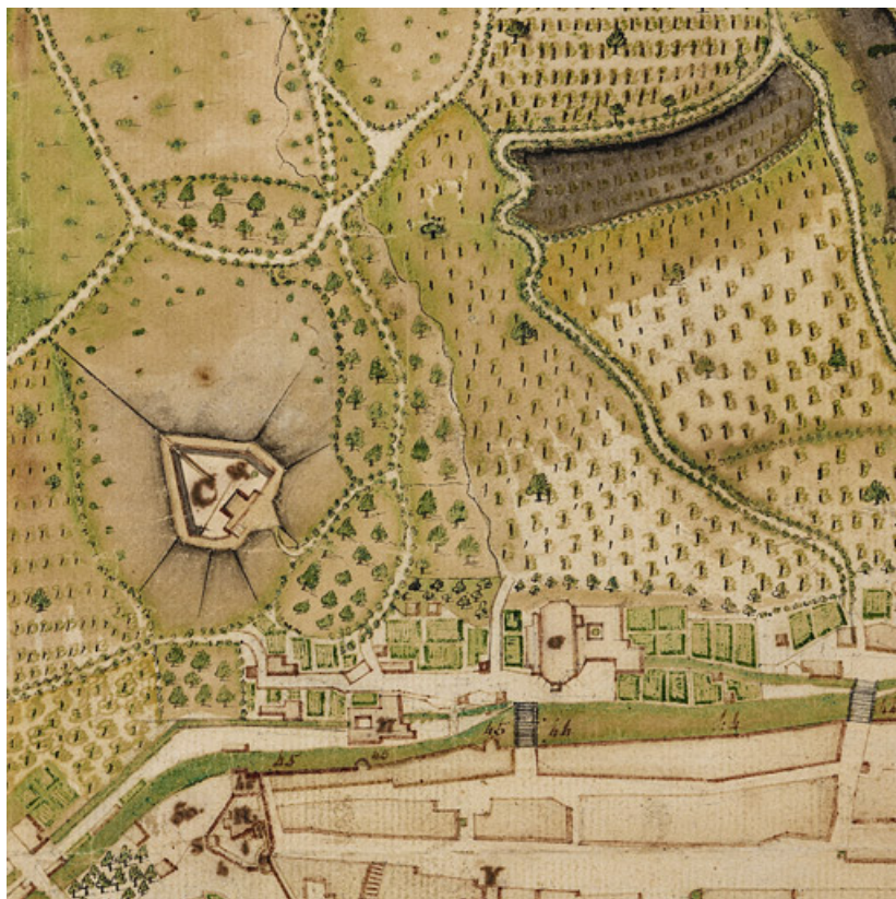
Le fort Bracon. 1782. 39, Bracon rue du Fort Bracon