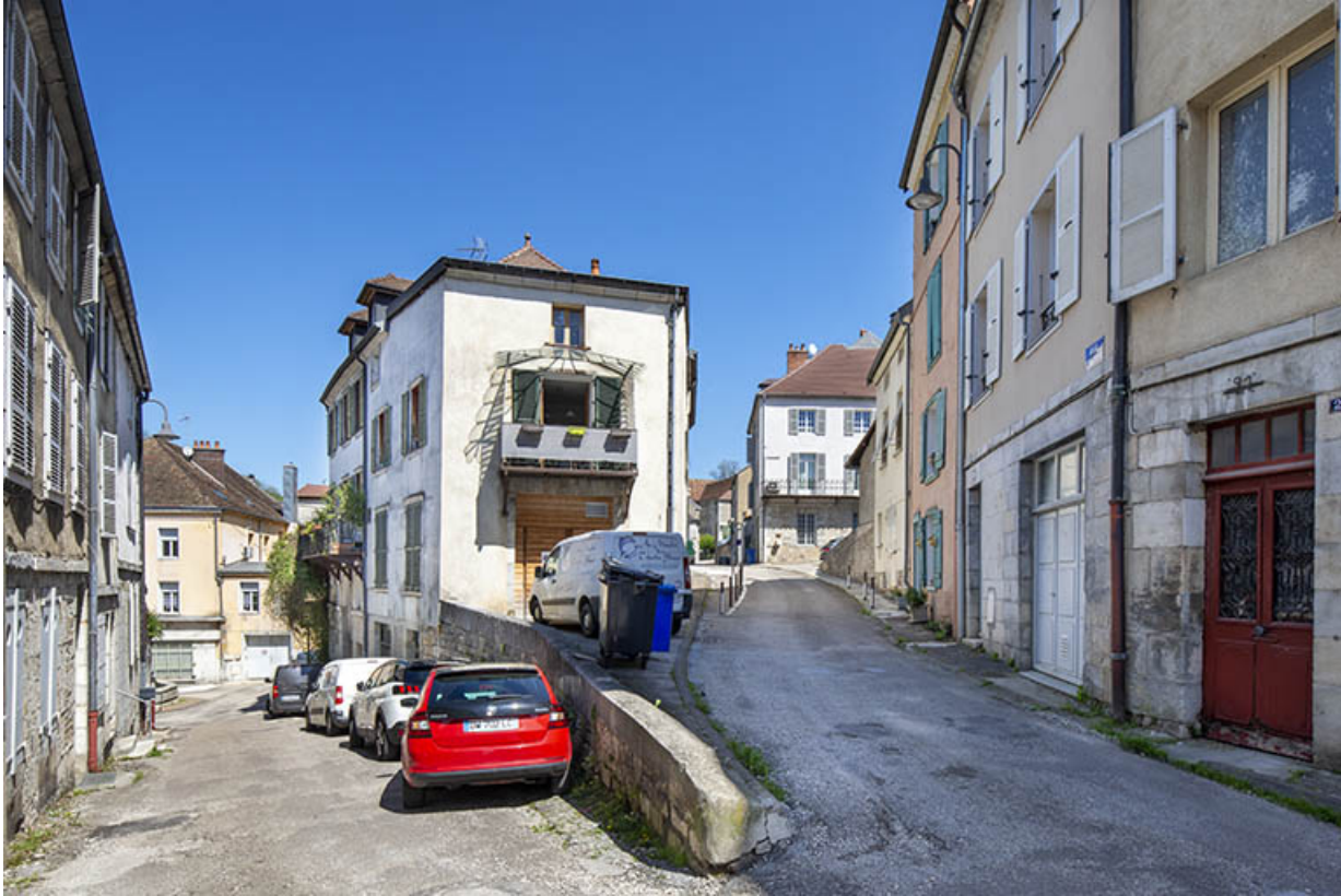
Vue depuis le croisement de la ruelle du Vigneron (à gauche) et de la rue Considerant (à droite).

39, Salins-les-Bains, 5 place du Vigneron