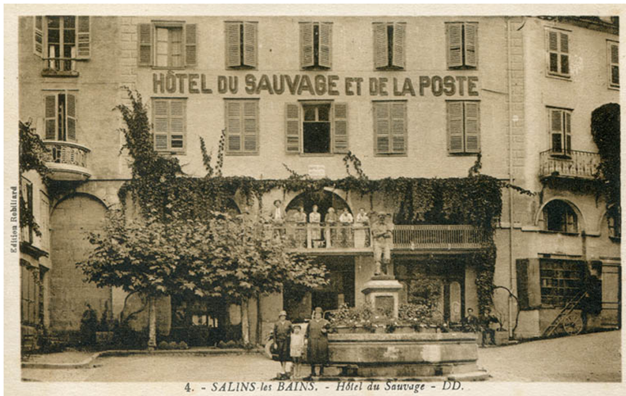
Salins-les-Bains - Hôtel du Sauvage, s.d. [fin 19e ou début 20e siècle].

39, Salins-les-Bains, 5 place du Vigneron