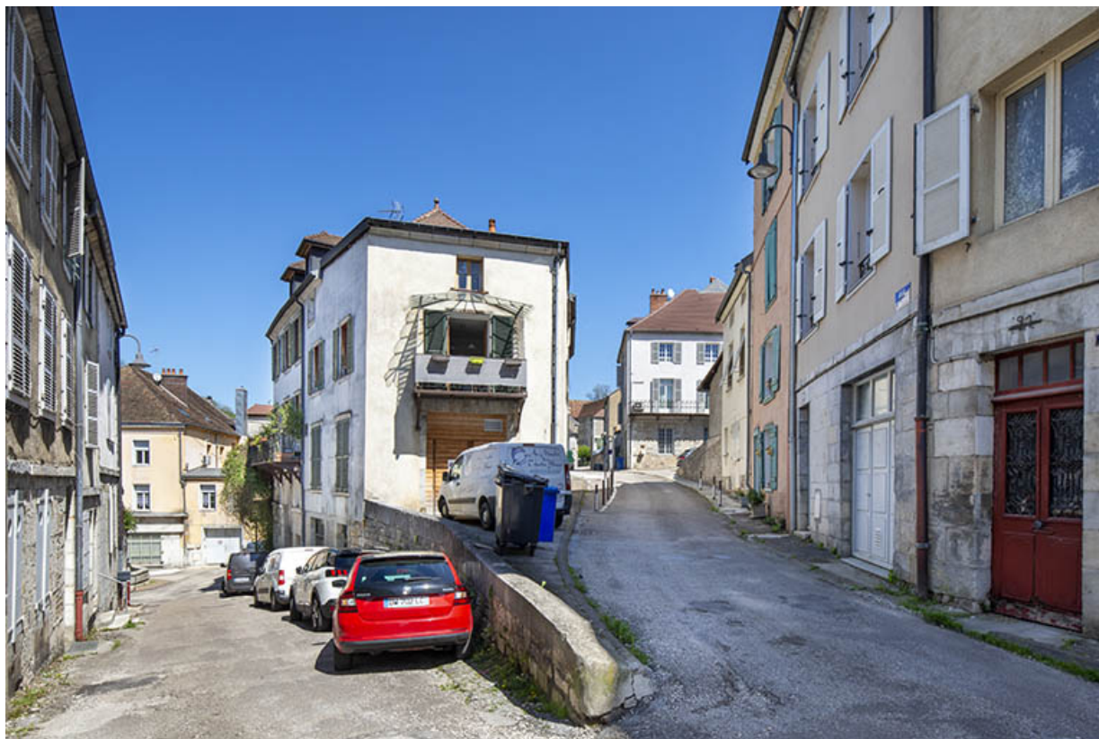
Vue depuis le croisement de la ruelle du Vigneron (à gauche) et de la rue Considerant (à droite). 39, Salins-les-Bains, 5 place du Vigneron