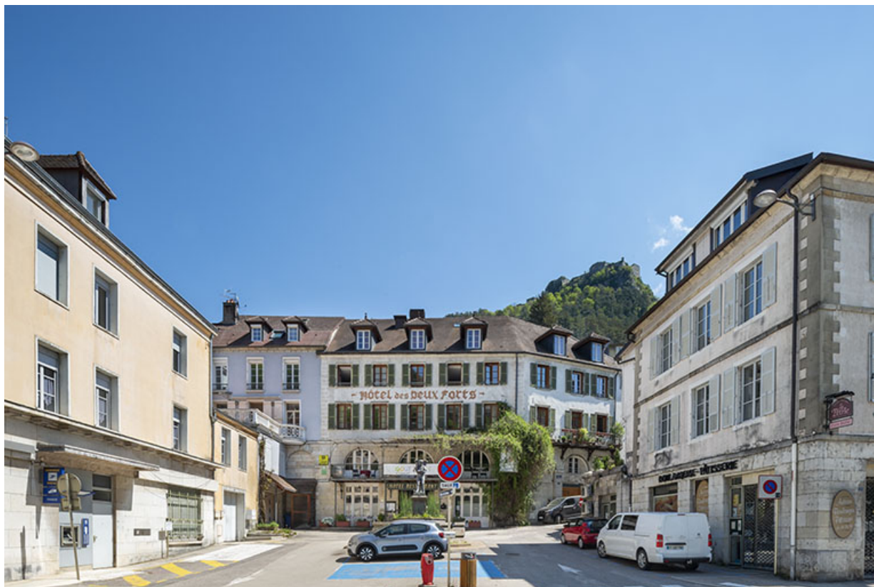
Place du Vigneron, avec l'hôtel surplombé par le fort Belin.

39, Salins-les-Bains, 5 place du Vigneron