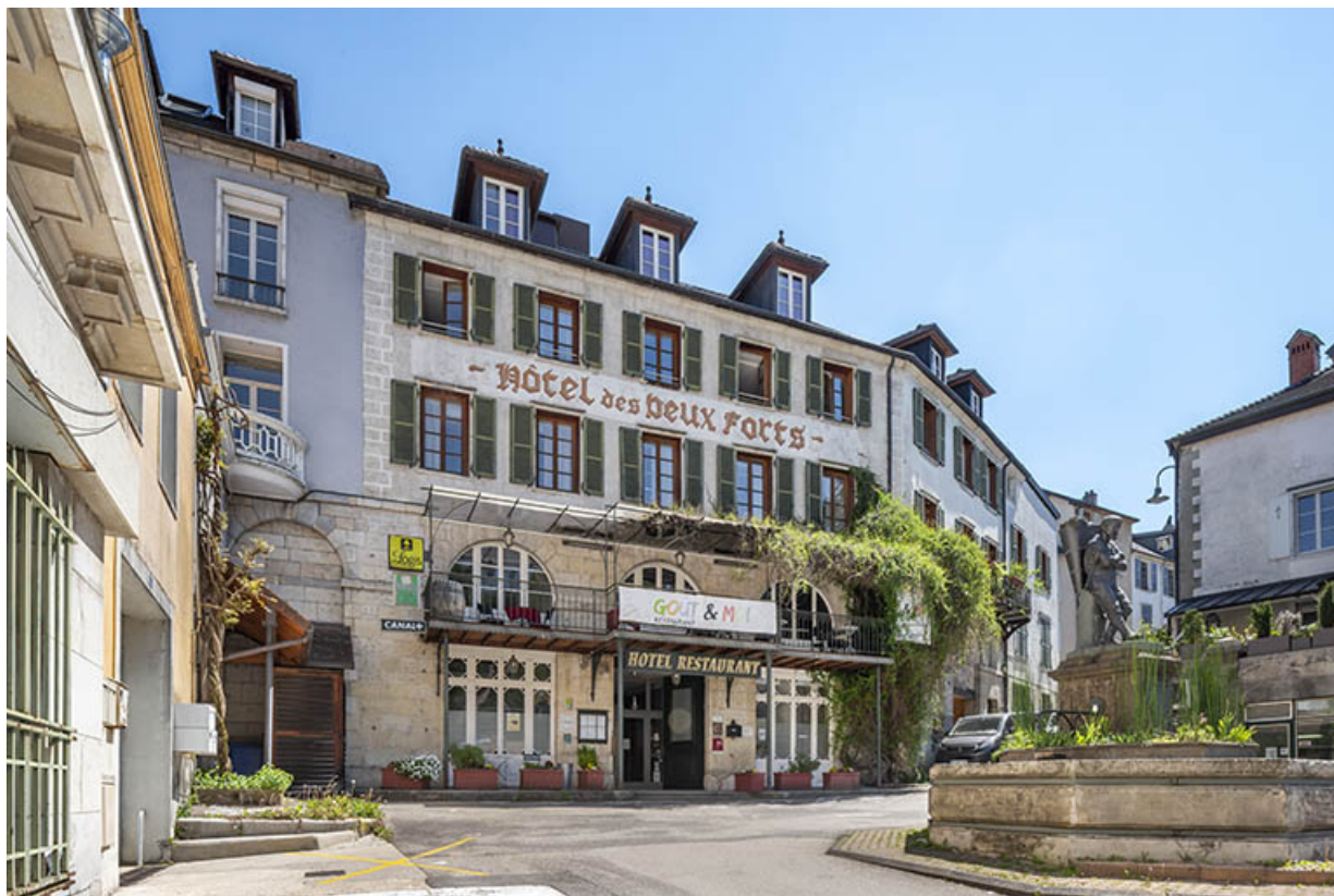
Façade sur la place du Vigneron, vue de trois quarts.

39, Salins-les-Bains, 5 place du Vigneron