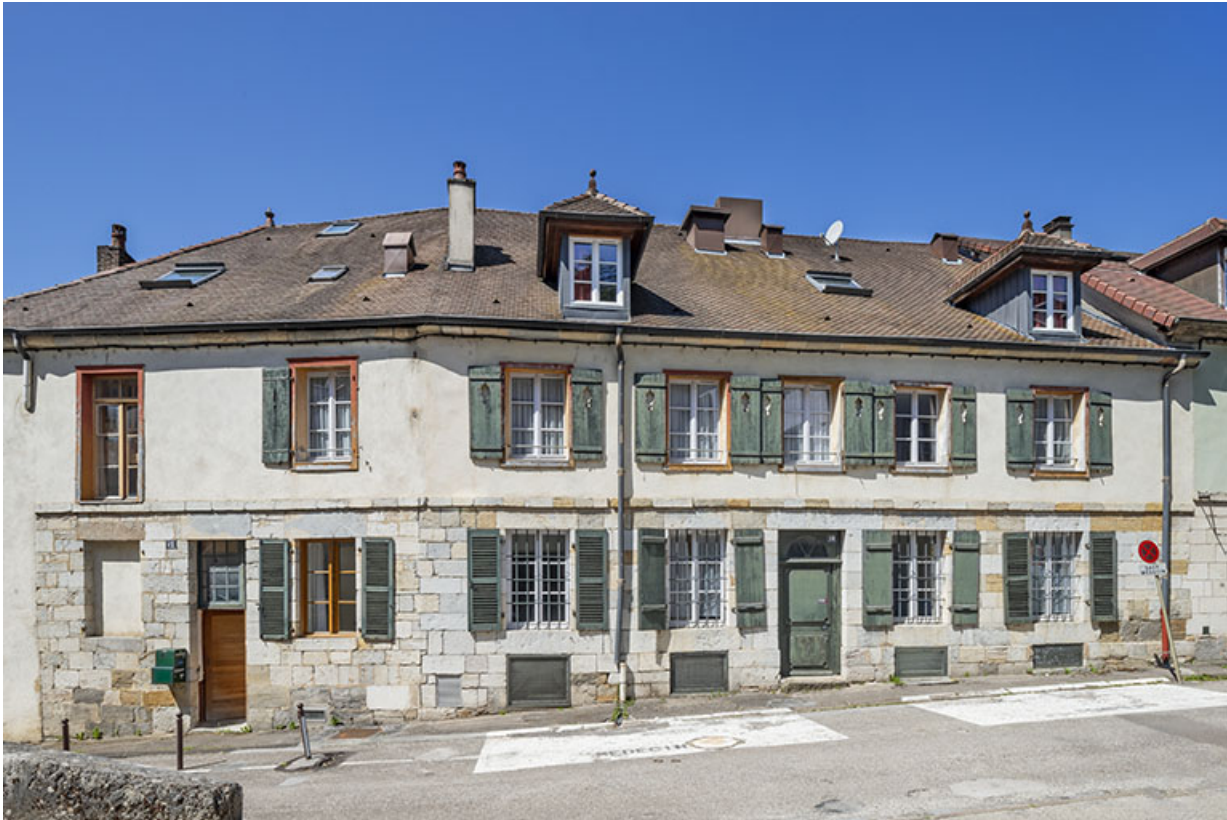
Façade sur la rue Considerant.

39, Salins-les-Bains, 5 place du Vigneron