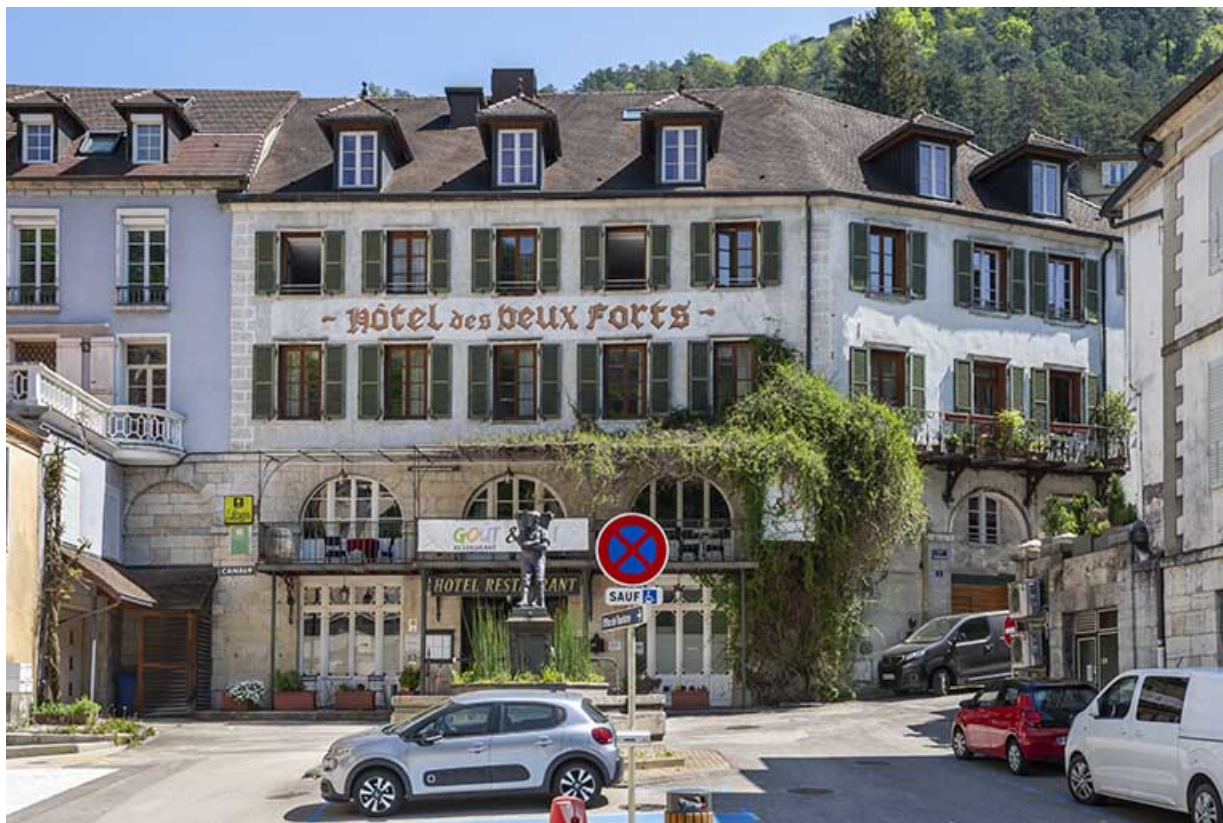
Façade sur la place du Vigneron, vue de face.

39, Salins-les-Bains, 5 place du Vigneron