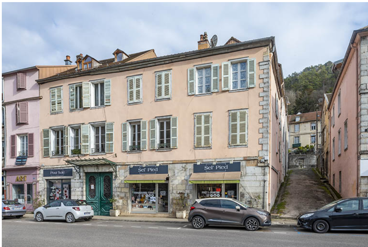
Façade sur la rue de la République.

39, Salins-les-Bains, 17 rue de la République