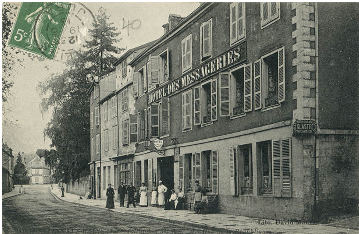
Vue ancienne (vers 1913).

39, Salins-les-Bains, 17 rue de la République