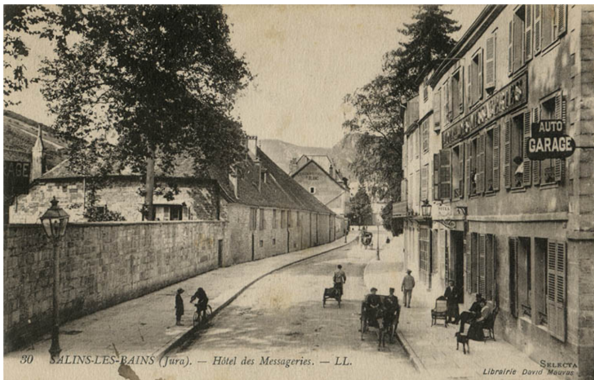
Vue ancienne (vers 1915).

39, Salins-les-Bains, 17 rue de la République