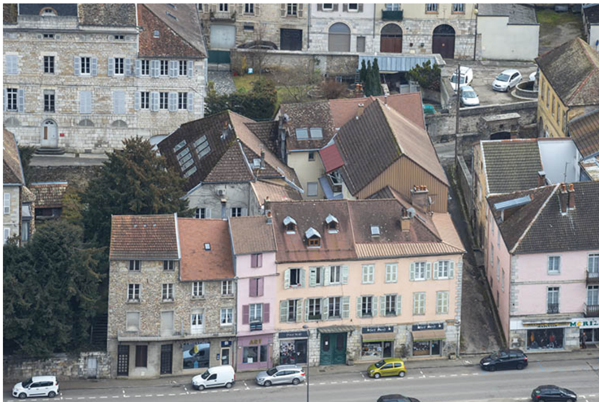
Vue depuis le mont Saint-André.

39, Salins-les-Bains, 17 rue de la République