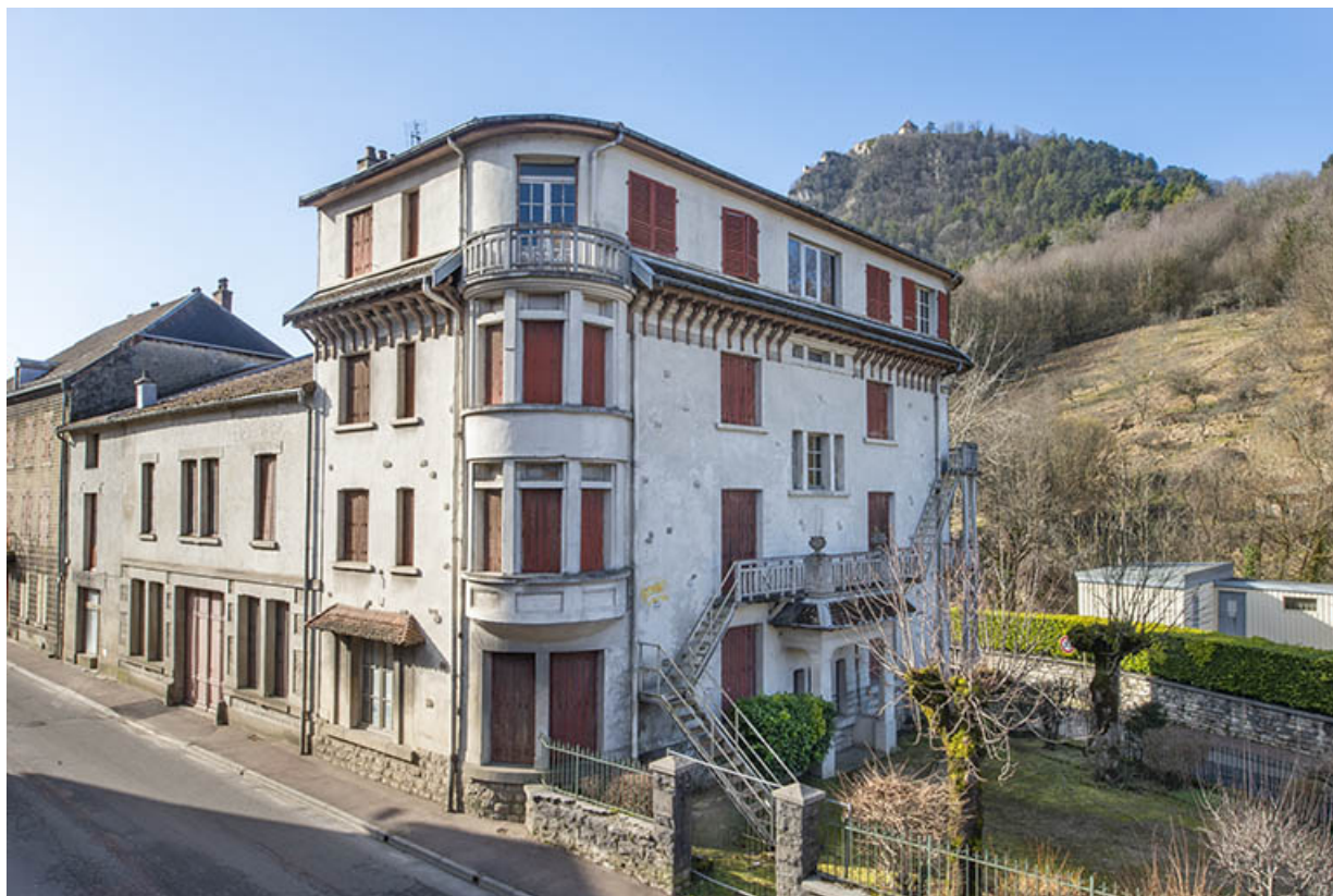
Vue depuis le nord-est.