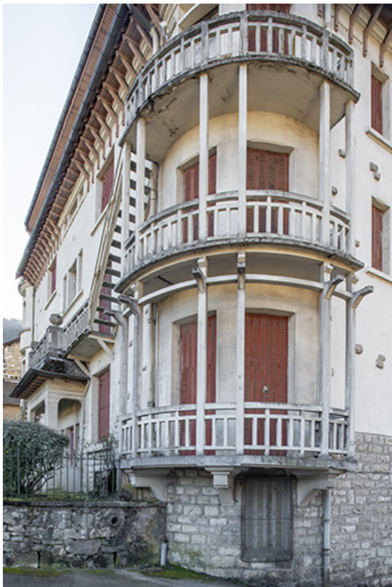
Balcons de l'angle nord-ouest.