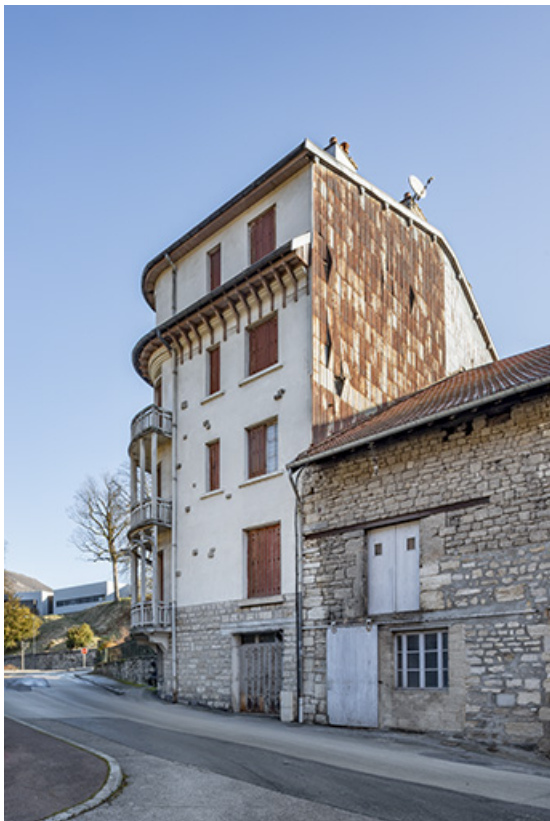
Vue depuis le sud-ouest.