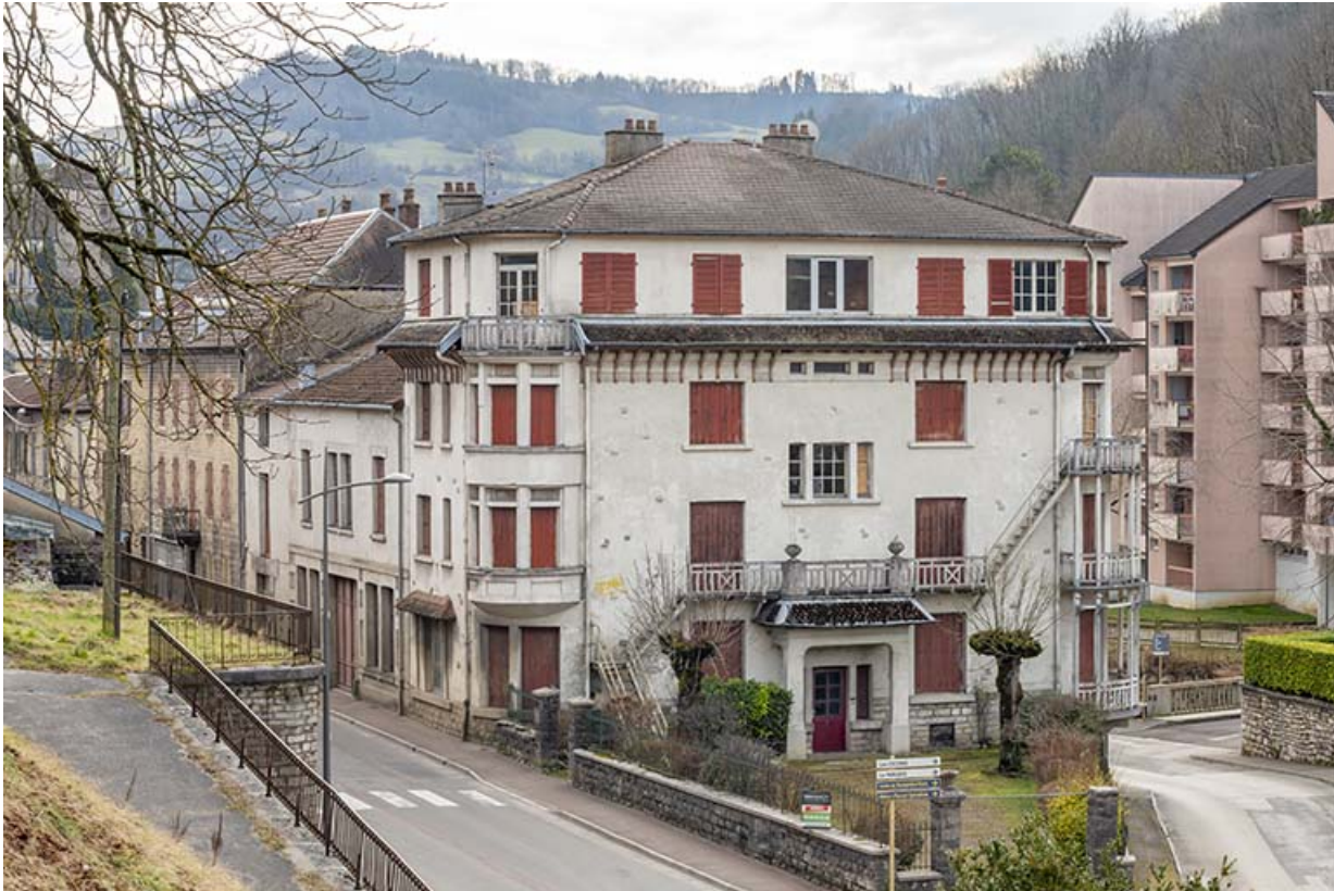
Façade principale, angle de la rue Gambetta (à gauche) et de la rue des Barres (à droite). 39, Salins-les-Bains, 23B rue Gambetta