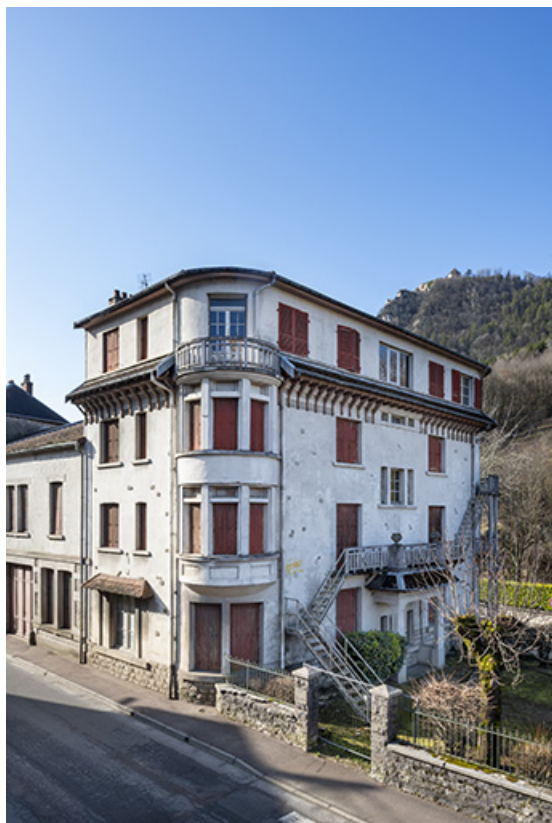
Vue depuis le nord-est.