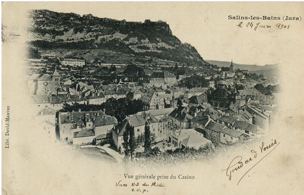
Vue prise depuis les flancs du Mont Saint-André. 39, Salins-les-Bains rue des Barres