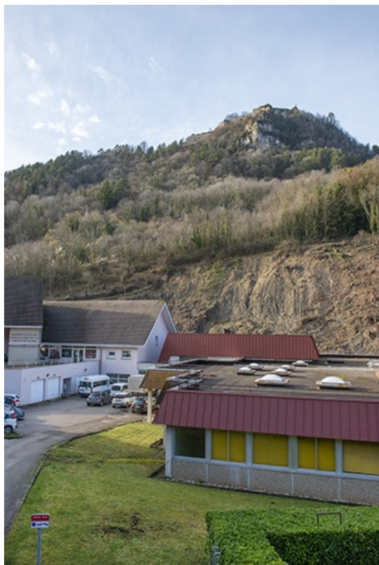
Site du casino (détruit), actuellement occupé par le centre hospitalier. 39, Salins-les-Bains rue des Barres