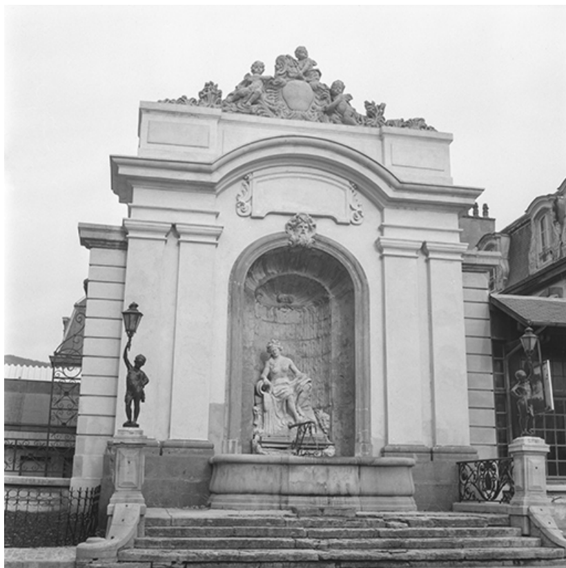
Vue d'ensemble, s.d. [vers 1960].

39, Salins-les-Bains place des Alliés et de la Résistance