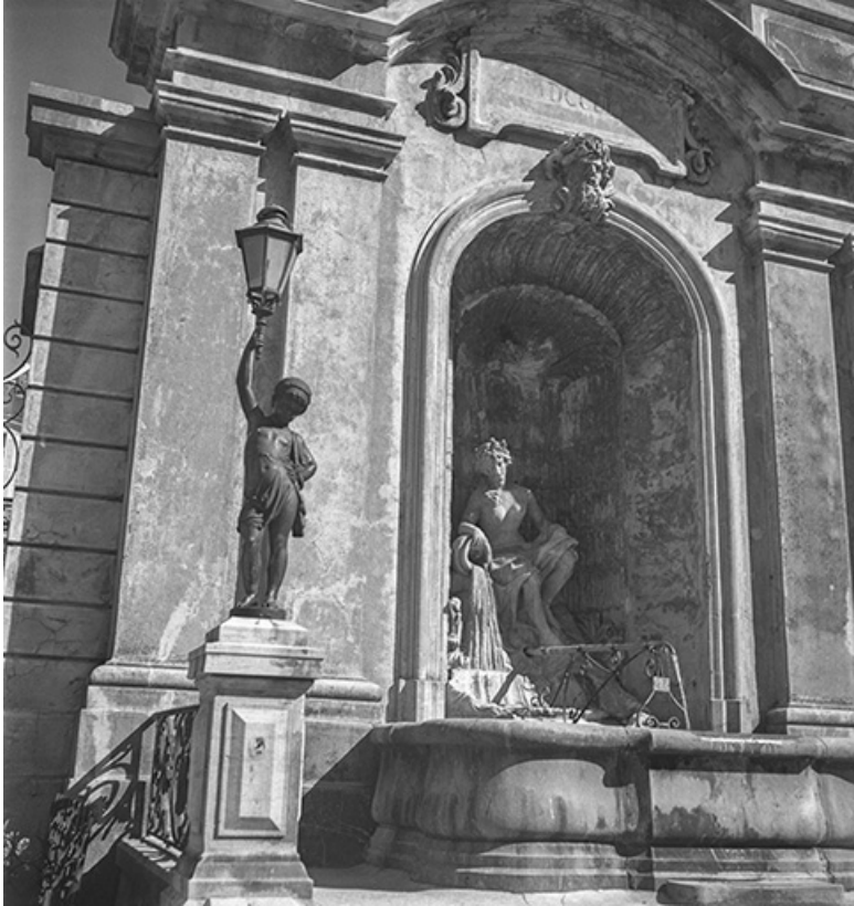
Vue rapprochée, s.d. [vers 1960].

39, Salins-les-Bains place des Alliés et de la Résistance