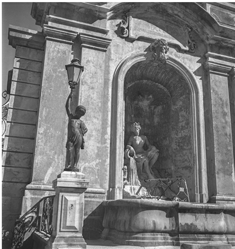
Vue rapprochée, s.d. [vers 1960].

39, Salins-les-Bains place des Alliés et de la Résistance