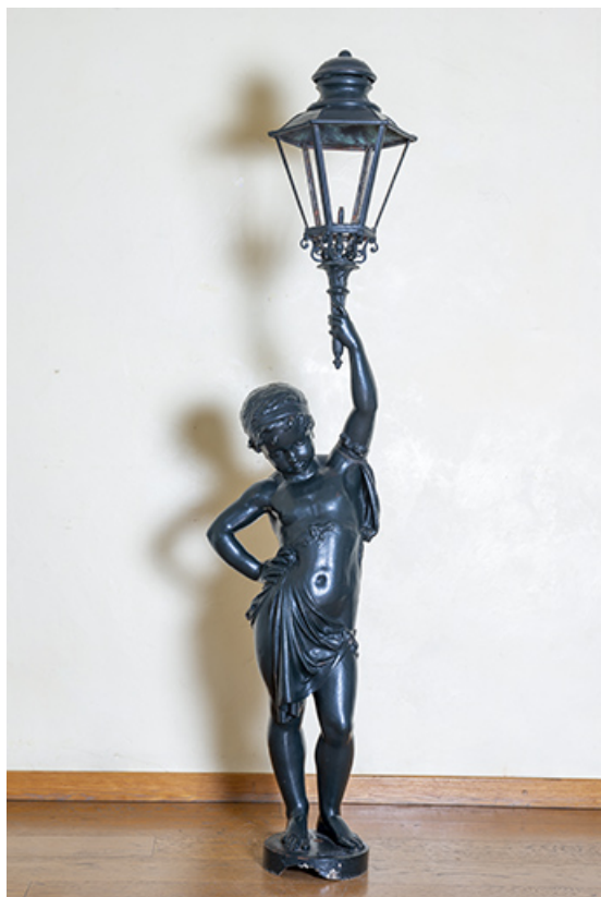
Enfant porte-torchère actuellement déposé à l'Hôtel de Ville.

39, Salins-les-Bains place des Alliés et de la Résistance