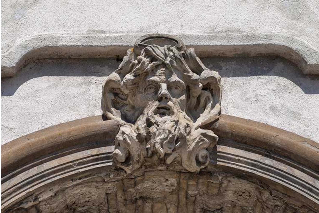
Relief surmontant la niche : masque de dieu marin (?).

39, Salins-les-Bains place des Alliés et de la Résistance