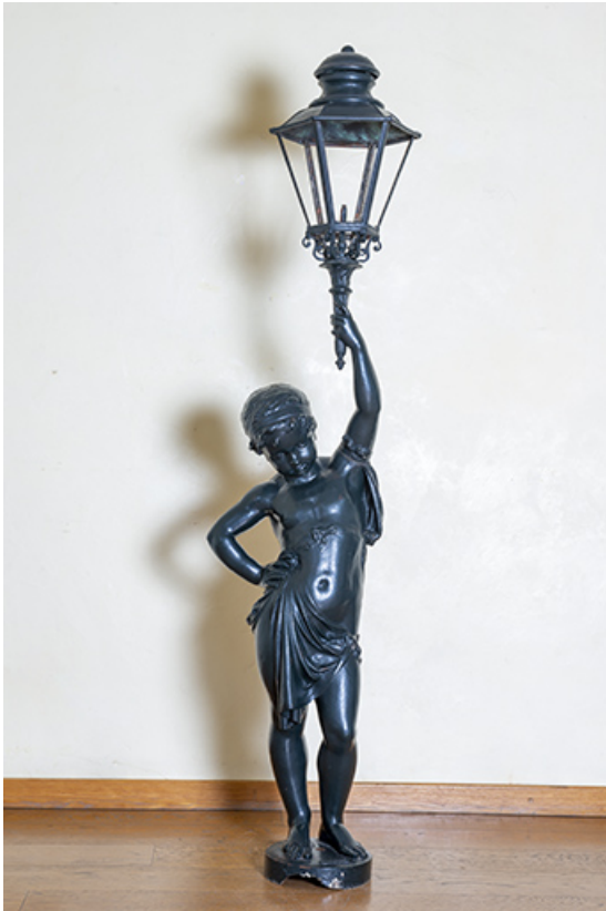
Enfant porte-torchère actuellement déposé à l'Hôtel de Ville.

39, Salins-les-Bains place des Alliés et de la Résistance