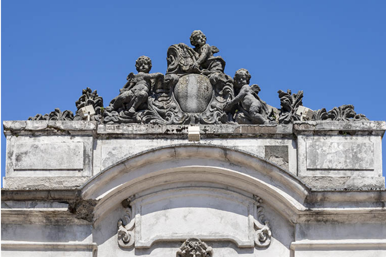
Couronnement : enfants autour d'un cartouche dans un décor végétal.

39, Salins-les-Bains place des Alliés et de la Résistance