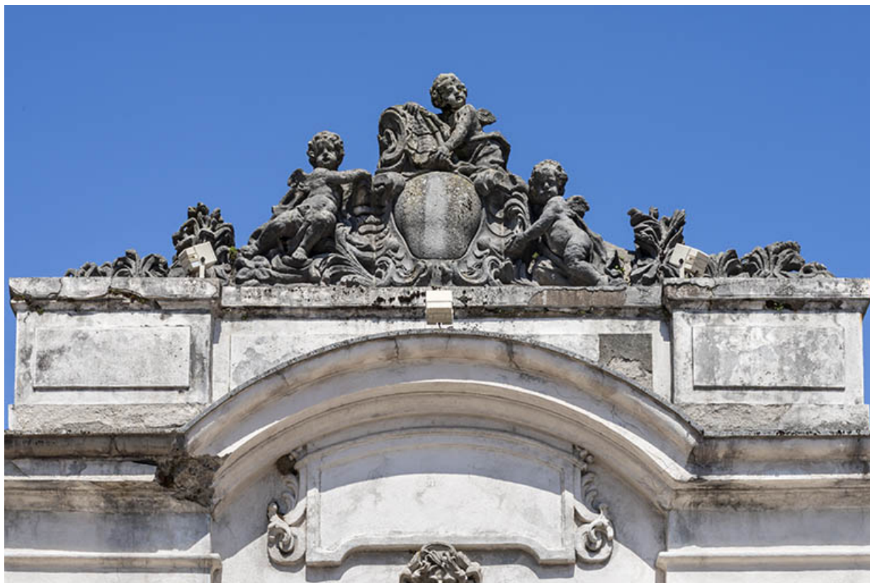
Couronnement : enfants autour d'un cartouche dans un décor végétal.

39, Salins-les-Bains place des Alliés et de la Résistance