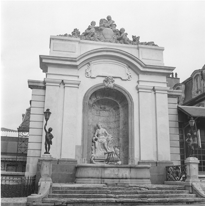
Vue d'ensemble, s.d. [vers 1960].

39, Salins-les-Bains place des Alliés et de la Résistance