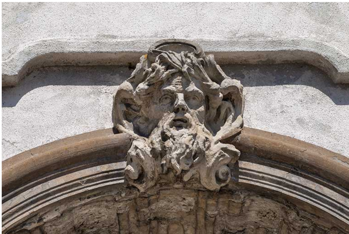
Relief surmontant la niche : masque de dieu marin (?).

39, Salins-les-Bains place des Alliés et de la Résistance