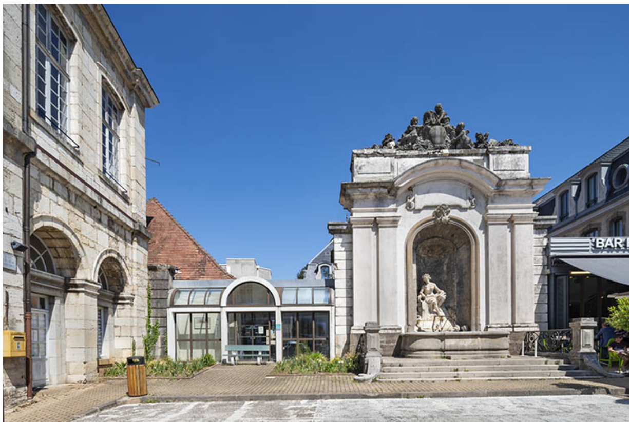
Vue d'ensemble, avec l'entrée de l'ancien établissement thermal à gauche.

39, Salins-les-Bains place des Alliés et de la Résistance