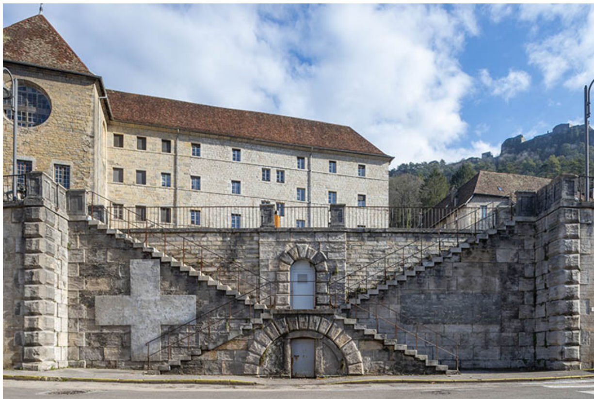
Façade sur la rue Charles Magnin, vue rapprochée de face : escalier.