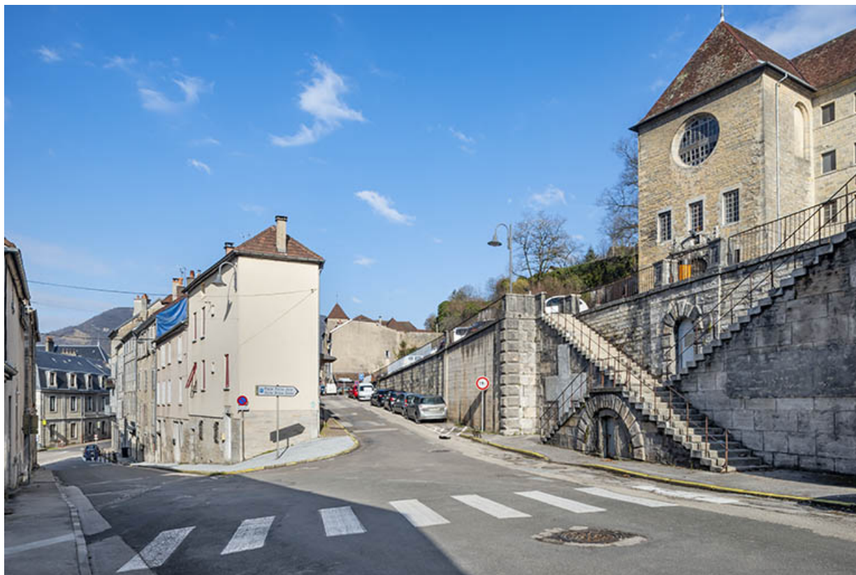
Façade sur la rue Charles Magnin, vue d'ensemble.