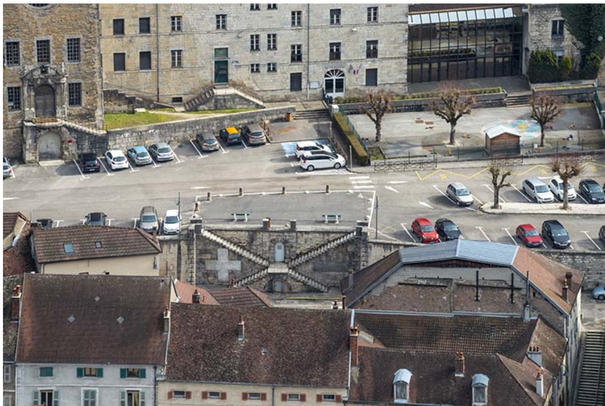
Vue depuis le fort Saint-André.