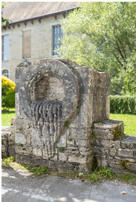
Urne de sel cristallisé (déposée place des Salines). 39, Salins-les-Bains rue Charles Magnin