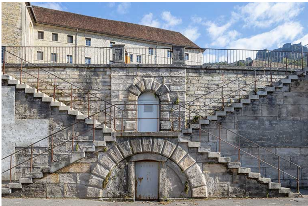
Façade sur la rue Charles Magnin, vue rapprochée de face : rampes de l'escalier. 39, Salins-les-Bains rue Charles Magnin