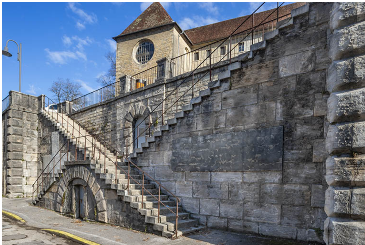
Façade sur la rue Charles Magnin, vue rapprochée de trois quarts : escalier.