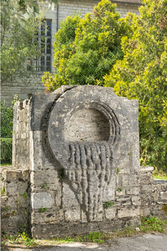
Urne de sel cristallisé (déposée place des Salines). 39, Salins-les-Bains rue Charles Magnin