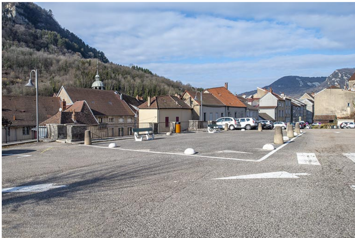
Couverture du réservoir, vue de la place Saint-Jean.