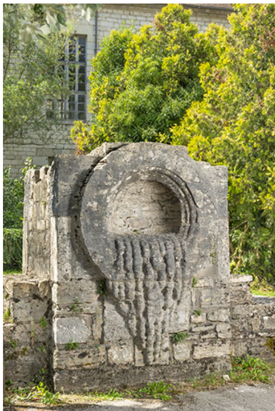
Urne de sel cristallisé (déposée place des Salines). 39, Salins-les-Bains rue Charles Magnin