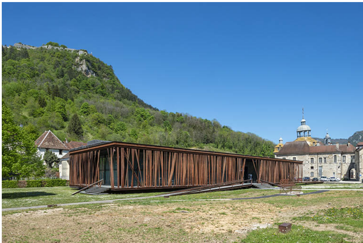
Vue d'ensemble de l'édifice surplombé par le fort Saint-André.

39, Salins-les-Bains, 6 rue de la République