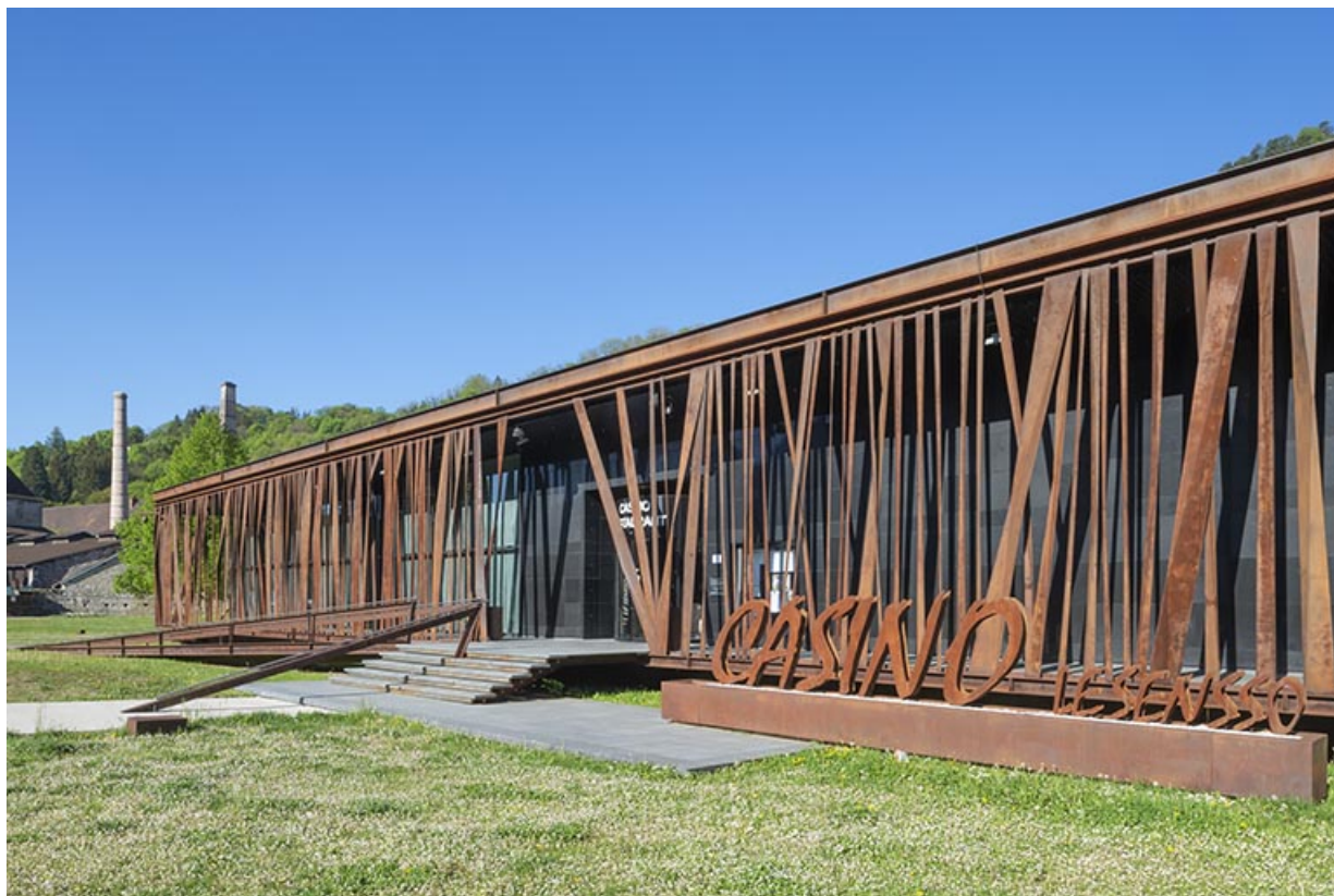
Vue depuis le nord-est.

39, Salins-les-Bains, 6 rue de la République