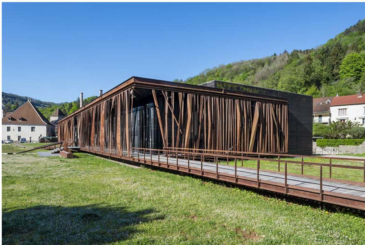
Vue depuis le nord-est.

39, Salins-les-Bains, 6 rue de la République