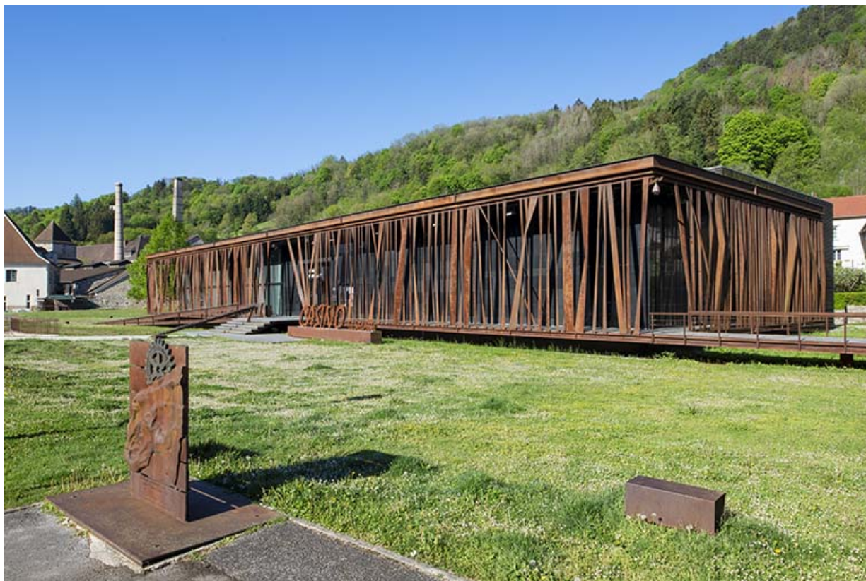
Vue depuis le nord-est.

39, Salins-les-Bains, 6 rue de la République