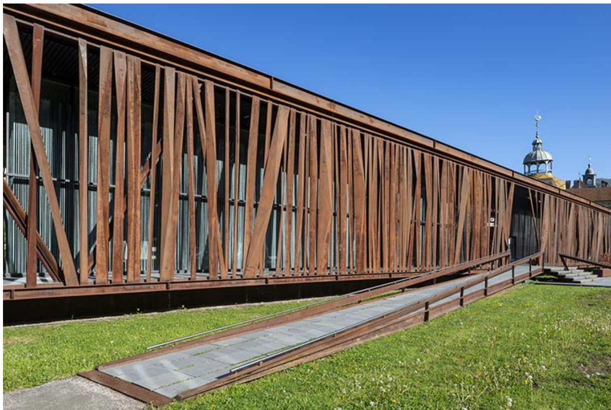
Vue depuis le sud-est.

39, Salins-les-Bains, 6 rue de la République