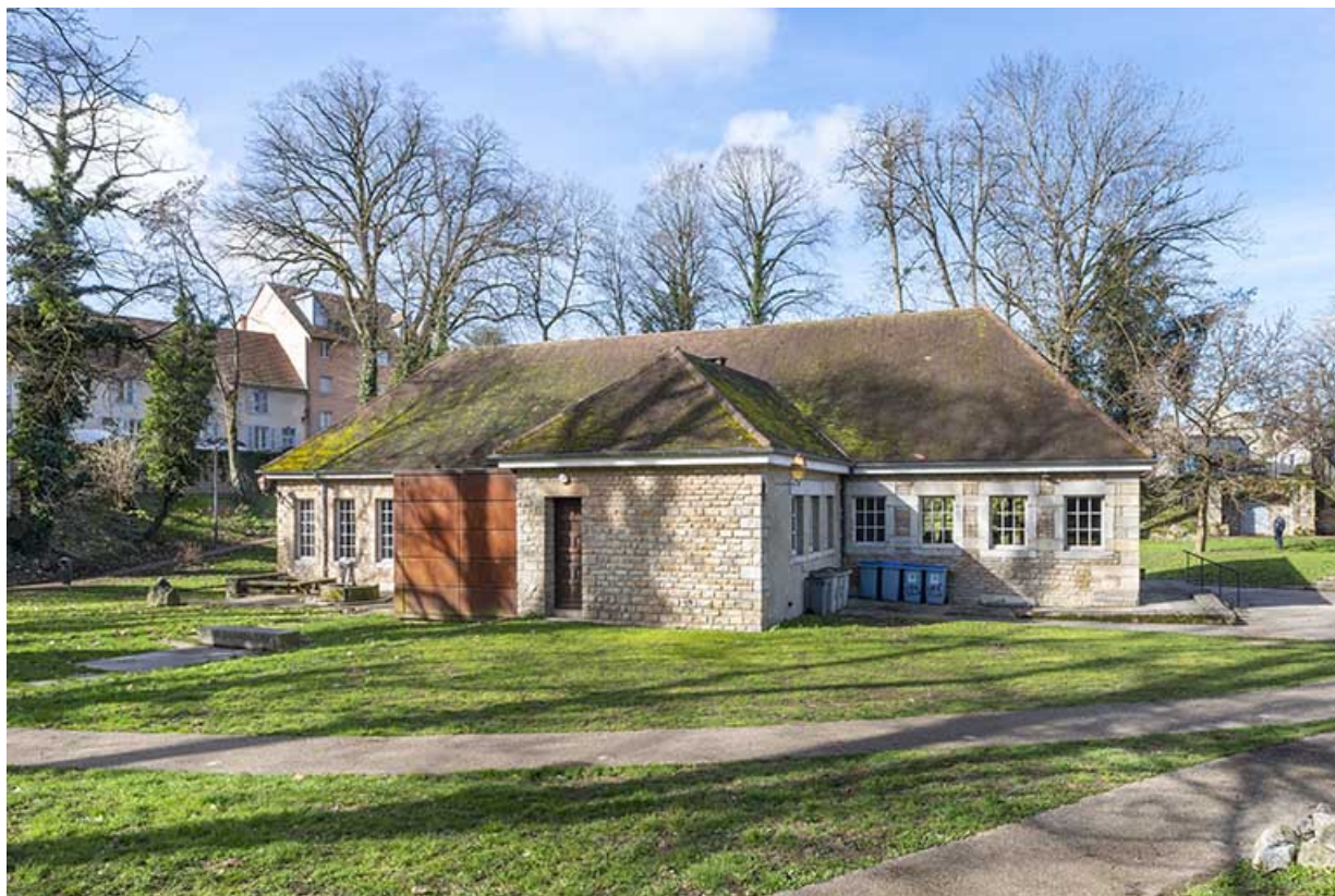
Vue depuis le nord-est.

39, Lons-le-Saunier, 2 rue du Puits salé