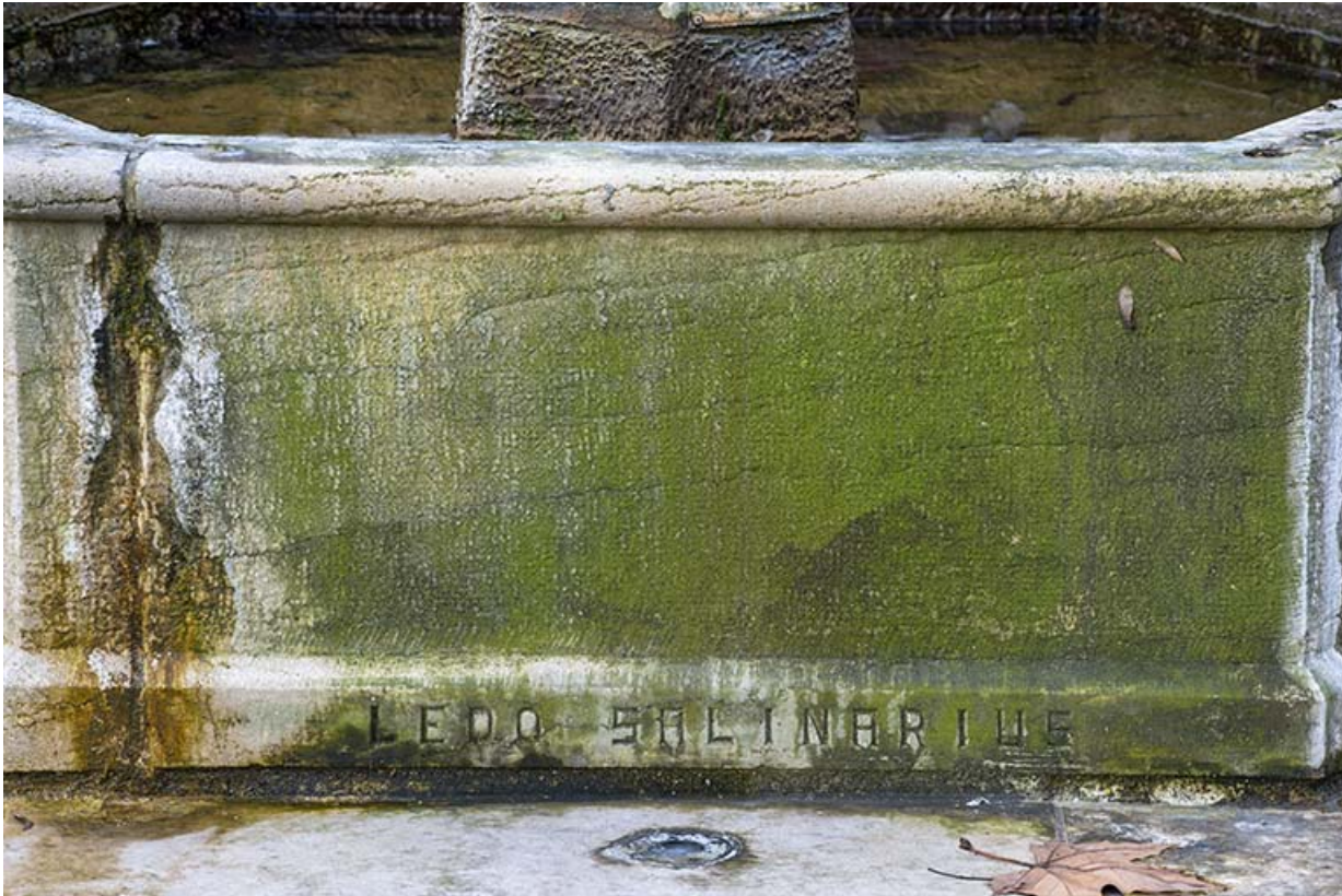
Fontaine, détail : inscription "LEDO SALINARIUS".

39, Lons-le-Saunier, 2 rue du Puits salé