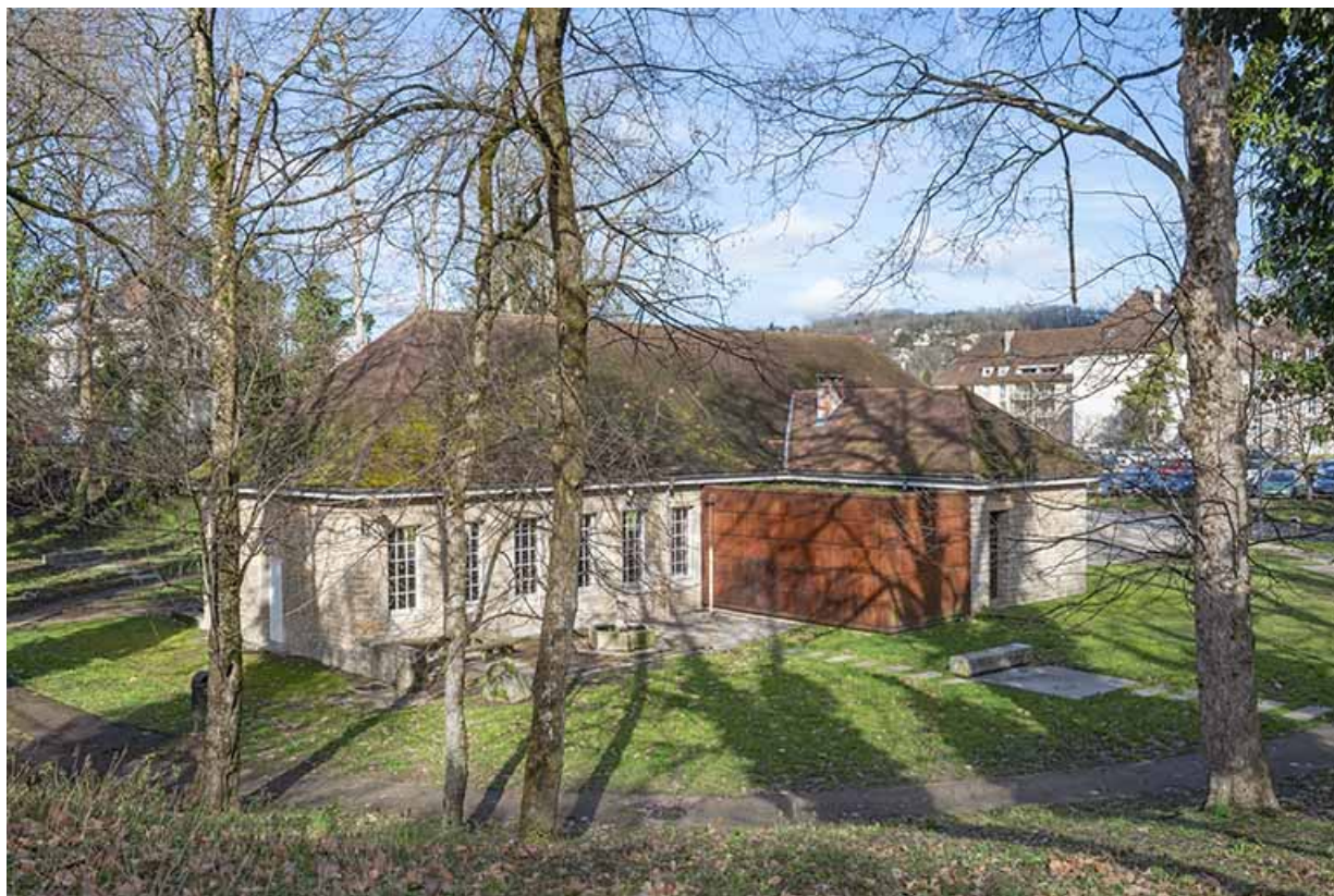
Vue d'ensemble depuis la rue.

39, Lons-le-Saunier, 2 rue du Puits salé