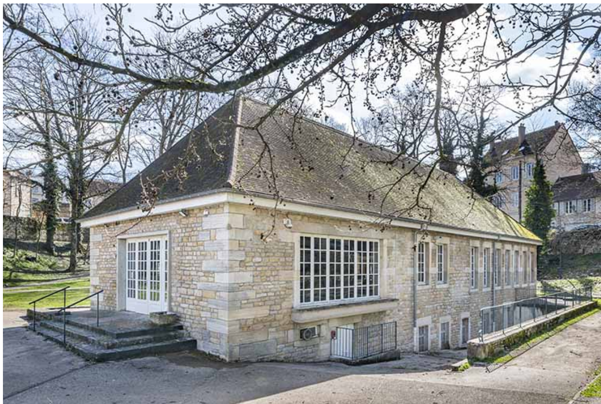
Vue depuis le nord-ouest.

39, Lons-le-Saunier, 2 rue du Puits salé