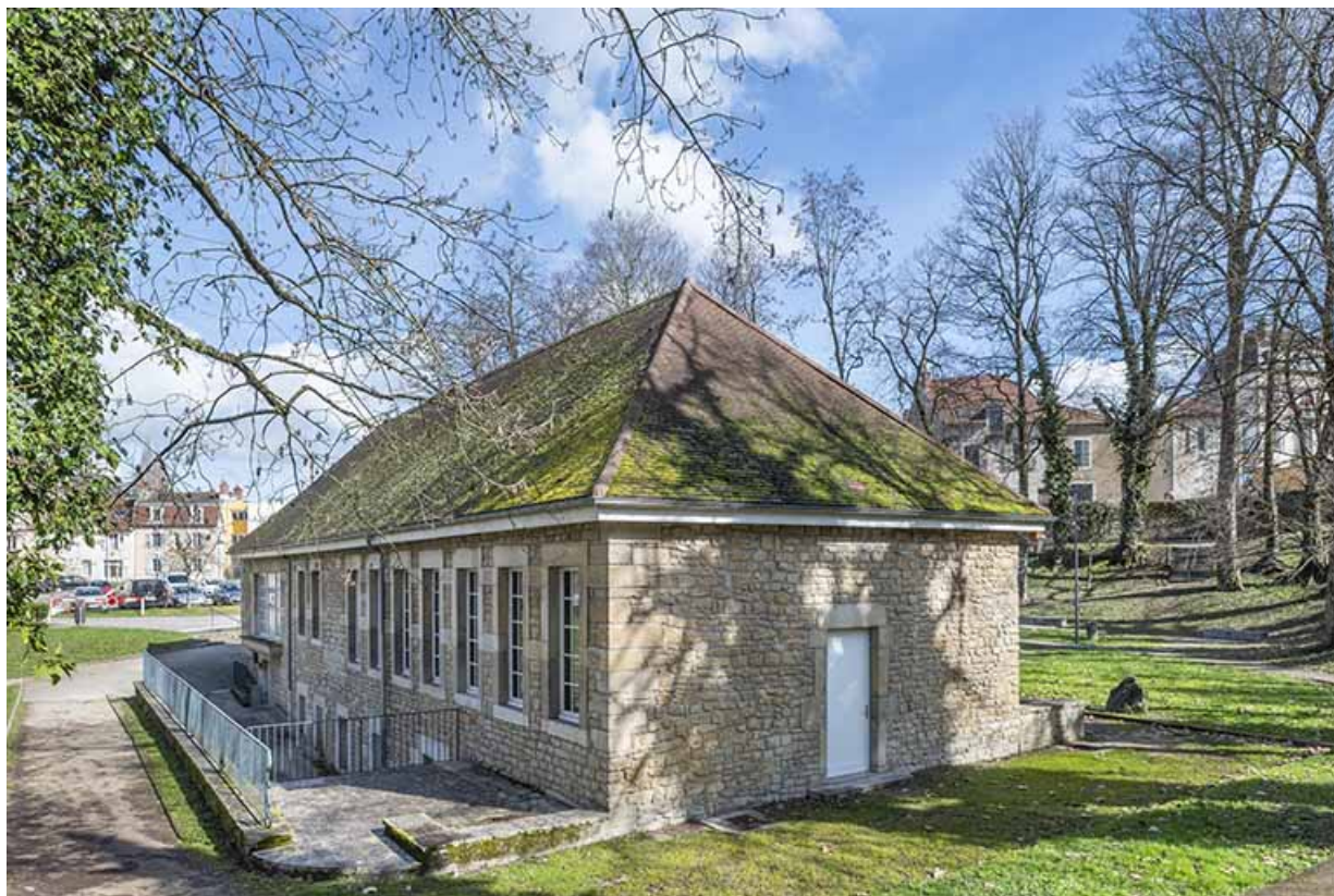
Vue depuis le sud-ouest.

39, Lons-le-Saunier, 2 rue du Puits salé