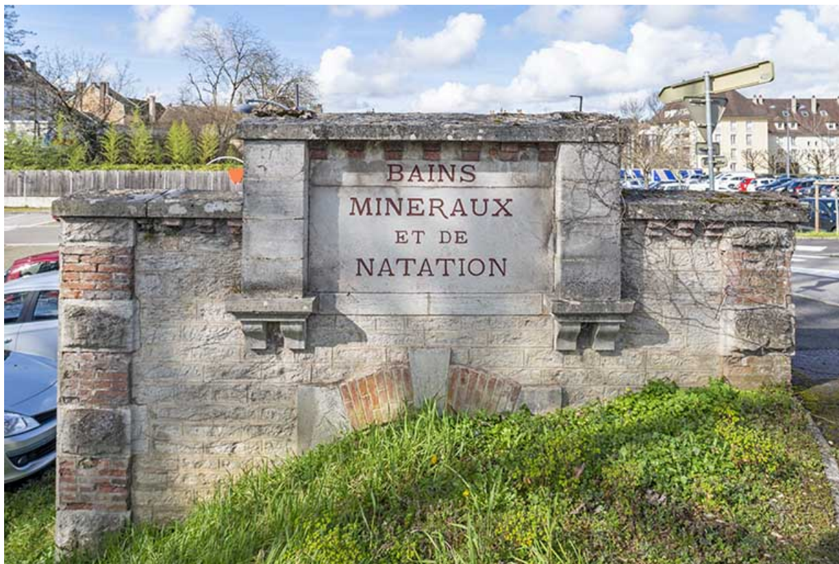
Ancienne entrée : "BAINS MINÉRAUX ET DE NATATION".

39, Lons-le-Saunier, 2 rue du Puits salé