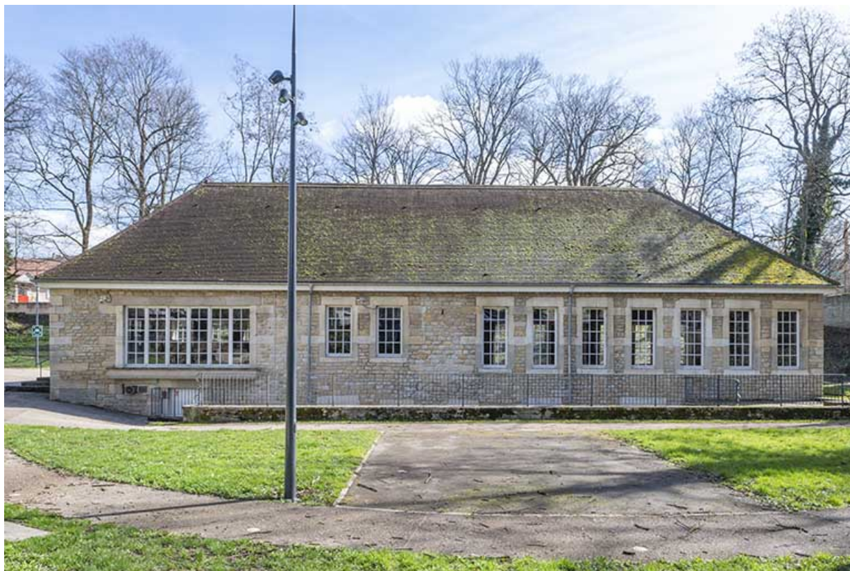
Vue depuis l'ouest.

39, Lons-le-Saunier, 2 rue du Puits salé