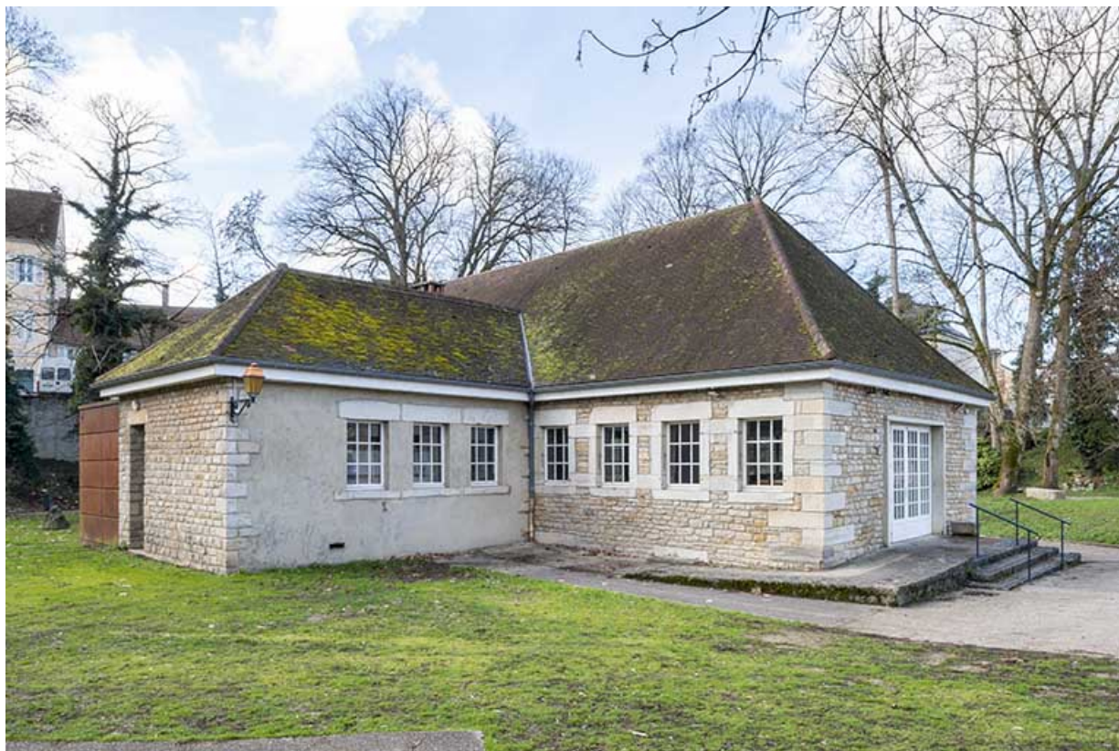
Vue depuis le nord-est.

39, Lons-le-Saunier, 2 rue du Puits salé