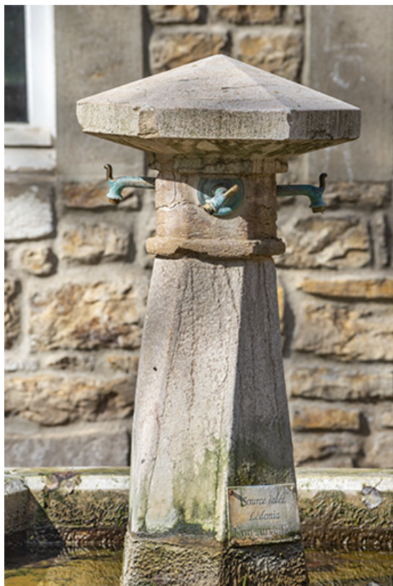
Fontaine, détail : inscription "Source salée Ledonia". 39, Lons-le-Saunier, 2 rue du Puits salé