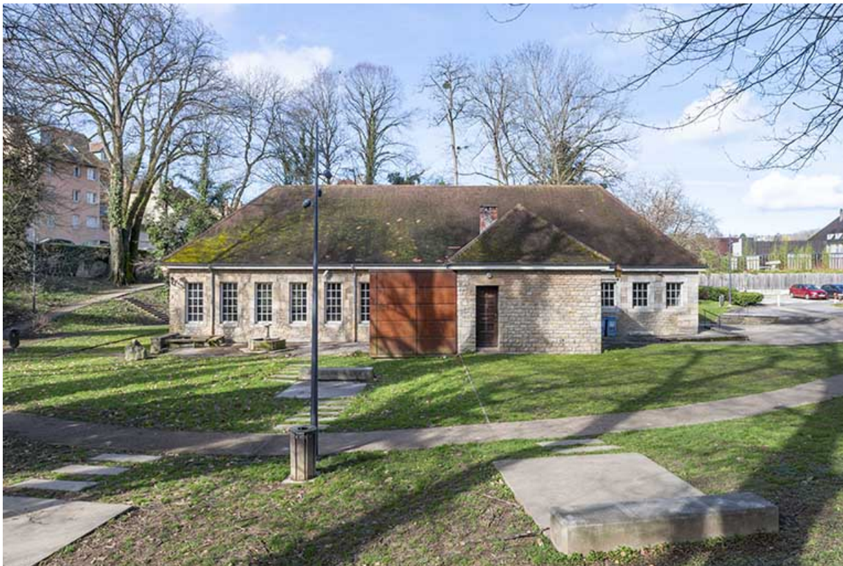
Vue depuis l'est.

39, Lons-le-Saunier, 2 rue du Puits salé