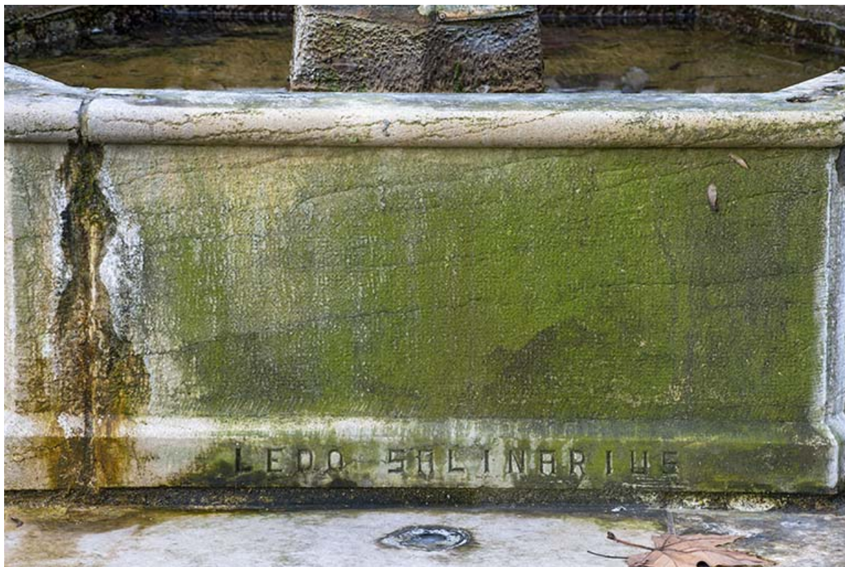
Fontaine, détail : inscription "LEDO SALINARIUS".

39, Lons-le-Saunier, 2 rue du Puits salé