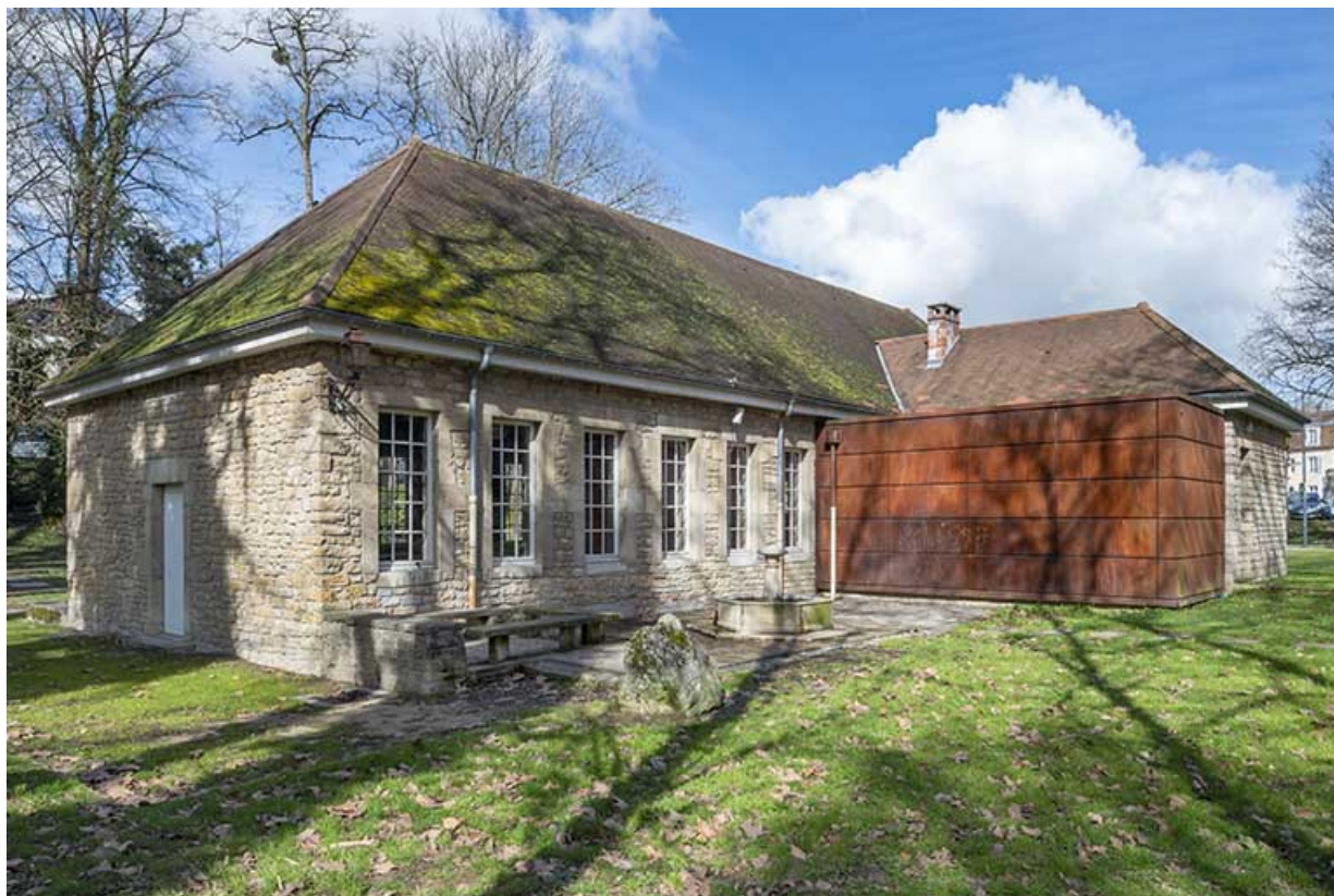
Vue depuis le sud-est.

39, Lons-le-Saunier, 2 rue du Puits salé