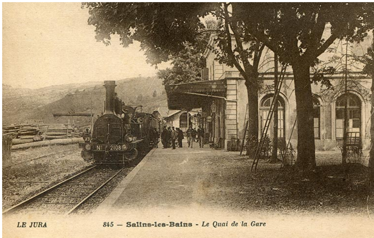
Le Jura - 845. Salins-les-Bains - Le Quai de la gare, s.d. [fin 19e ou début 20e siècle]. 39, Salins-les-Bains, 1-3 rue du Docteur Éric Hurter