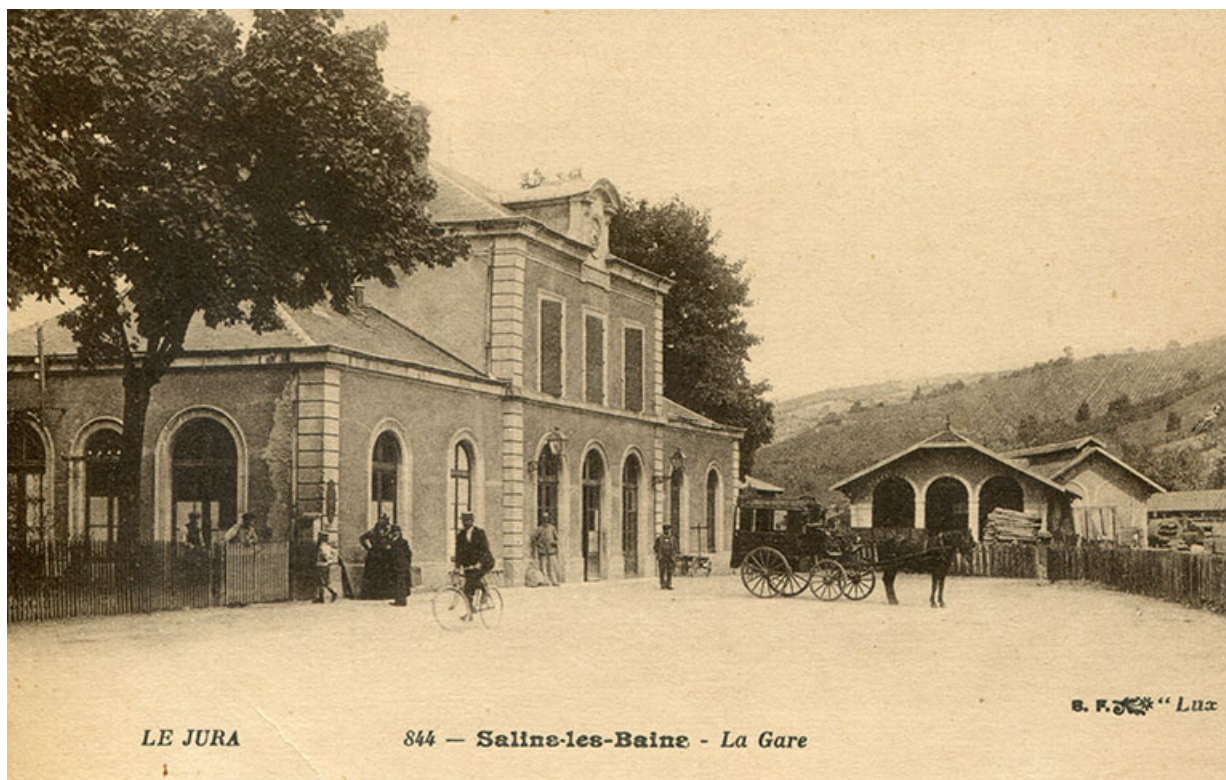
Le Jura - 844. Salins-les-Bains - La gare, s.d. [fin 19e ou début 20e siècle].

39, Salins-les-Bains, 1-3 rue du Docteur Éric Hurter