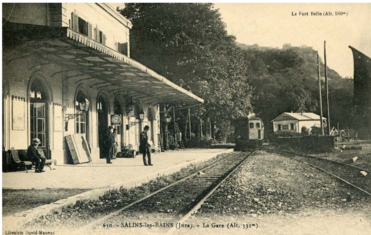
Salins-les-Bains (Jura) - La gare, s.d. [fin 19e ou début 20e siècle].

39, Salins-les-Bains, 1-3 rue du Docteur Éric Hurter