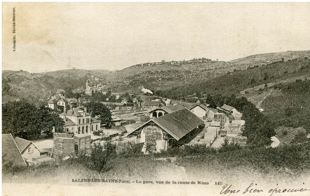
Salins-les-Bains (Jura) - La gare, vue depuis la route de Nans, s.d. [fin 19e ou début 20e siècle].

39, Salins-les-Bains, 1-3 rue du Docteur Éric Hurter