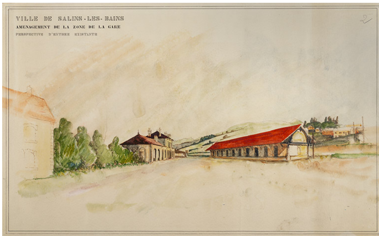
Aménagement de la zone de la gare. Perspective d'entrée existante, dessin, s.d. [vers 1970].

39, Salins-les-Bains, 1-3 rue du Docteur Éric Hurter