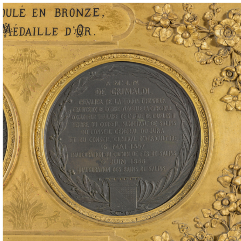
Médaille en l'honneur de Jean-Marie de Grimaldi, revers : "6 juin 1858, inauguration des bains de Salins" (Salins-les-Bains, musée municipal).

39, Salins-les-Bains, 1-3 rue du Docteur Éric Hurter