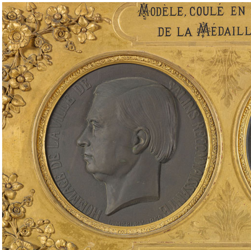
Médaille en l'honneur de Jean-Marie de Grimaldi, face (Salins-les-Bains, musée municipal). 39, Salins-les-Bains, 1-3 rue du Docteur Éric Hurter