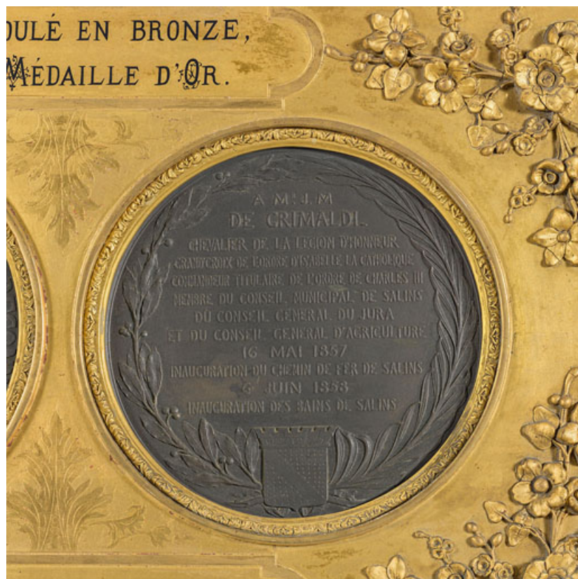
Médaille en l'honneur de Jean-Marie de Grimaldi, revers : "6 juin 1858, inauguration des bains de Salins" (Salins-les-Bains, musée municipal).

39, Salins-les-Bains, 1-3 rue du Docteur Éric Hurter