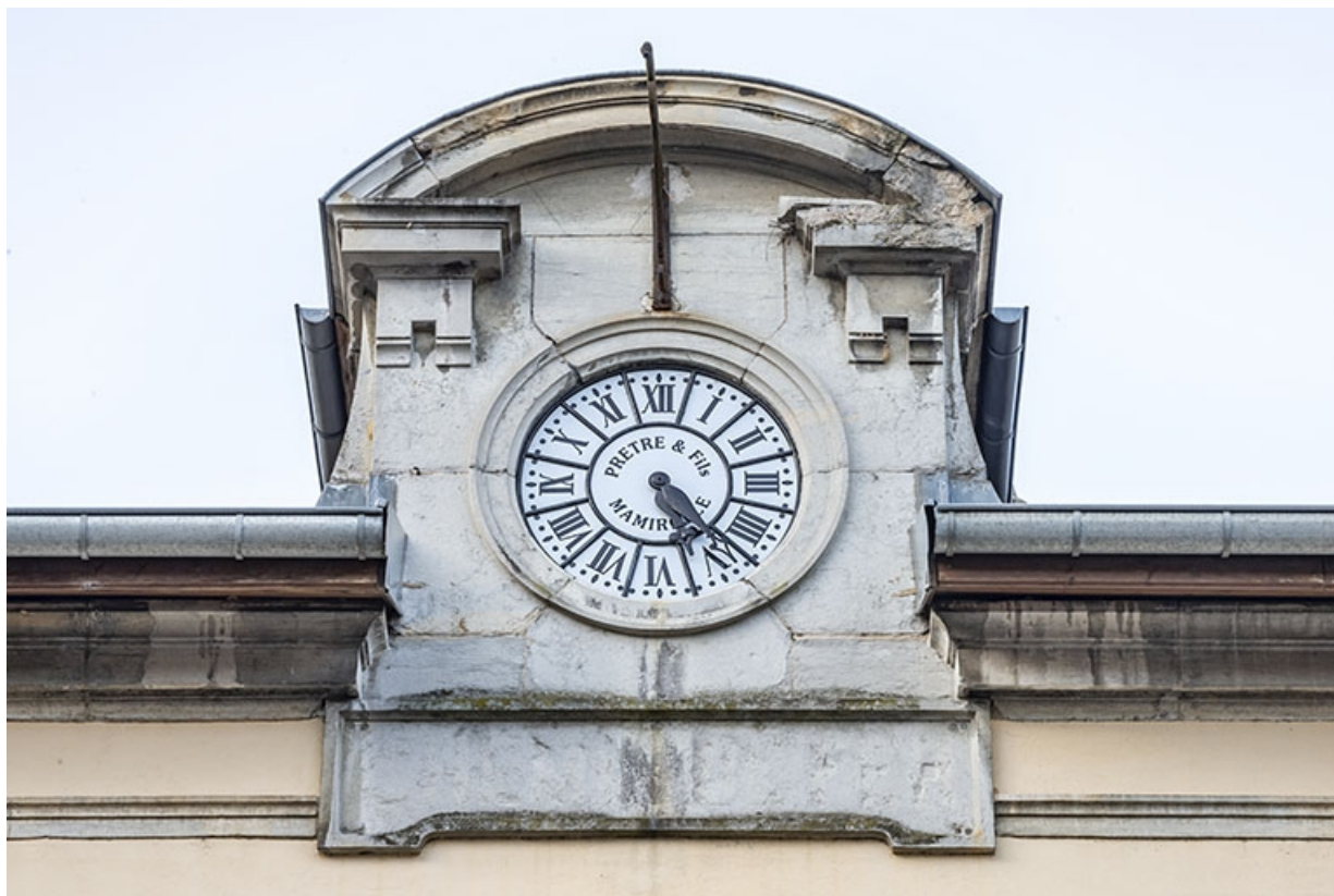
Horloge de la façade est.

39, Salins-les-Bains, 1-3 rue du Docteur Éric Hurter