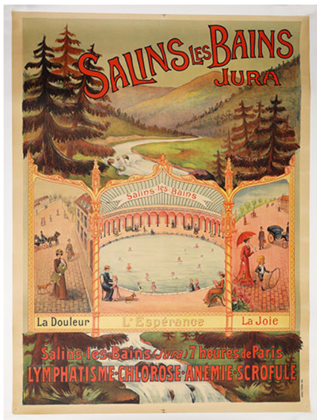
Affiche publicitaire (début du 20e siècle). 39, Salins-les-Bains