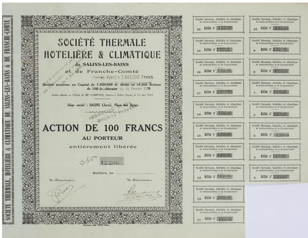
Action de 100 francs au porteur entièrement libérée. Société thermale hôtelière et climatique de Salins-les-Bains et de Franche-Comté. 1928.