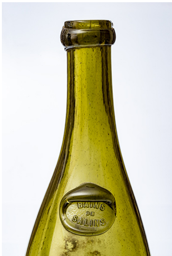
Bouteille : BAINS DE SALINS (Salins-les-Bains, musée municipal). 39, Salins-les-Bains