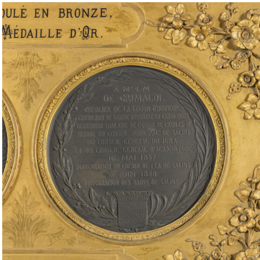
Médaille en l'honneur de Jean-Marie de Grimaldi, revers : "6 juin 1858, inauguration des bains de Salins" (Salins-les-Bains, musée municipal).

39, Salins-les-Bains place des Alliés et de la Résistance