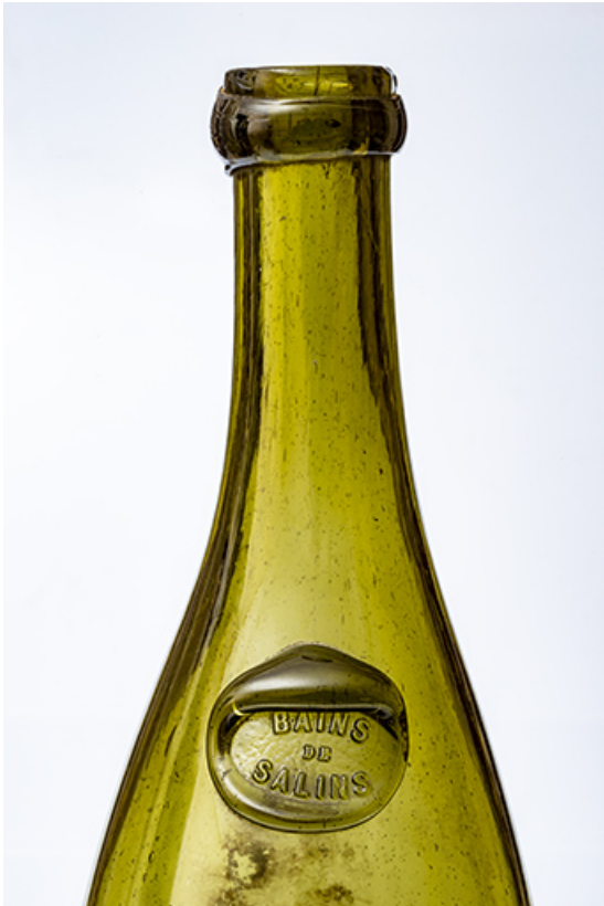
Bouteille : BAINS DE SALINS (Salins-les-Bains, musée municipal). 39, Salins-les-Bains