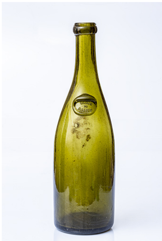
Bouteille : BAINS DE SALINS (Salins-les-Bains, musée municipal). 39, Salins-les-Bains