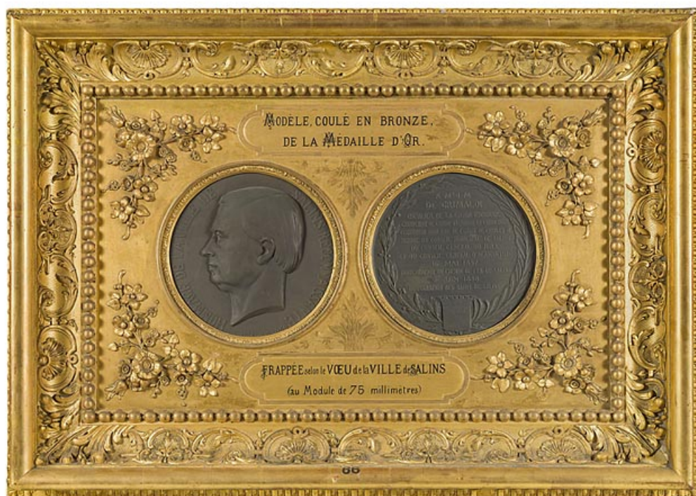
Médailles en l'honneur de Jean-Marie de Grimaldi (Salins-les-Bains, musée municipal). 39, Salins-les-Bains