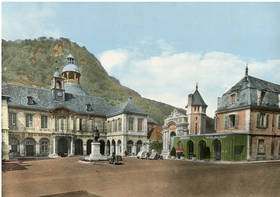
Vue ancienne de l'établissement thermal et du Grand Hôtel des Bains (début du 20e siècle).