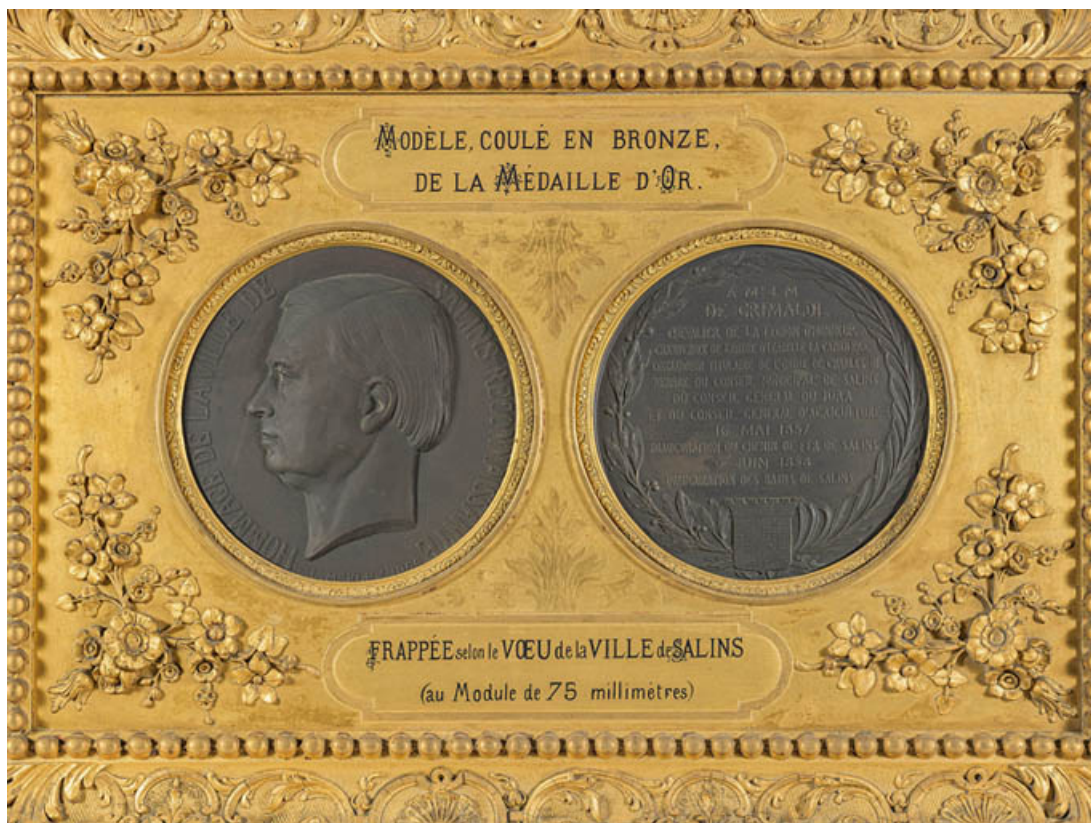
Médailles en l'honneur de Jean-Marie de Grimaldi (Salins-les-Bains, musée municipal). 39, Salins-les-Bains