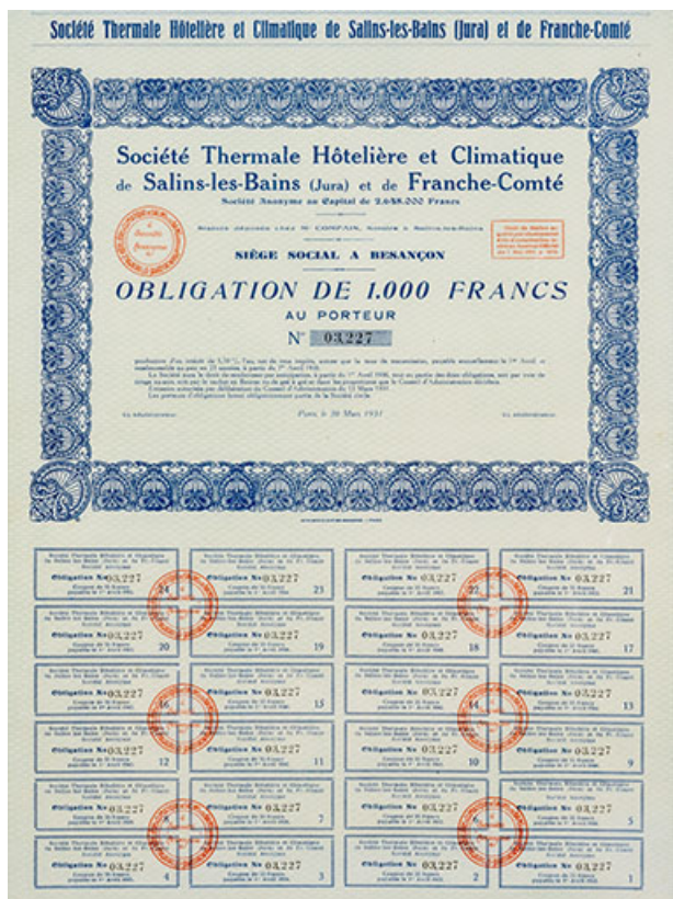
Obligation de 1 000 francs au porteur. Société thermale hôtelière et climatique de Salins-les-Bains (Jura) et de Franche-Comté. 1931.