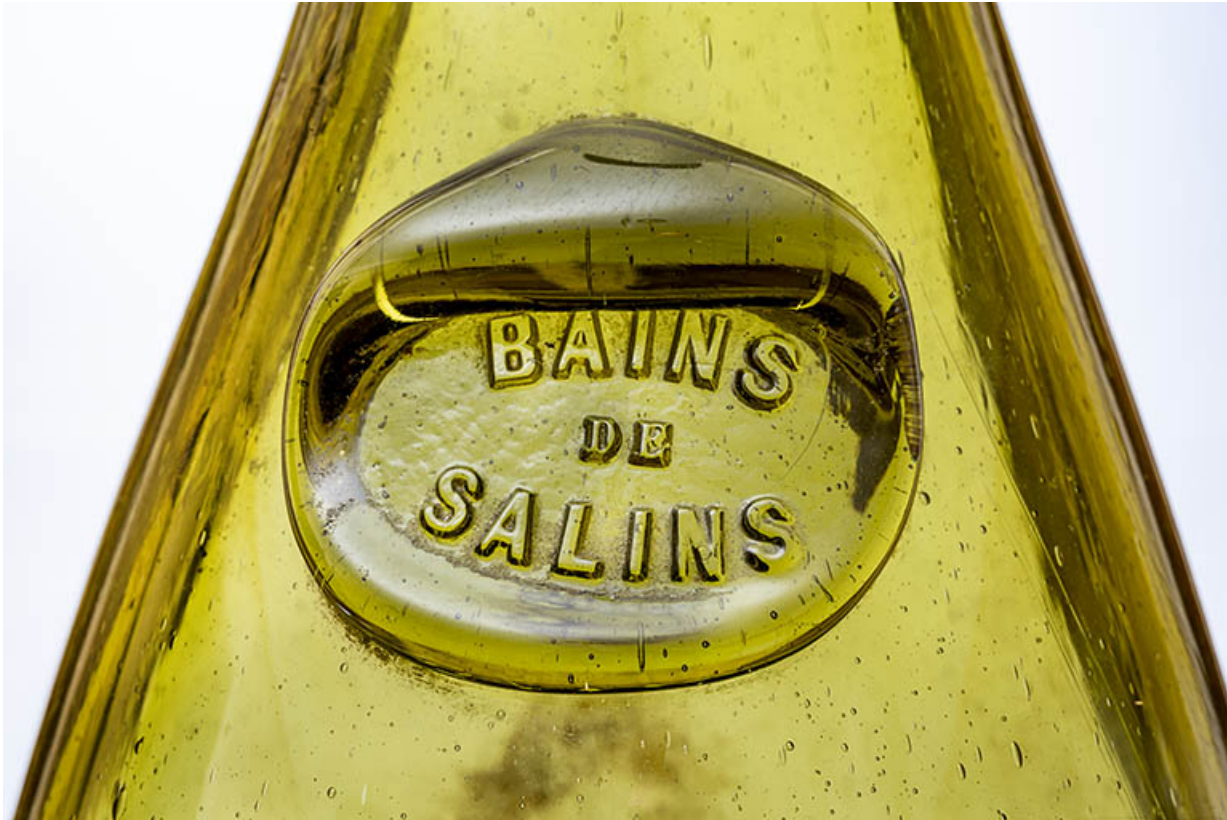
Bouteille : BAINS DE SALINS (Salins-les-Bains, musée municipal). 39, Salins-les-Bains