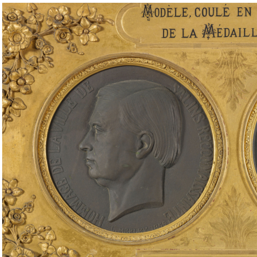
Médaille en l'honneur de Jean-Marie de Grimaldi, face (Salins-les-Bains, musée municipal). 39, Salins-les-Bains place des Alliés et de la Résistance