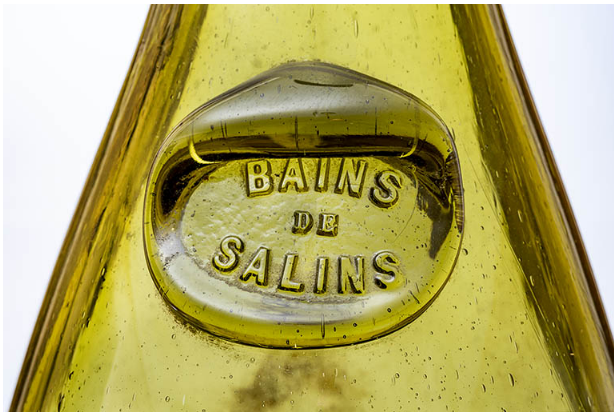
Bouteille : BAINS DE SALINS (Salins-les-Bains, musée municipal). 39, Salins-les-Bains