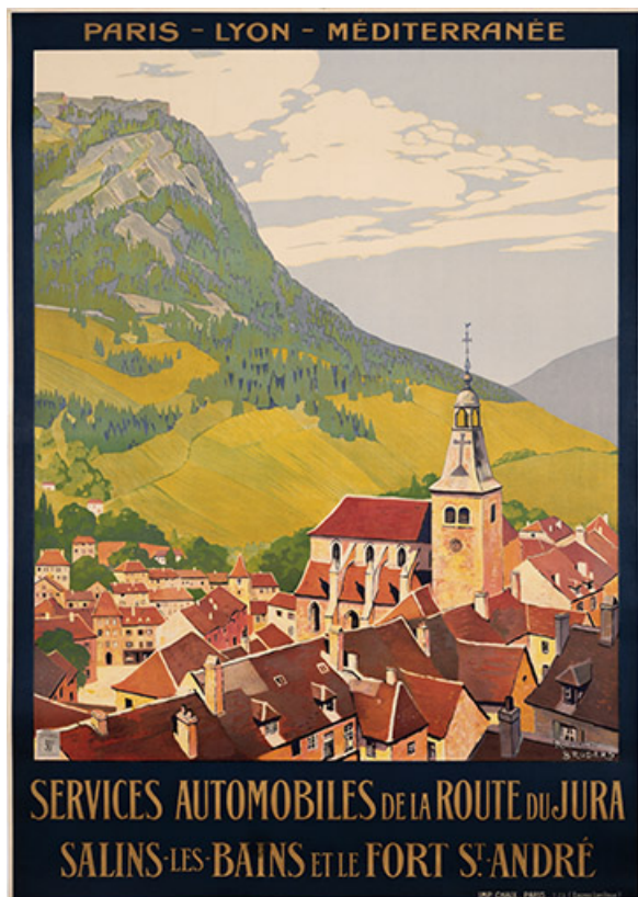
Affiche publicitaire (années 1920). 39, Salins-les-Bains