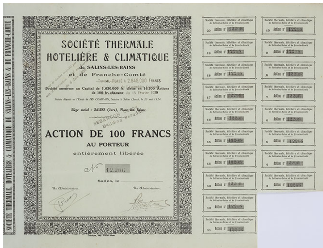
Action de 100 francs au porteur entièrement libérée. Société thermale hôtelière et climatique de Salins-les-Bains et de Franche-Comté. 1928.