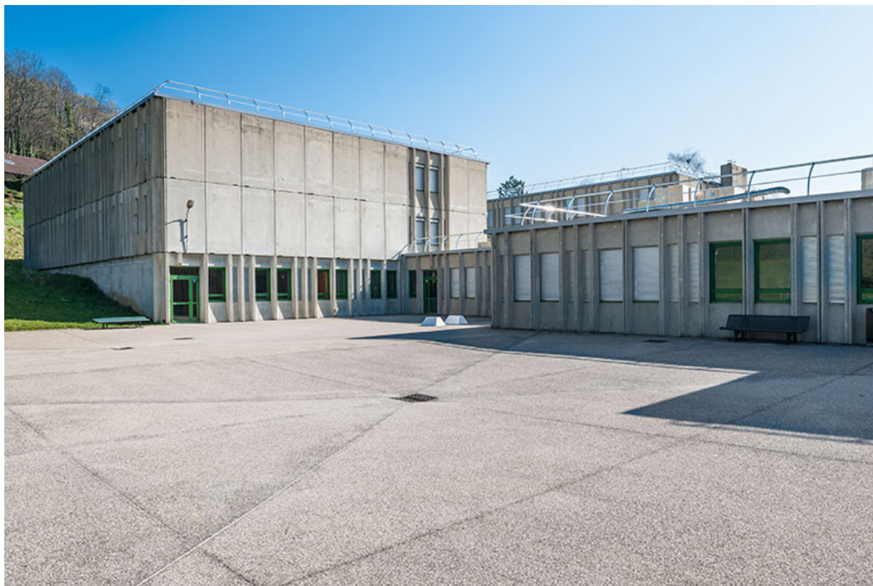
Vue des internats et façade postérieure de l'infirmierie.