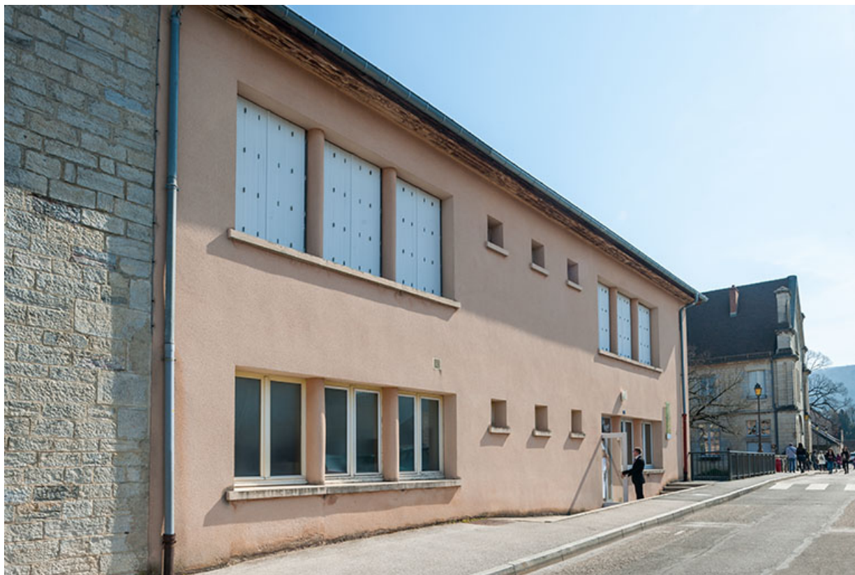
Annexe : façade antérieure, vue trois-quart. 39, Arbois, 1 rue des Ecoles