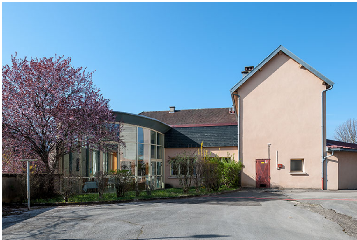
Restaurant d'application : façade postérieure avec extension en rotonde. 39, Arbois, 1 rue des Ecoles