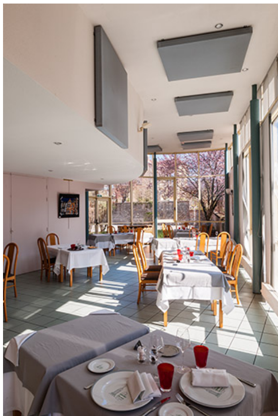
Salle à manger du restaurant d'application, côté rotonde. 39, Arbois, 1 rue des Ecoles