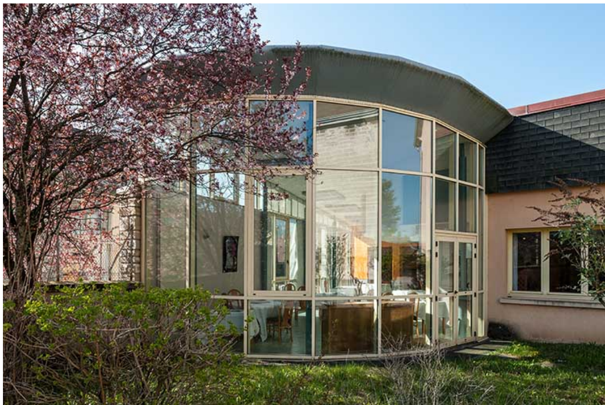
Rotonde de la salle du restaurant d'application : extérieurs.