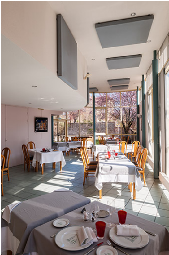
Salle à manger du restaurant d'application, côté rotonde. 39, Arbois, 1 rue des Ecoles