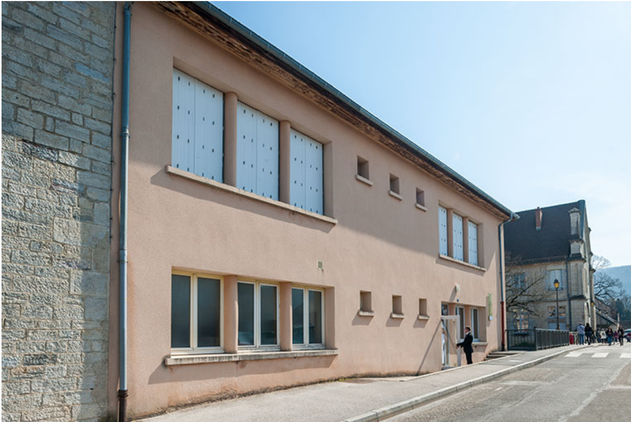
Annexe : façade antérieure, vue trois-quart.