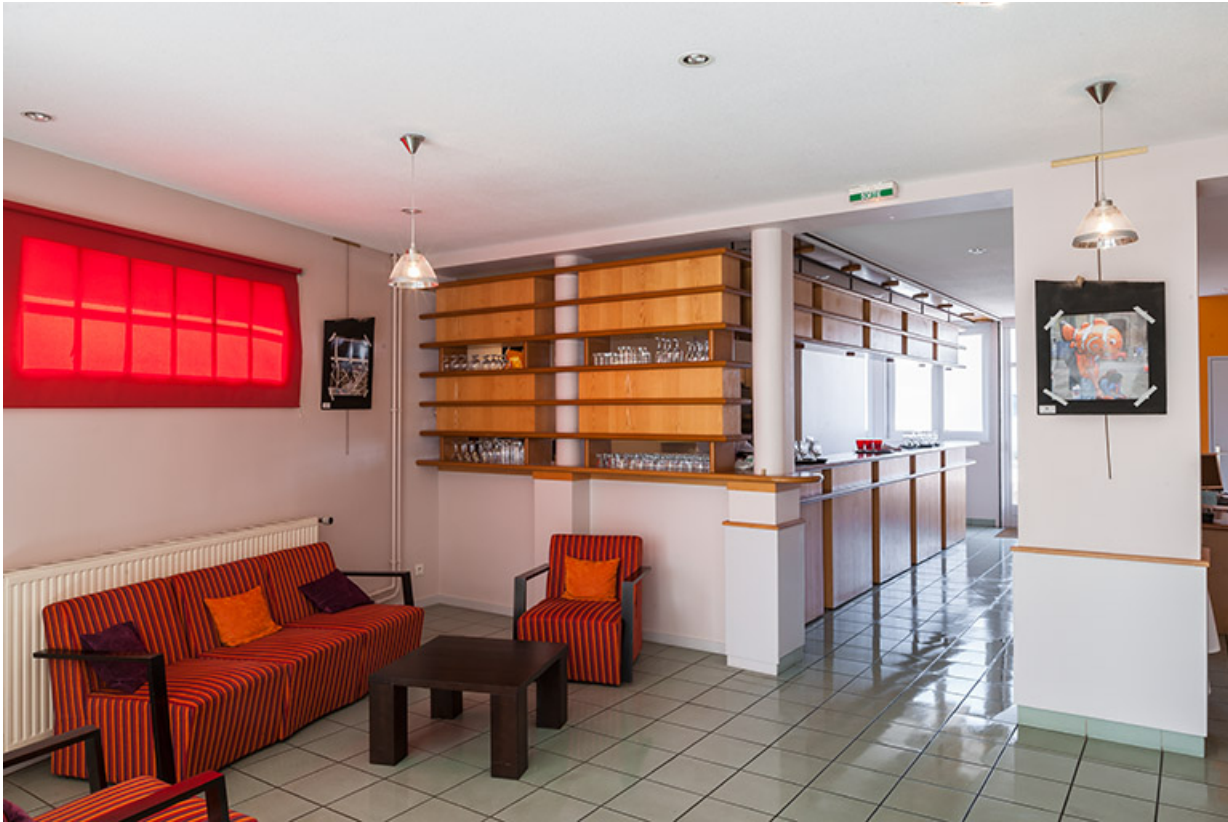
Restaurant d'application : réception.