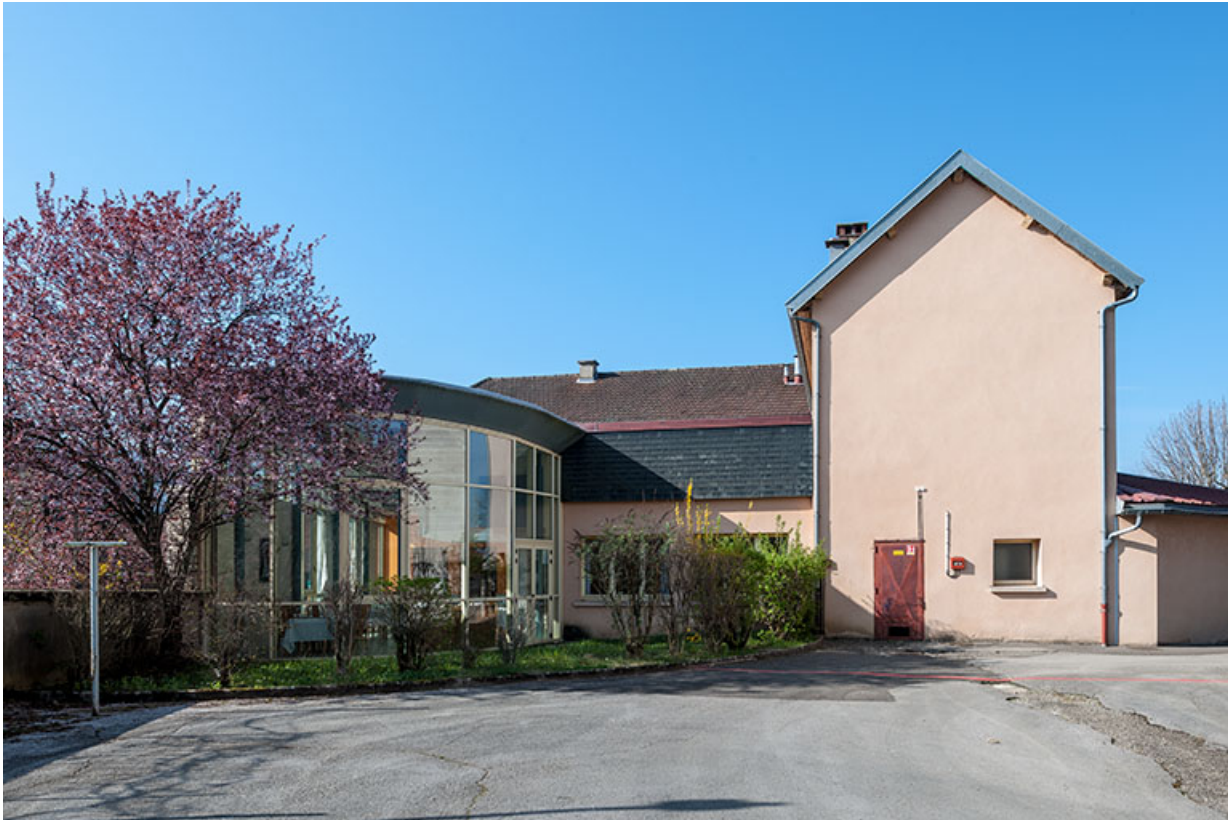
Restaurant d'application : façade postérieure avec extension en rotonde.