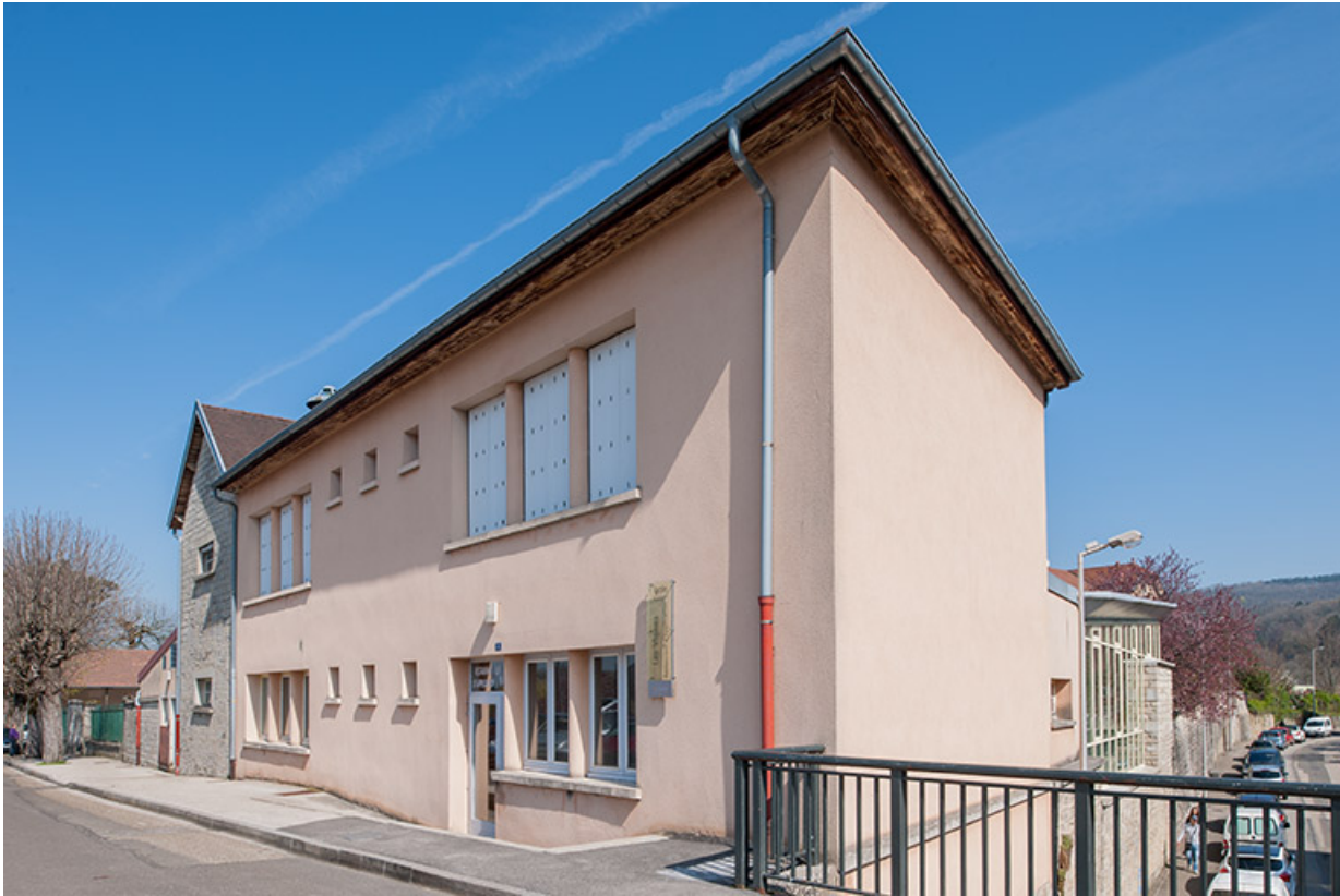
Annexe : façade antérieure, rue des écoles.