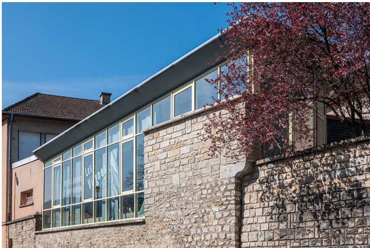
Restaurant d'application : façade sur avenue Delort 39, Arbois, 1 rue des Ecoles