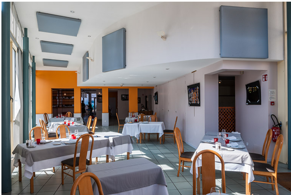
Restaurant d'application : les espaces de restauration.