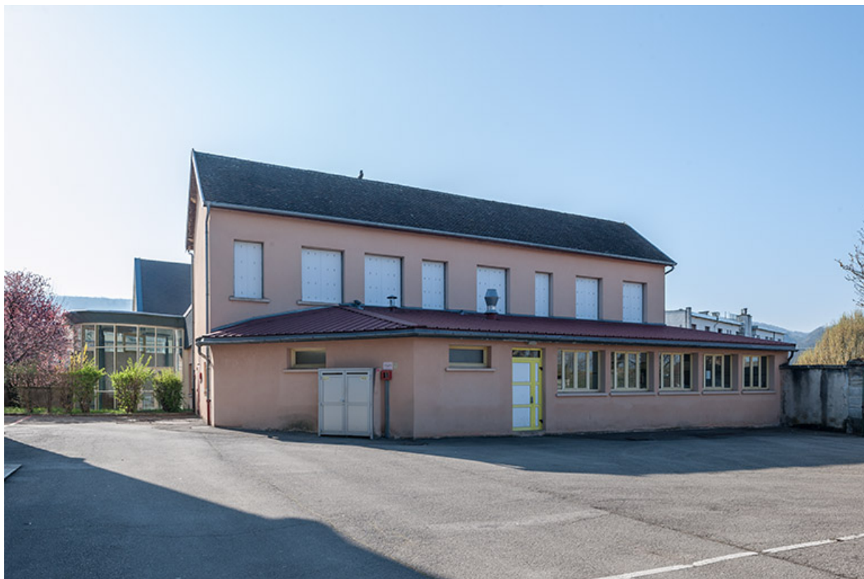
Restaurant d'application : ensemble des bâtiments, vue depuis la cour.