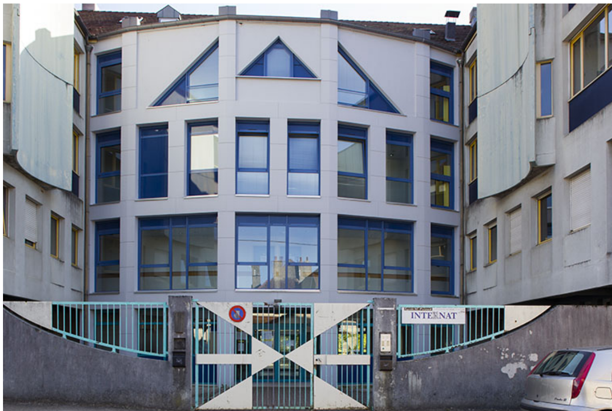
Internat : façade Nord, détail.