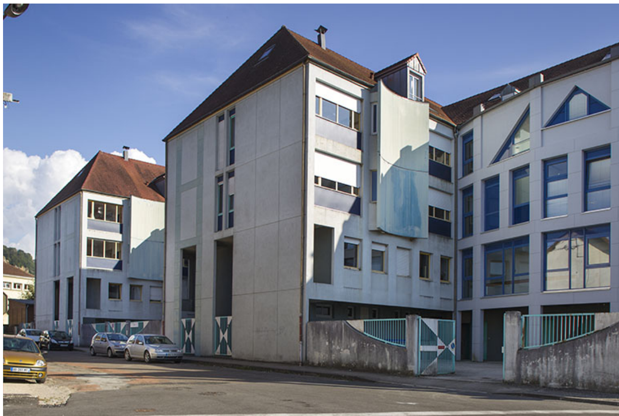
Internat : façades Nord sur la rue de la Résistance.