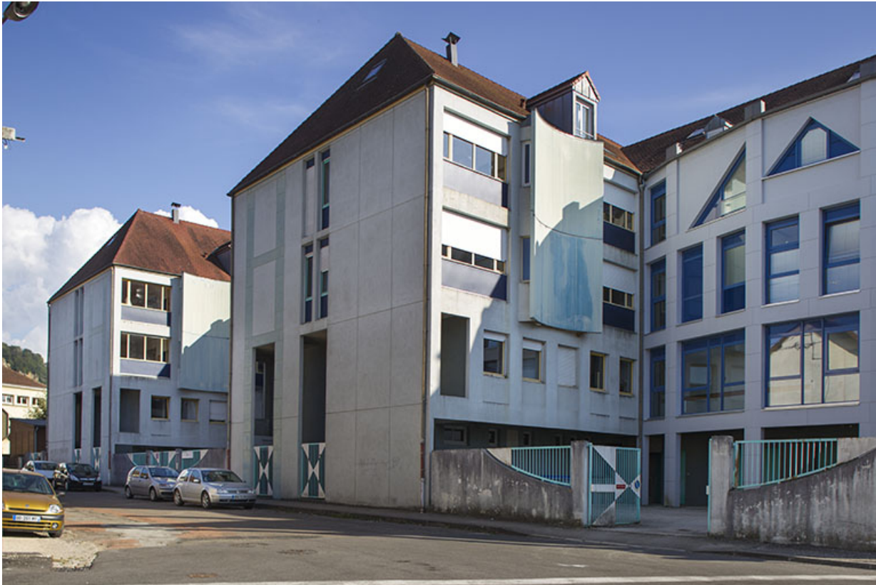
Internat : façades Nord sur la rue de la Résistance.