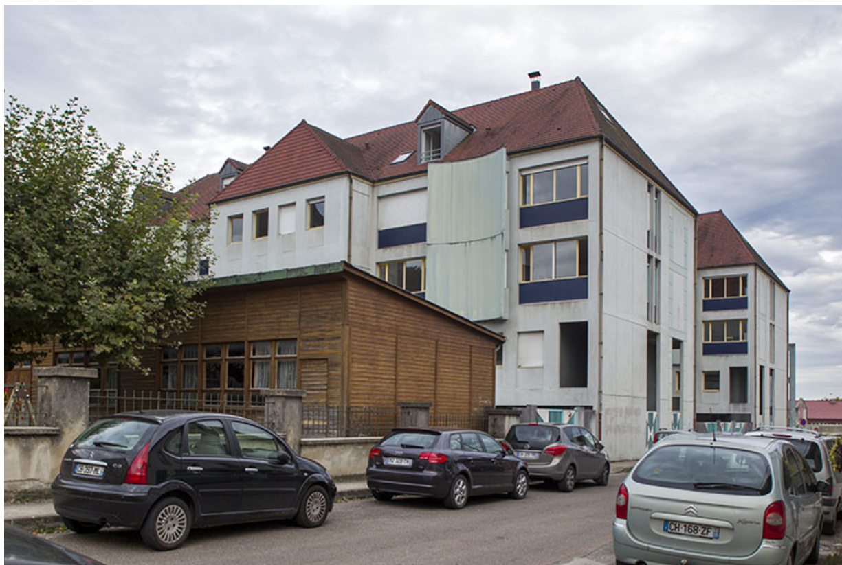
Internat : façades arrière.