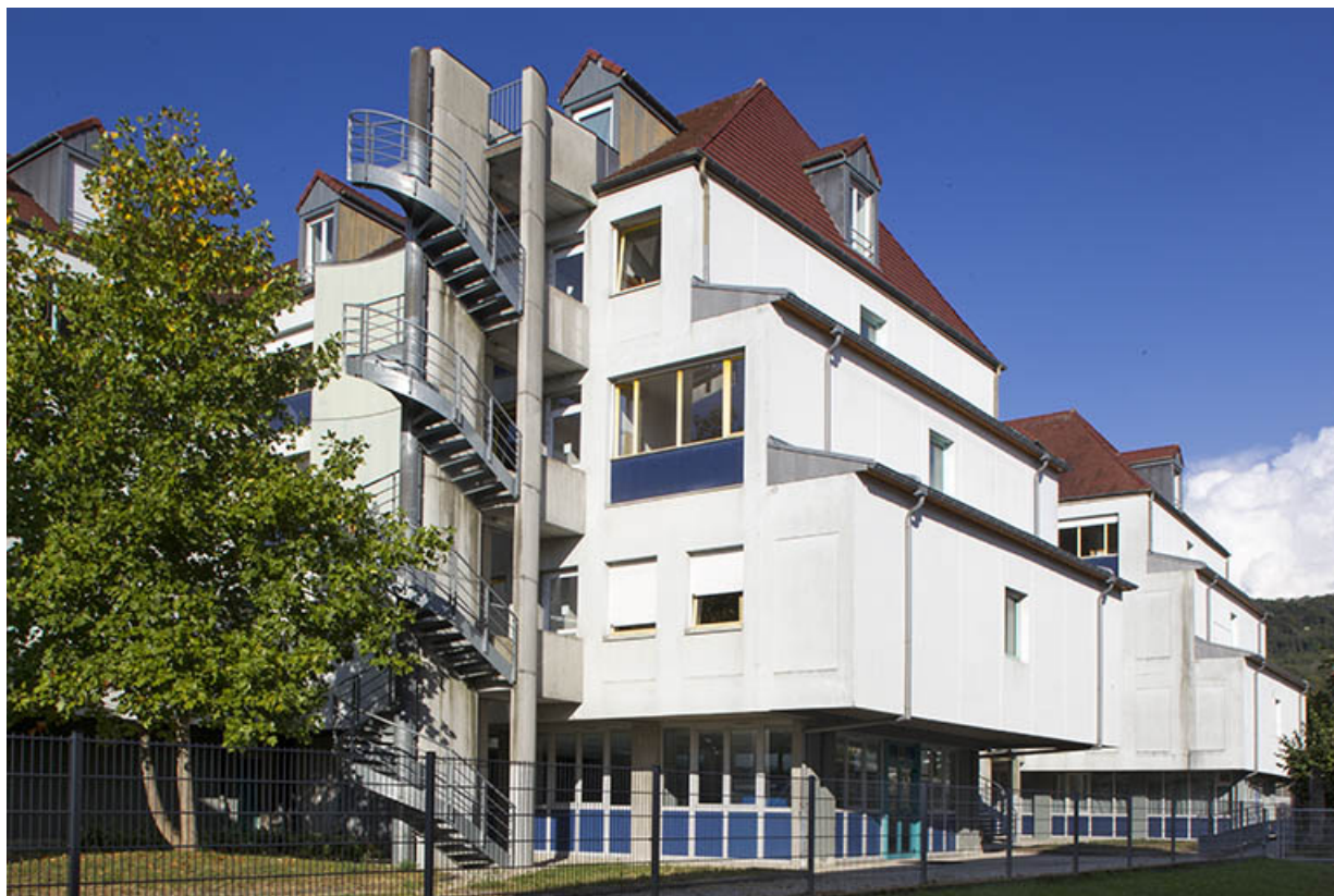
Internat : façades nord -est depuis la rue de la Résistance.