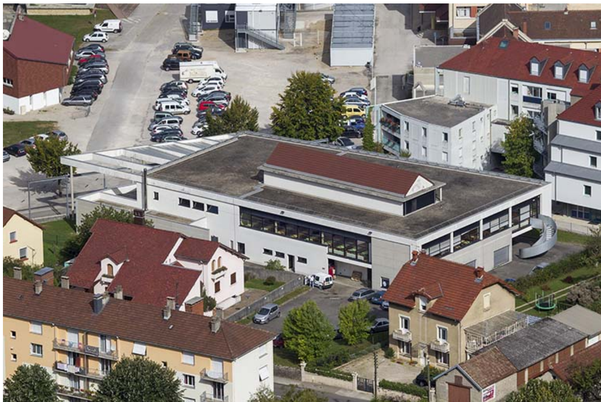
Internat-restaurant : vue générale du site.