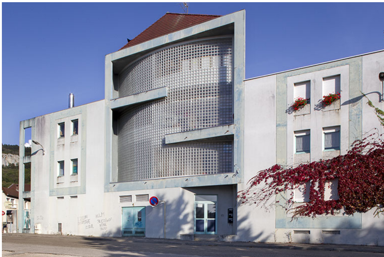
Internat : façade Ouest sur la rue de Versailles, détail.