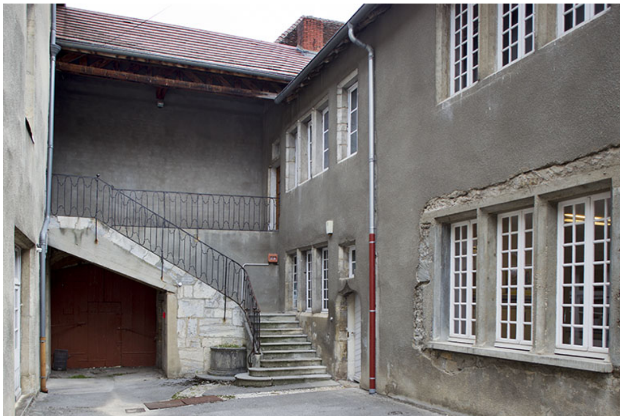
Escalier de la maison Bonnotte et façades ouest.