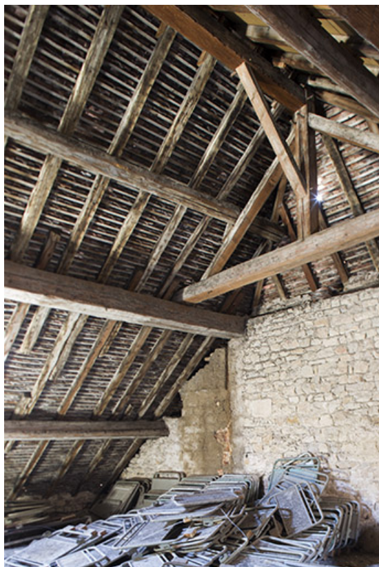
Maison Bonnotte : détail de la charpente.