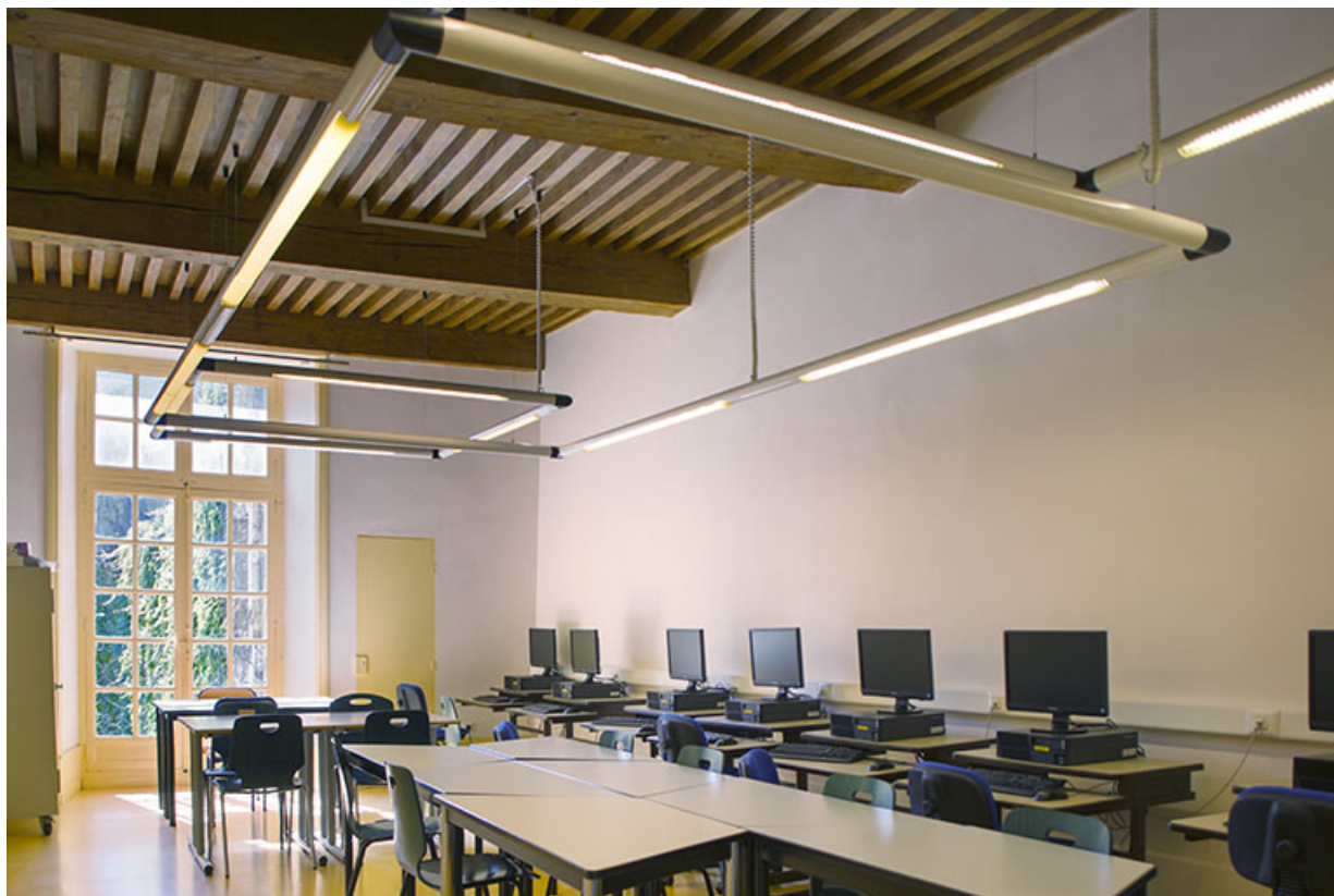
Externat, site Bonotte, salle de classe : plafonds à la française.