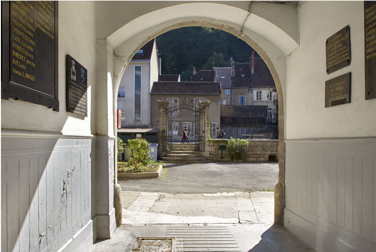
Site des oratoriens : vue de la cour intérieure depuis la rue du théâtre. 39, Poligny, 42 rue du Collège