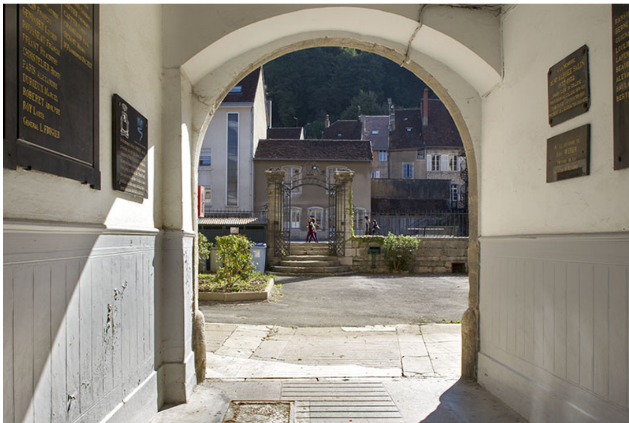
Site des oratoriens : vue de la cour intérieure depuis la rue du théâtre. 39, Poligny, 42 rue du Collège