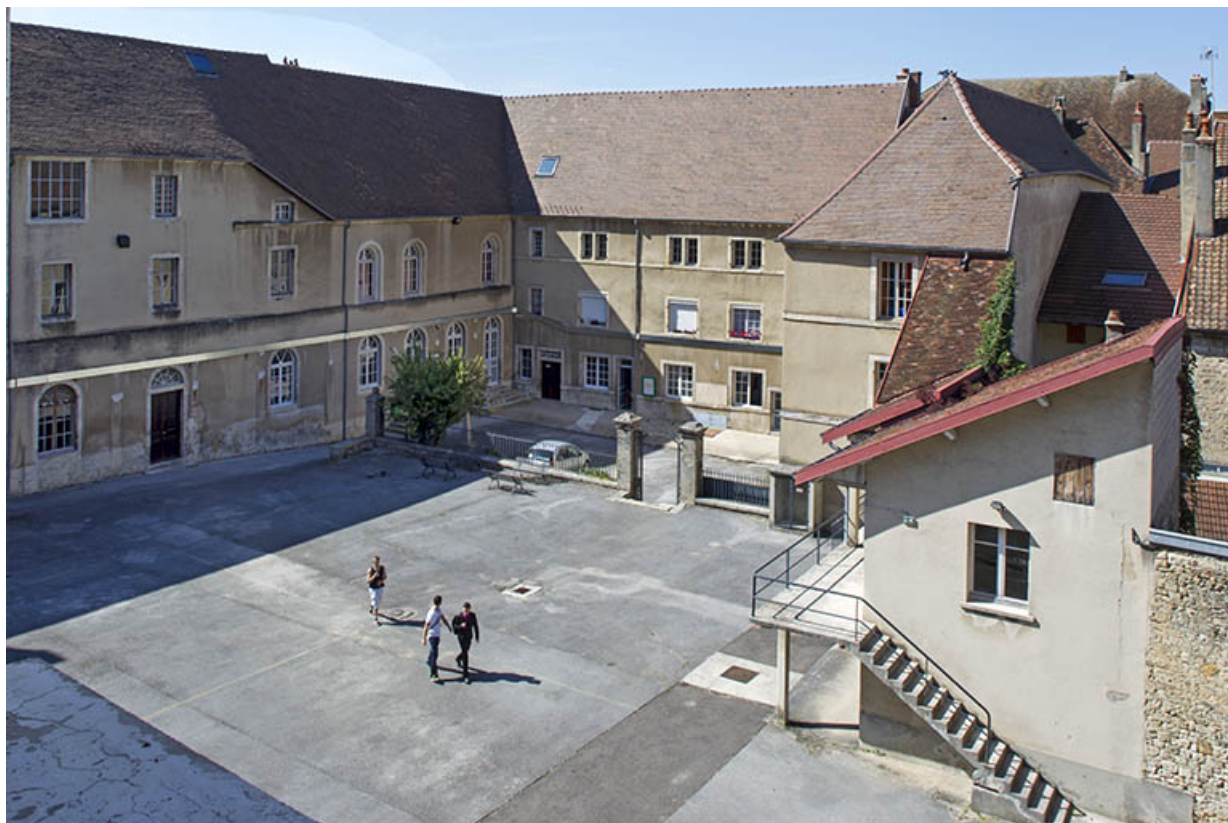
Externat : vue de la cour des oratoriens avec les adjonctions récentes.