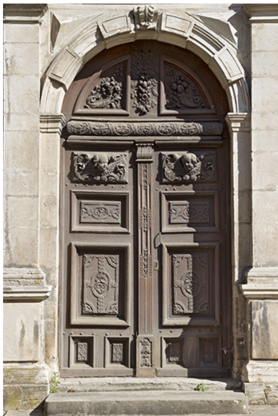
Site des oratoriens : porte dite porte des anges, vue rapprochée. 39, Poligny, 42 rue du Collège