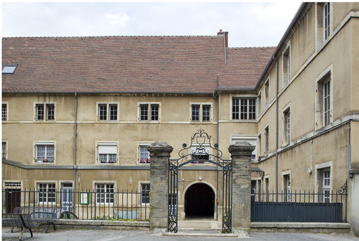
Cour des oratoriens : portail situé dans la cour intérieure.