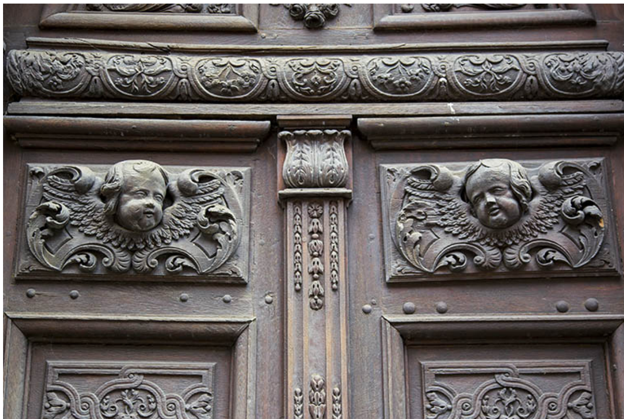
Site des oratoriens : détail du linteau de la porte des anges.