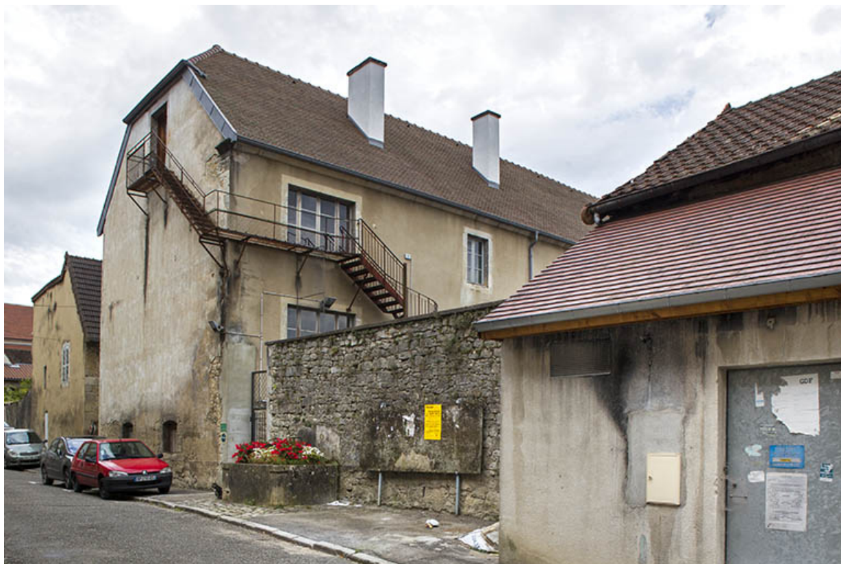
Site des oratoriens : façades Est, rue du théâtre 39, Poligny, 42 rue du Collège