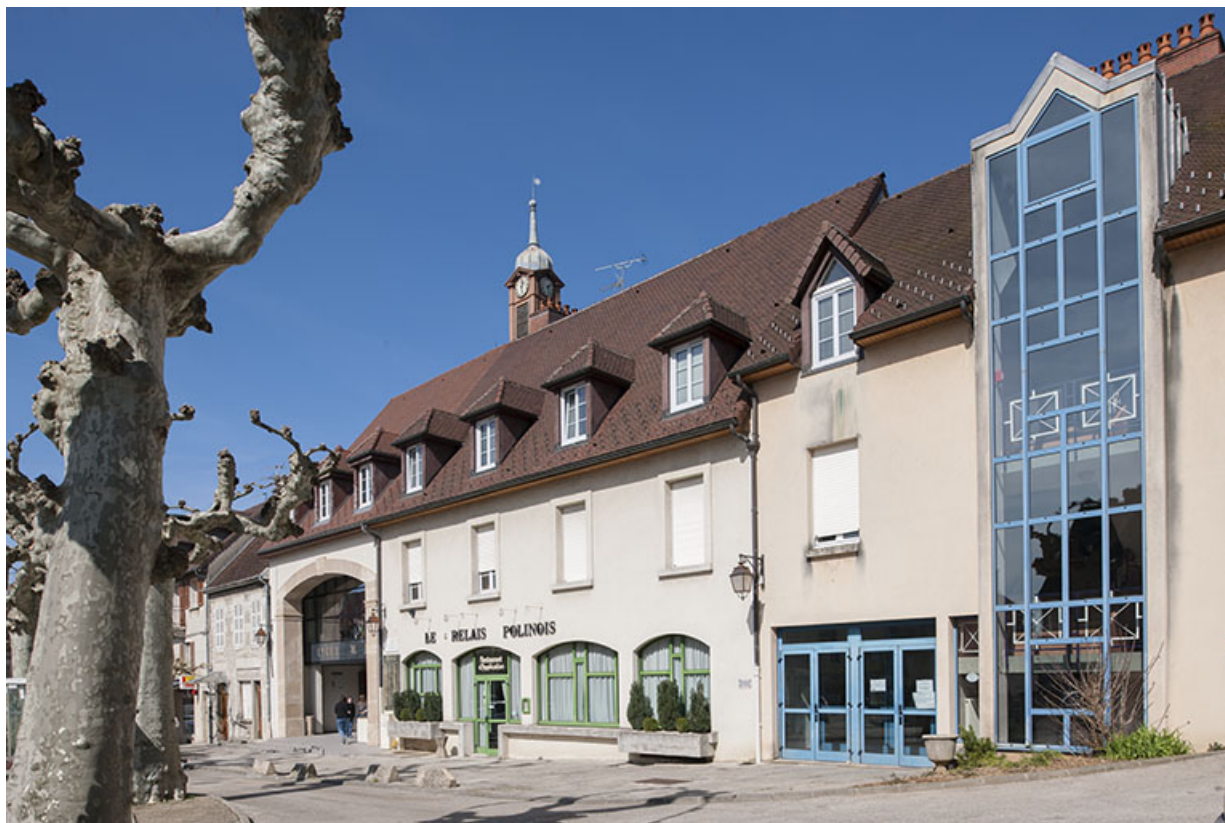
Poligny, lycée Hyacinthe Friant : restaurant d'application.