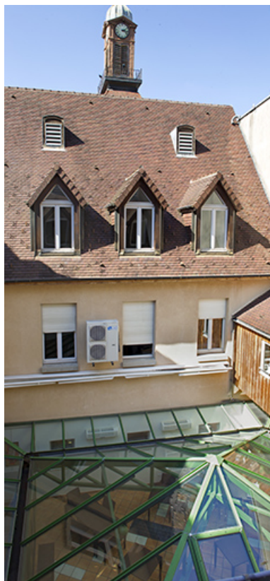
Restaurant d'application : façade postérieure et verrière de la salle de restaurant 39, Poligny, 3 rue Hyacinthe Friant