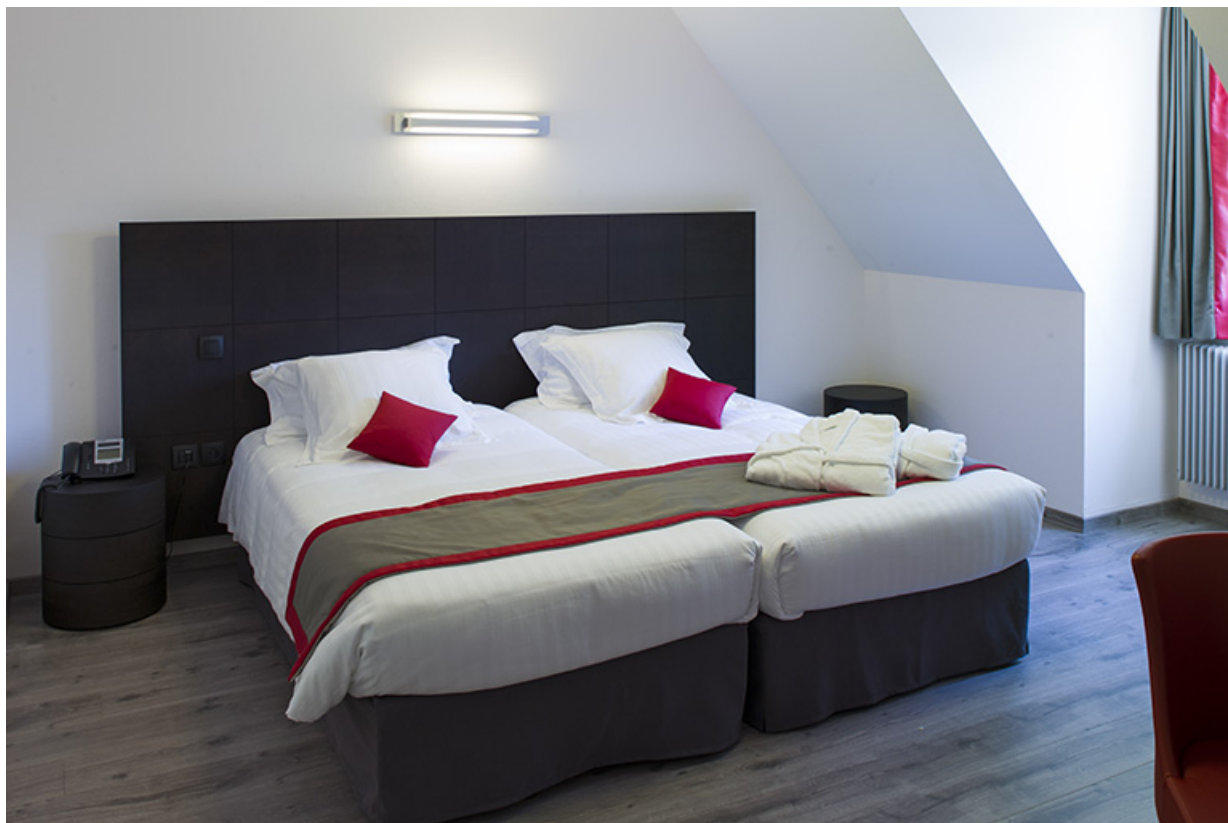
Relais polinois, sous combles : chambre d'application pour section hôtelière. 39, Poligny, 3 rue Hyacinthe Friant