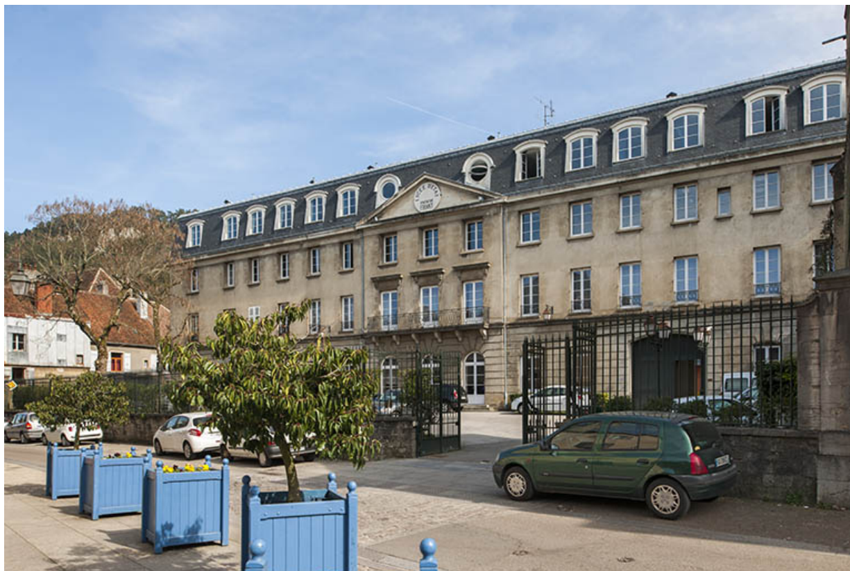
Externat : Façade antérieure, site des jacobins, rue Friant. 39, Poligny