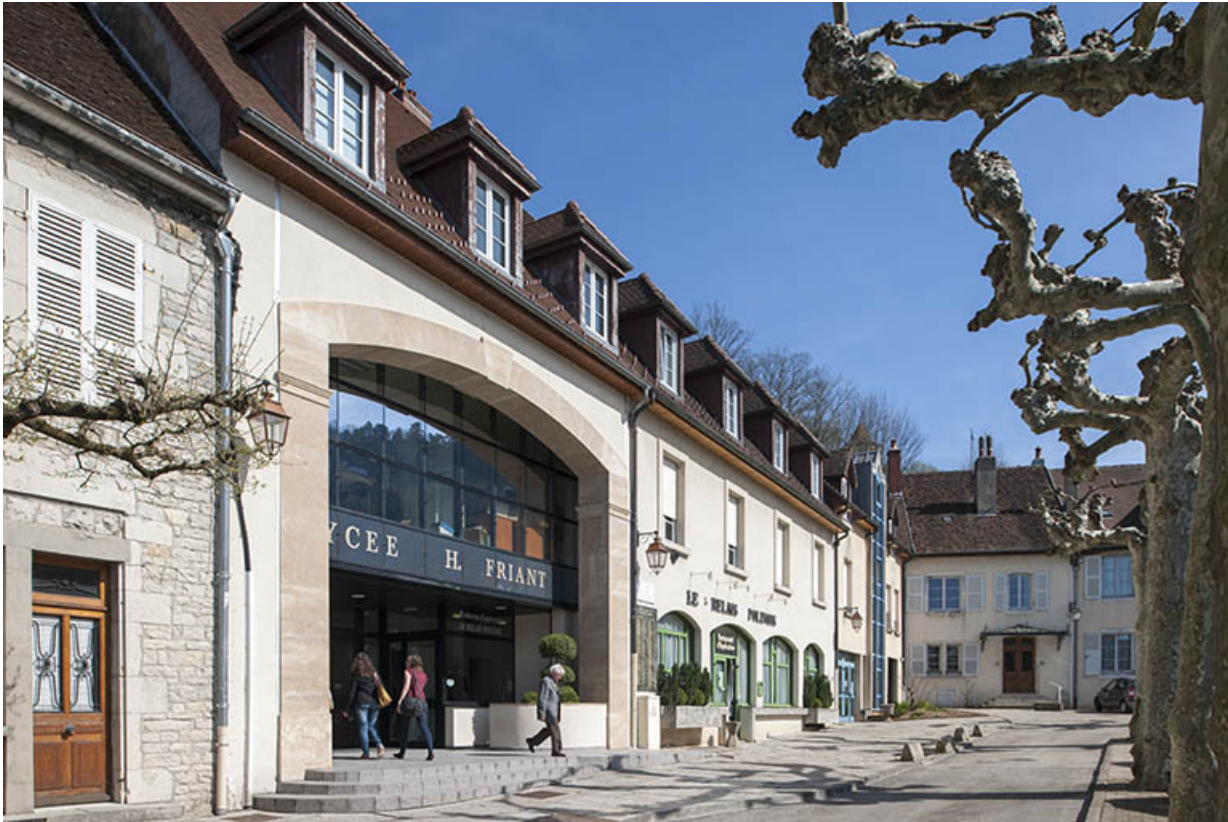
Entrée, place des déportés.