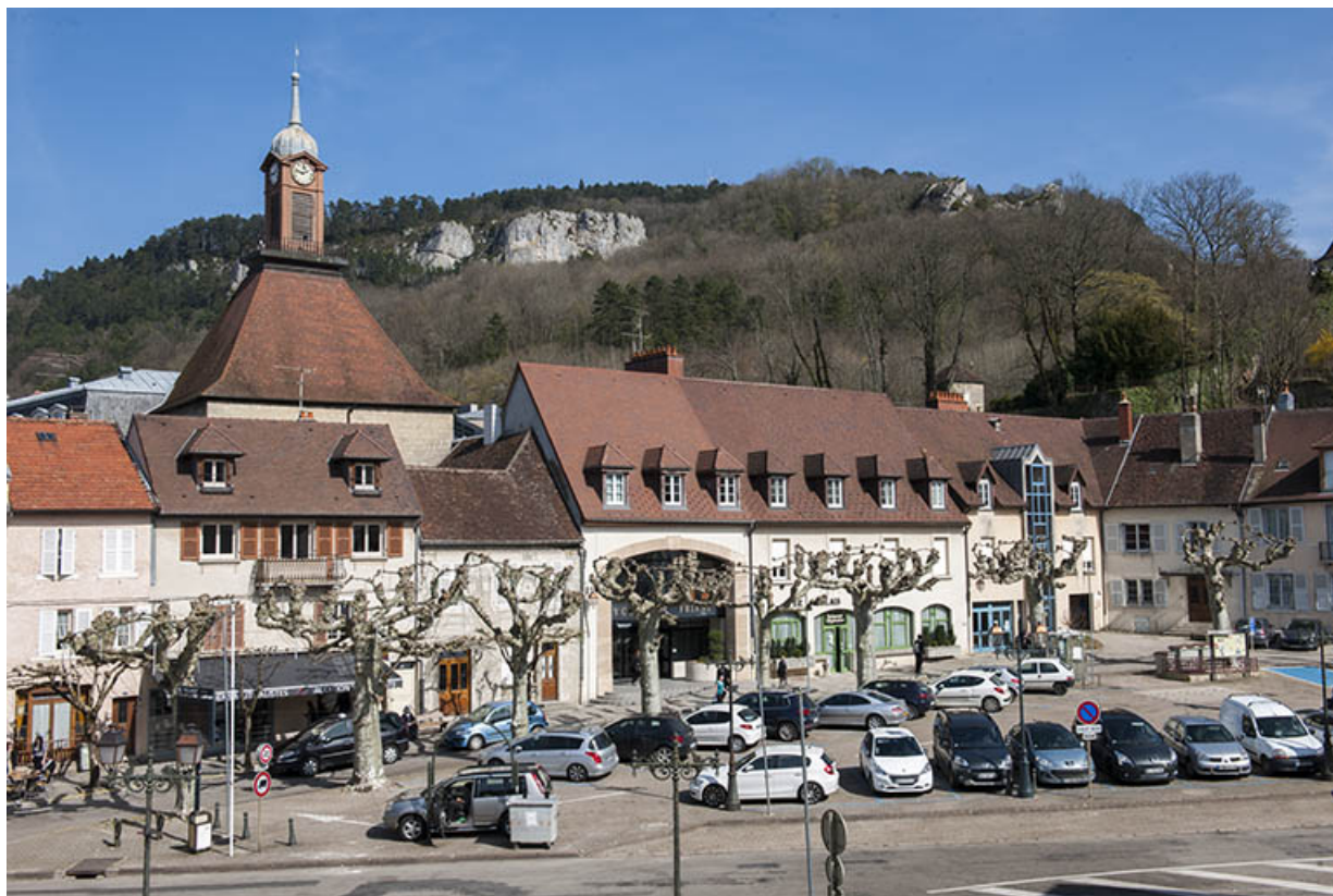
Vue générale depuis la place des déportés du site externat et restaurant d'application. 39, Poligny