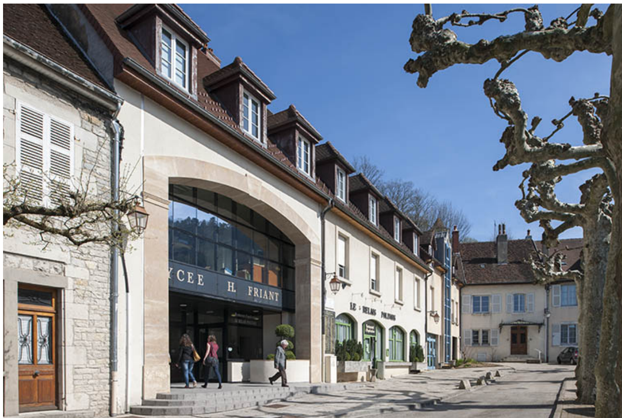
Entrée, place des déportés. 39, Poligny