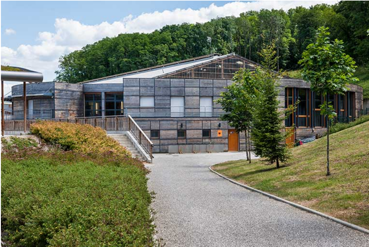
Centre équestre : manège, accès et bâtiment d'accueil.

39, Lons-le-Saunier, 410 montée Gauthier Villars