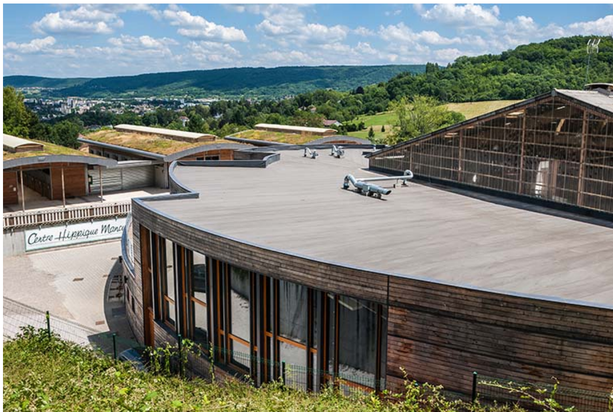
Centre équestre : toiture du manège et au second plan, toits végétalisés des boxes d'enseignement.

39, Lons-le-Saunier, 410 montée Gauthier Villars