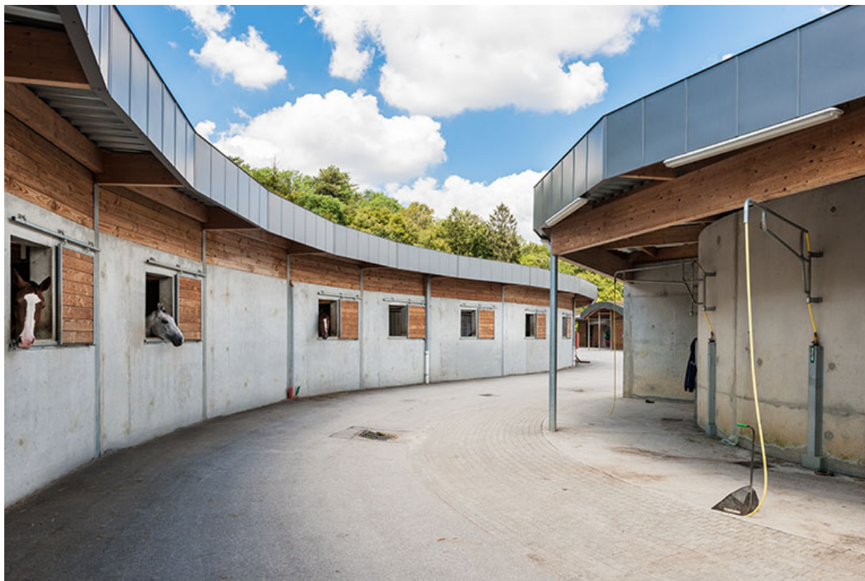
Centre équestre : chevaux dans leurs boxes. 39, Lons-le-Saunier, 410 montée Gauthier Villars