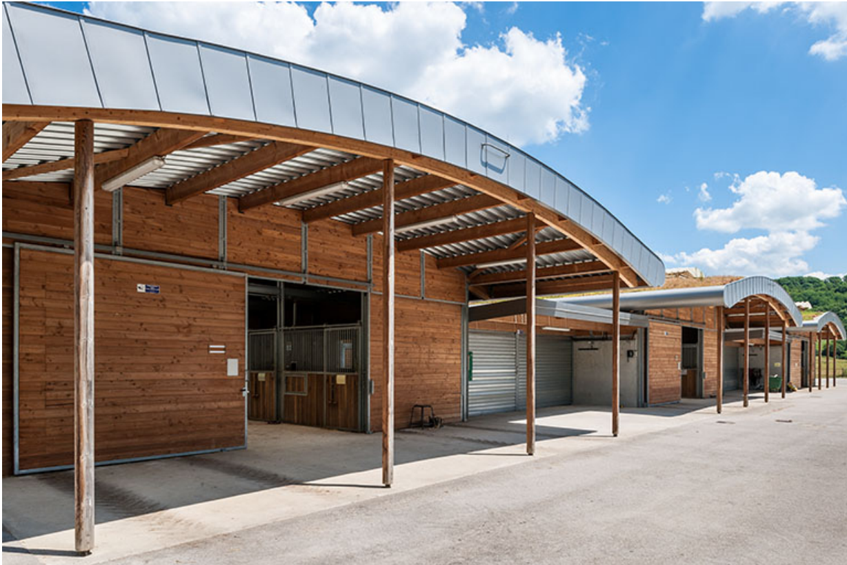
Centre équestre : façades des boxes d'enseignement.

39, Lons-le-Saunier, 410 montée Gauthier Villars