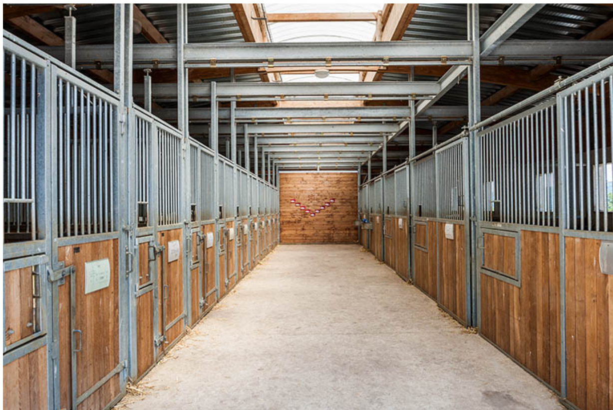
Centre équestre : boxes d'enseignement, allée centrale.

39, Lons-le-Saunier, 410 montée Gauthier Villars