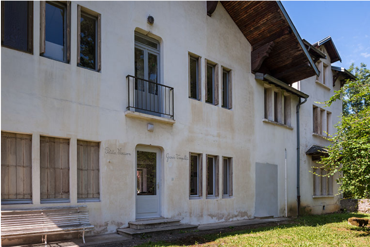
Chalet Colette : façade postérieure.

39, Lons-le-Saunier, 410 montée Gauthier Villars