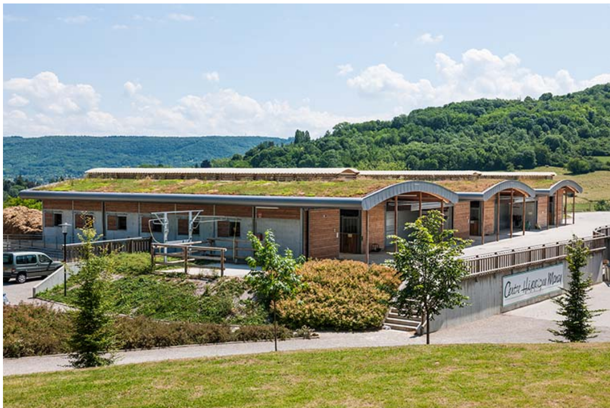
Centre équestre : vue générale des boxes d'enseignement.

39, Lons-le-Saunier, 410 montée Gauthier Villars