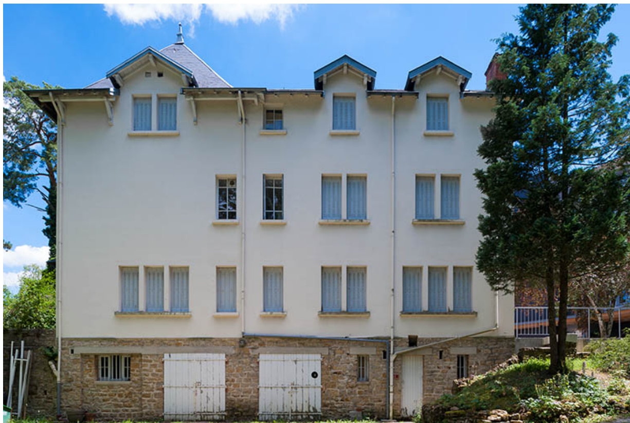
Chalet Colette : façade postérieure de l'aile ouest.

39, Lons-le-Saunier, 410 montée Gauthier Villars