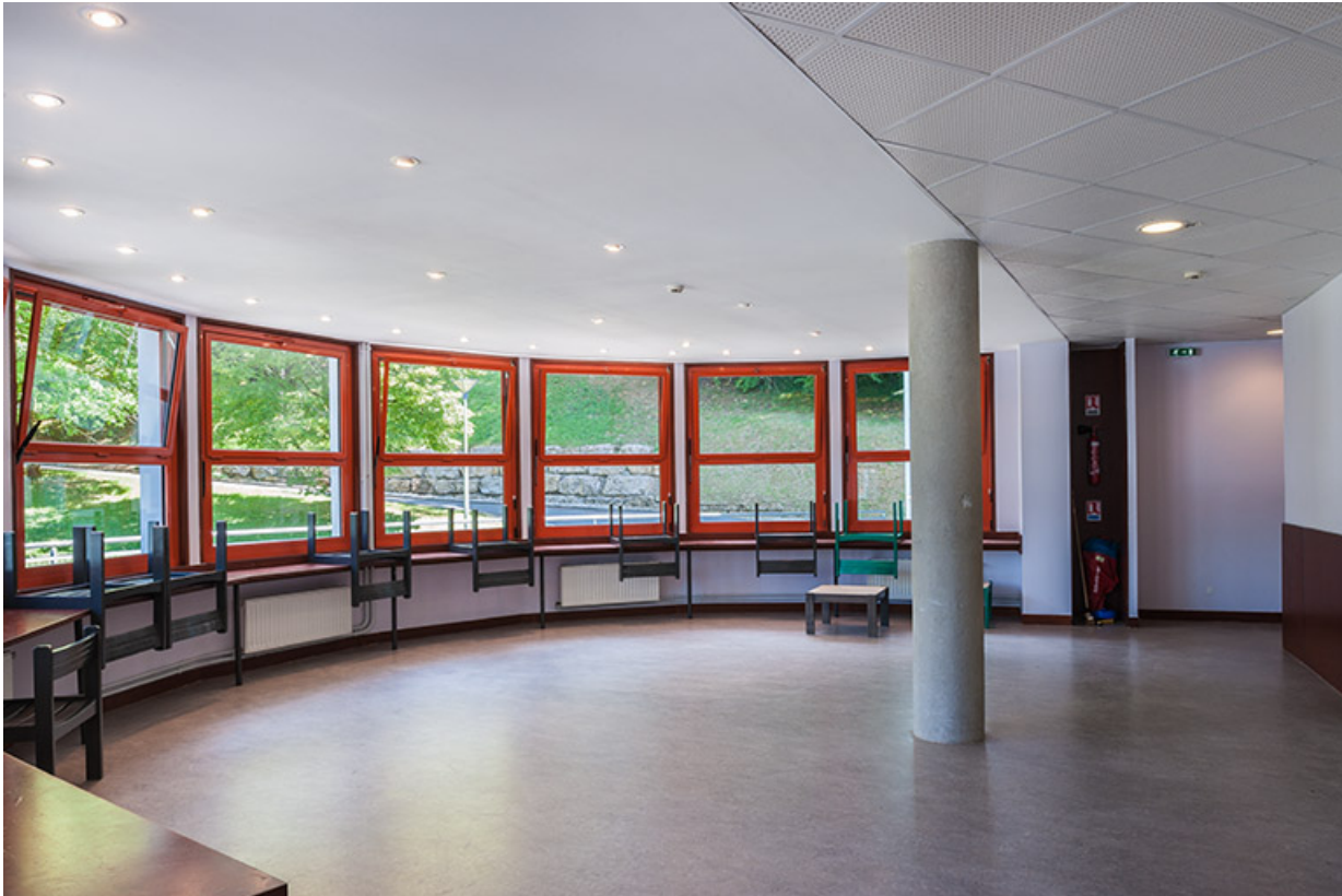
Internat : hall hémisphérique du 1er étage.

39, Lons-le-Saunier, 410 montée Gauthier Villars