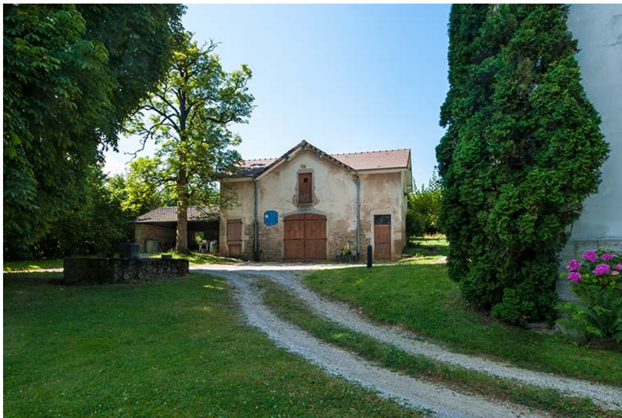
Annexe servant de garage : vue générale.

39, Lons-le-Saunier, 410 montée Gauthier Villars