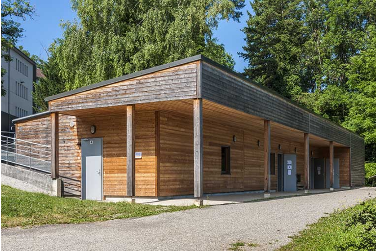
Externat : façade antérieure du préfabriqué rénové.

39, Lons-le-Saunier, 410 montée Gauthier Villars