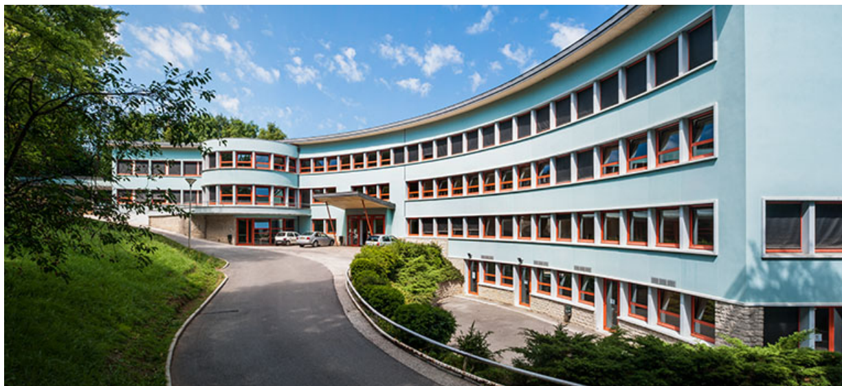
Internat : vue d'ensemble, façade antérieure. 39, Lons-le-Saunier, 410 montée Gauthier Villars