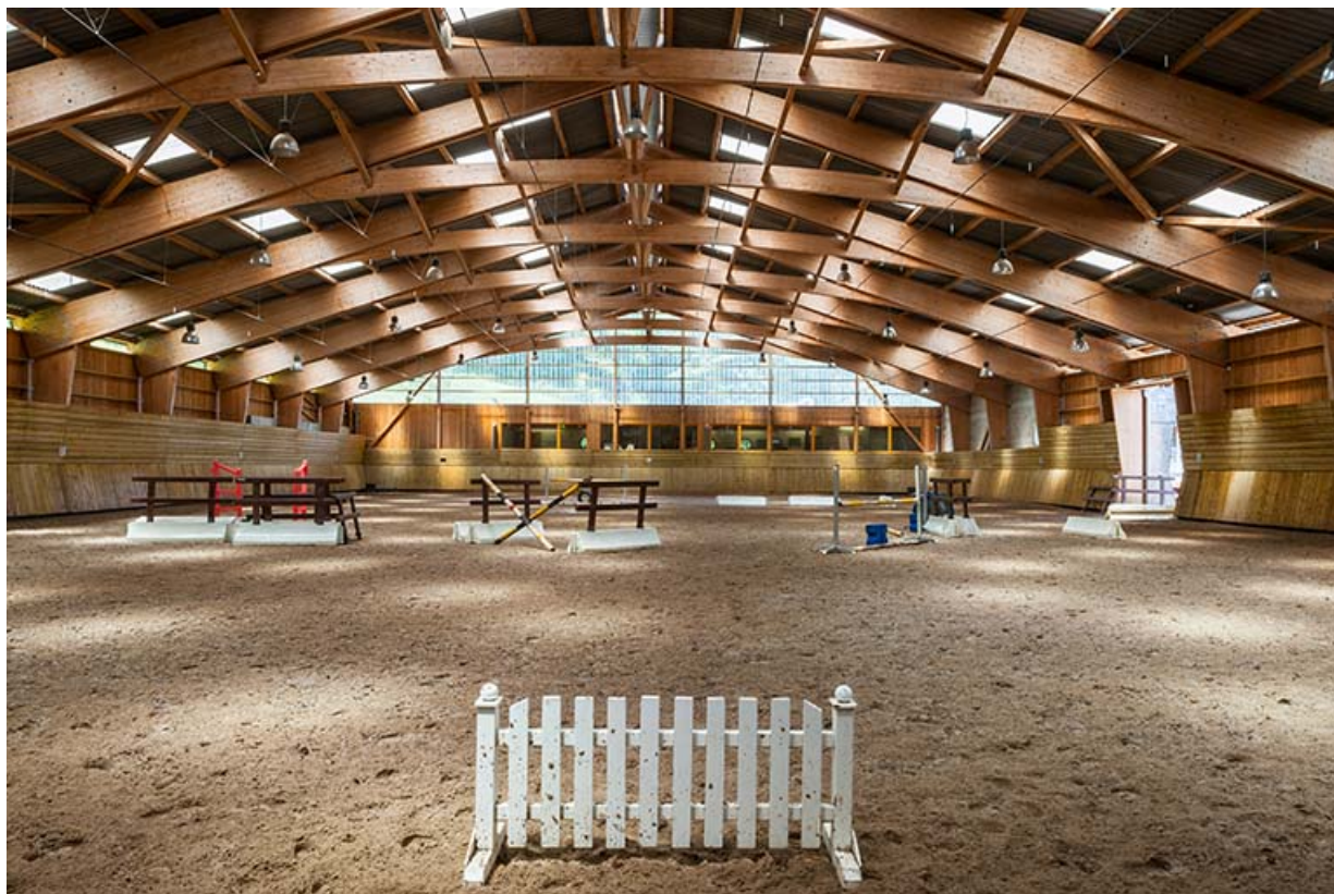
Centre équestre : manège, vue intérieure avec charpente en lamellé collé.

39, Lons-le-Saunier, 410 montée Gauthier Villars