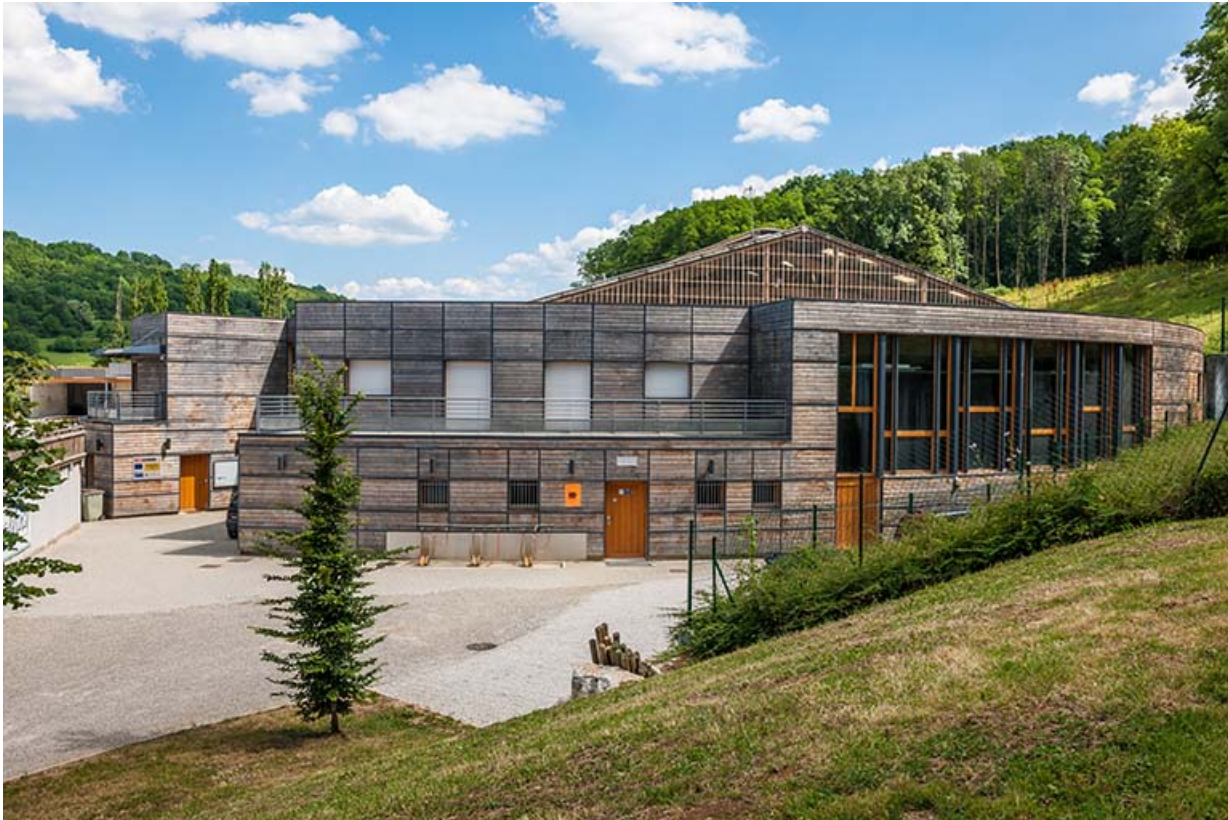
Centre équestre : manège, vue générale de la partie accueil, administration.

39, Lons-le-Saunier, 410 montée Gauthier Villars