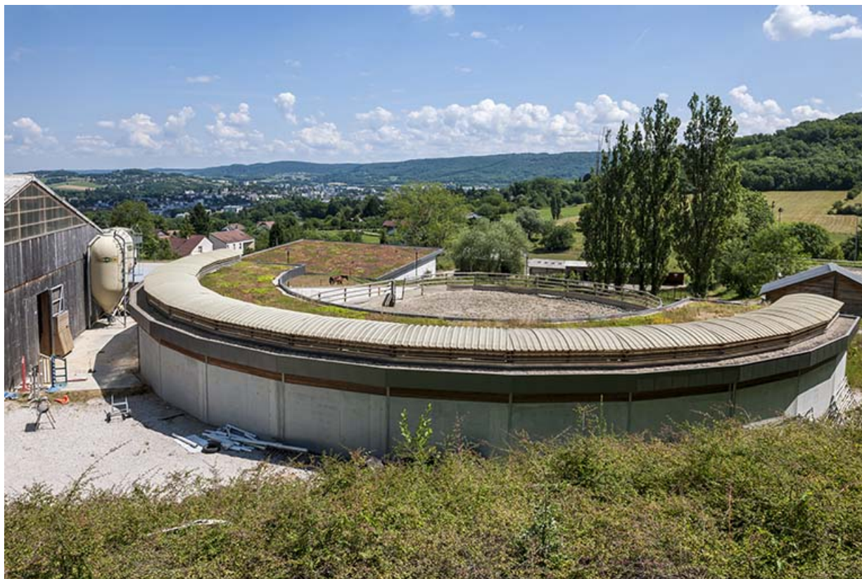
Centre équestre : boxes des jeunes chevaux et paddock, vue générale.

39, Lons-le-Saunier, 410 montée Gauthier Villars