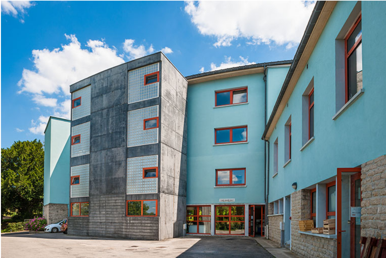
Internat : avant-corps et aile ouest de la façade postérieure.

39, Lons-le-Saunier, 410 montée Gauthier Villars