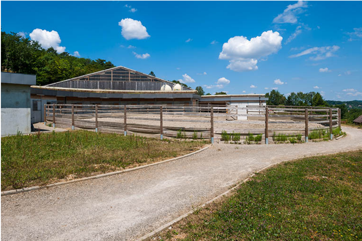
Centre équestre : paddock, vue générale.

39, Lons-le-Saunier, 410 montée Gauthier Villars