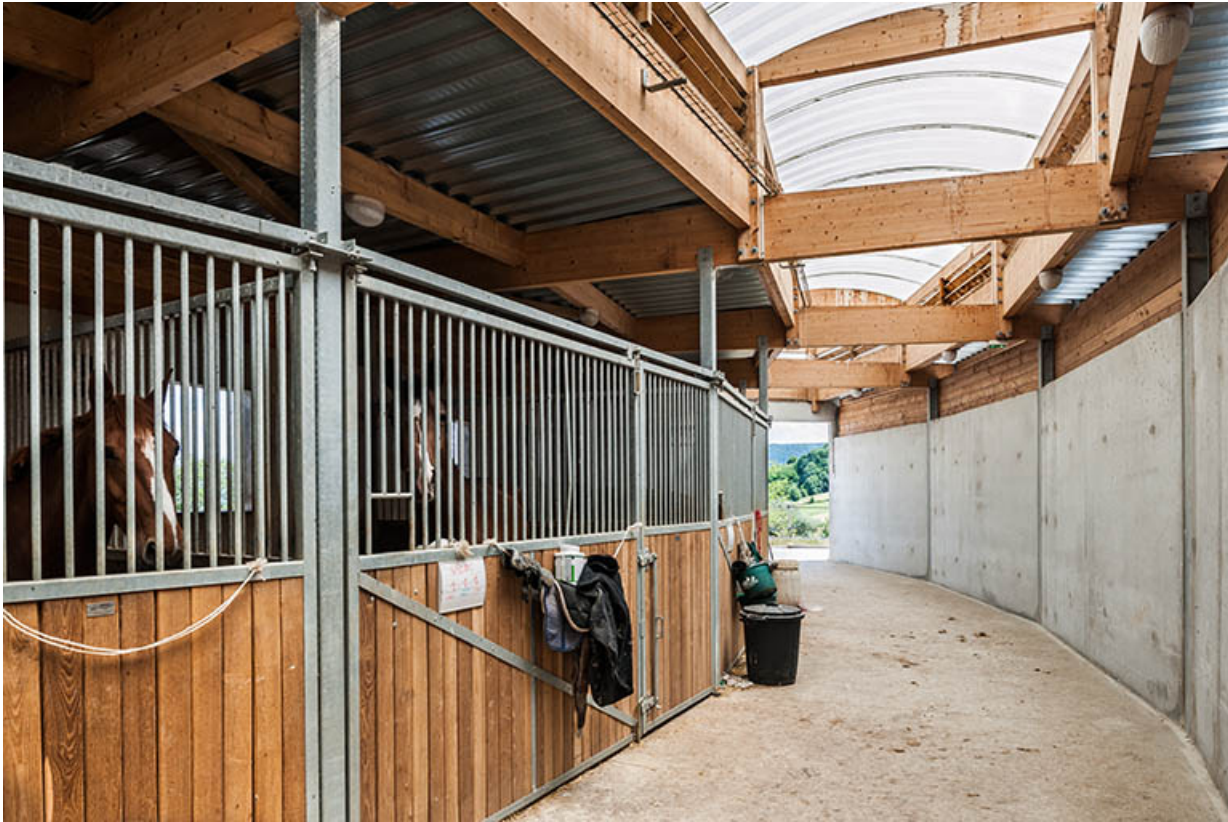
Centre équestre : chevaux dans les stalles du manège.

39, Lons-le-Saunier, 410 montée Gauthier Villars