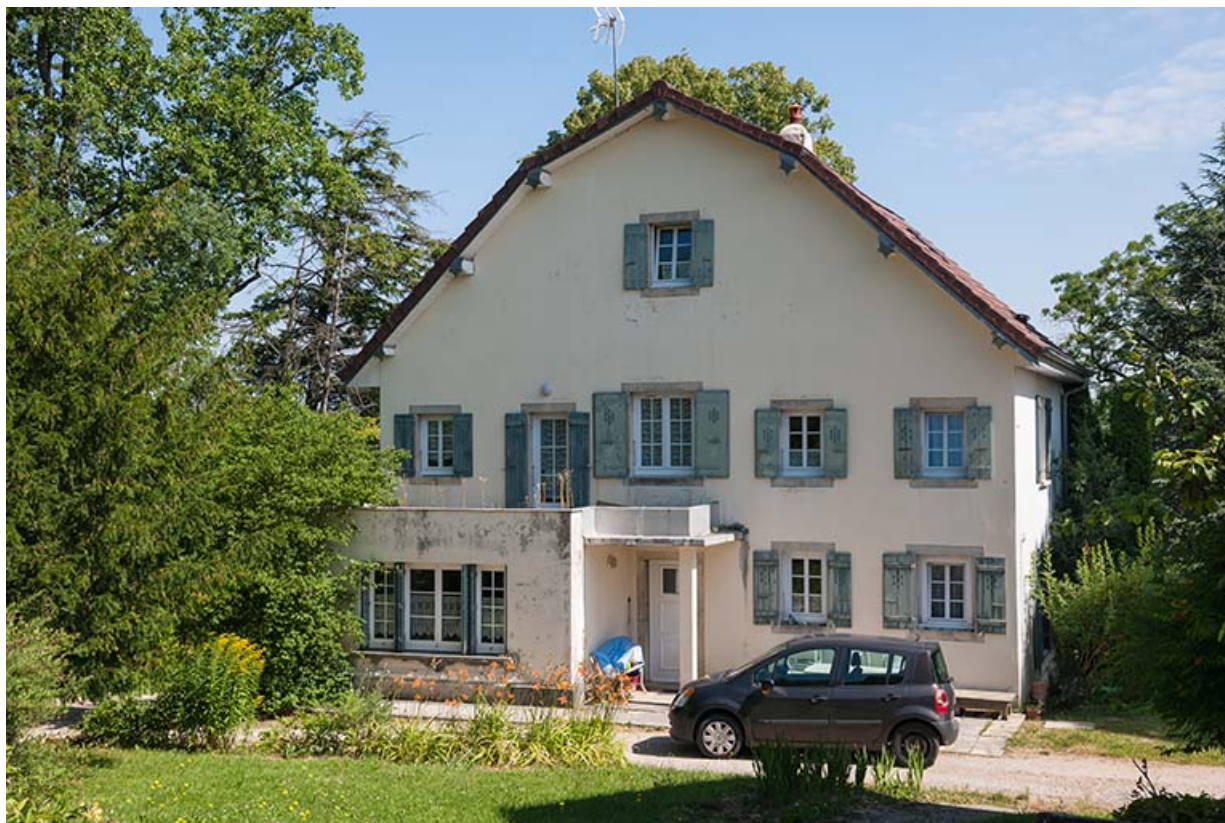
Pavillon du proviseur : façade postérieure.

39, Lons-le-Saunier, 410 montée Gauthier Villars