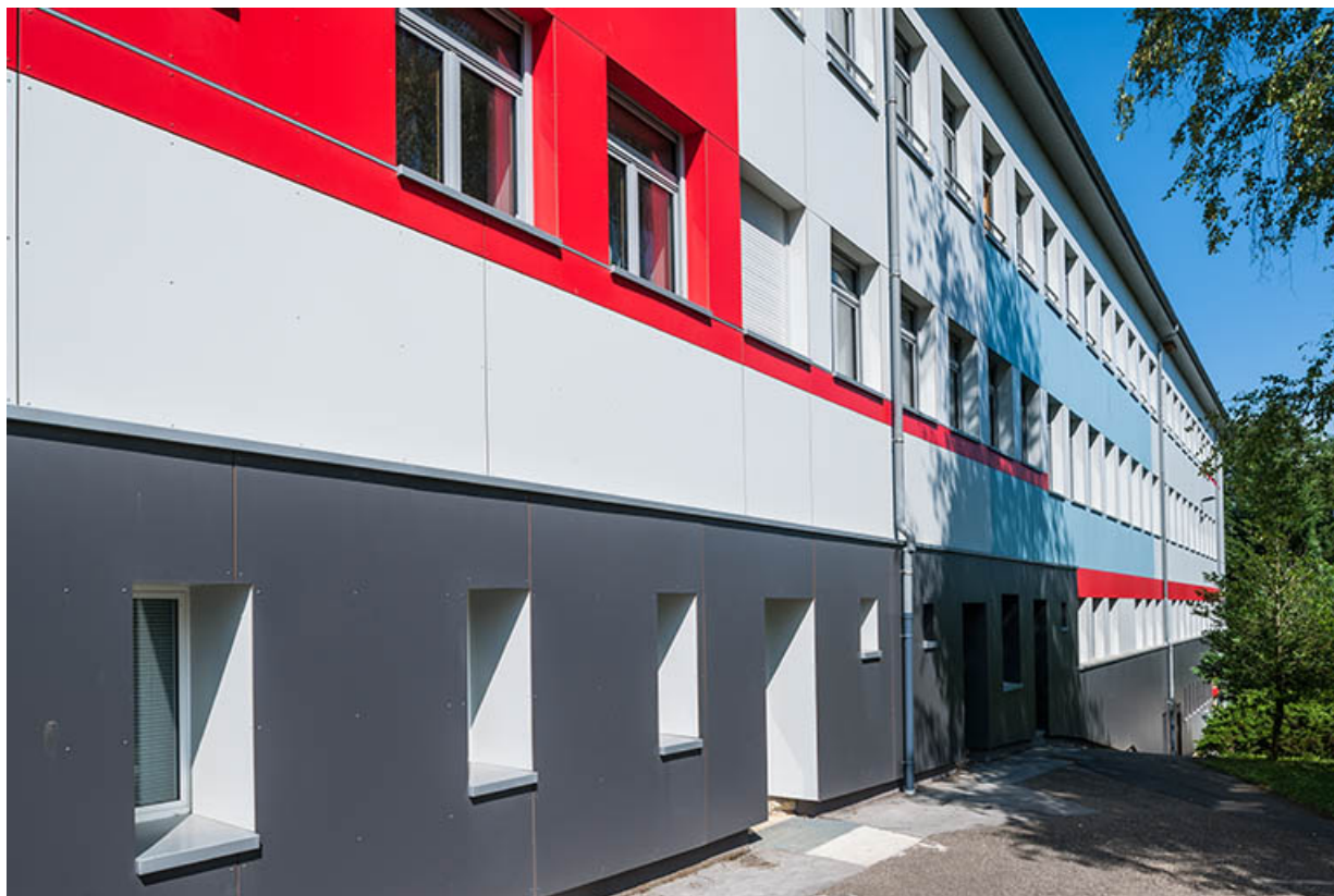
Externat : façade antérieure avec parements isolants de couleur.

39, Lons-le-Saunier, 410 montée Gauthier Villars