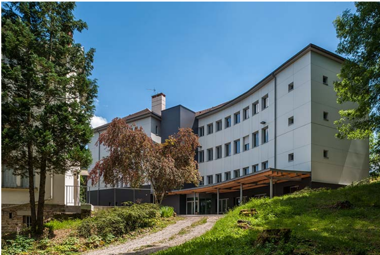
Externat : aile ouest, façade postérieure après rénovation , ajout d'un auvent et parements isolants. 39, Lons-le-Saunier, 410 montée Gauthier Villars