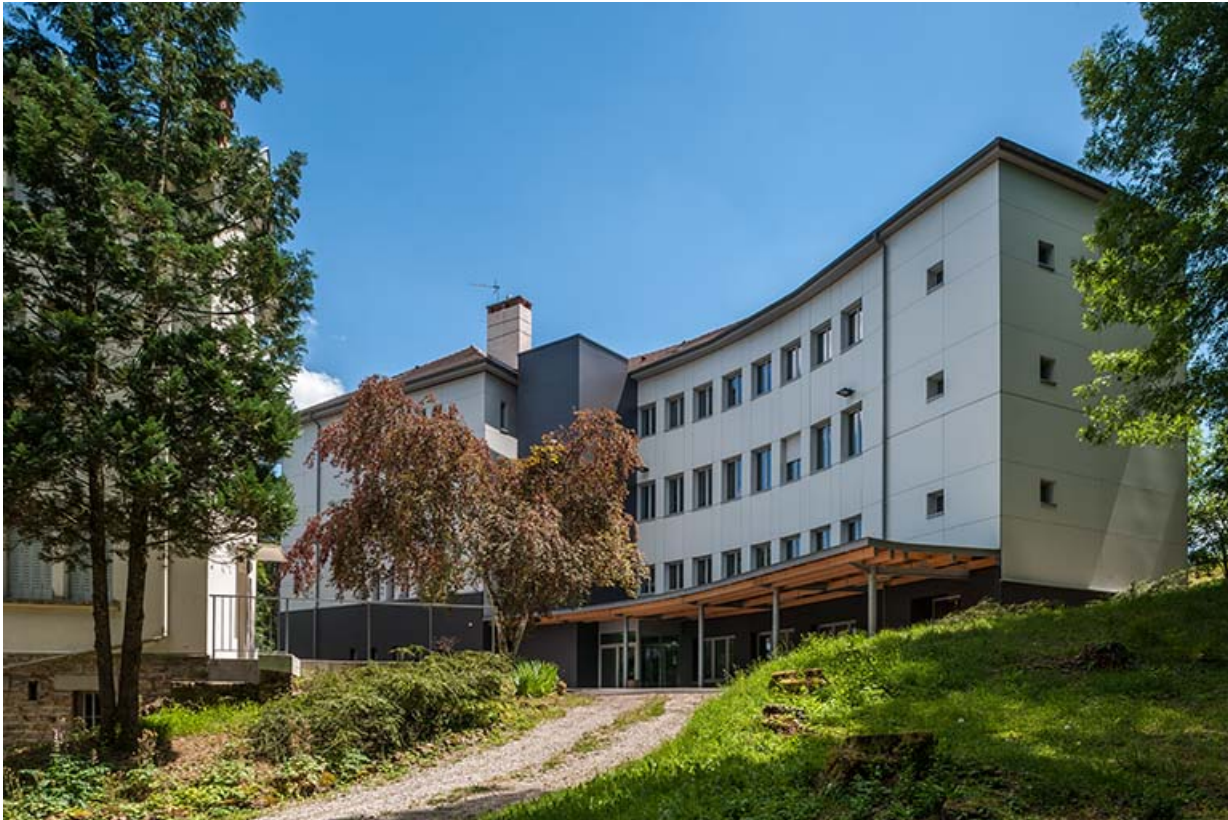
Externat : aile ouest, façade postérieure après rénovation , ajout d'un auvent et parements isolants.

39, Lons-le-Saunier, 410 montée Gauthier Villars