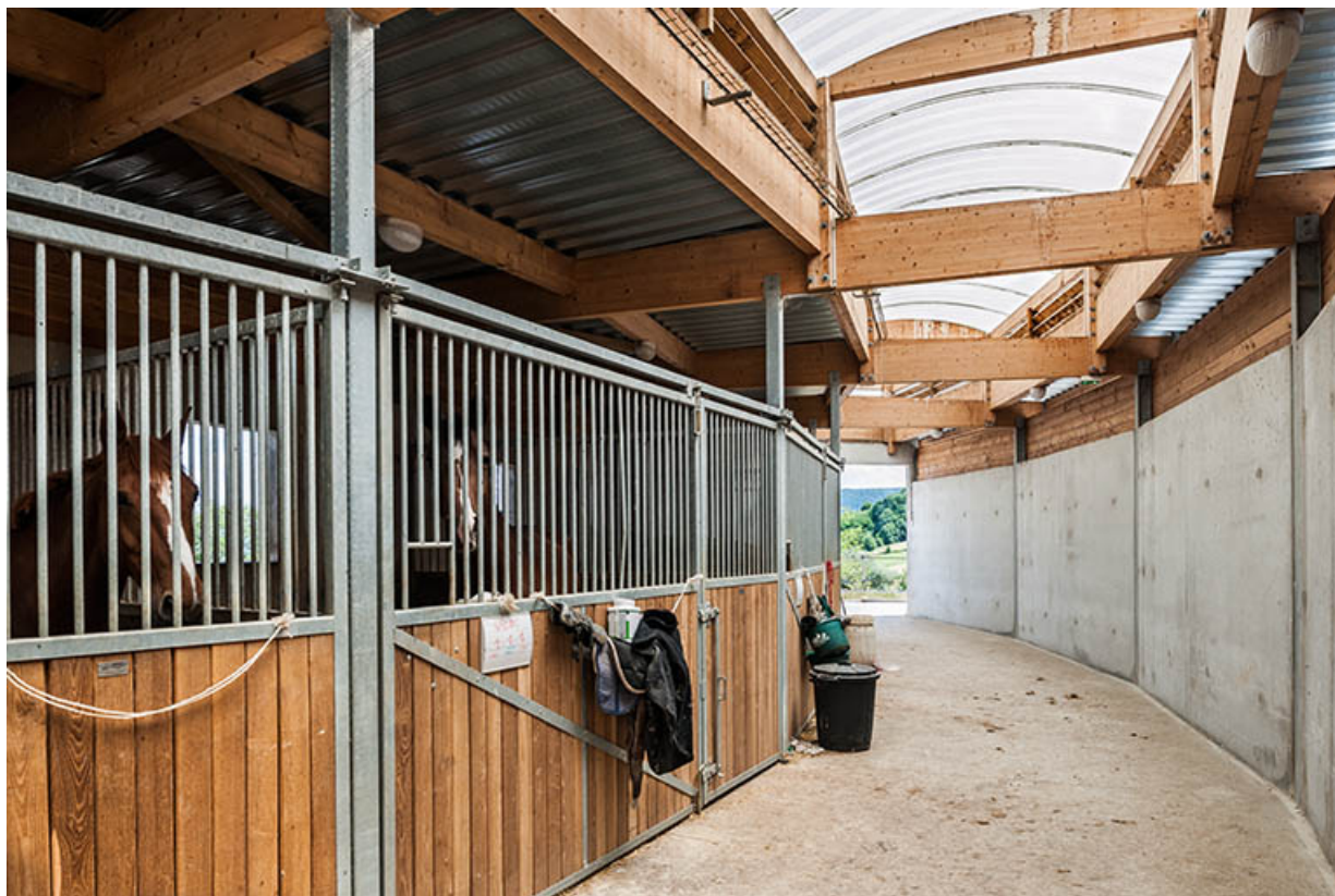
Centre équestre : chevaux dans les stalles du manège.

39, Lons-le-Saunier, 410 montée Gauthier Villars