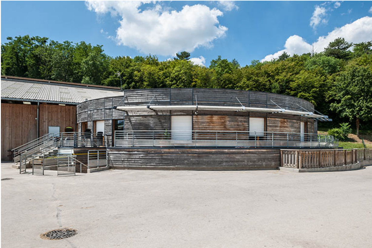
Centre équestre : rotonde du bâtiment d'accueil.

39, Lons-le-Saunier, 410 montée Gauthier Villars