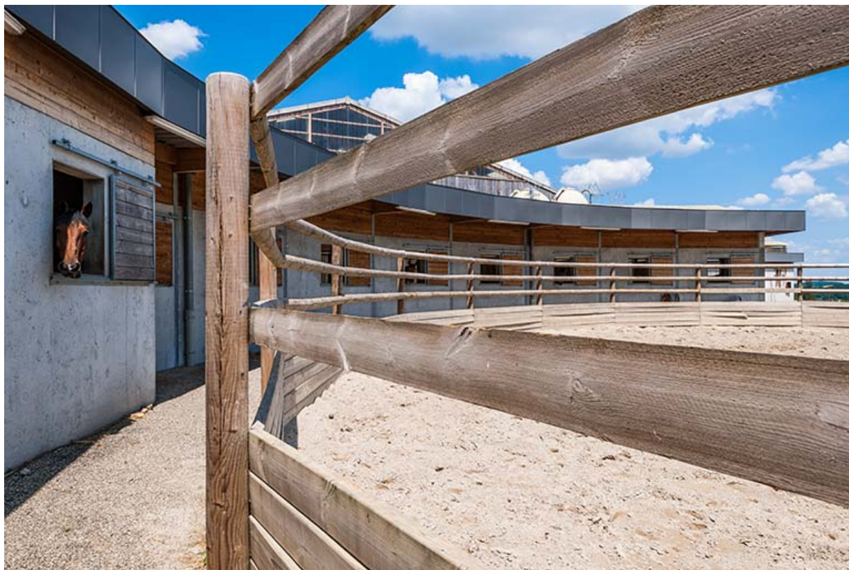
Centre équestre : boxes des jeunes chevaux. 39, Lons-le-Saunier, 410 montée Gauthier Villars