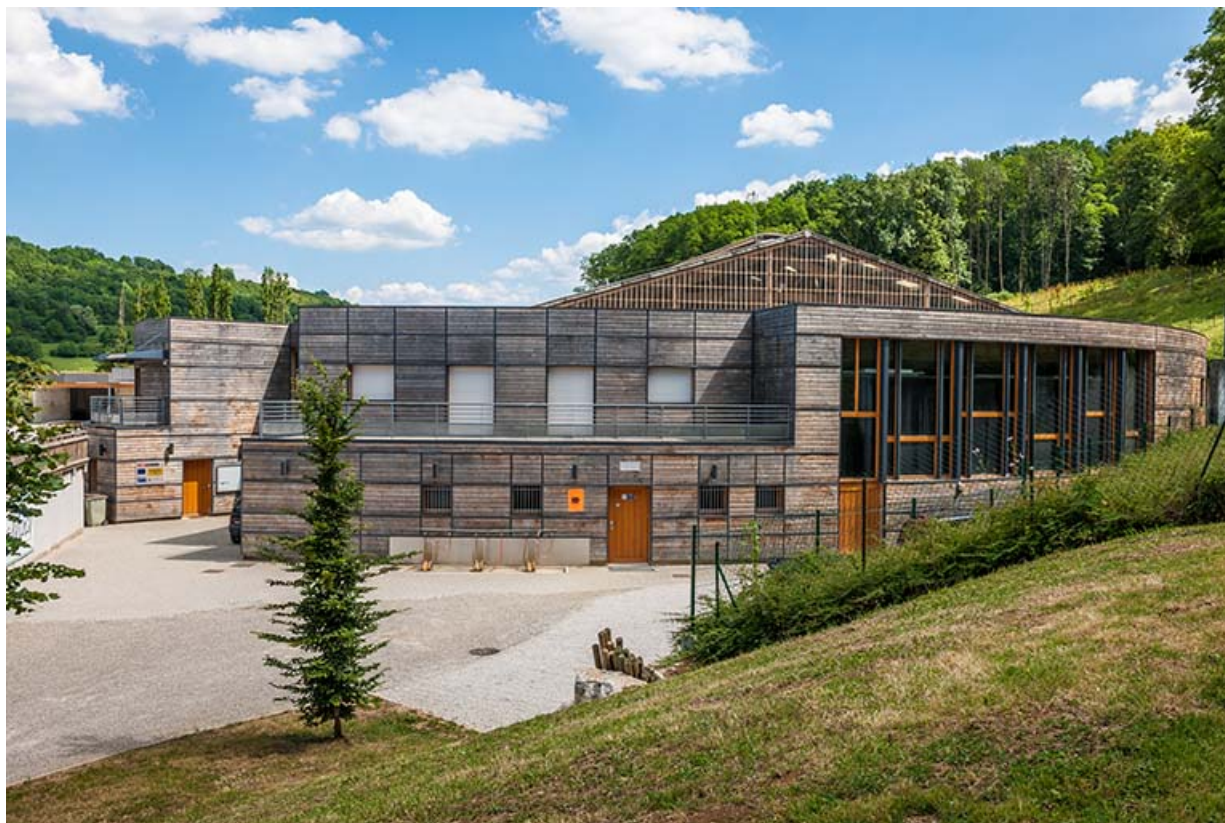
Centre équestre : manège, vue générale de la partie accueil, administration. 39, Lons-le-Saunier, 410 montée Gauthier Villars