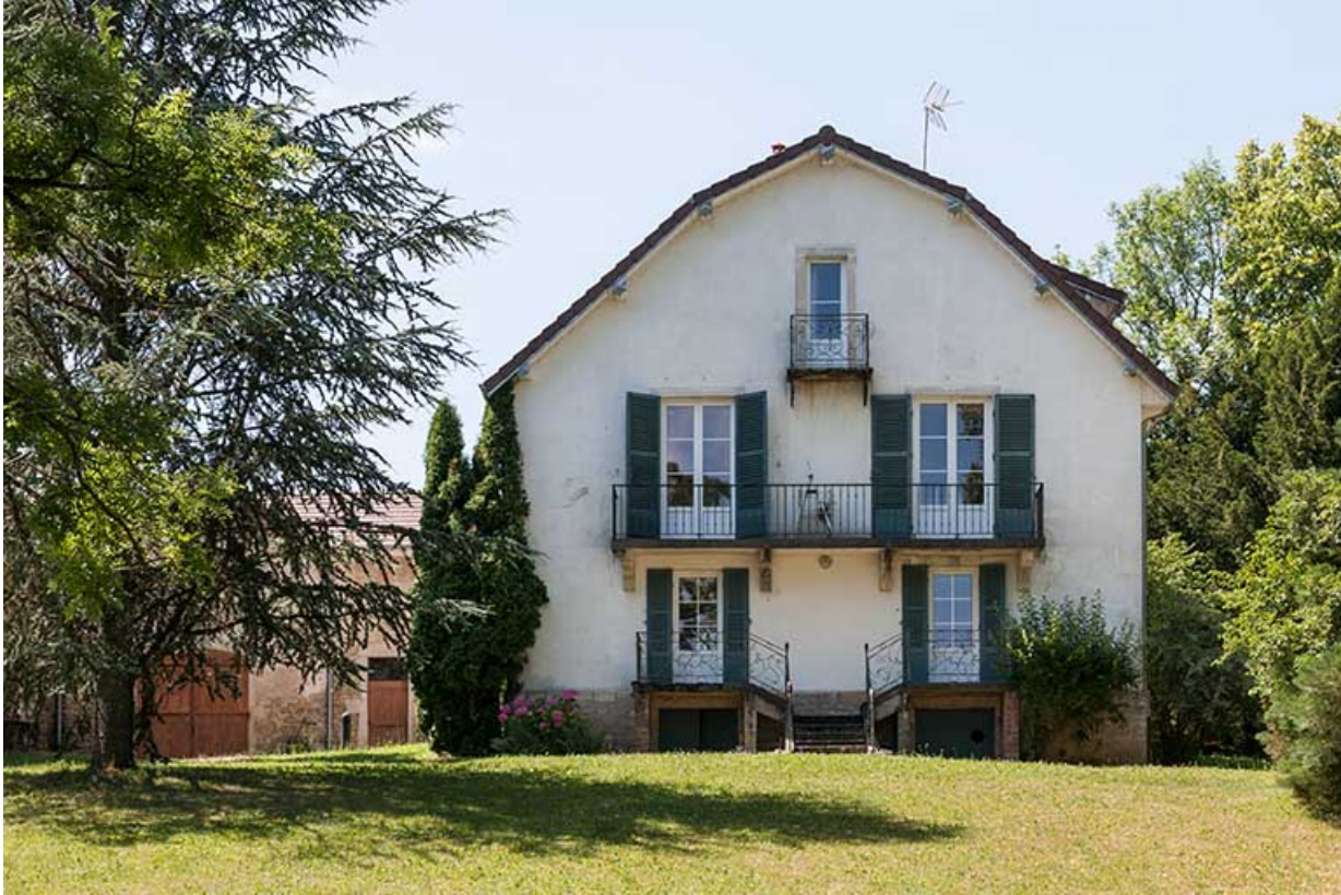
Pavillon du proviseur : façade antérieure.

39, Lons-le-Saunier, 410 montée Gauthier Villars