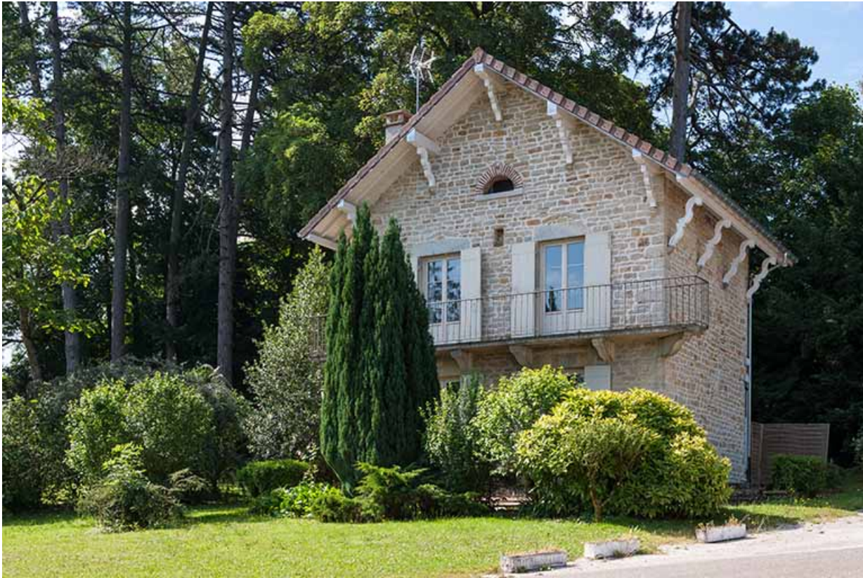
Villa les Perrières : façade antérieure, logement.

39, Lons-le-Saunier, 410 montée Gauthier Villars