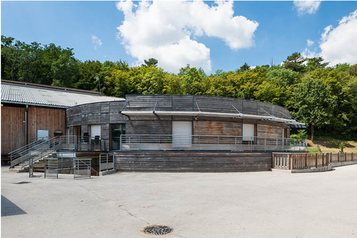
Centre équestre : façades bois de la rotonde d'accueil du manège.

39, Lons-le-Saunier, 410 montée Gauthier Villars