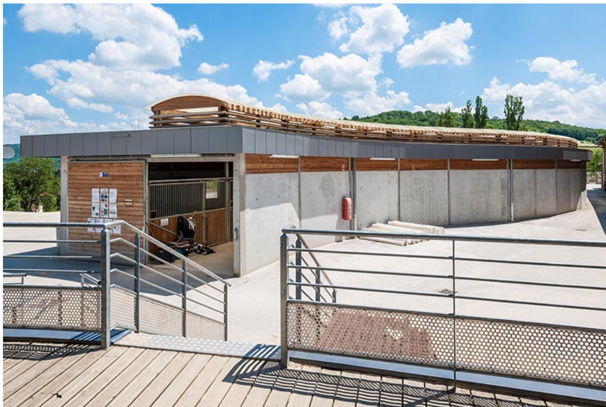
Centre équestre : boxes des propriétaires de chevaux.

39, Lons-le-Saunier, 410 montée Gauthier Villars