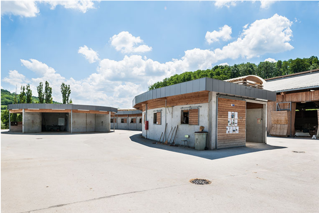
Centre équestre : boxes des propriétaires de chevaux au 1er plan et cercle équin en arrière-plan.

39, Lons-le-Saunier, 410 montée Gauthier Villars