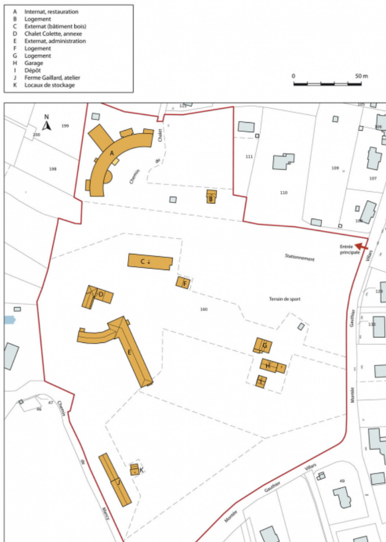
Plan-masse et situation. Extrait du plan cadastral, 2011, section BD, échelle 1/1 500. 39, Lons-le-Saunier, 410 montée Gauthier Villars