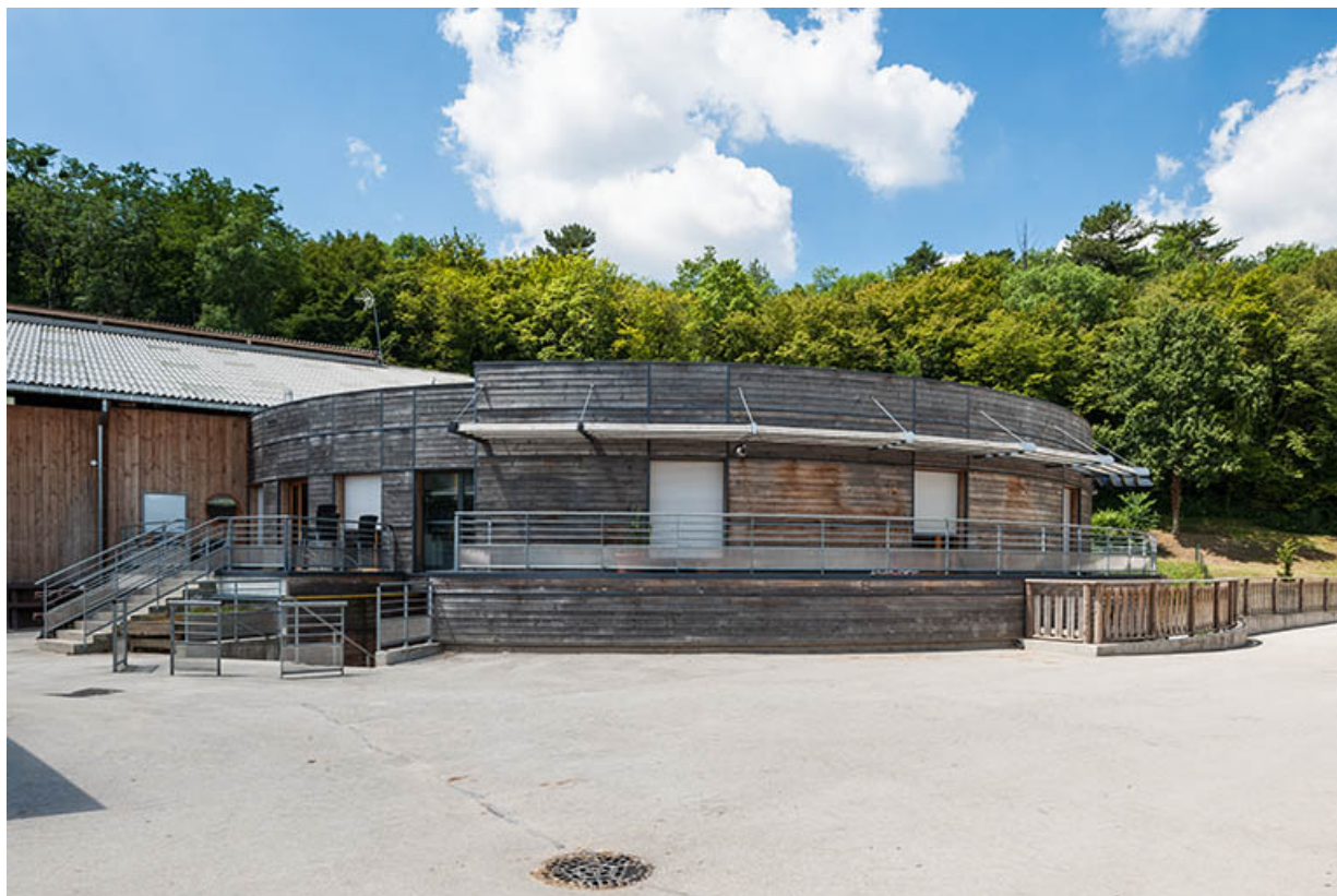
Centre équestre : façades bois de la rotonde d'accueil du manège.

39, Lons-le-Saunier, 410 montée Gauthier Villars