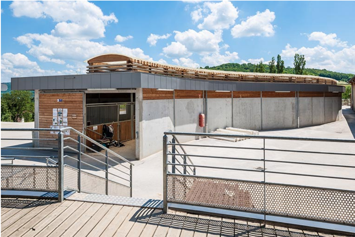
Centre équestre : boxes des propriétaires de chevaux.

39, Lons-le-Saunier, 410 montée Gauthier Villars