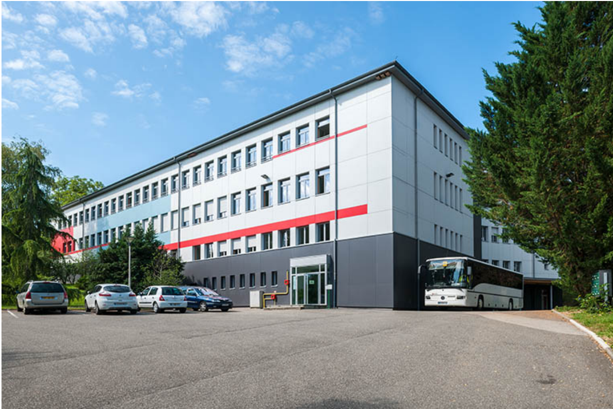
Externat : vue trois-quart.

39, Lons-le-Saunier, 410 montée Gauthier Villars