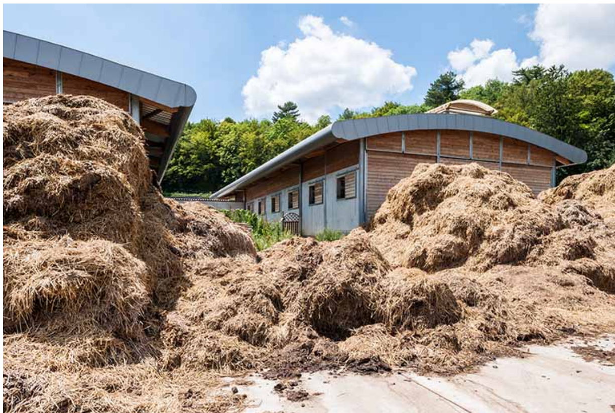
Centre équestre : fumière avec en arrière-plan les boxes d'enseignement.

39, Lons-le-Saunier, 410 montée Gauthier Villars