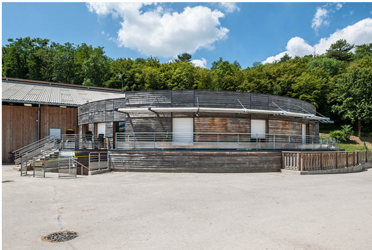
Centre équestre : rotonde du bâtiment d'accueil.

39, Lons-le-Saunier, 410 montée Gauthier Villars