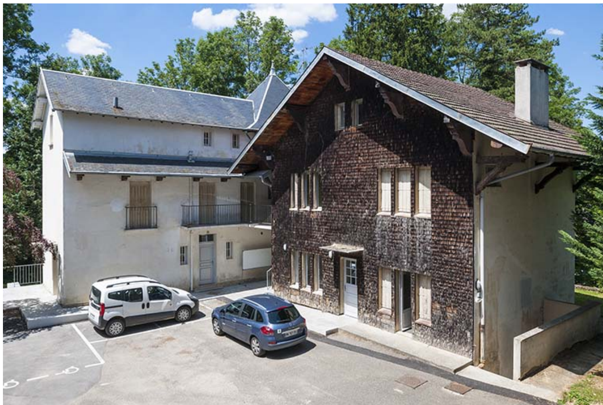
Chalet Colette : façade antérieure, logement. 39, Lons-le-Saunier, 410 montée Gauthier Villars