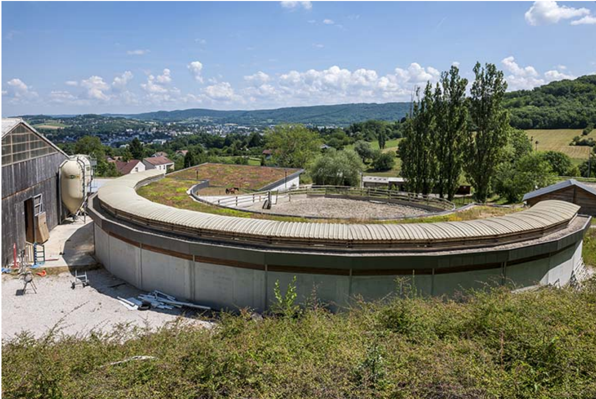
Centre équestre : boxes des jeunes chevaux et paddock, vue générale.

39, Lons-le-Saunier, 410 montée Gauthier Villars