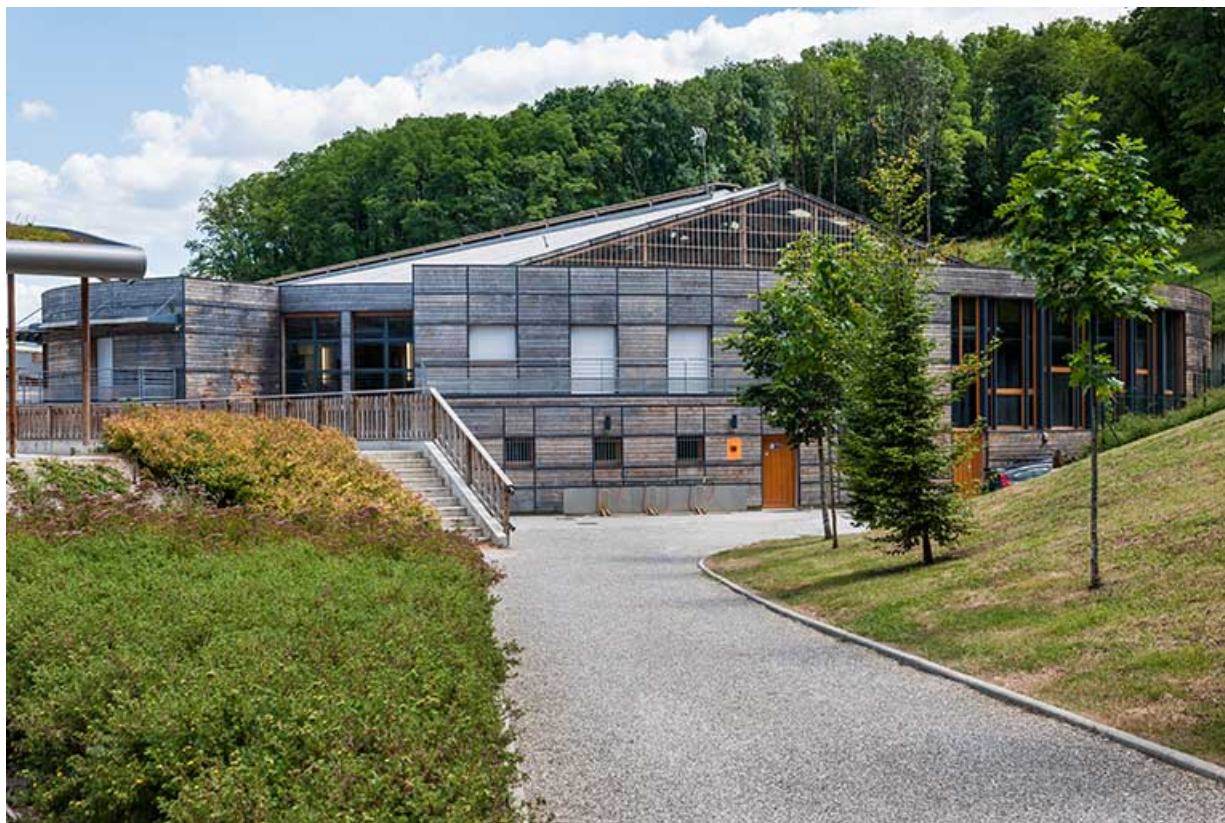
Centre équestre : manège, accès et bâtiment d'accueil.

39, Lons-le-Saunier, 410 montée Gauthier Villars