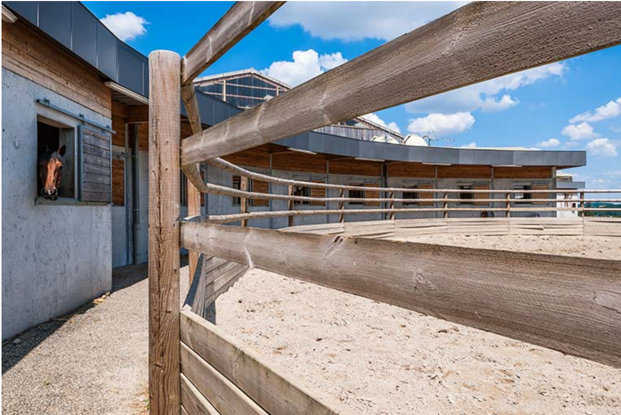
Centre équestre : boxes des jeunes chevaux. 39, Lons-le-Saunier, 410 montée Gauthier Villars