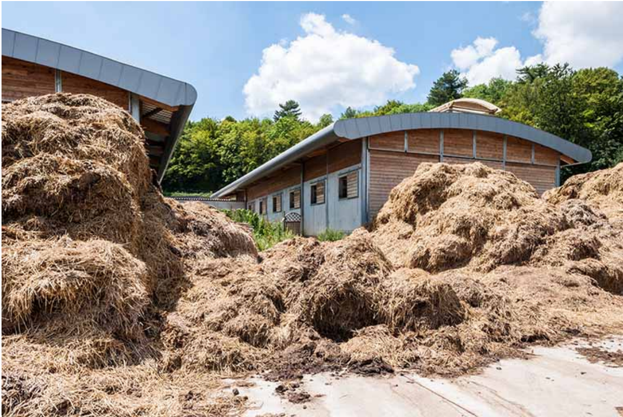
Centre équestre : fumière avec en arrière-plan les boxes d'enseignement.

39, Lons-le-Saunier, 410 montée Gauthier Villars