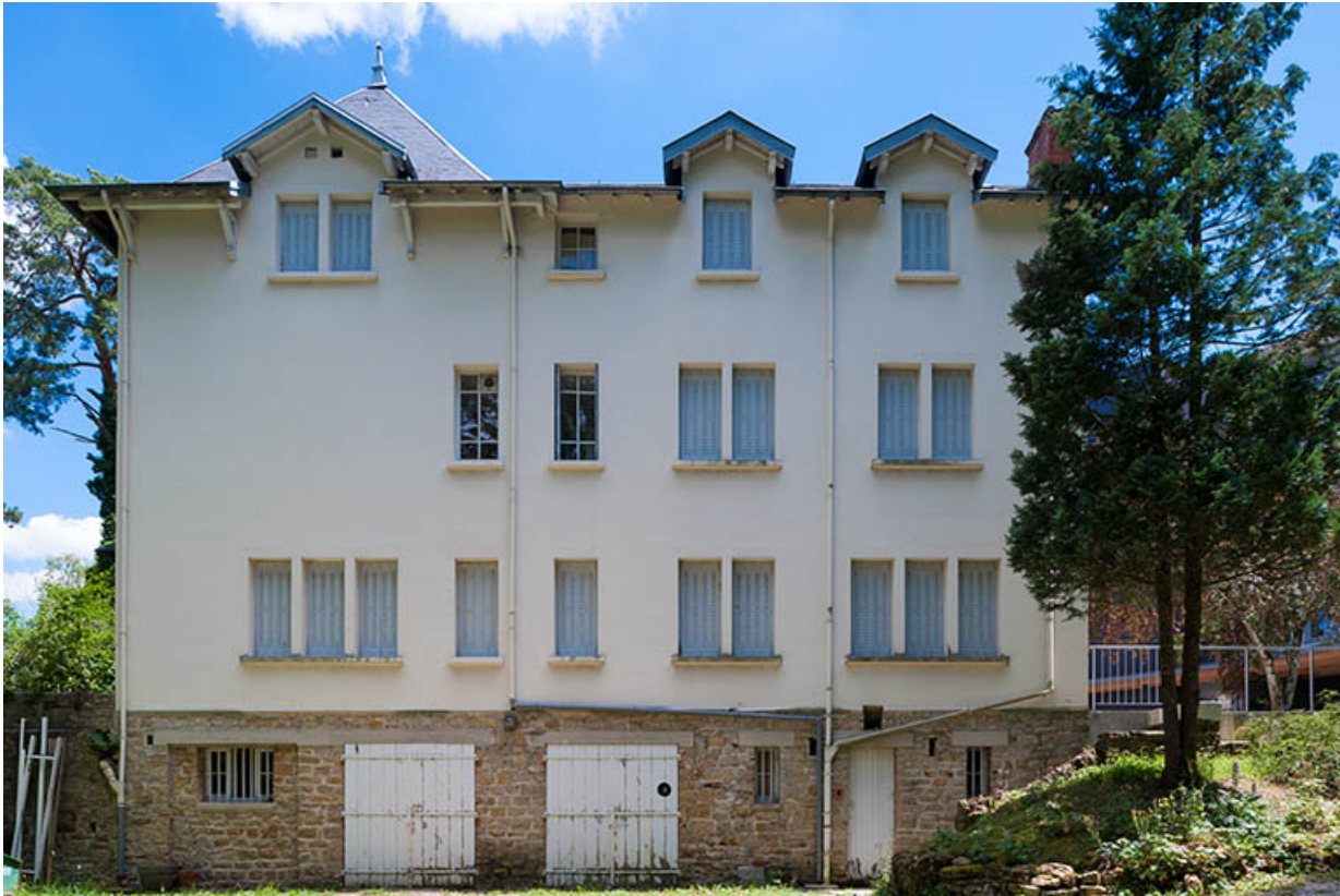
Chalet Colette : façade postérieure de l'aile ouest.

39, Lons-le-Saunier, 410 montée Gauthier Villars