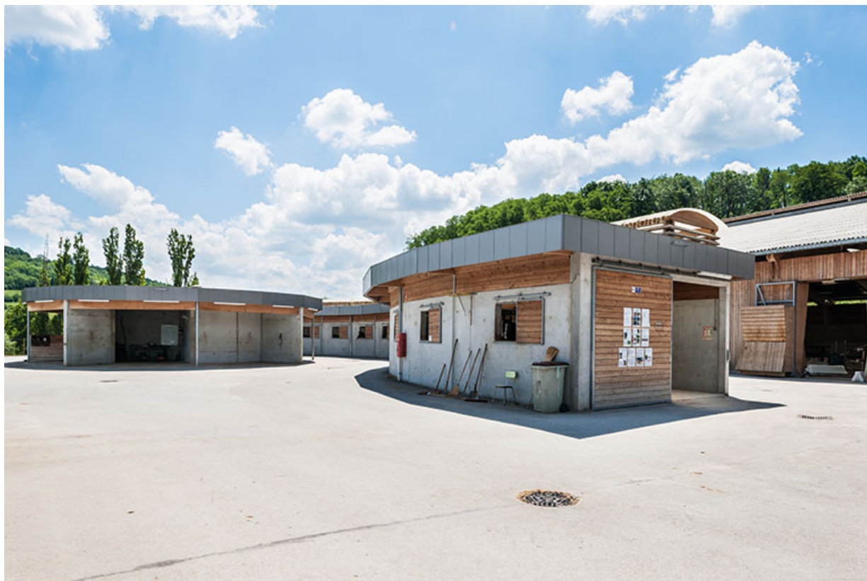
Centre équestre : boîtes des propriétaires de chevaux au 1er plan et cercle équin en arrière-plan. 39, Lons-le-Saunier, 410 montée Gauthier Villars