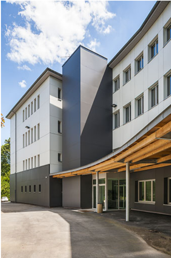
Externat, façade postérieure : détail.

39, Lons-le-Saunier, 410 montée Gauthier Villars