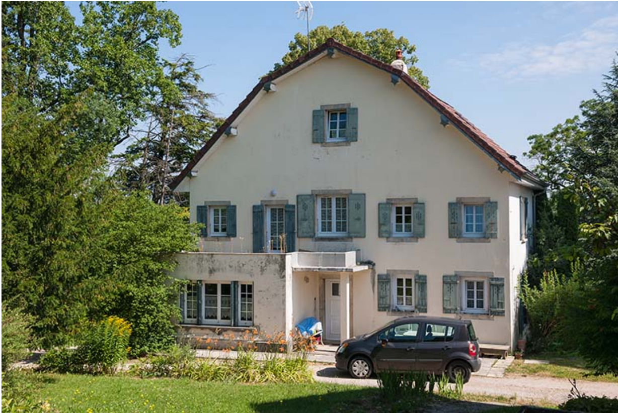
Pavillon du proviseur : façade postérieure.

39, Lons-le-Saunier, 410 montée Gauthier Villars