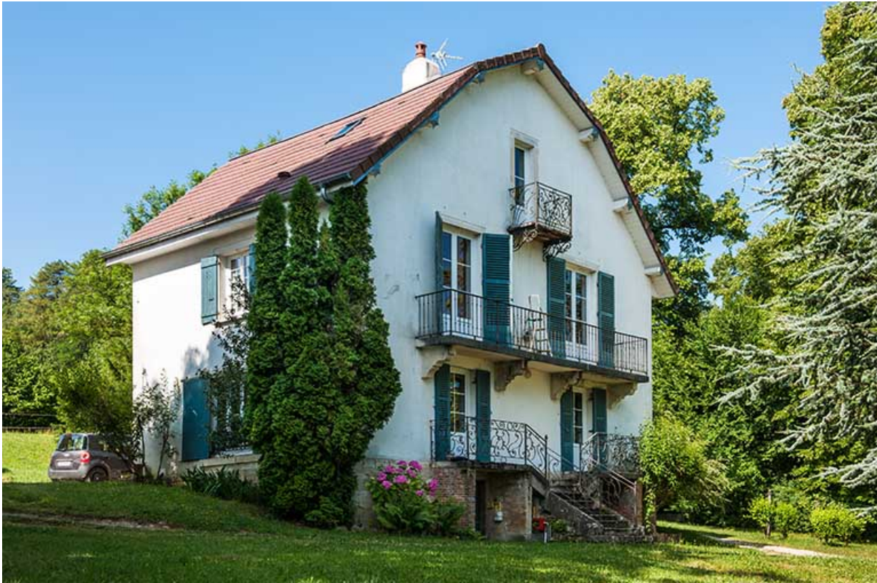
Pavillon du proviseur, vue trois quart.

39, Lons-le-Saunier, 410 montée Gauthier Villars