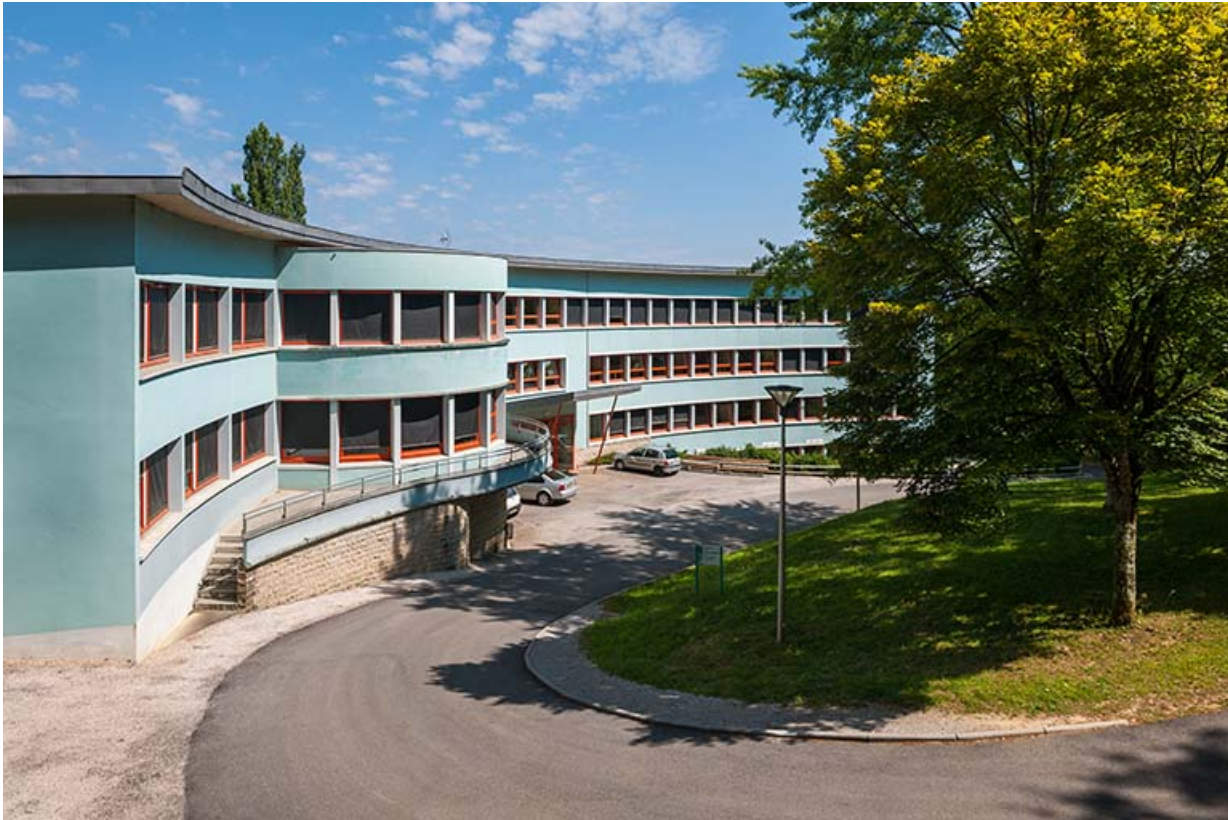
Internat : vue sud.

39, Lons-le-Saunier, 410 montée Gauthier Villars