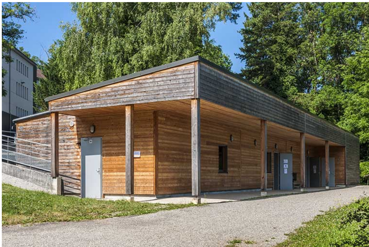
Externat : façade antérieure du préfabriqué rénové.

39, Lons-le-Saunier, 410 montée Gauthier Villars