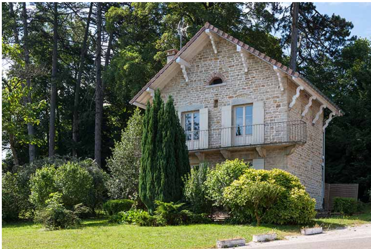
Villa les Perrières : façade antérieure, logement.

39, Lons-le-Saunier, 410 montée Gauthier Villars