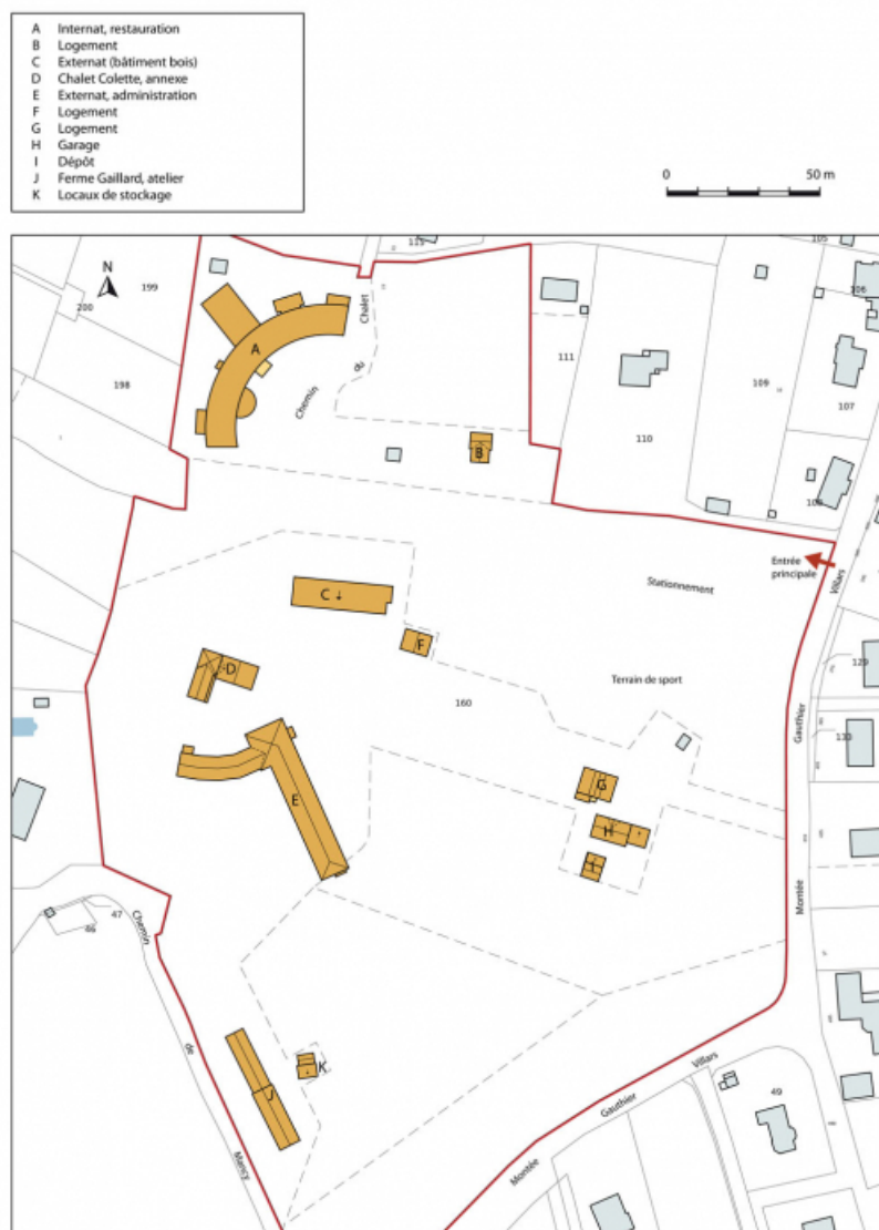
Plan-masse et situation. Extrait du plan cadastral, 2011, section BD, échelle 1/1 500. 39, Lons-le-Saunier, 410 montée Gauthier Villars