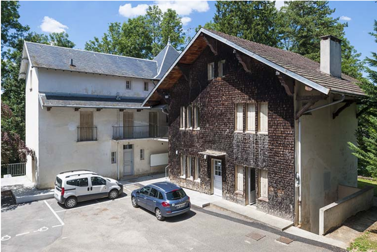
Chalet Colette : façade antérieure, logement. 39, Lons-le-Saunier, 410 montée Gauthier Villars