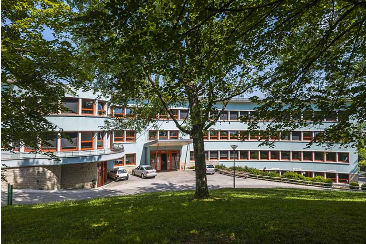
Internat : façade antérieure.

39, Lons-le-Saunier, 410 montée Gauthier Villars