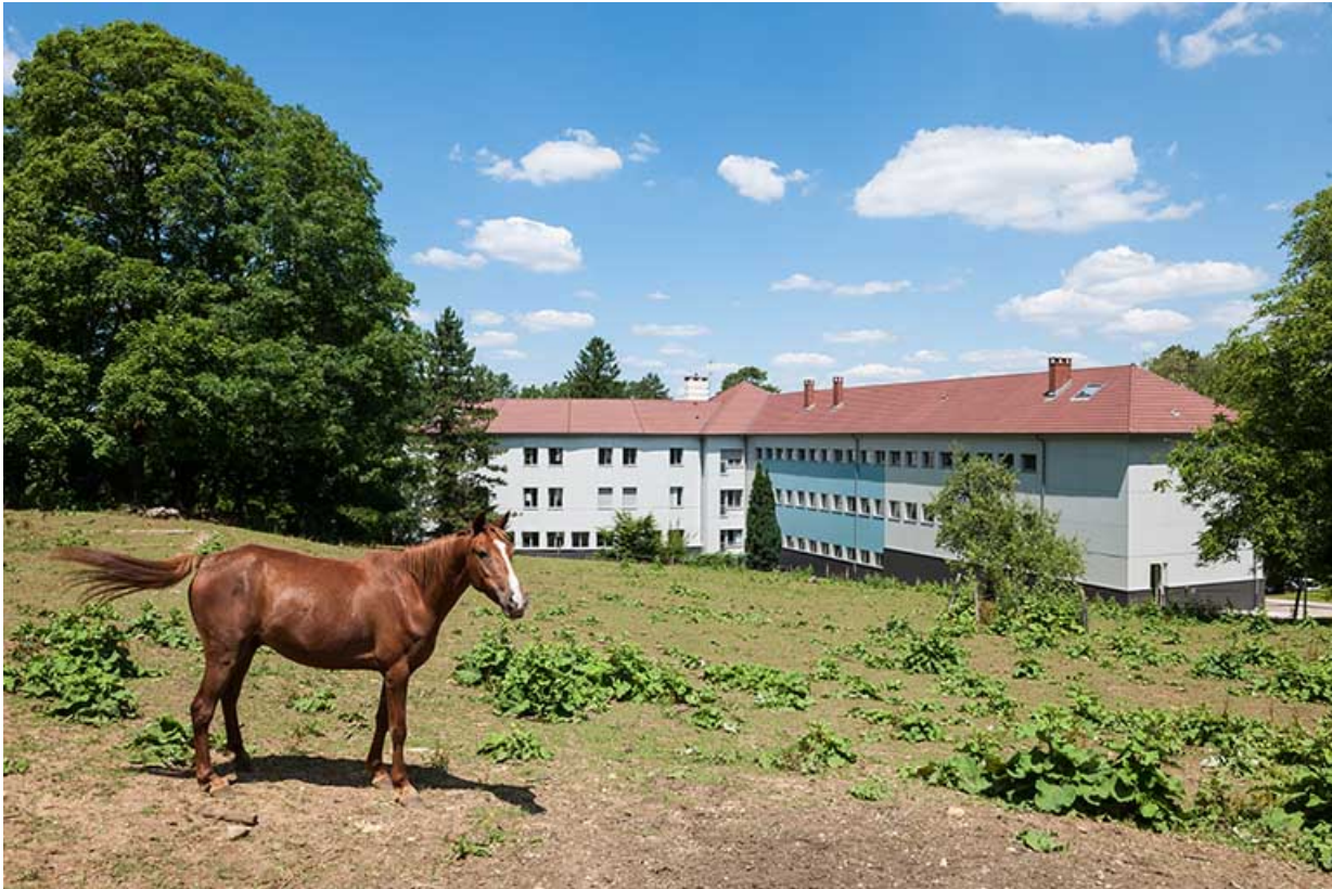
Externat : façade postérieure.

39, Lons-le-Saunier, 410 montée Gauthier Villars