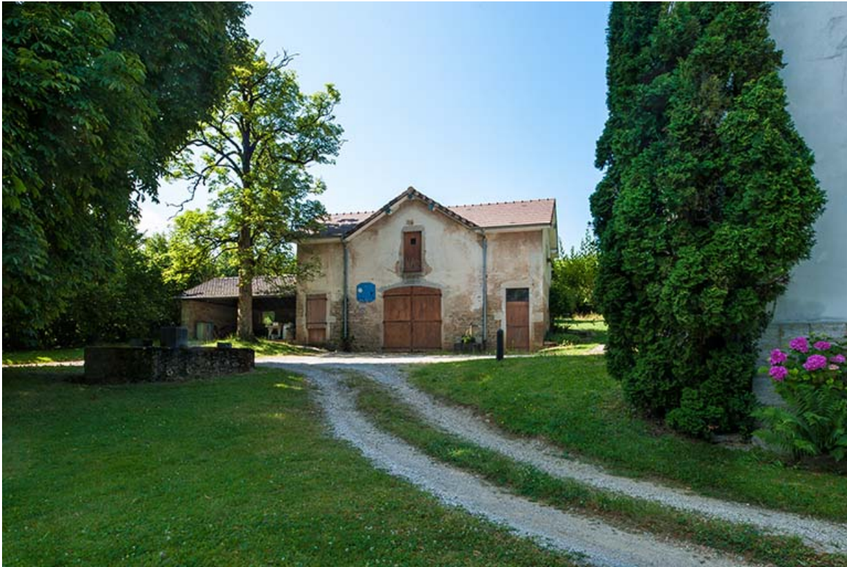
Annexe servant de garage : vue générale.

39, Lons-le-Saunier, 410 montée Gauthier Villars