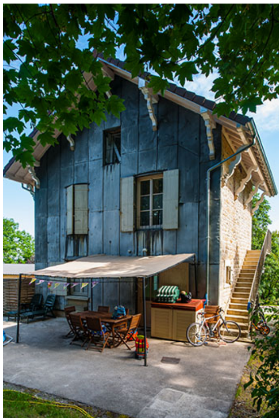
Villa Les Perrières : façade postérieure, logement.

39, Lons-le-Saunier, 410 montée Gauthier Villars