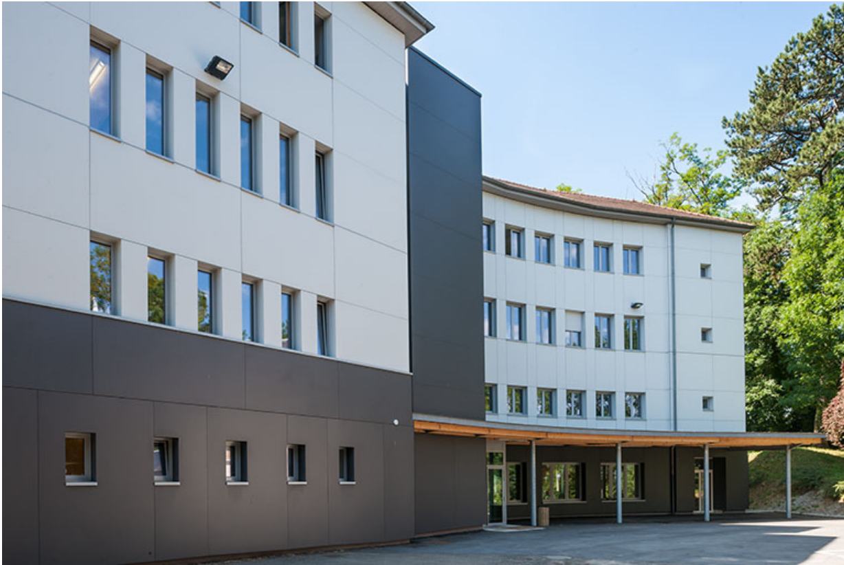
Externat : aile ouest , façade antérieure.

39, Lons-le-Saunier, 410 montée Gauthier Villars