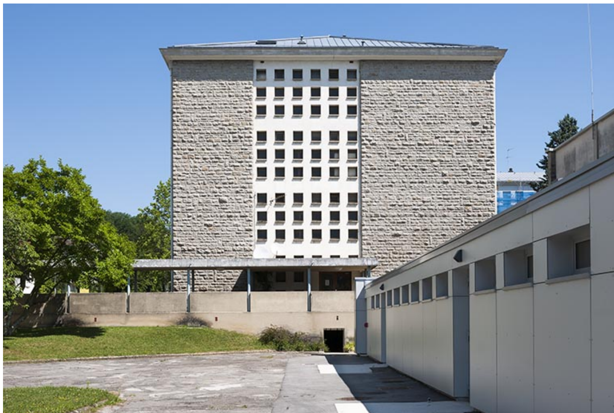
Pignon du bâtiment principal et gymnase.

39, Lons-le-Saunier, 400 rue du Docteur Jean Michel