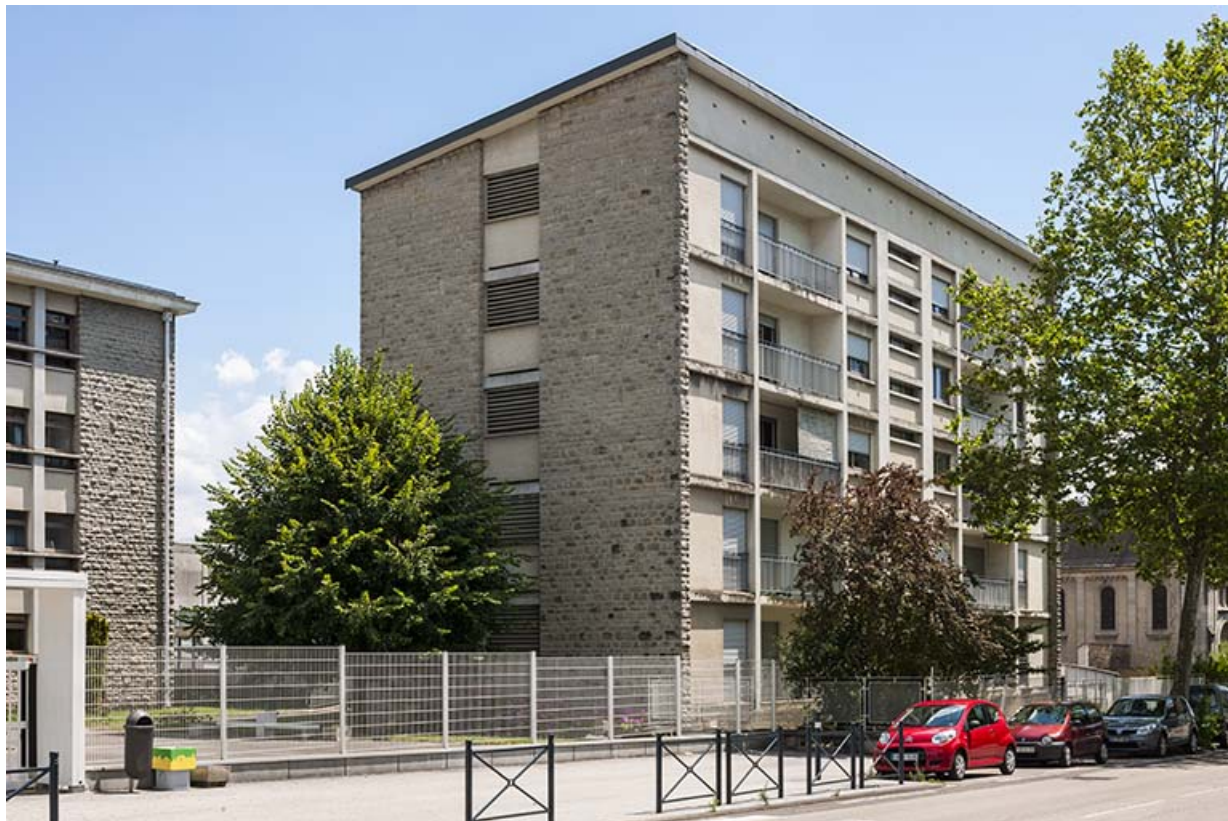
Bâtiment administration-logements, vue de trois quart depuis la rue Michel sur façade antérieure.

39, Lons-le-Saunier, 400 rue du Docteur Jean Michel