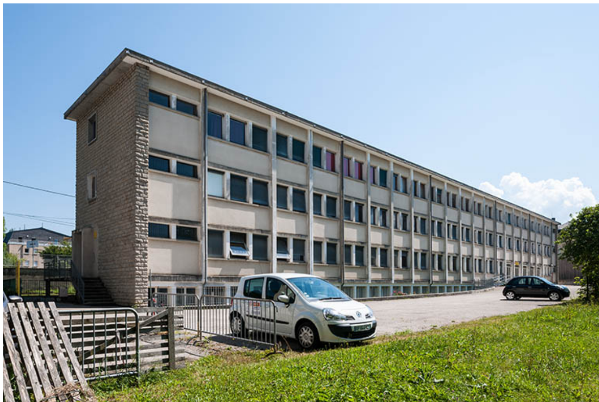
Façade postérieure de l'externat, ancien GRETA 39, Lons-le-Saunier, 400 rue du Docteur Jean Michel