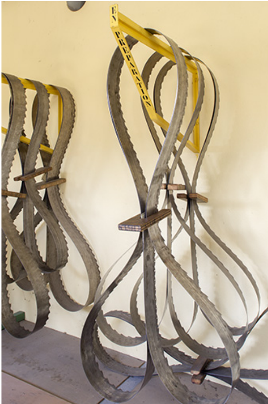
Scierie : lames de scie, détail.