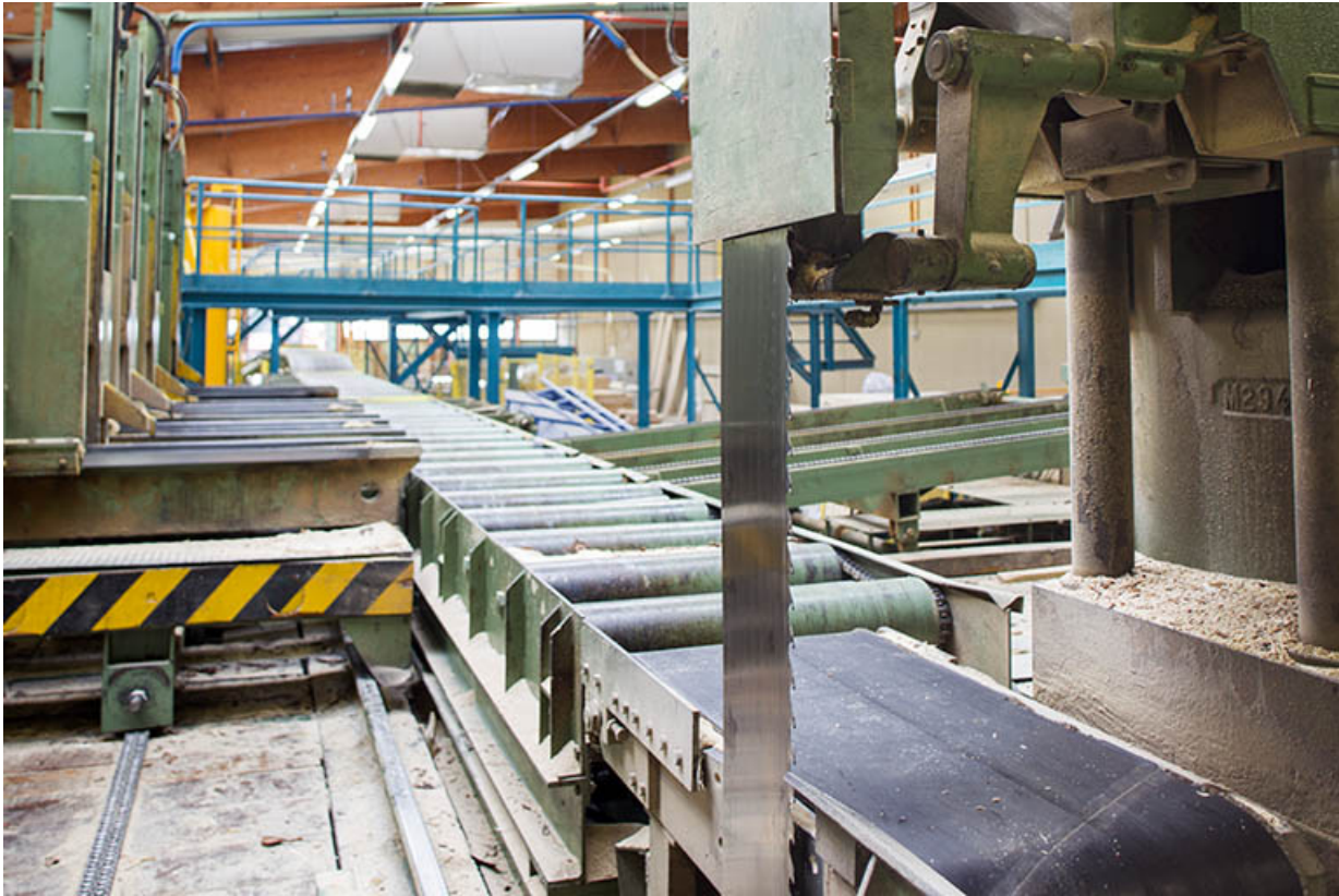
Scierie : tapis pour débiter les grumes en planches.