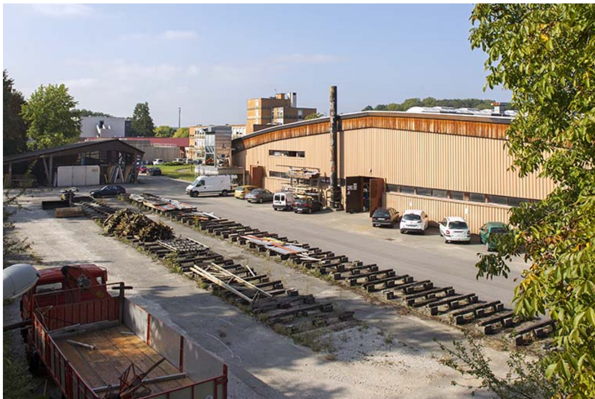
Atelier, vue postérieure et chantier de grumes