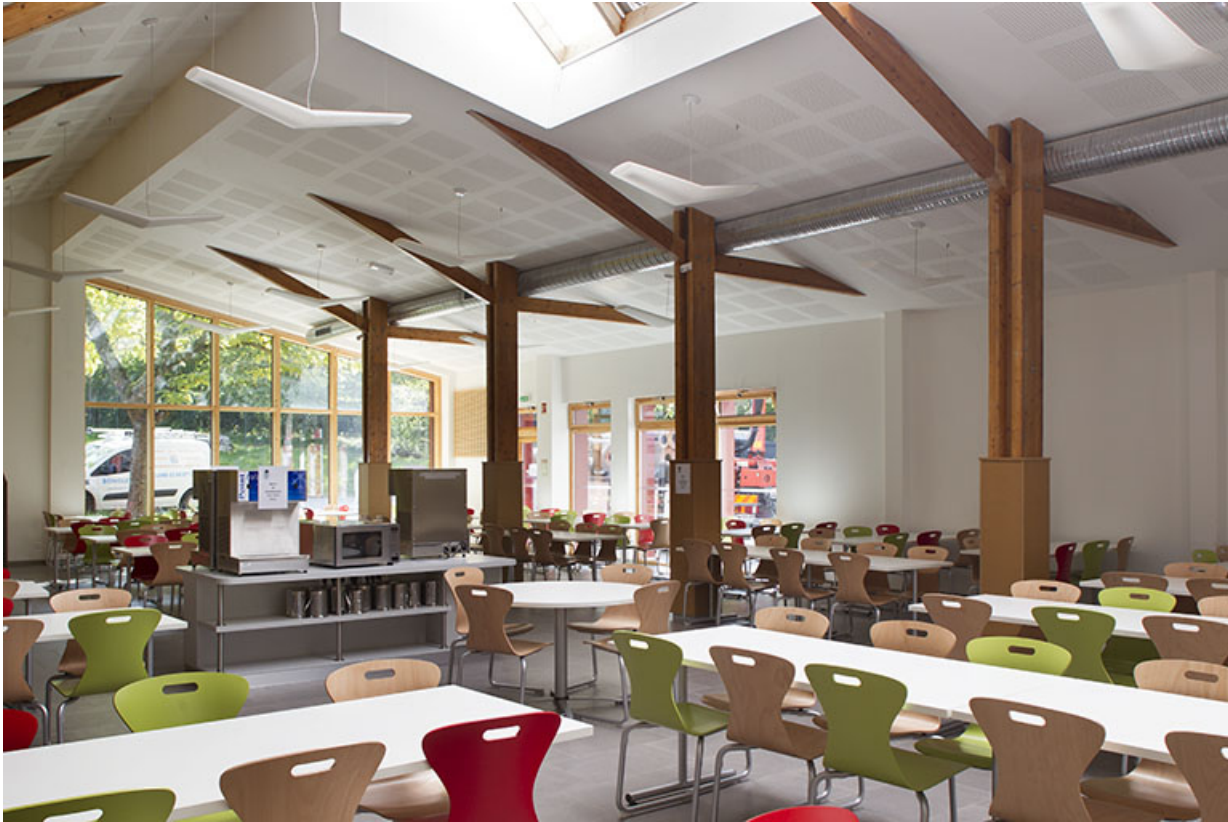
Restauration : détail des structures porteuses et plafonds.