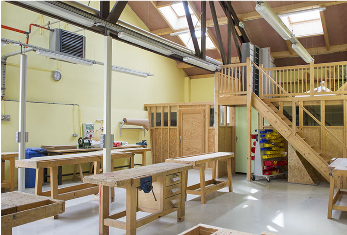
Atelier menuiserie : établis.