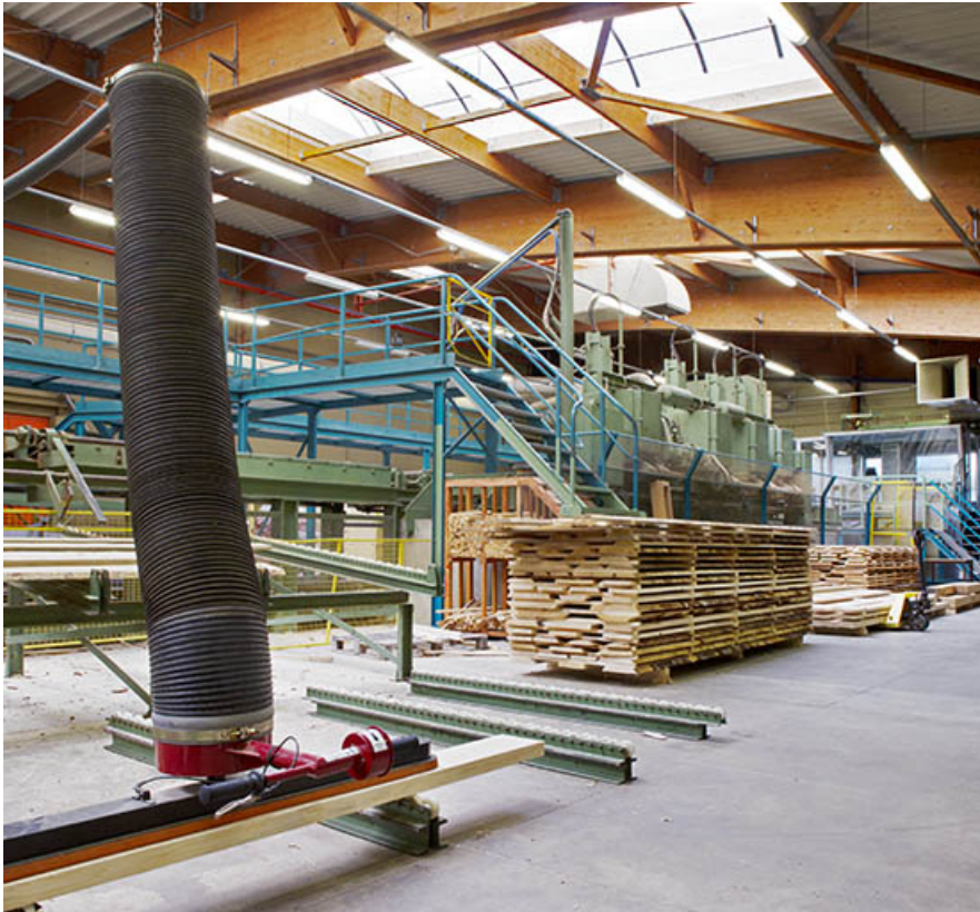
Scierie : fabrication des planches.