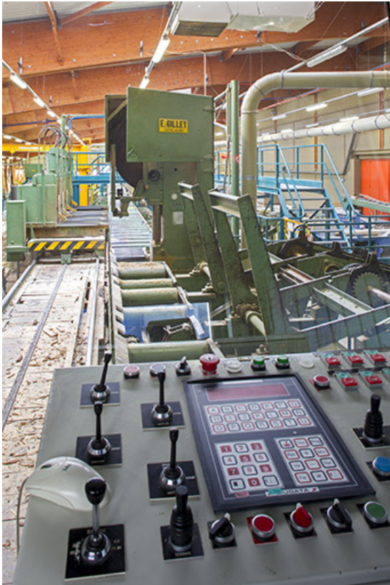
scierie : machine à commande numérique pour déitage 39, Mouchard, 67 rue de Strasbourg