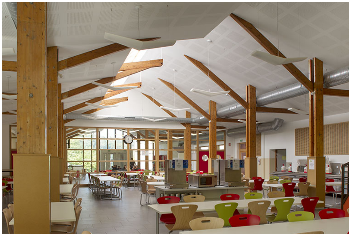
Restauration : vue de la salle à manger.