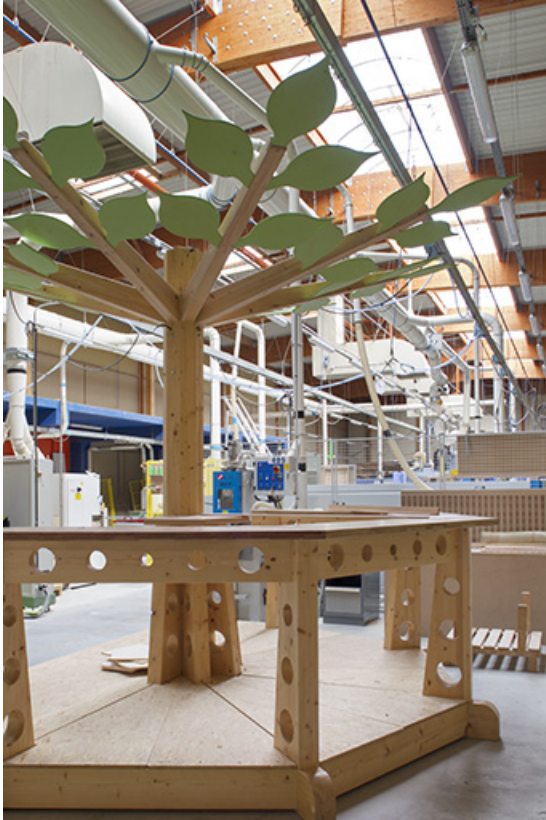
Atelier : réalisation d'élèves pour mobilier de stand. 39, Mouchard, 67 rue de Strasbourg