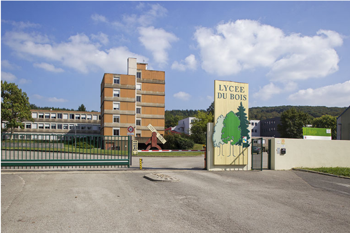
Entrée du lycée, rue de Strasbourg.