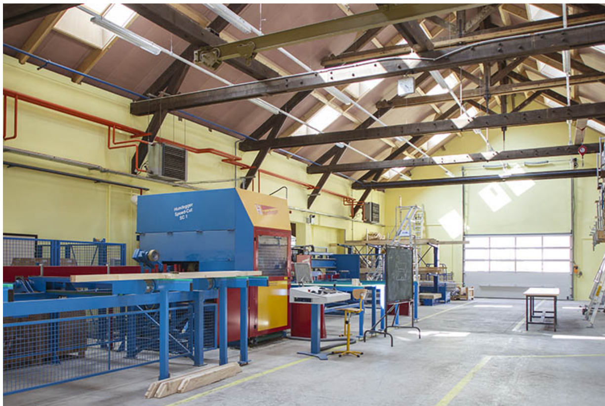
Atelier menuiserie : machines à commande numérique.