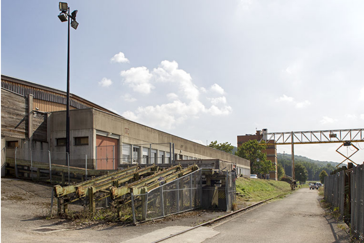
Atelier : façades ouest.