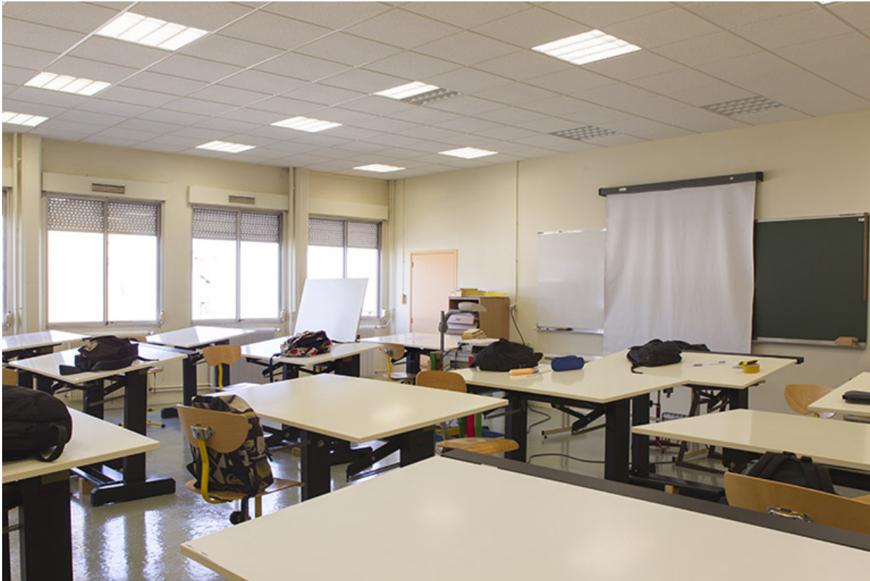
Atelier : salle de cours, intérieur.