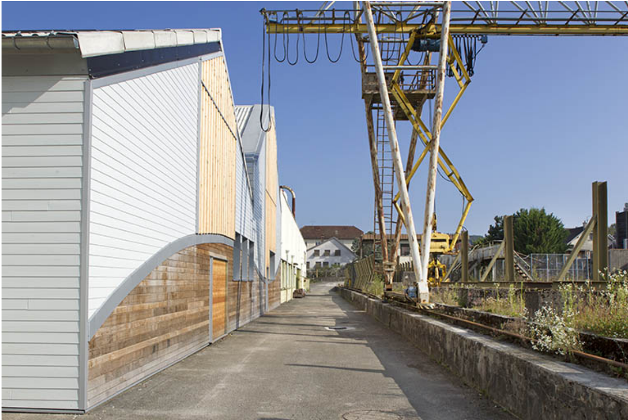
Atelier : façade antérieure et détail pont roulant.