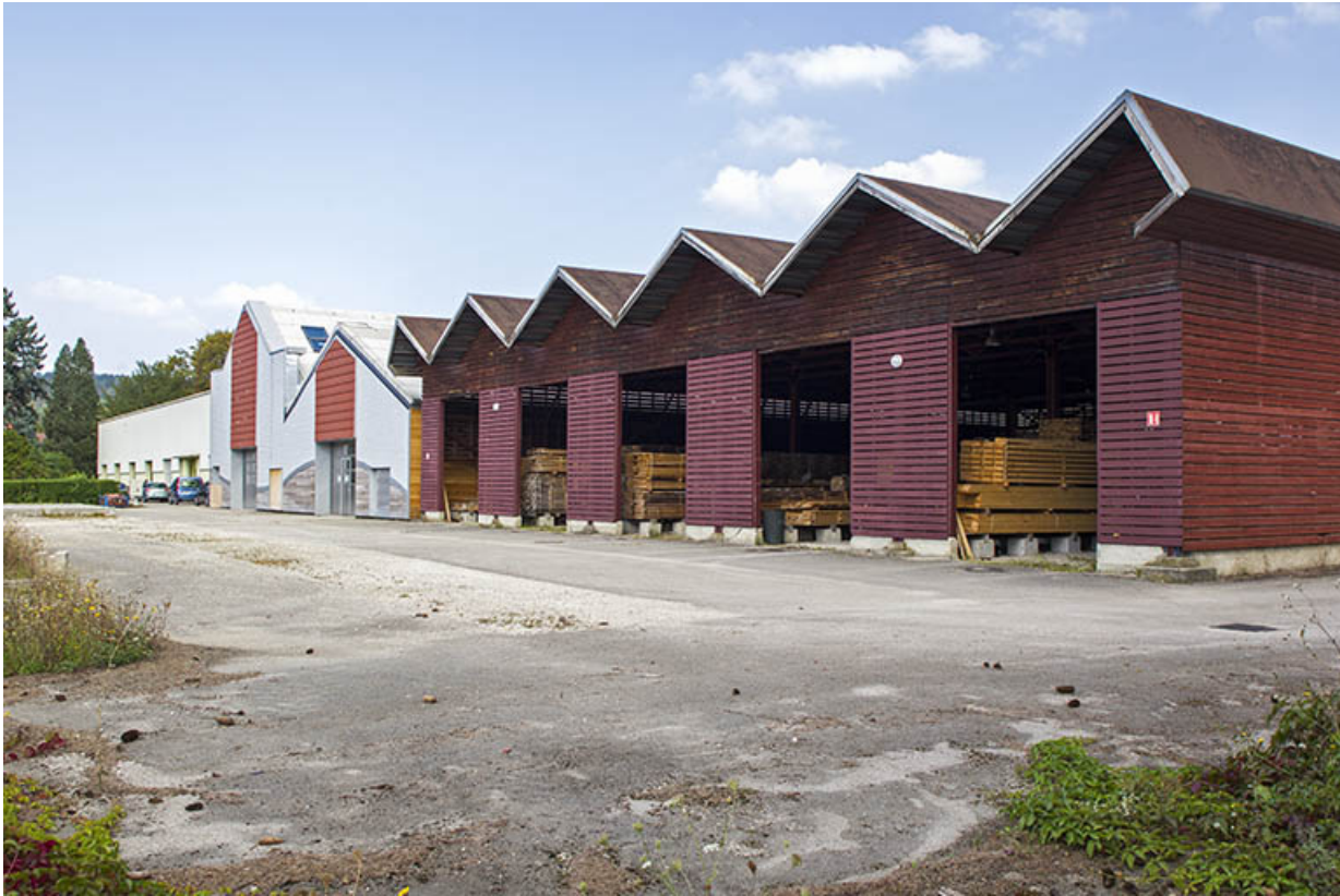
Bâtiment de stockage du bois et atelier : façades postérieures.