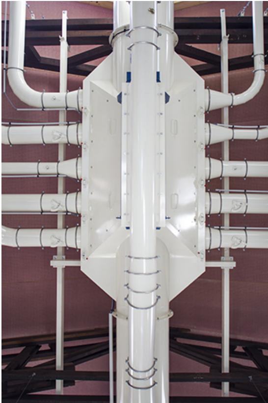
Atelier menuiserie : système d'aspiration.