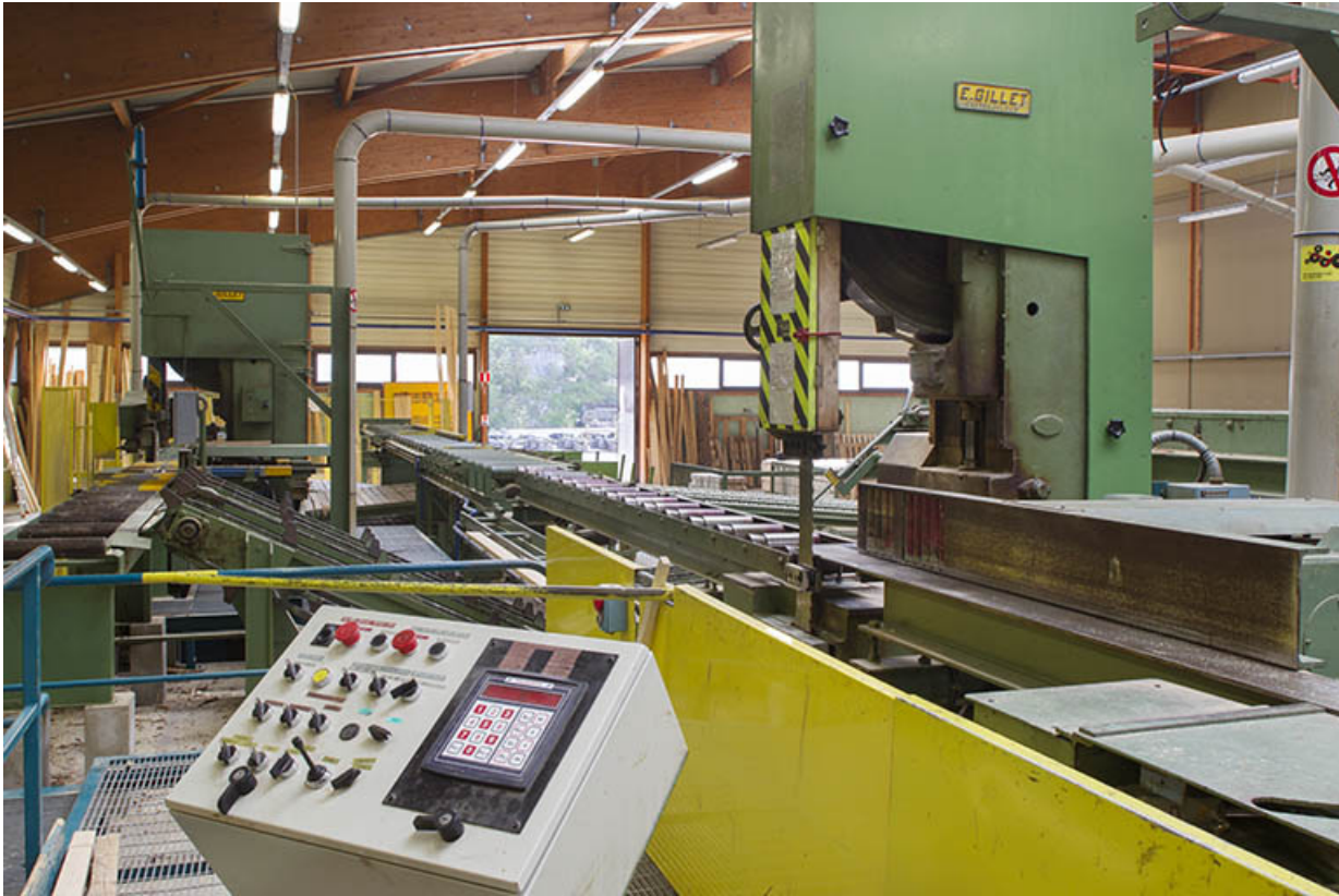
Scierie : poste de commande automatisé.