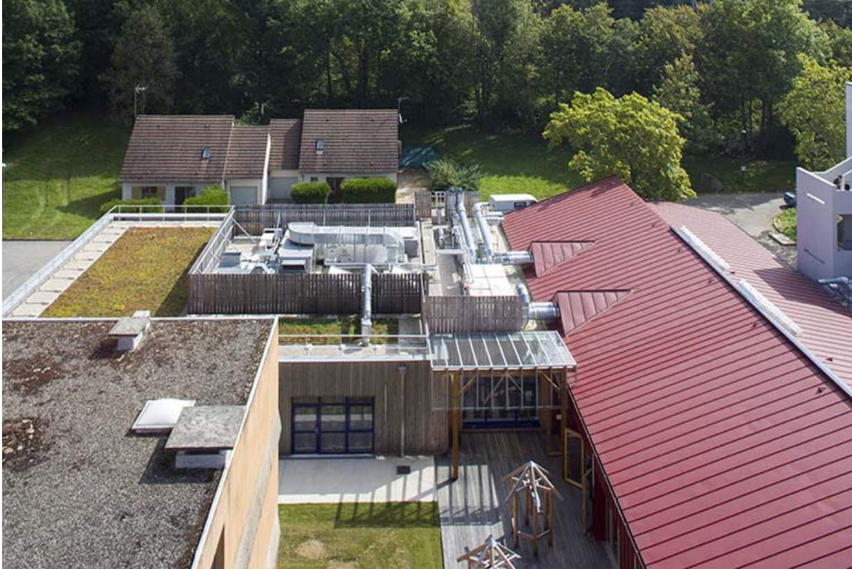
Restauration : vue sur la cour intérieure, au fond pavillons pour logements.