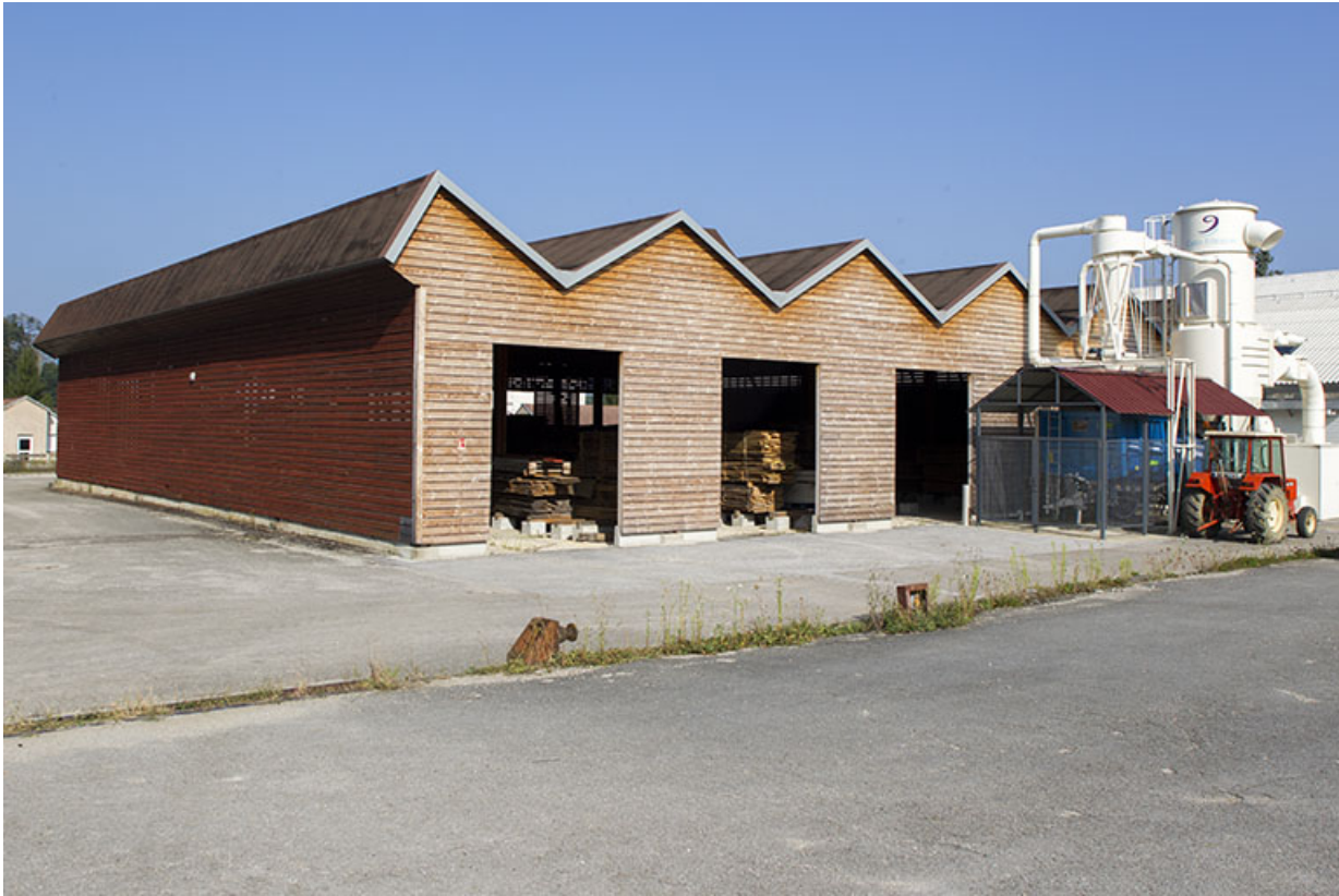
Bâtiment de stockage du bois et atelier, façades antérieures.