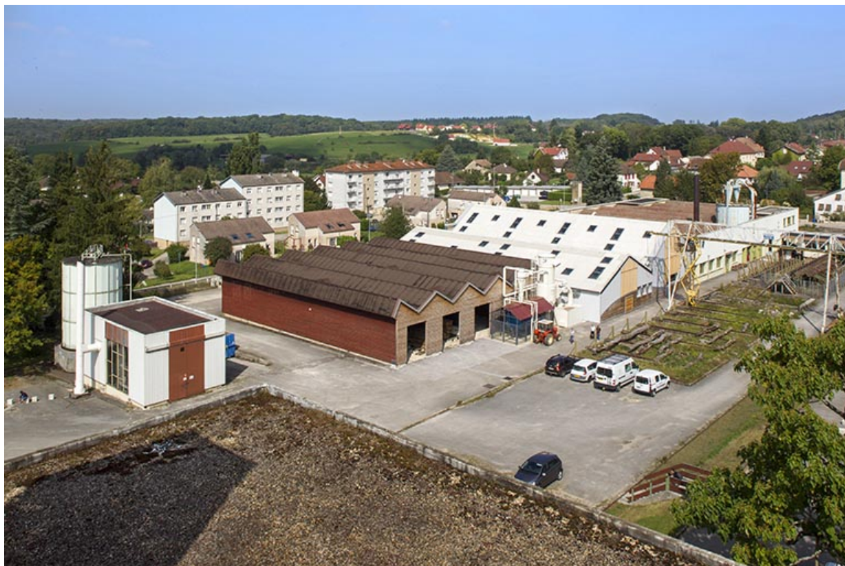
Chantier de grumes at ateliers : vue générale.