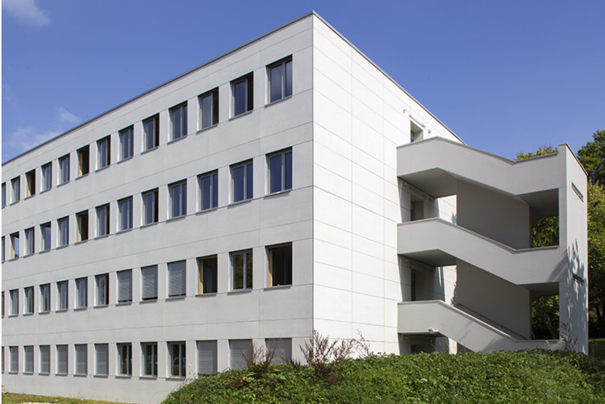
Internat : détail des parements de façade.