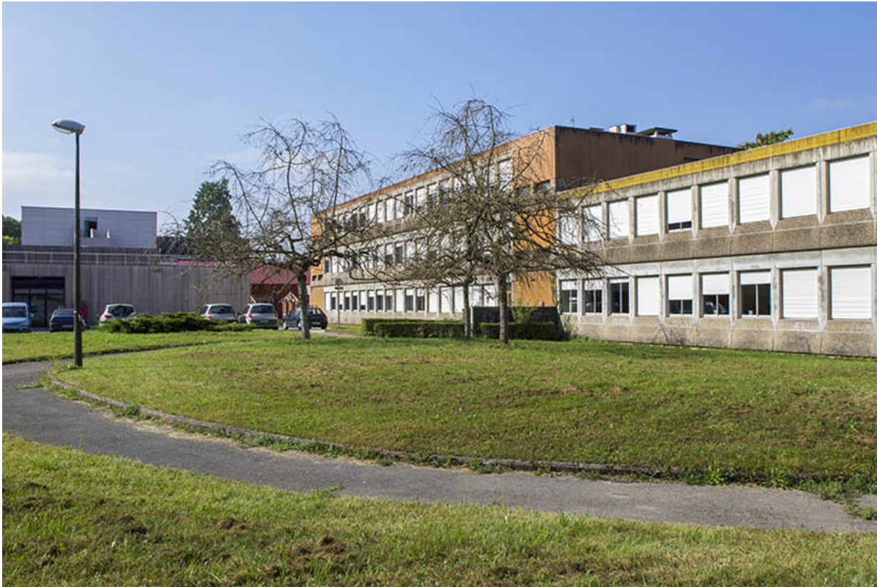
Internat : façade postérieure.