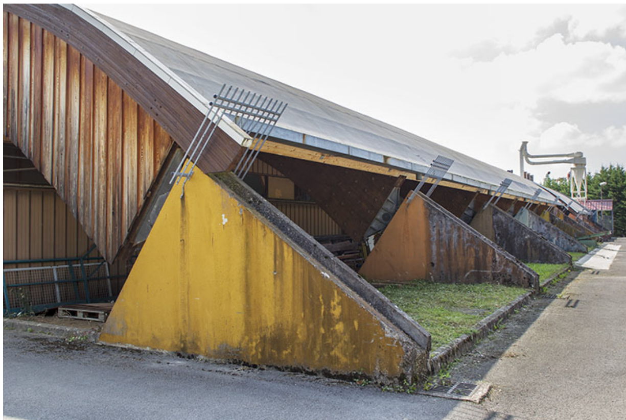
Atelier : couverture et charpente, détail de la culée.