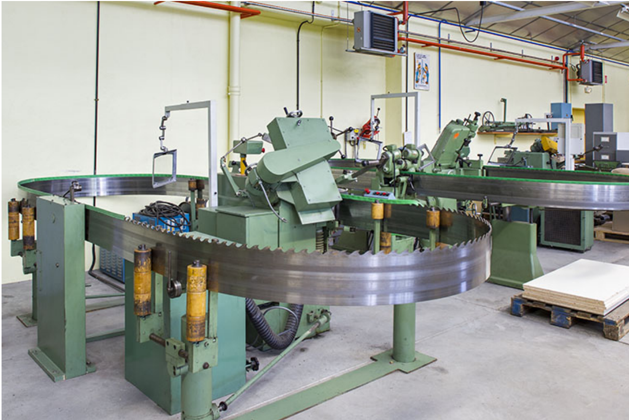
Scierie : détail des machines à affûter les lames de scie.