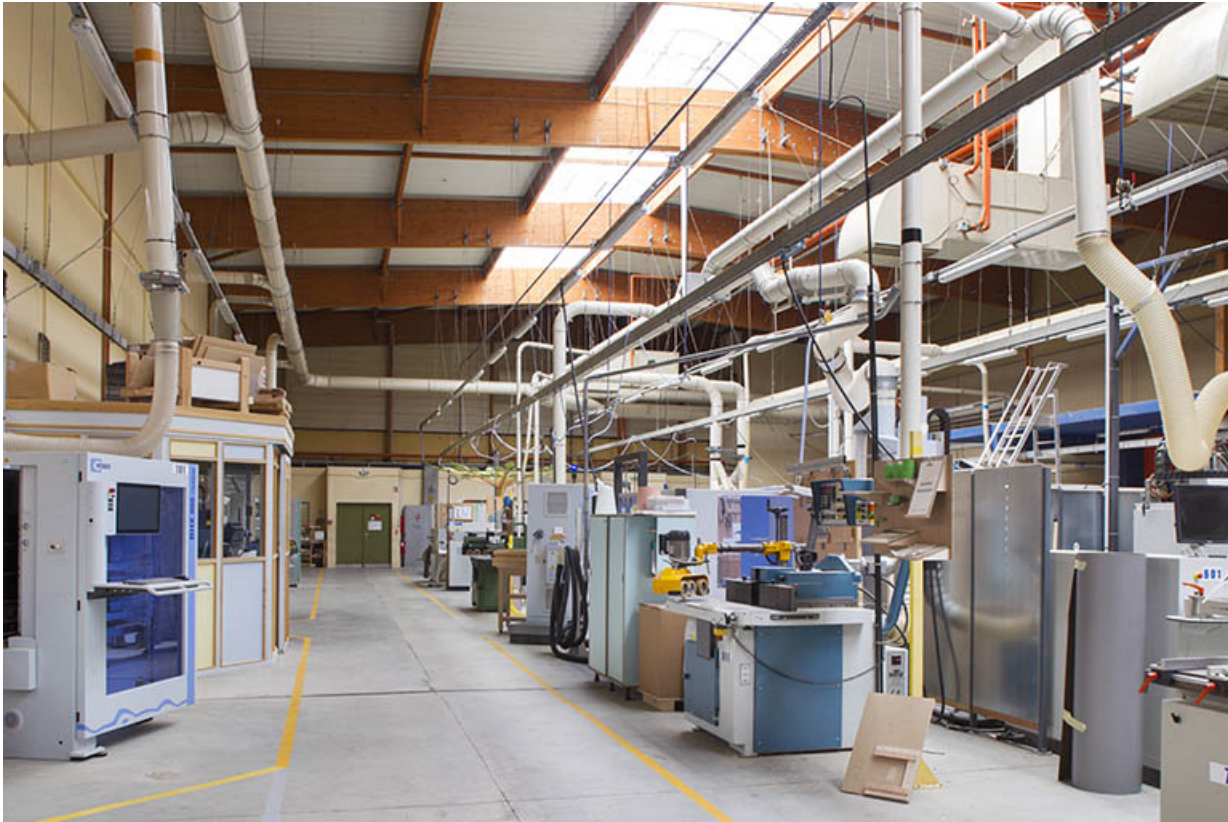
Atelier construction : postes de travail.