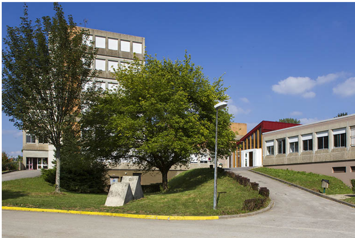
Administration et internat : façades ouest, au premier plan la sculpture de Jean Gilles (1% artistique)