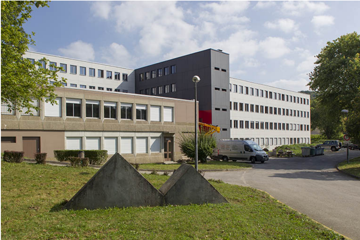
Internat : façades Ouest.