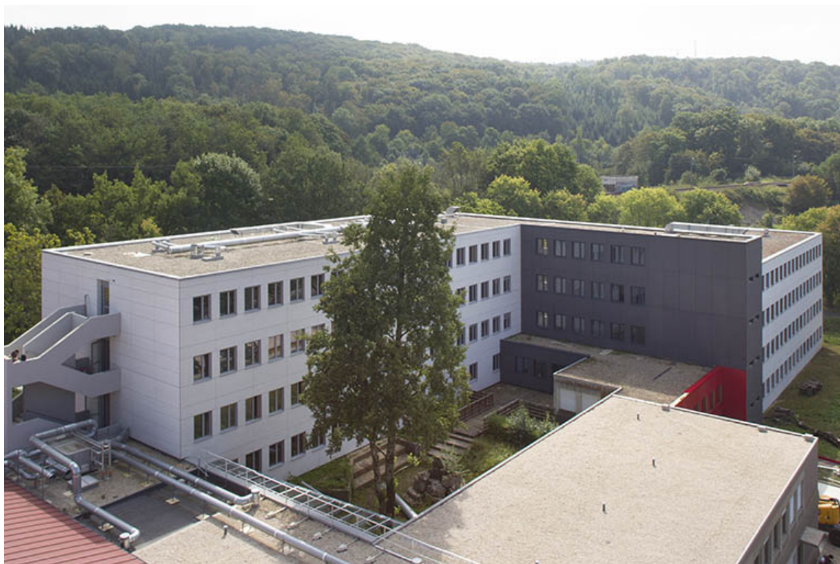
Internat : vue générale après restauration des façades.