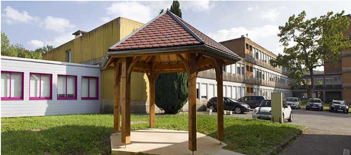
Externat : cour ouest.