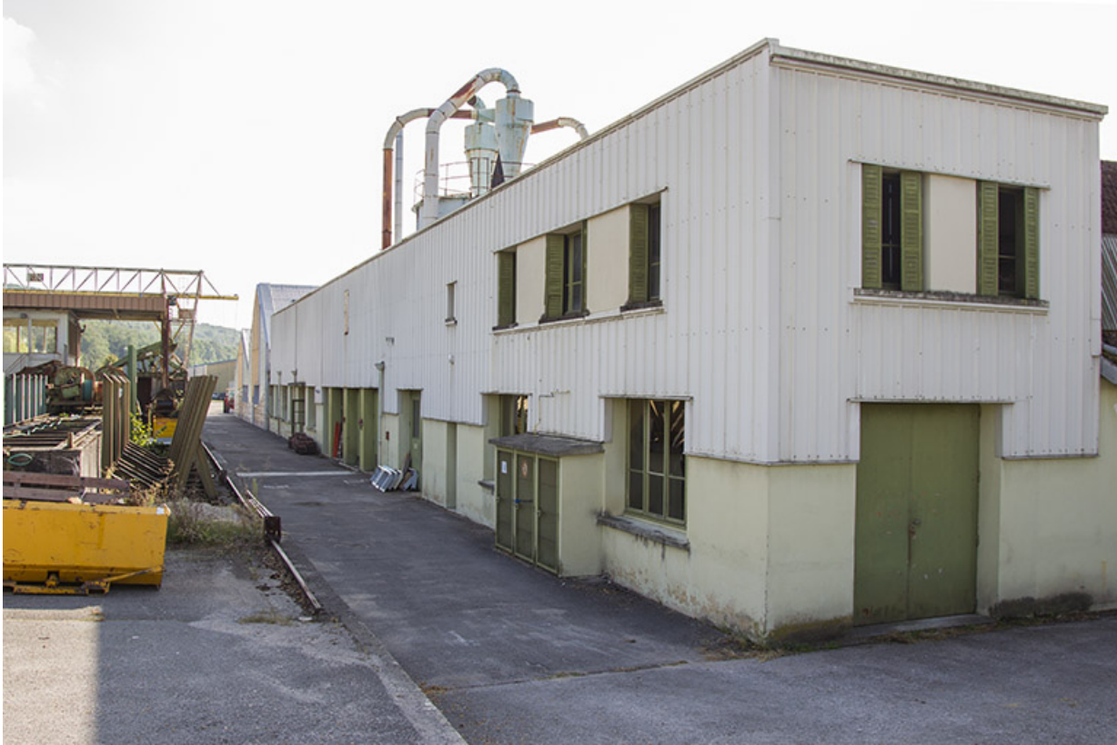
Atelier construction : façade antérieure et pignon nord.