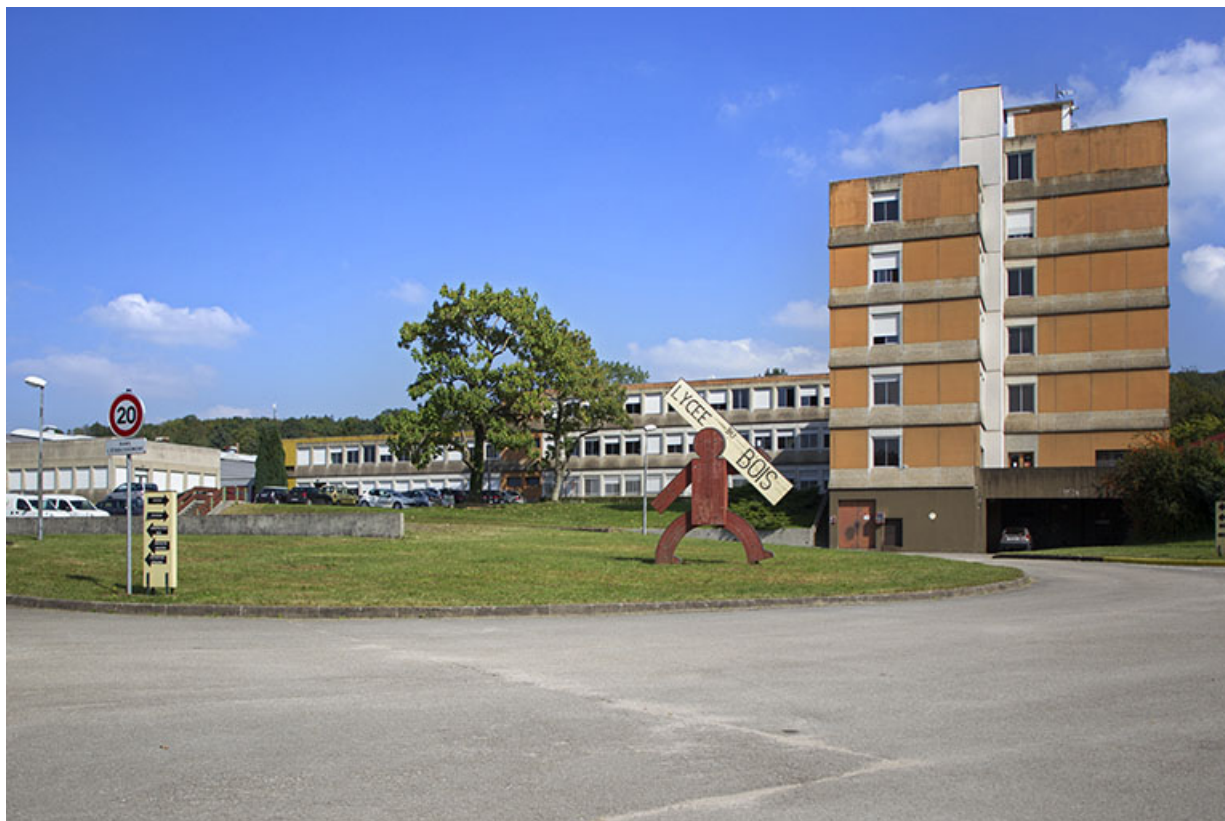
Vue générale avec au premier plan, le bâtiment de l'administration.