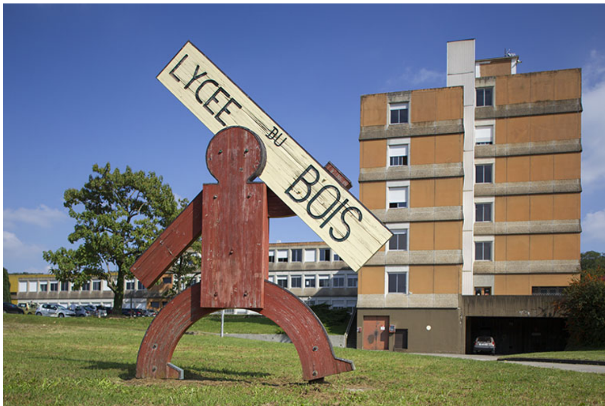
Administration : pignon ouest. Au pied, réalisation signalétique par les élèves. 39, Mouchard, 67 rue de Strasbourg