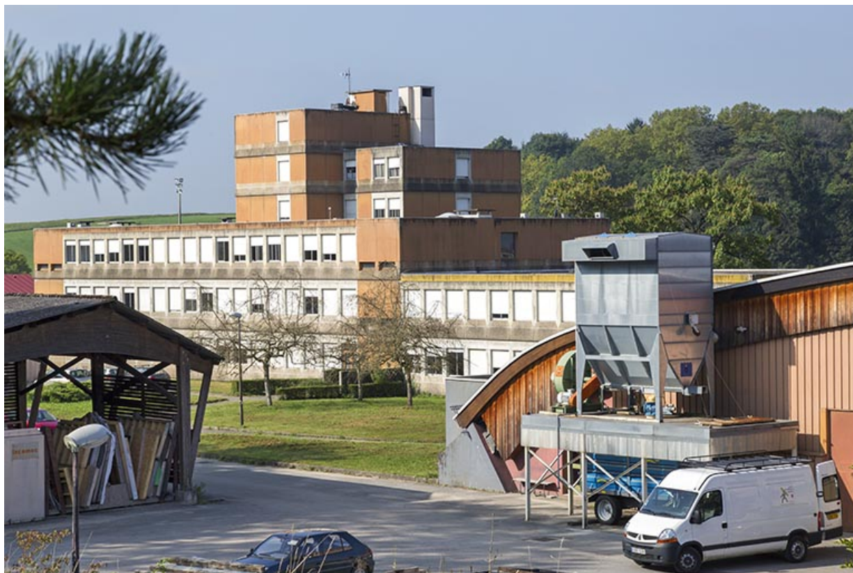
Externat : vue générale.