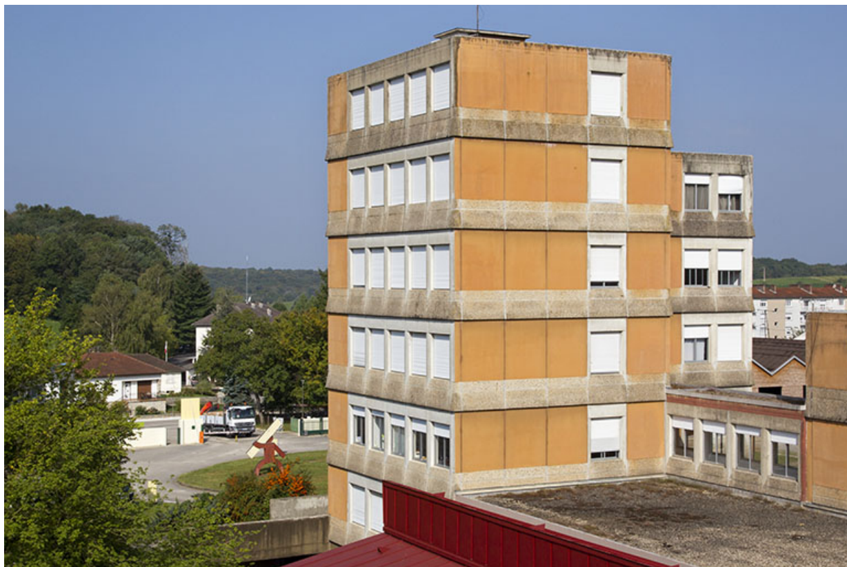
Administration et logements : façades Sud et Est.