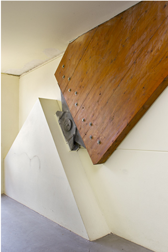
Atelier : détail de la culée de charpente, intérieur.