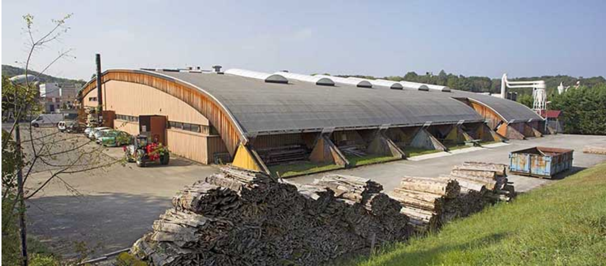
Atelier : couverture avec charpente en lamellé collé.