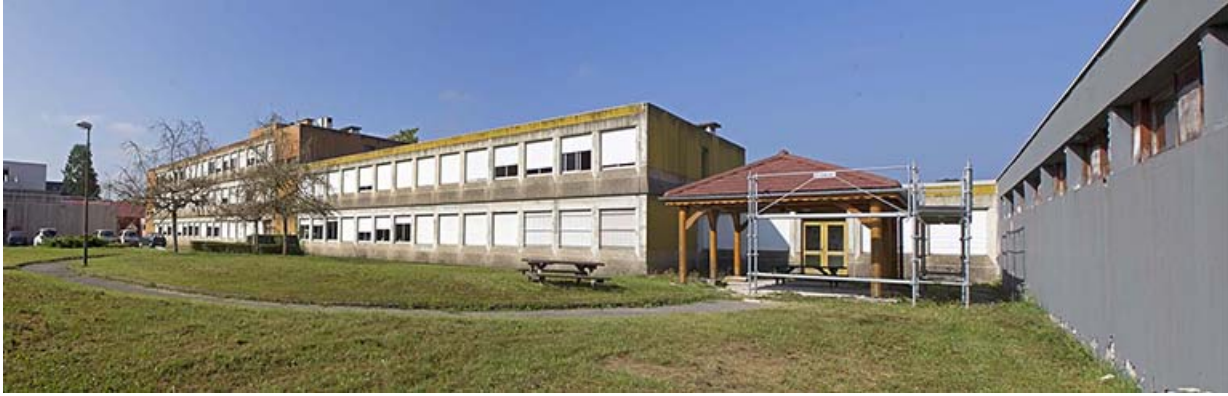
Externat : façade postérieure.