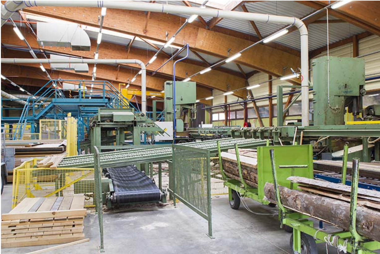
Scierie : vue intérieure.