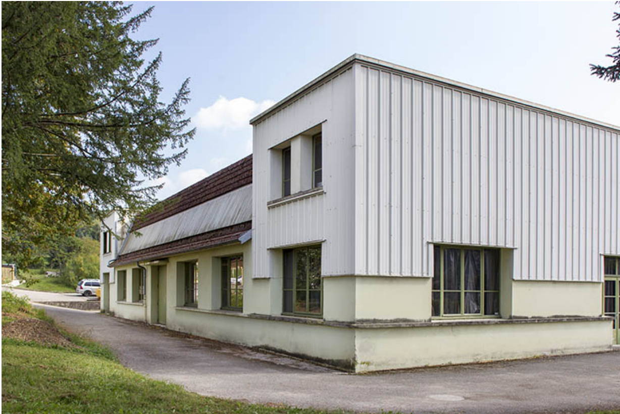
Atelier construction : façade postérieure.