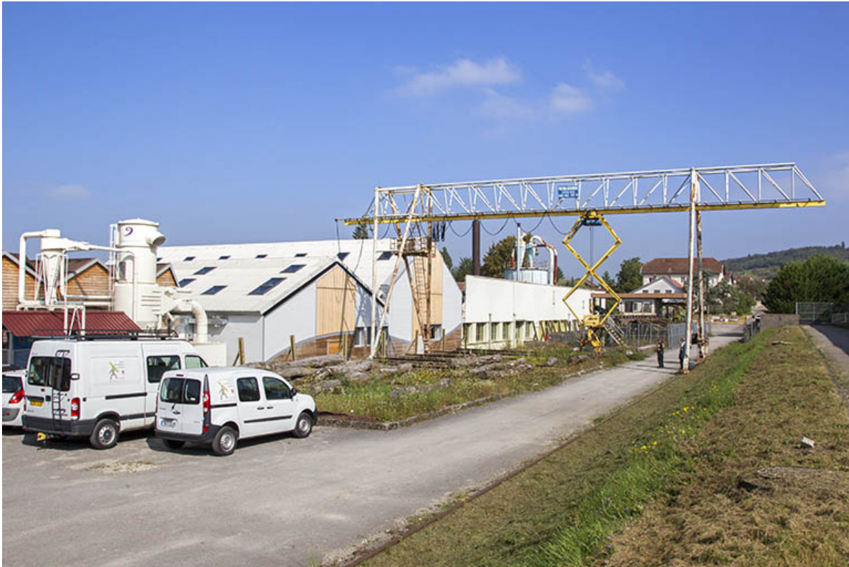
Chantier de grumes avec pont roulant.