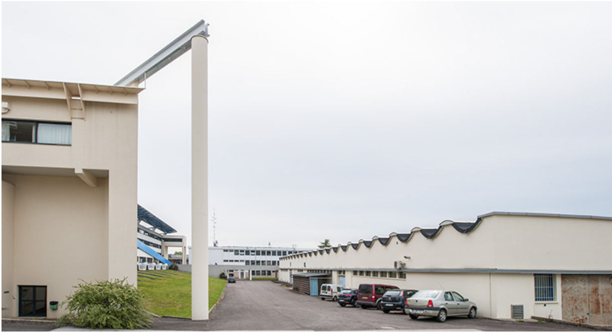
Ateliers : façade antérieure.