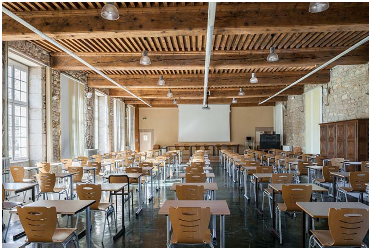
Internat, salle d'étude du 1er étage.