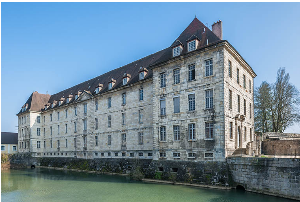
Ancien hôpital de la Charité, façade antérieure.