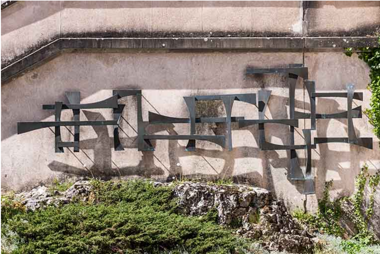
Détail de l'idéogramme.