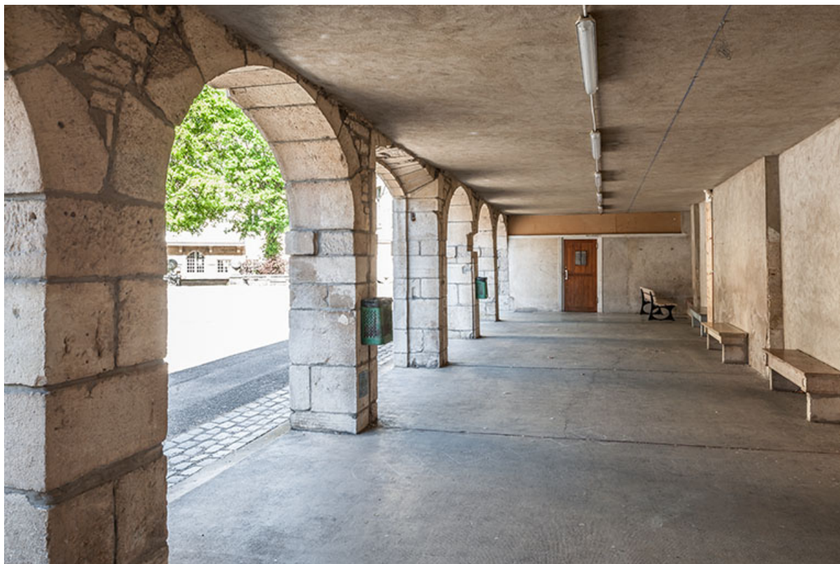
Cloître de l'ancien couvent, cour externat.