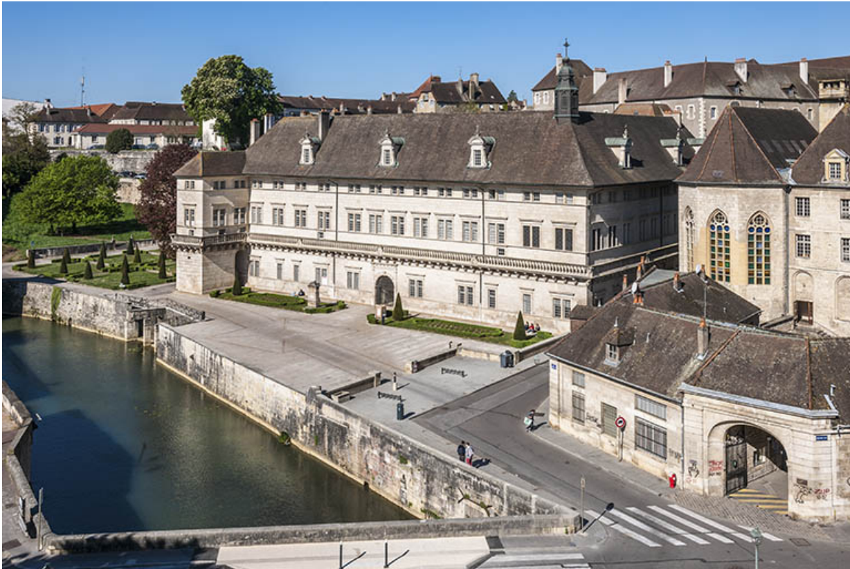
Vue du site externat depuis la rue Bauzonnet.