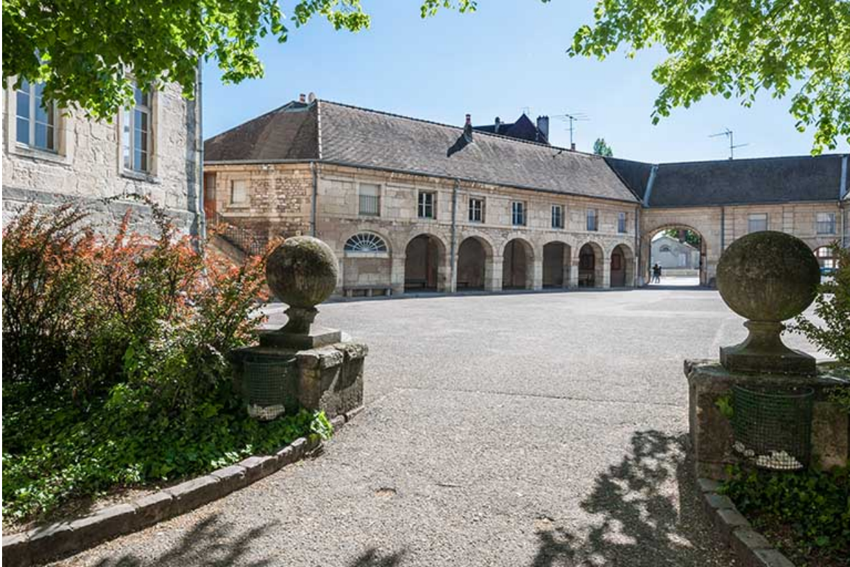
Vue générale de la cour d'externat avec entrée principale en arrière-plan.