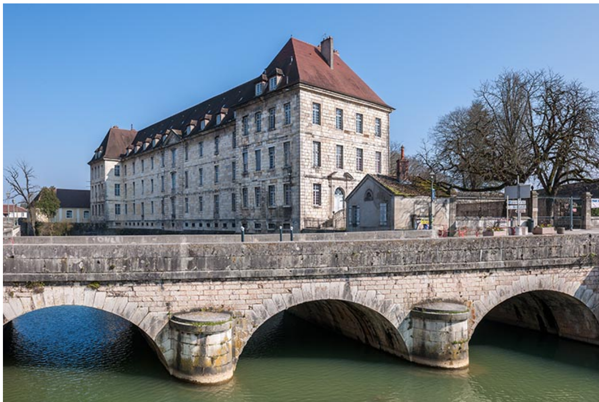
Ancien hôpital de la Charité, actuellement internat, vue générale.