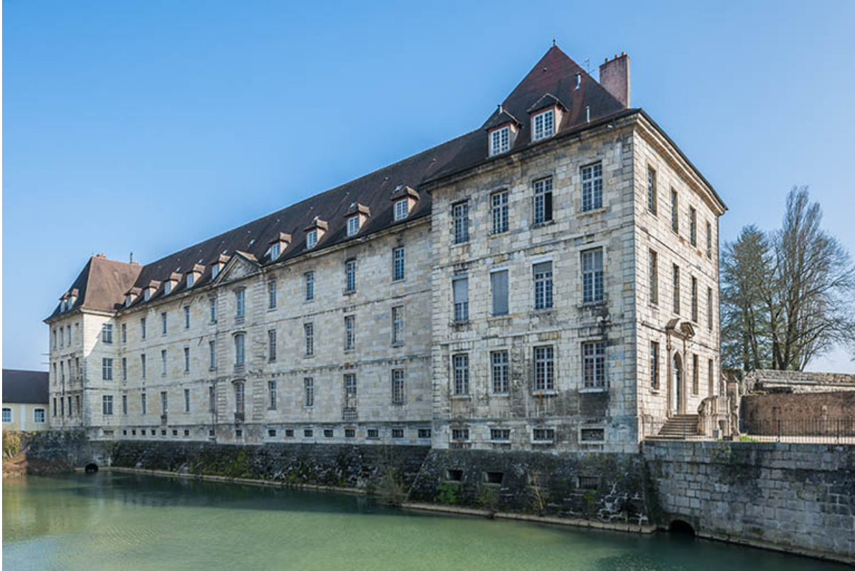
Ancien hôpital de la Charité, façade antérieure.