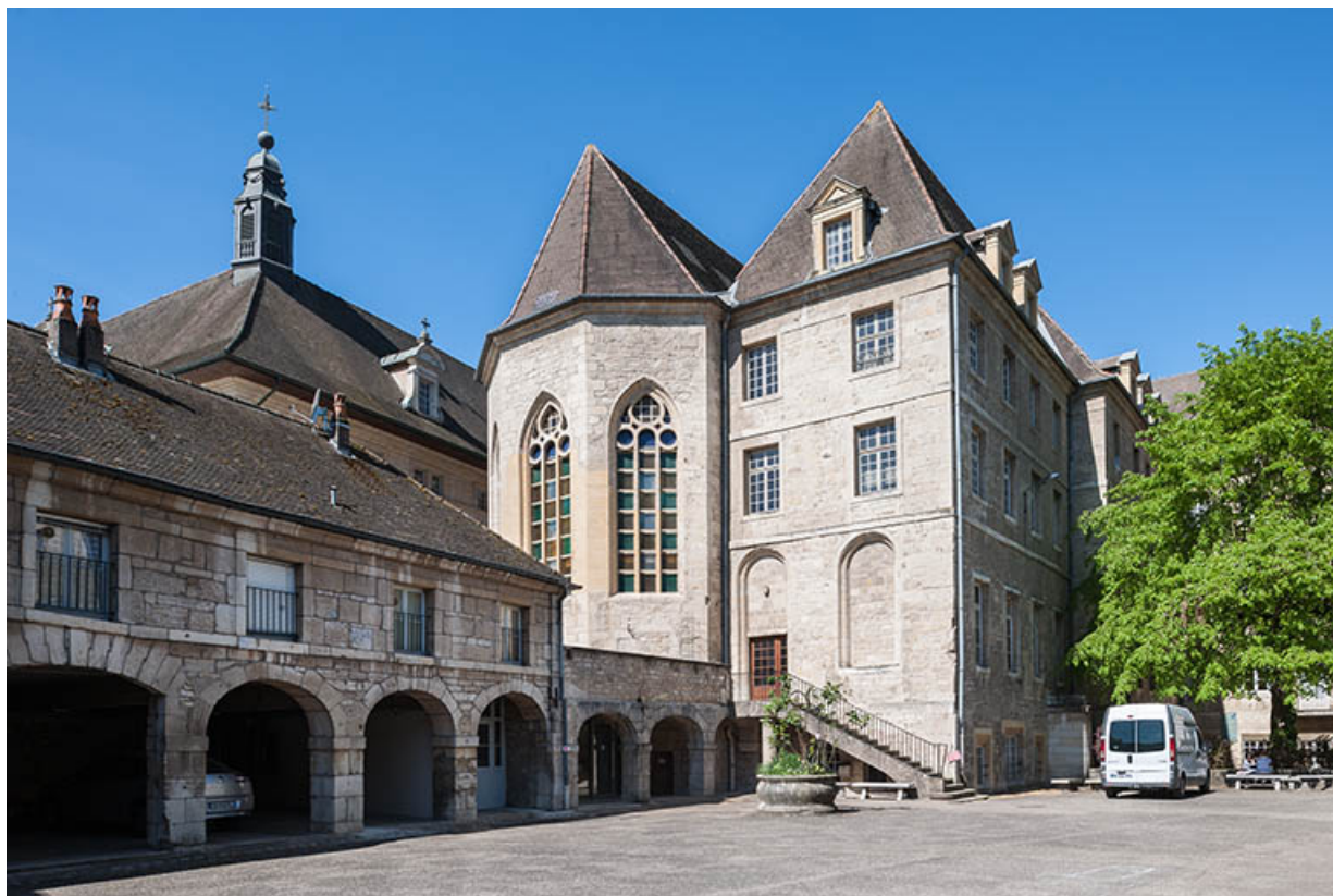
Vue de la cour intérieure du site d'externat, ancien couvent des Dames d'Ounans, à gauche abside de la chapelle et au premier plan arcades du cloître.