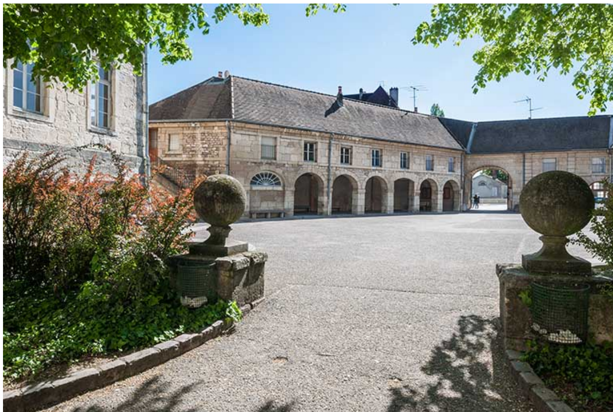
Vue générale de la cour d'externat avec entrée principale en arrière-plan.