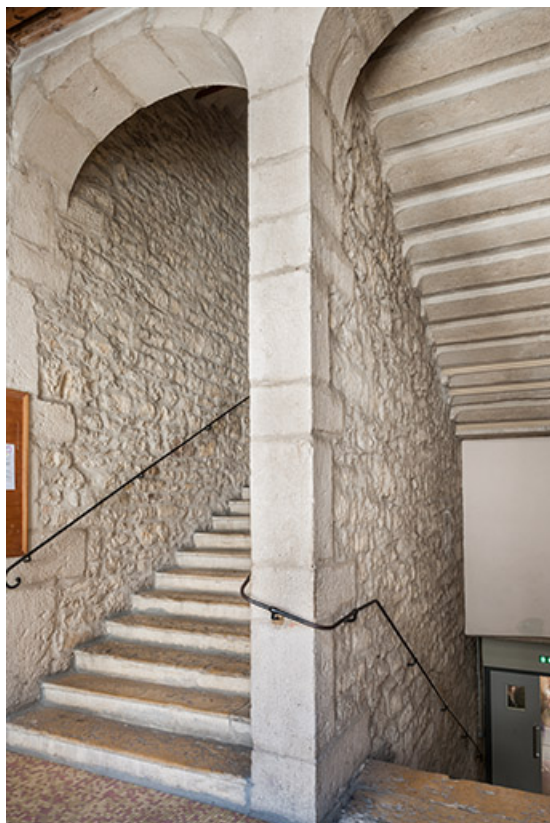
Escalier de pierre intérieur.