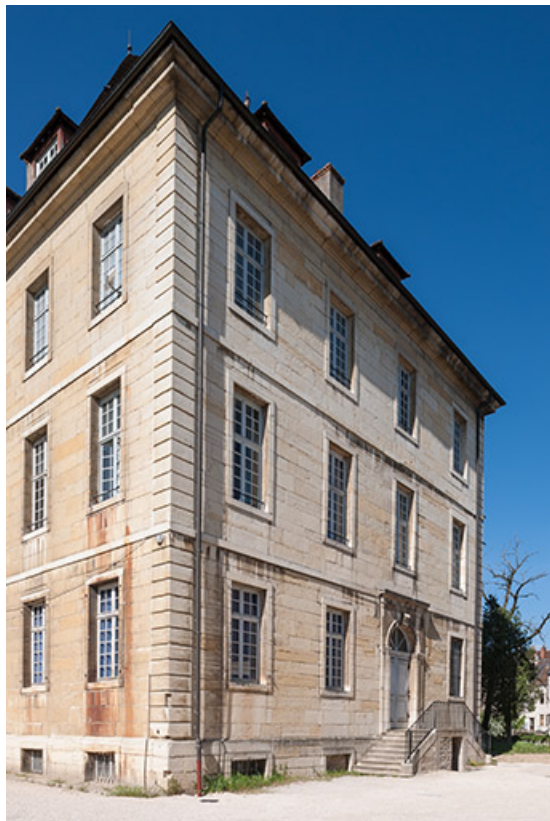
Ancien hôpital de la Charité, actuellement internat, pignon Est. 39, Dole, 6 Grande Rue