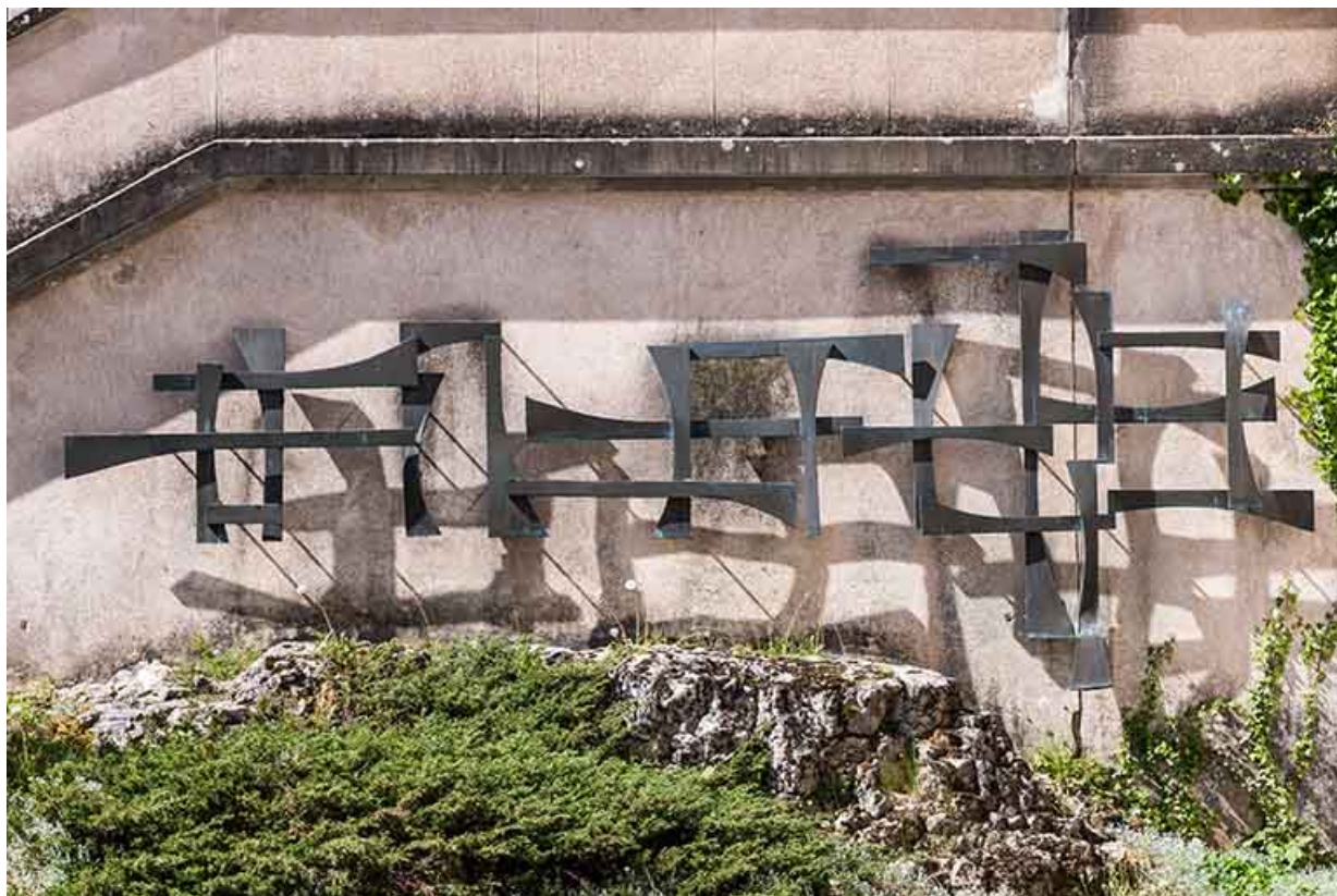
Détail de l'idéogramme.