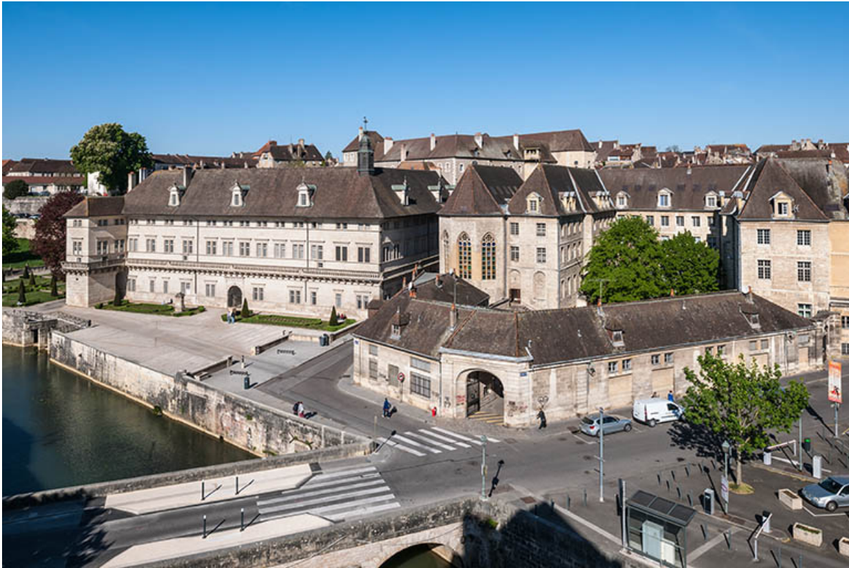
Vue générale du site externat, ancien couvent et de l'Hôtel Dieu, depuis le sud . 39, Dole, 6 Grande Rue