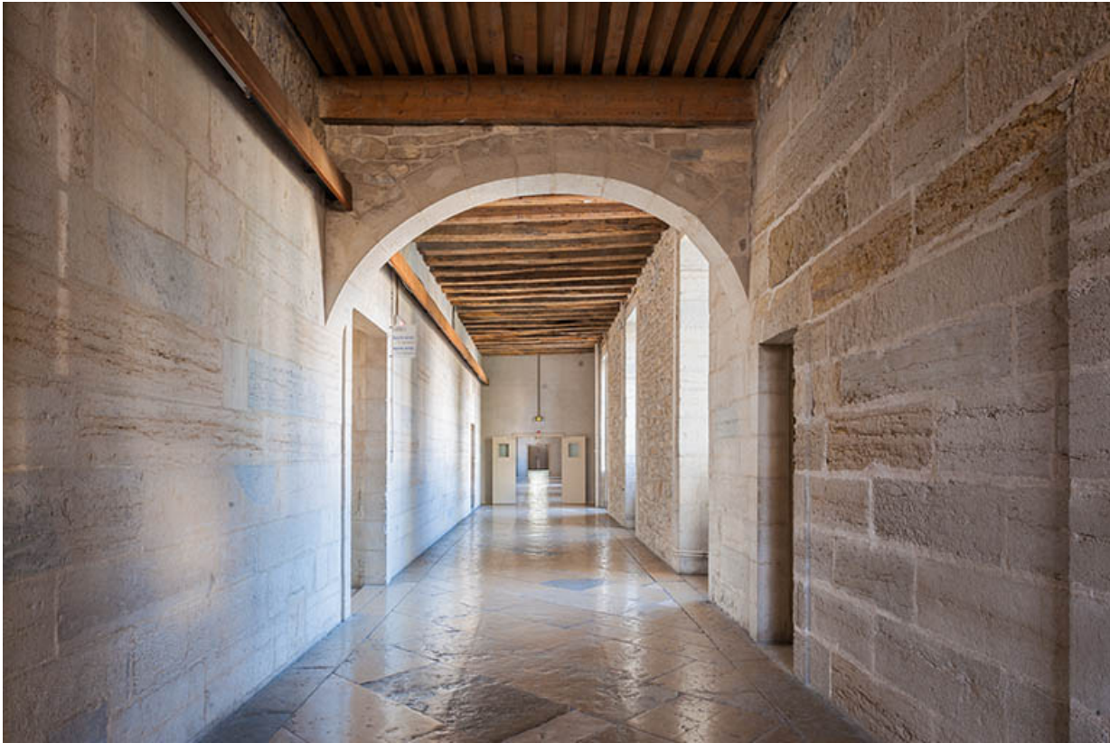
Internat, couloir du rez-de-chaussée.