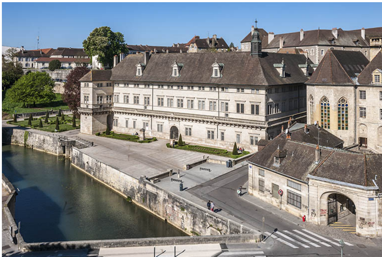
Vue du site externe depuis la rue Bazoune.