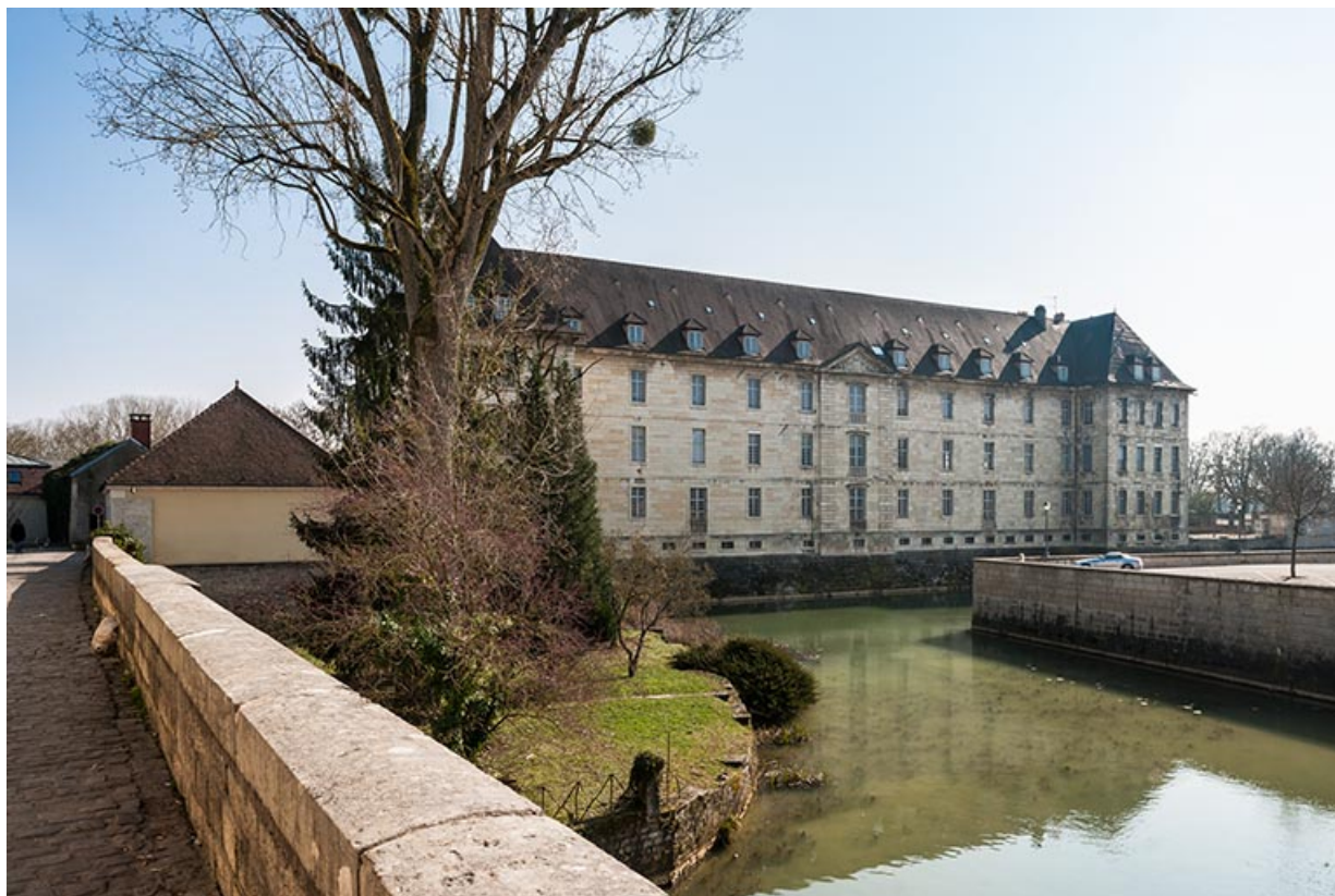
Dole, lycée Charles Nodier : internat.