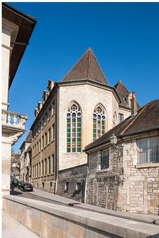
Chapelle du couvent des Dames d'Ounans : site externat. 39, Dole, 6 Grande Rue