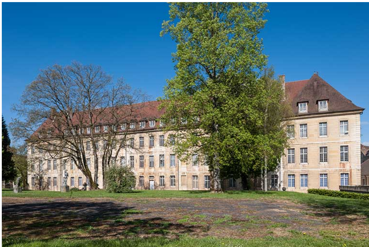
Ancien hôpital de la Charité, actuellement internat, vue postérieure sur le parc. 39, Dole, 6 Grande Rue