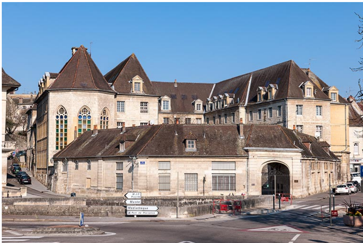
Vue générale du site occupé autrefois par le couvent des Dames d'Ounans.