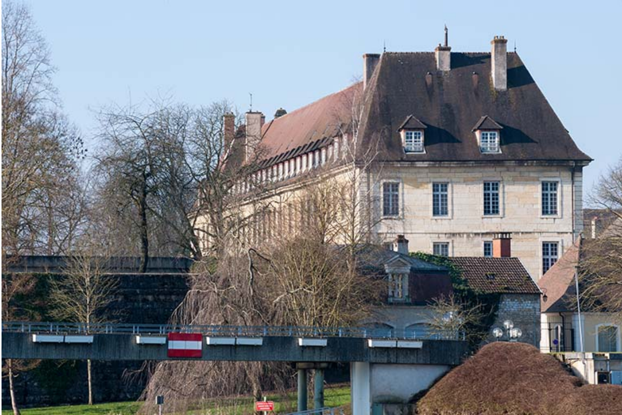
Ancien hôpital de la Charité, actuellement internat, détail des toitures.