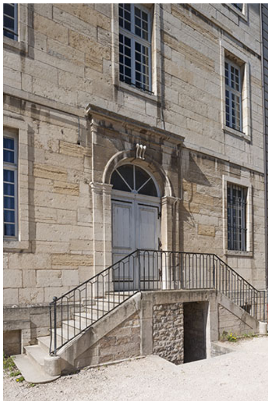
Portail de l'internat, pignon Est.