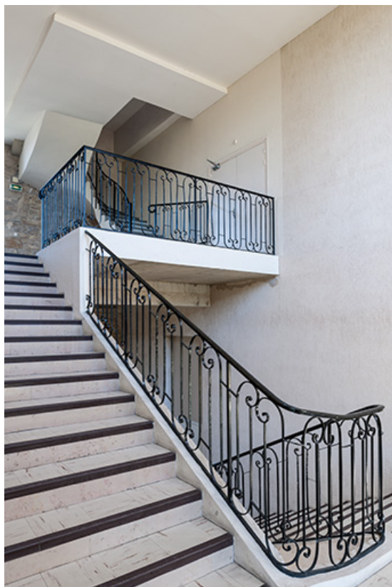
Internat, escalier intérieur.