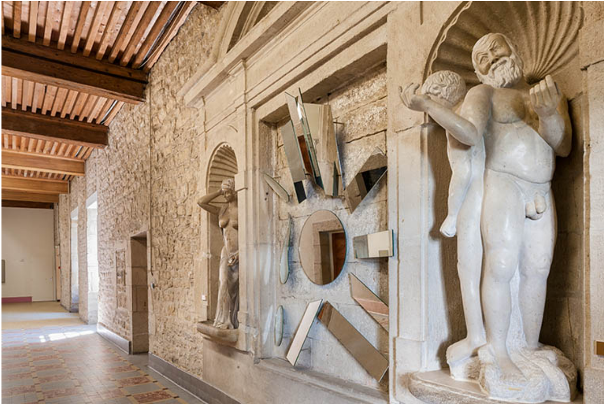
Galerie de l'ancien cloître : groupe sculpté