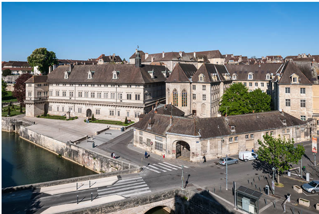
Vue générale du site externat, ancien couvent et de l'Hôtel Dieu, depuis le sud . 39, Dole, 6 Grande Rue