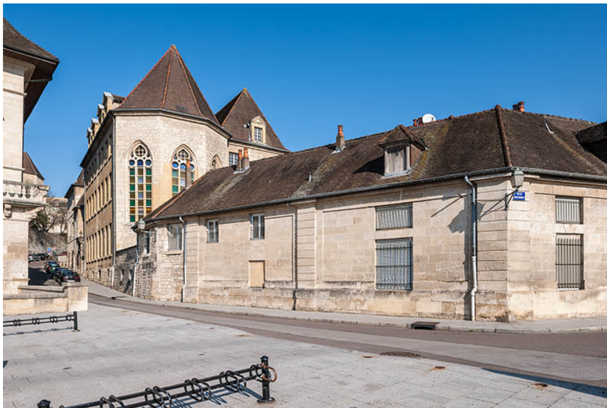
Façades des bâtiments logements, rue Bauzonnet, en arrière-plan la chapelle. 39, Dole, 6 Grande Rue