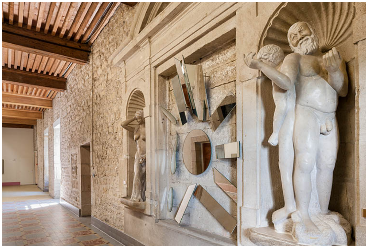
Galerie de l'ancien cloître : groupe sculpté 39, Dole, 6 Grande Rue