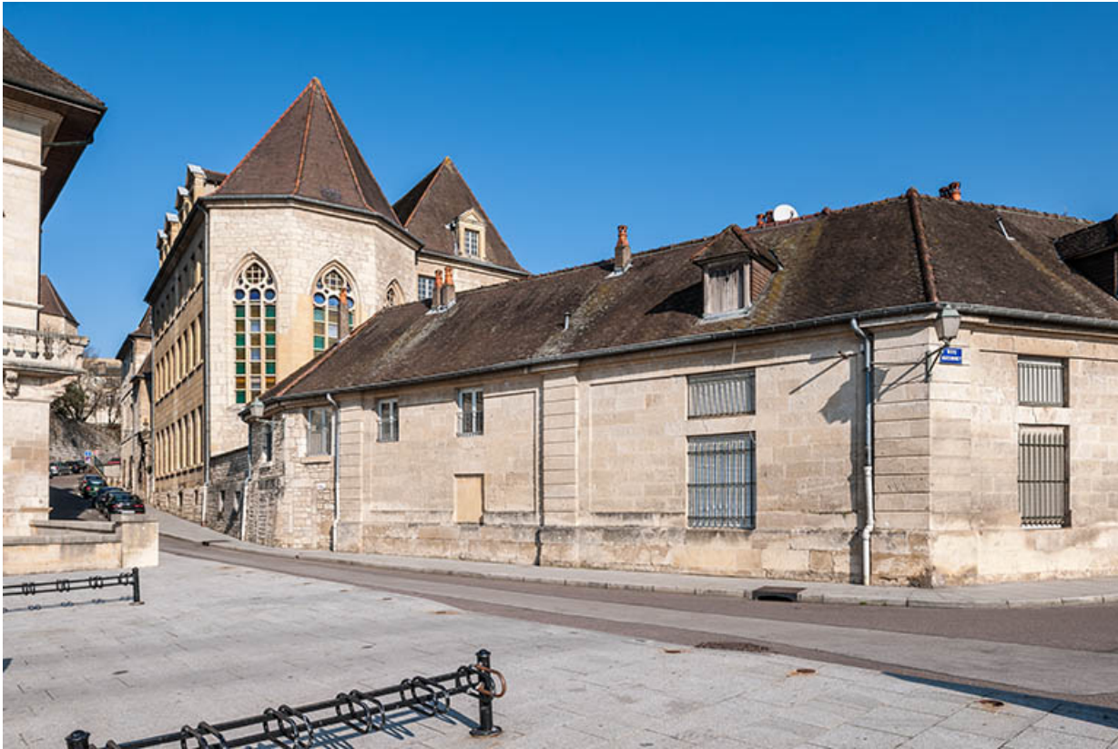
Façades des bâtiments logements, rue Bauzonnet, en arrière-plan la chapelle. 39, Dole, 6 Grande Rue