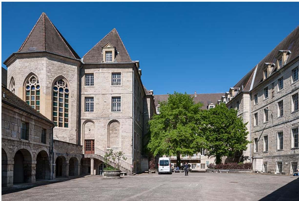
Site de l'ancien couvent des Dames d'Ounans : bâtiments d'externat et logements. 39, Dole, 6 Grande Rue