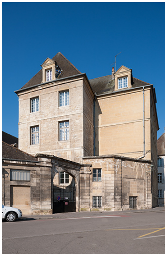
Externat : entrée, rue des Boucheries.