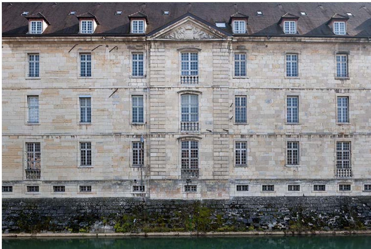
Ancien Hôpital de la Charité , vue de la façade antérieure sur le canal des Tanneurs.