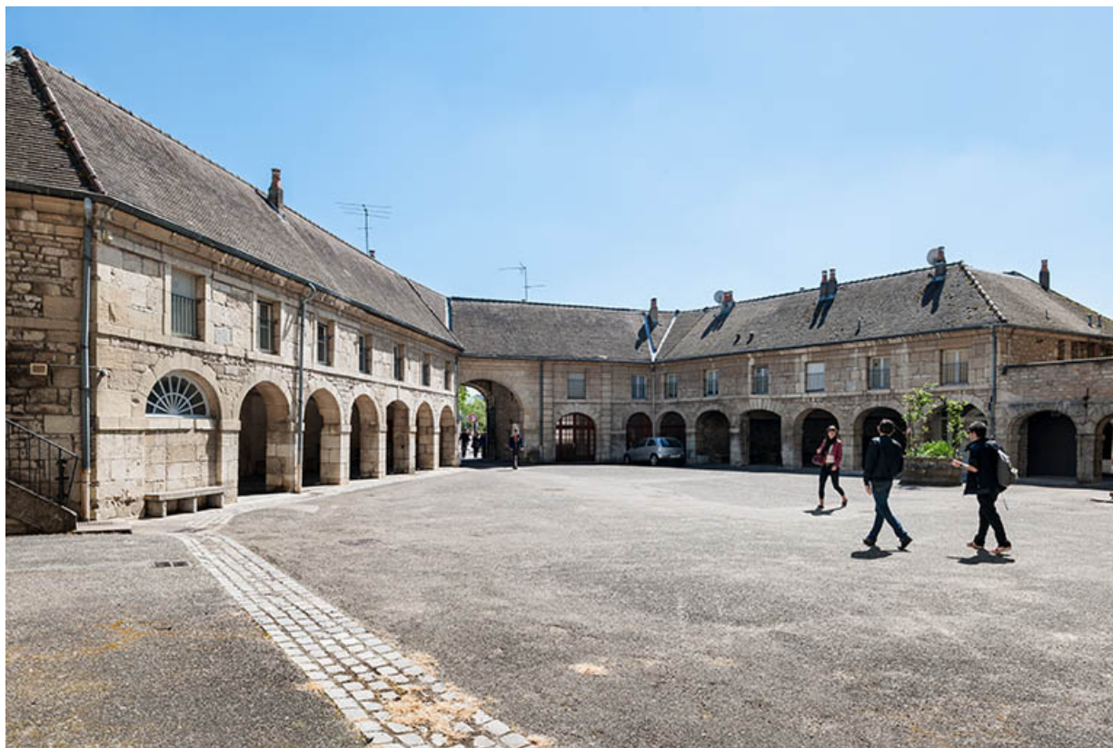
Cour intérieure et façades postérieures des bâtiments conciergerie et logements 39, Dole, 6 Grande Rue