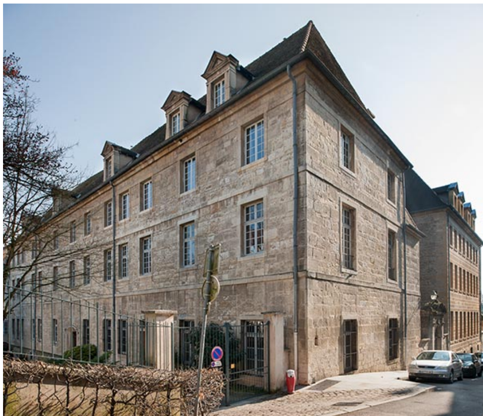
Façades des bâtiments d'externat sur la rue Bazzonnet avec portail donnant accès à la chapelle. 39, Dole, 6 Grande Rue