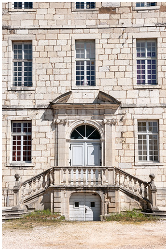
Ancien hôpital de la Charité, actuellement internat, portail d'entrée ouest. 39, Dole, 6 Grande Rue