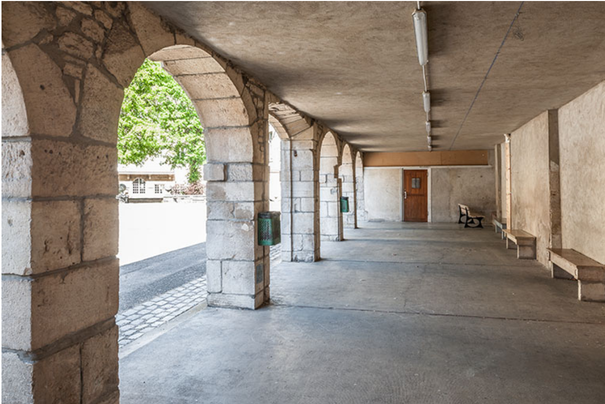
Cloître de l'ancien couvent, cour externat.