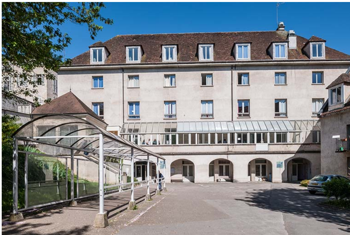
Bâtiment restauration scolaire, vue générale.