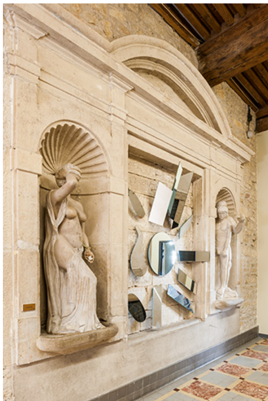
Sculptures de la galerie de l'ancien cloître.