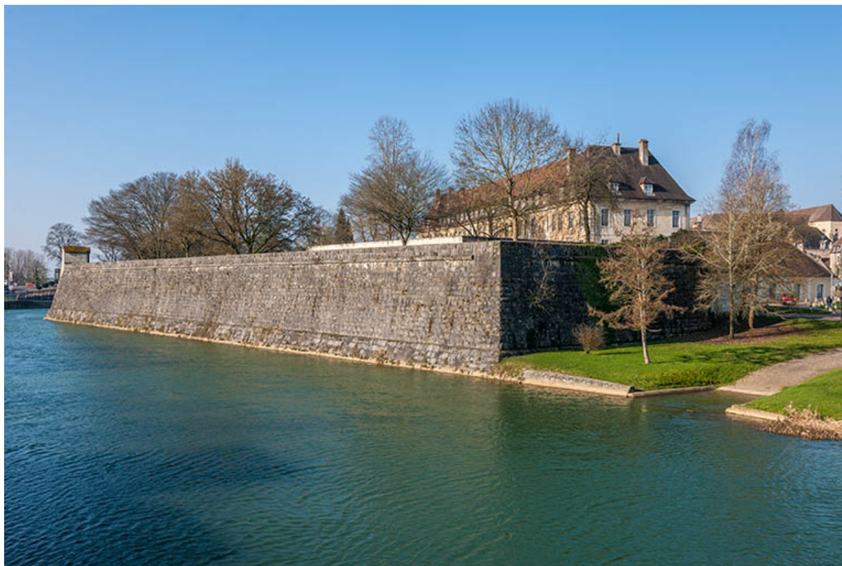
Ancien hôpital de la Charité, actuellement internat, vue du parc au bord du canal. 39, Dole, 6 Grande Rue