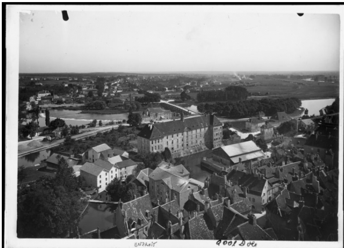
Vue de situation [1re moitié 20e siècle].