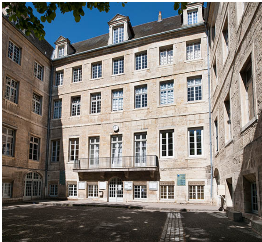
Façades de l'externat sur la cour intérieure.