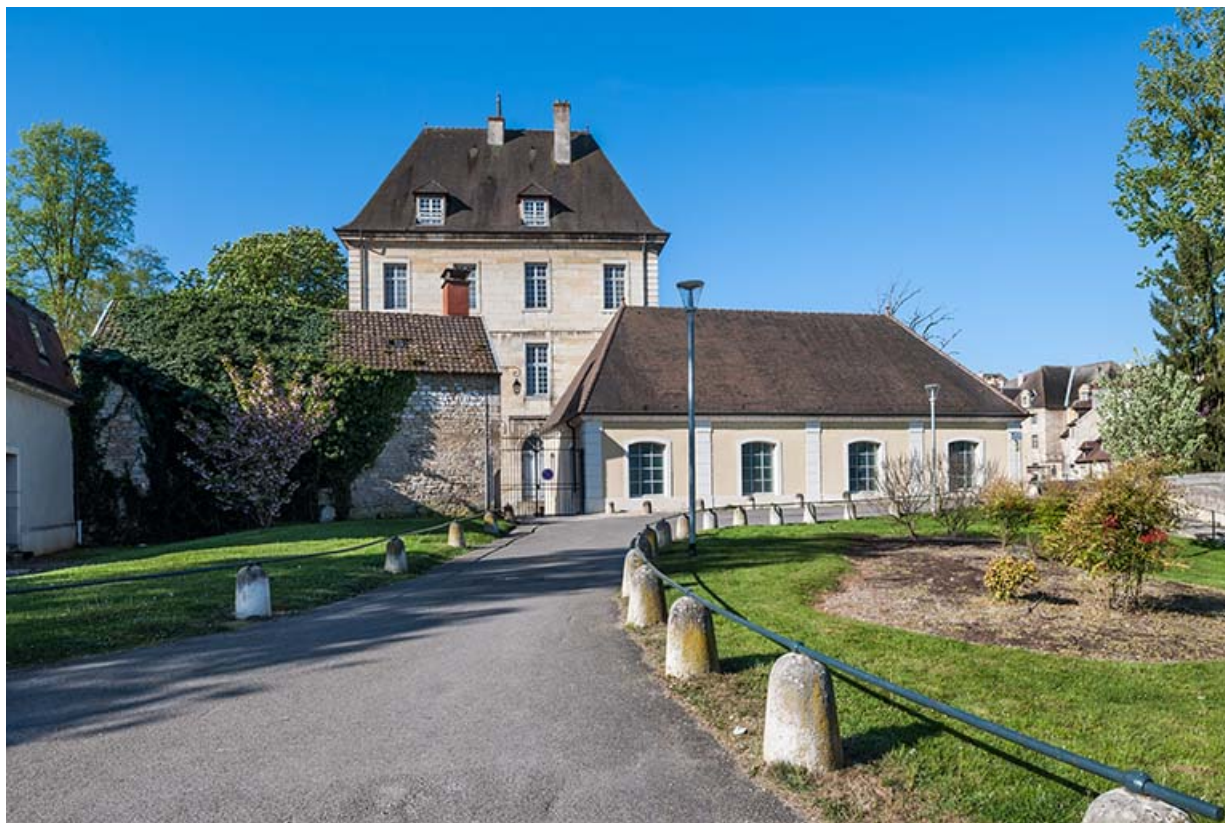
Hôpital de la Charité, actuellement internat, entrée Est avec bâtiments transformés en salles de sports. 39, Dole, 6 Grande Rue