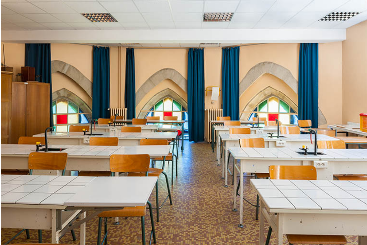
Salle de travaux pratiques.