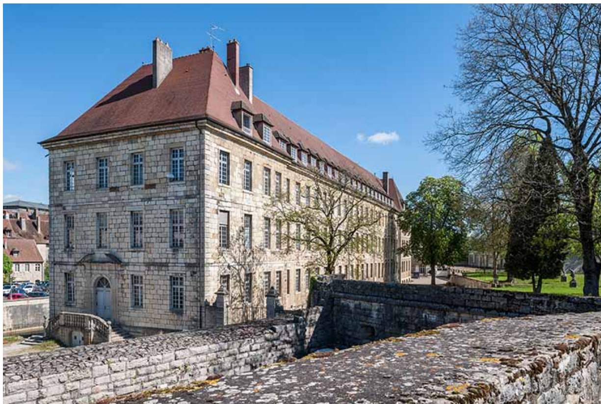
Ancien hôpital de la Charité, actuellement internat, vue façade postérieure et pignon ouest, remparts. 39, Dole, 6 Grande Rue