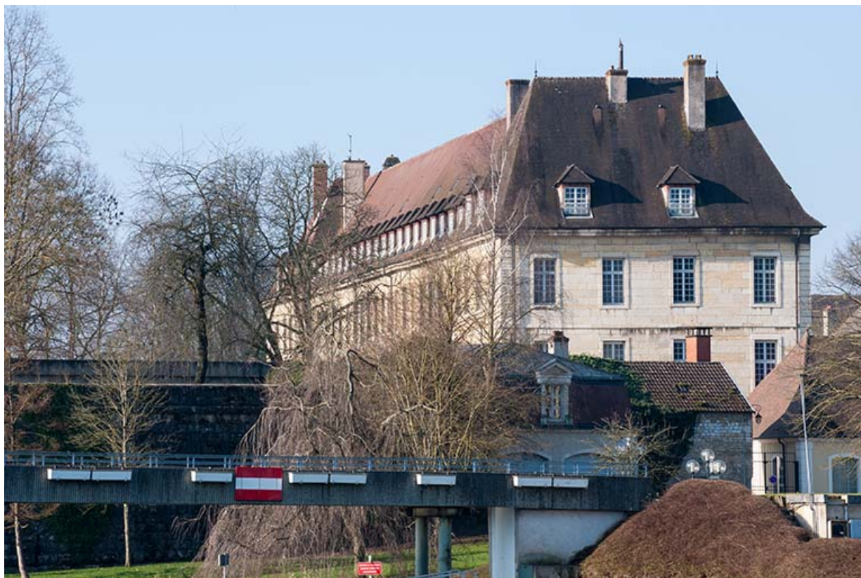
Ancien hôpital de la Charité, actuellement internat, détail des toitures. 39, Dole, 6 Grande Rue