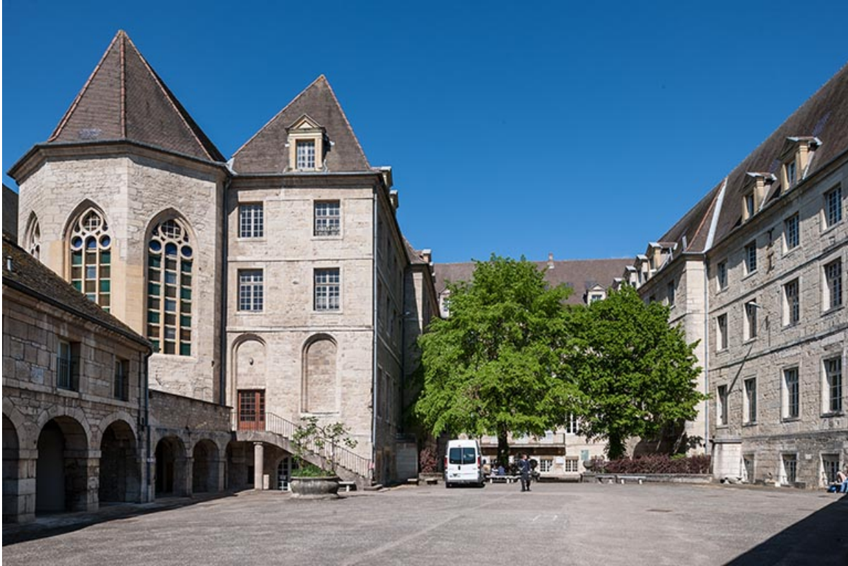
Site de l'ancien couvent des Dames d'Ounans : bâtiments d'externat et logements.