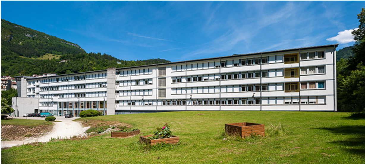
Internat : façade postérieure, vue générale.