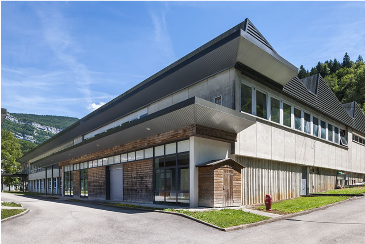
Atelier : vue d'ensemble.