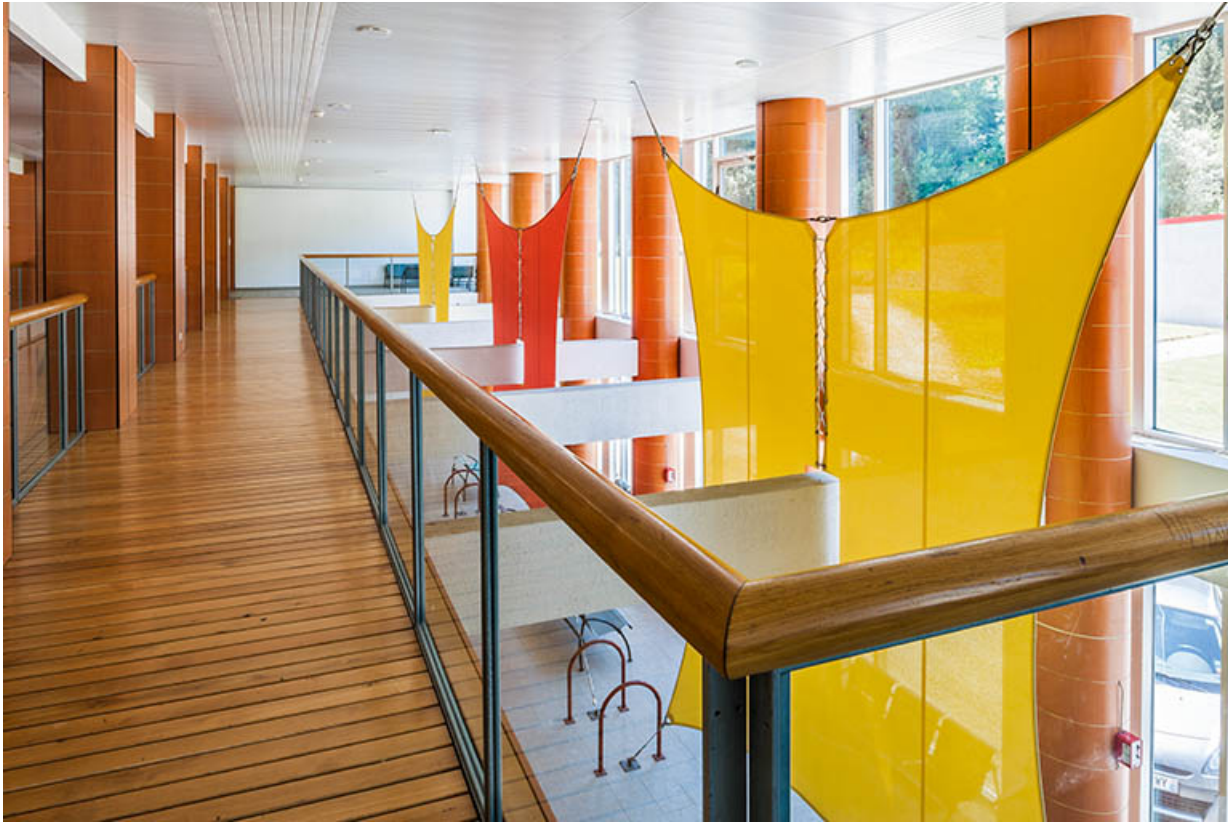
Internat : hall depuis le 1er étage.