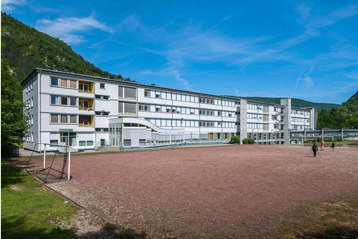
Internat : façade Est, terrain de football.