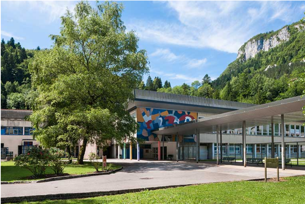
Ateliers avec passage couvert vers l'externat, mosaïque 1% artistique sur la façade.