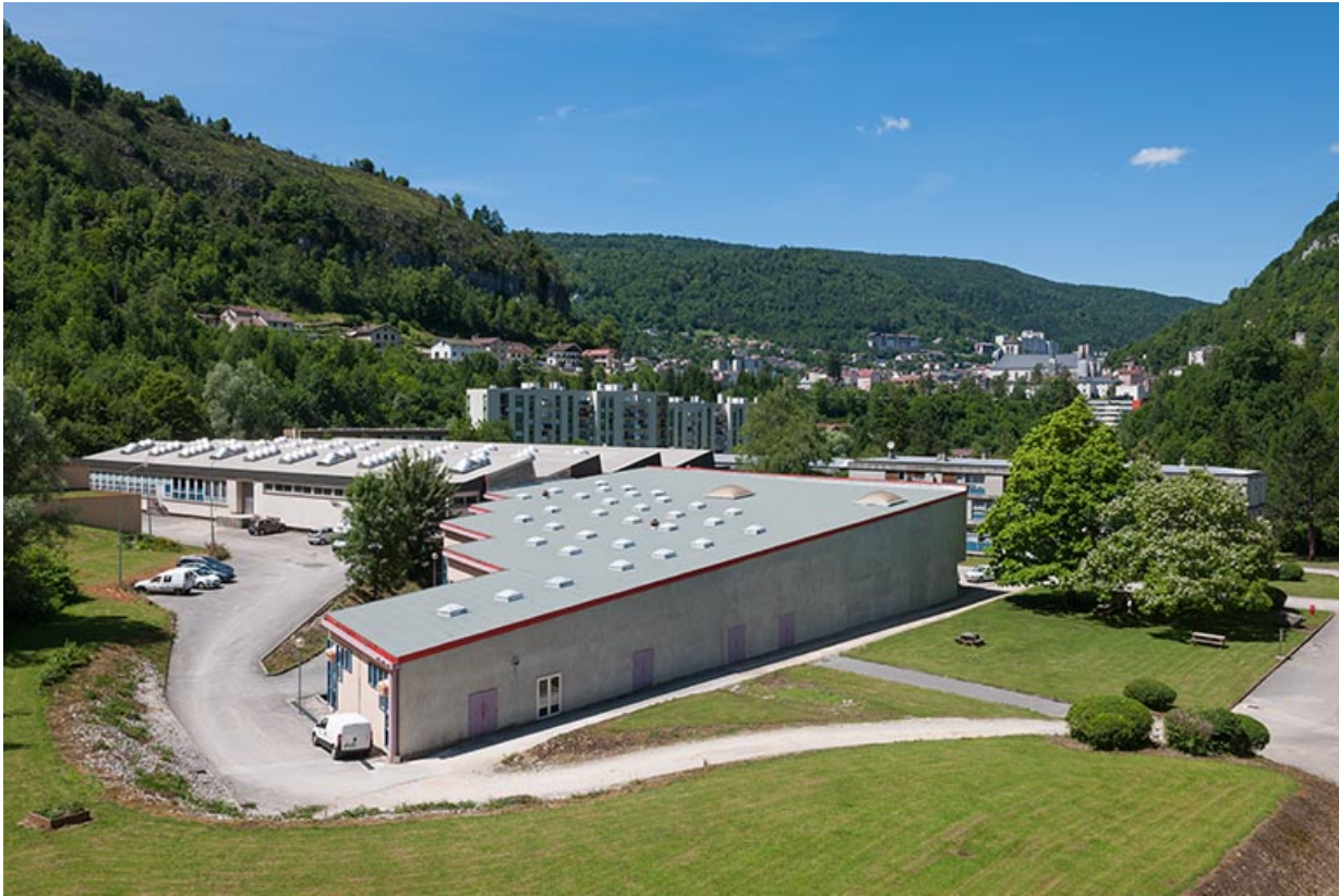
Ateliers : vue d'ensemble des toitures.