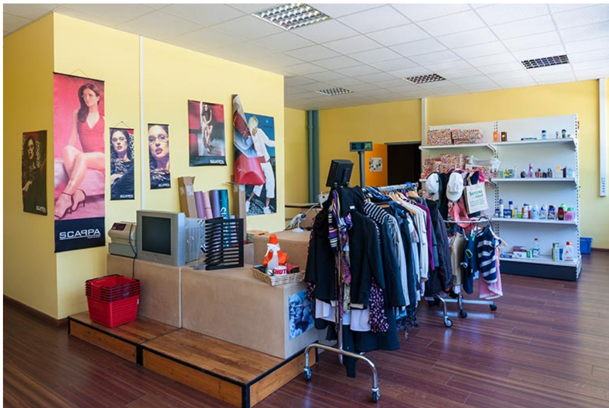
Externat tertiaire : boutique de vente pour formation des élèves.