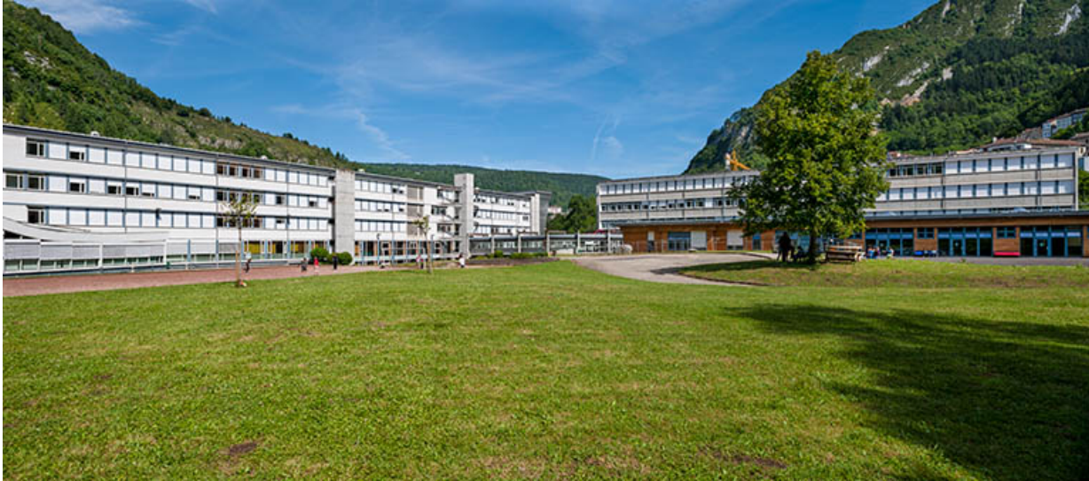
Internat et externat : vue d'ensemble.