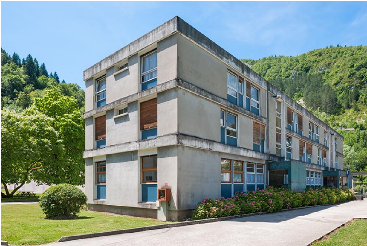
Administration : façade antérieure.