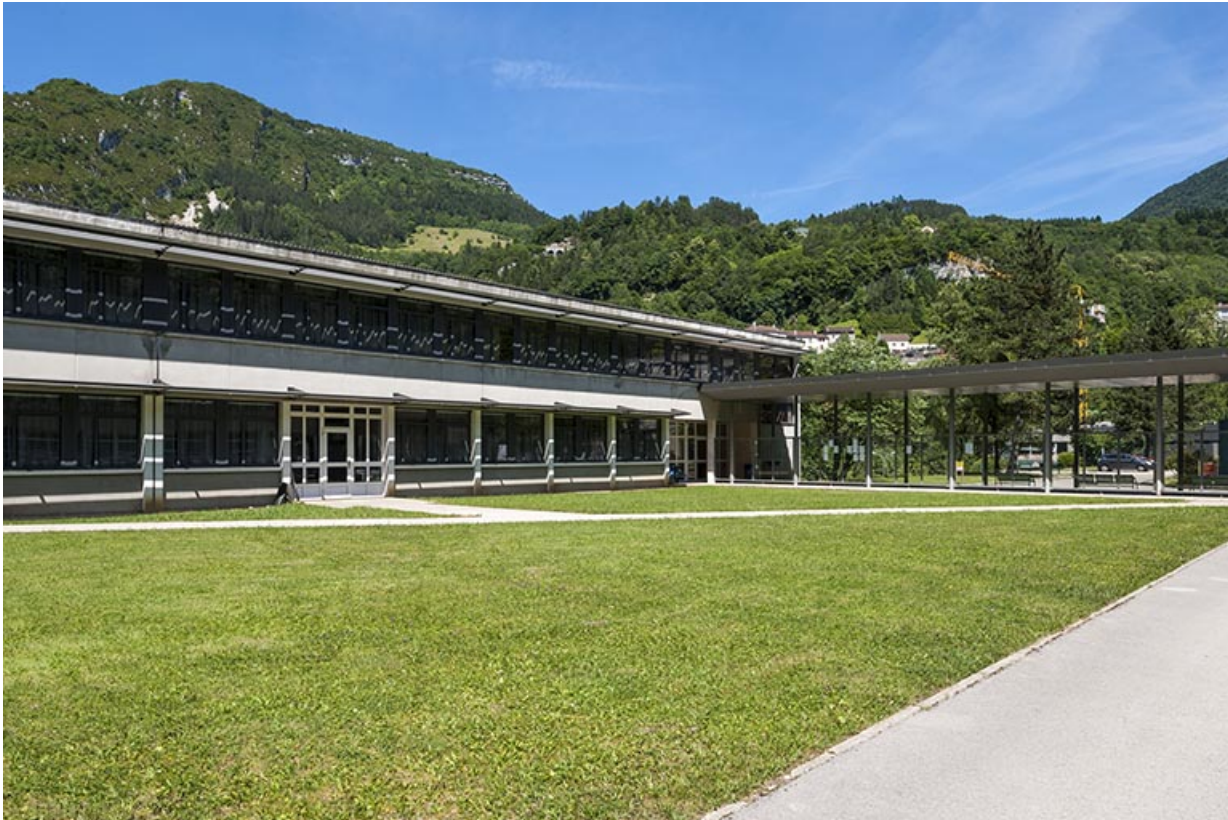
Externat tertiaire : façade antérieure.