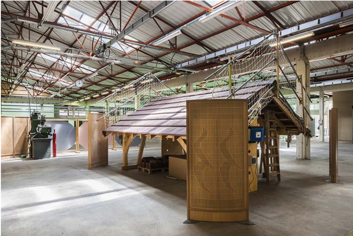
Atelier, ancien atelier mécanique, destiné aux formations sciences et technologies, énergie et environnement : intérieur. 39, Saint-Claude rue du Tomachon