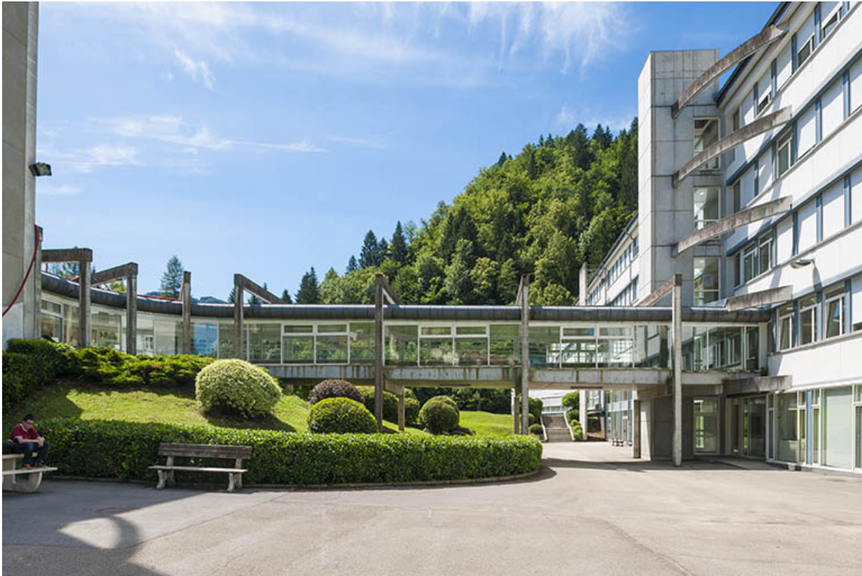
Passerelle couverte entre internat et externat .