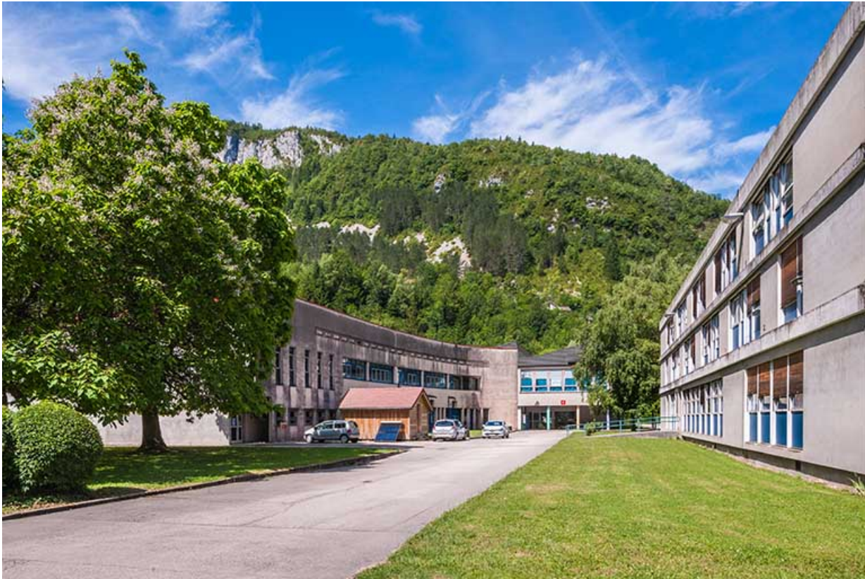
Façade postérieure de l'administration avec au second plan, les ateliers.