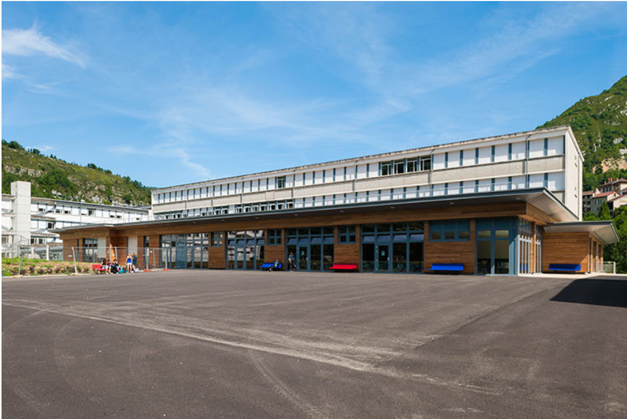
Cour et bâtiments des formations tertiaire.