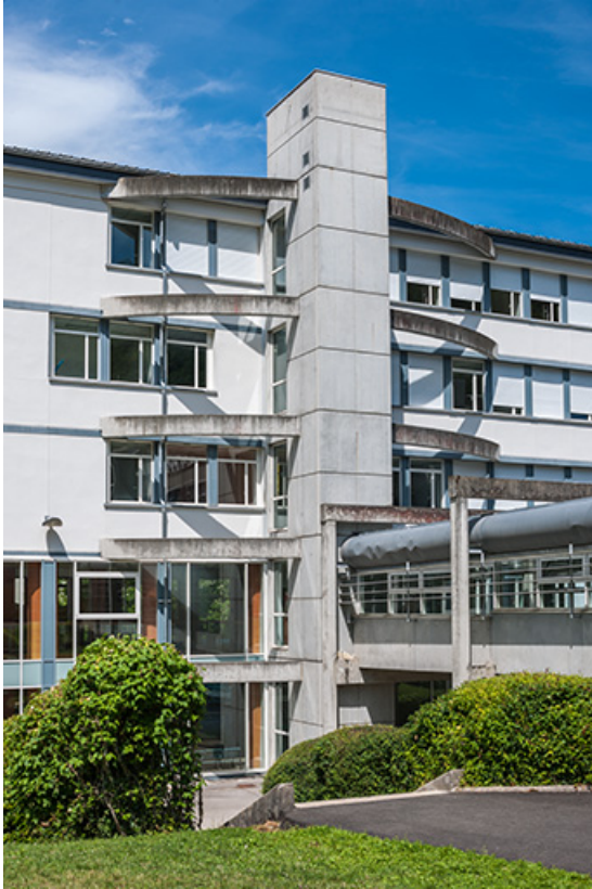
Internat : détail de la façade antérieure.