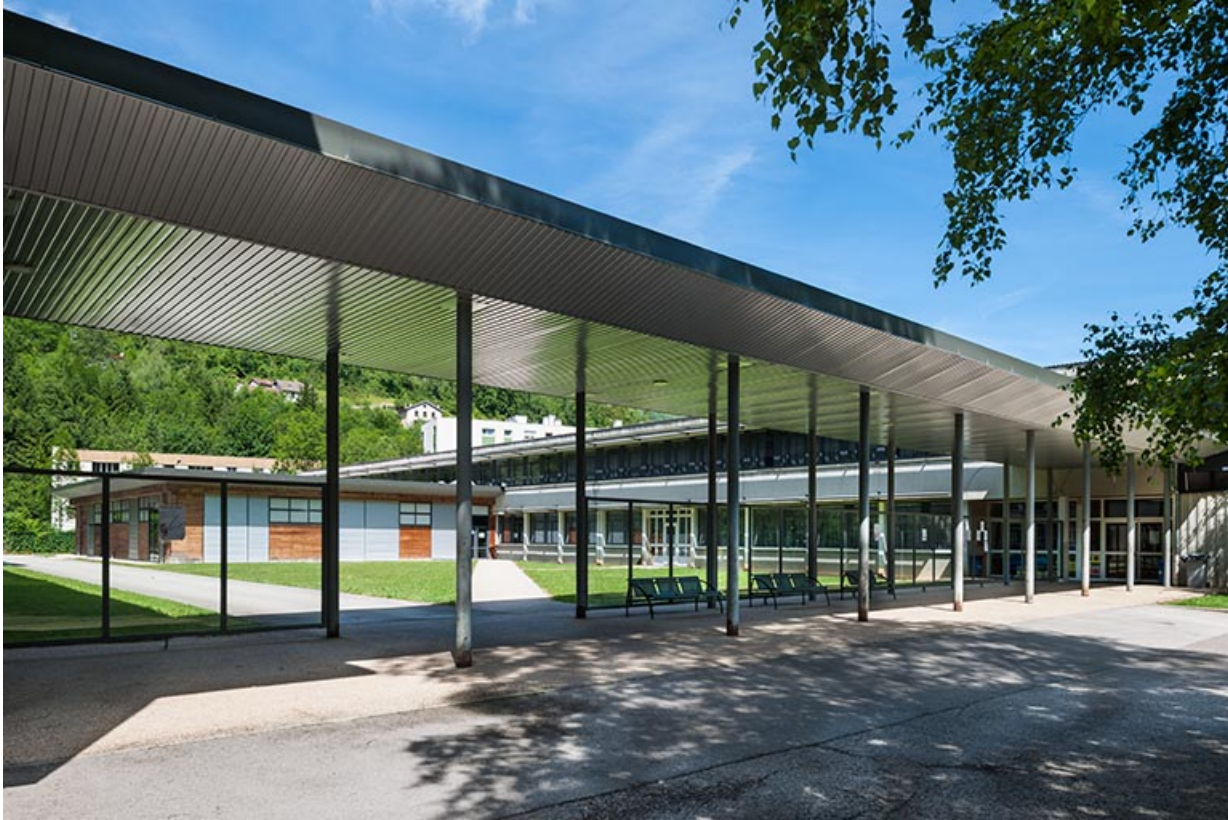
Passage couvert reliant l'atelier à l'externat tertiaire.