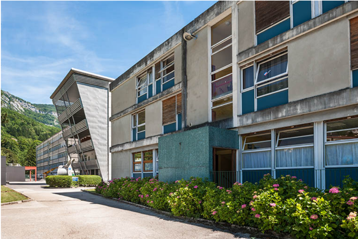
Administration : vue depuis le côté Est avec au second plan l'extension de l'internat. 39, Saint-Claude rue du Tomachon