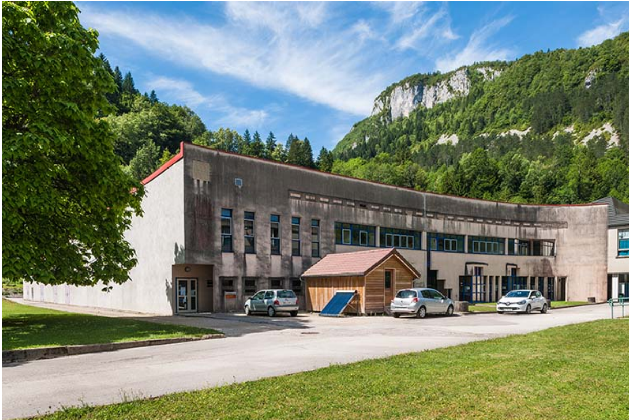
Atelier, ancien atelier mécanique : vue d'ensemble.