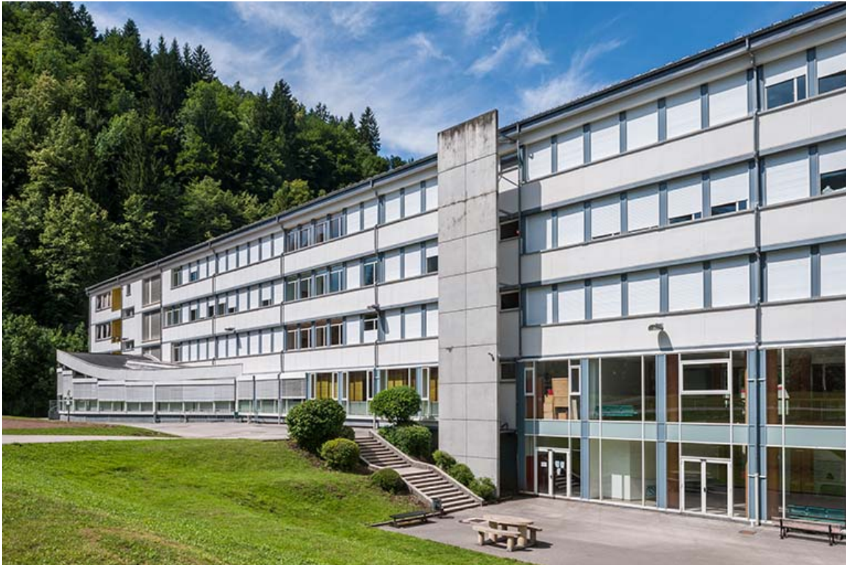
Internat : façade antérieure rénovée et aménagements extérieurs.