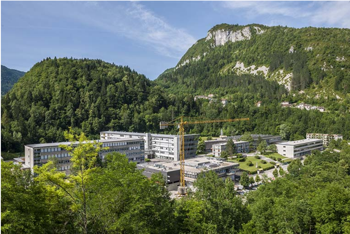
Vue d'ensemble de la cité scolaire.