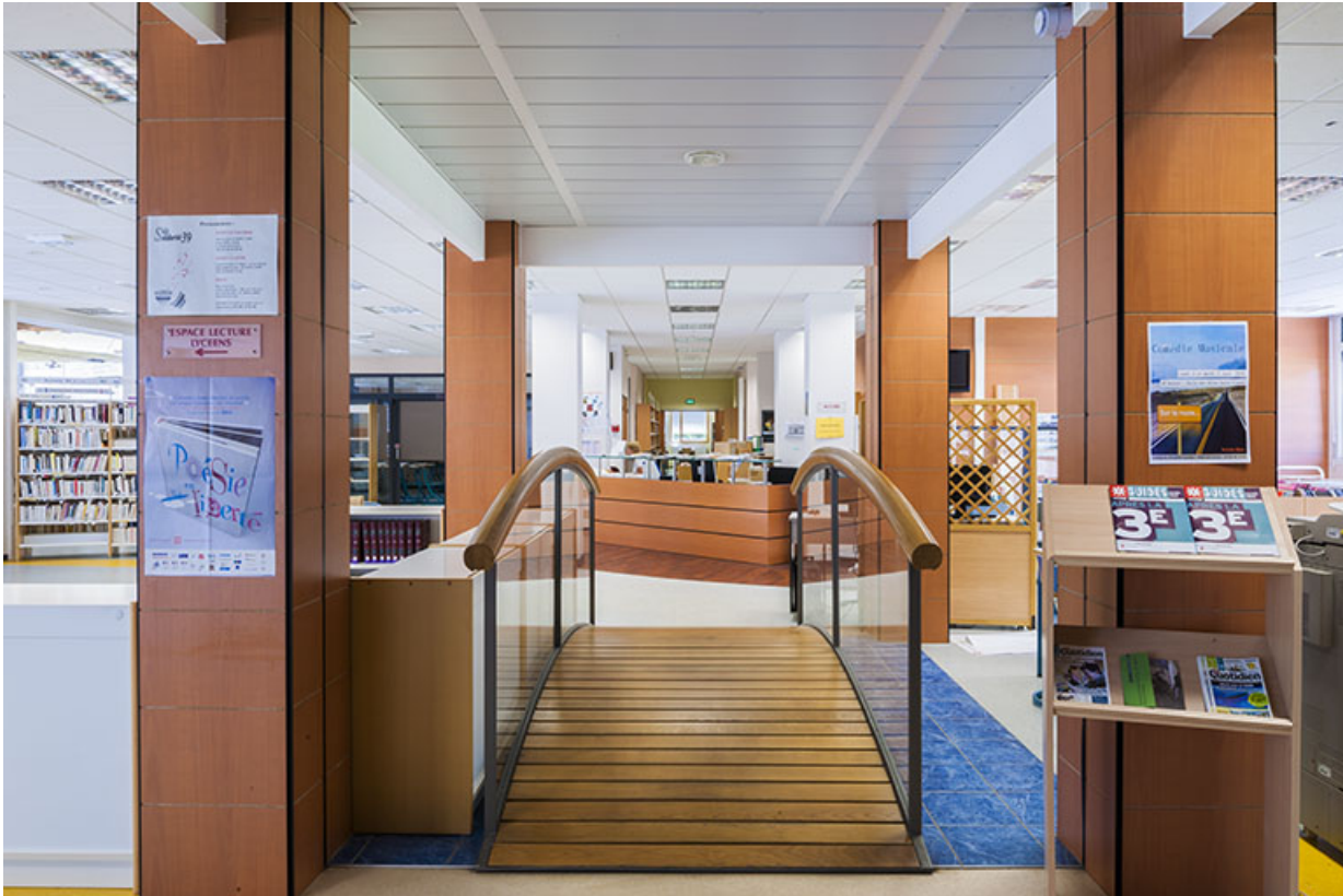
Centre de documentation, aménagement intérieur.