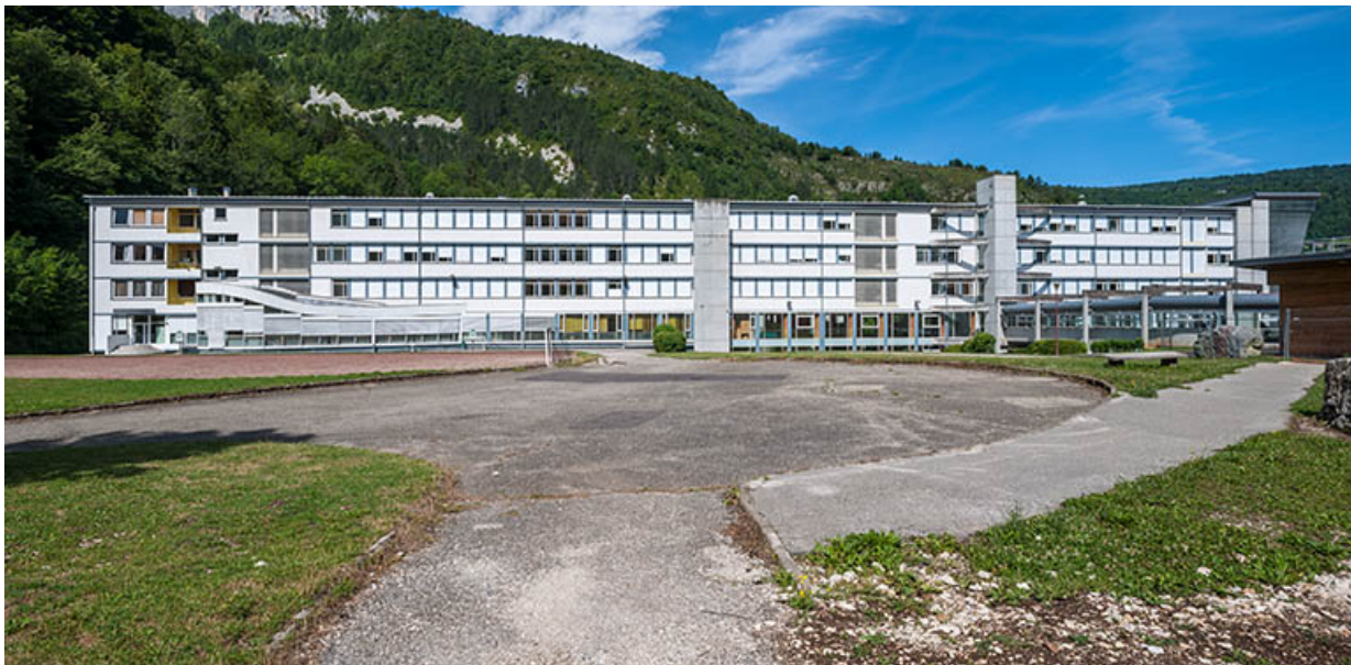
Vue d'ensemble de l'internat depuis les terrains de sport, à droite le passage couvert vers l'externat.