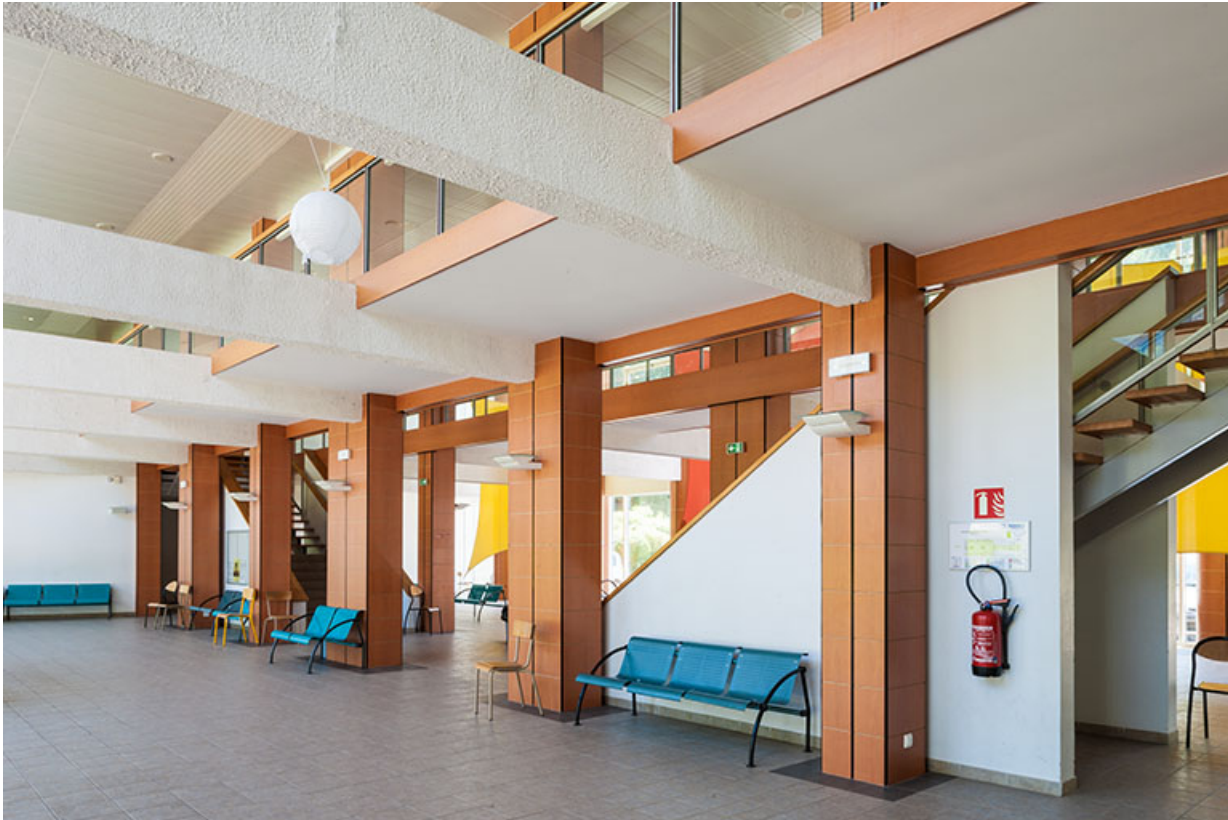
Internat : aménagement du hall-forum.