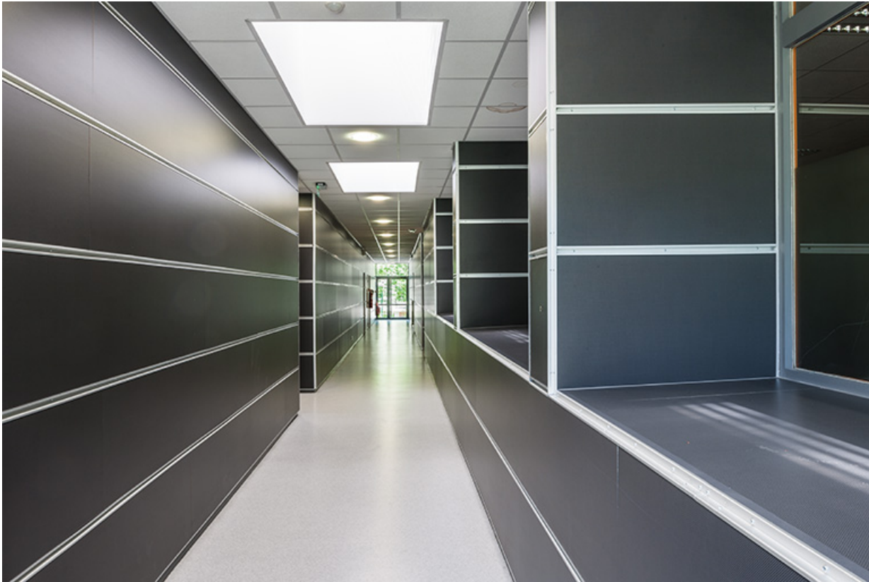
Atelier : couloir de l'extension.