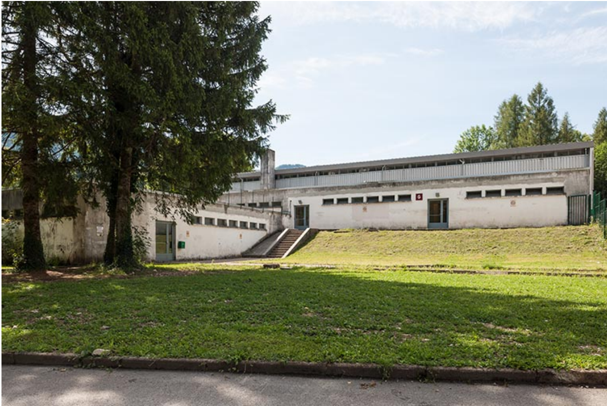
Externat: vue postérieure.