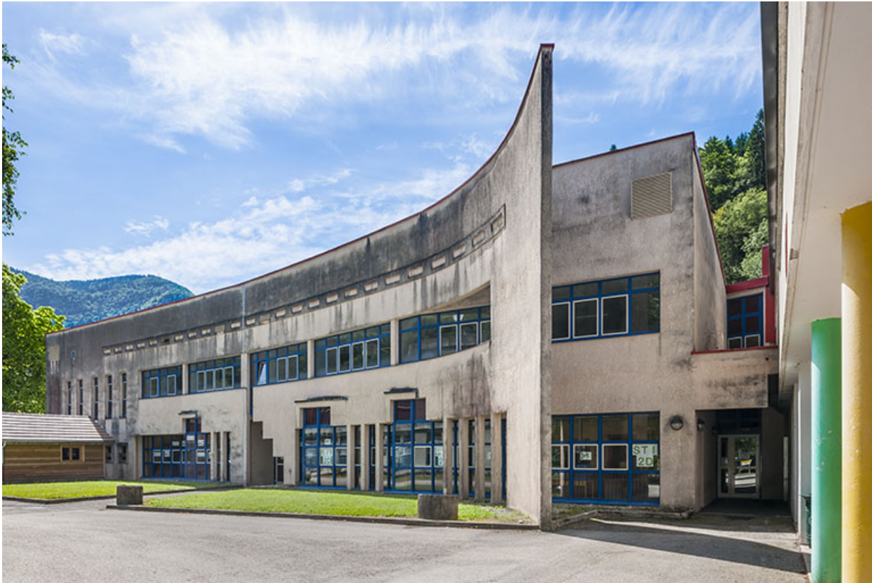
Saint-Claude, lycée de la cité scolaire du Pré Saint-Sauveur : façade de l'ancien atelier mécanique. 39, Saint-Claude rue du Tomachon