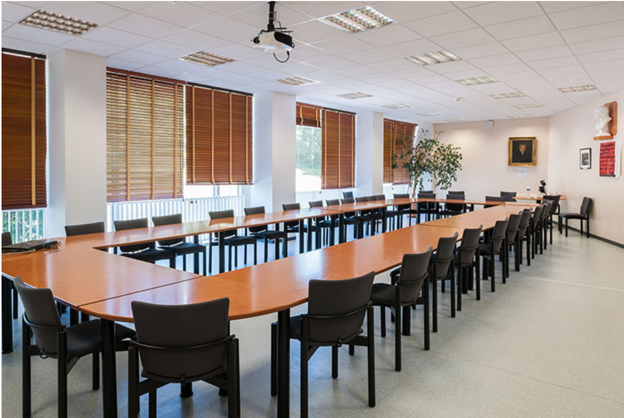
Internat : salle de réunion du 1er étage.