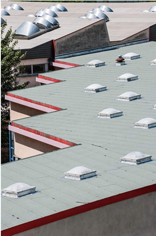
Toitures des deux ateliers : détail.