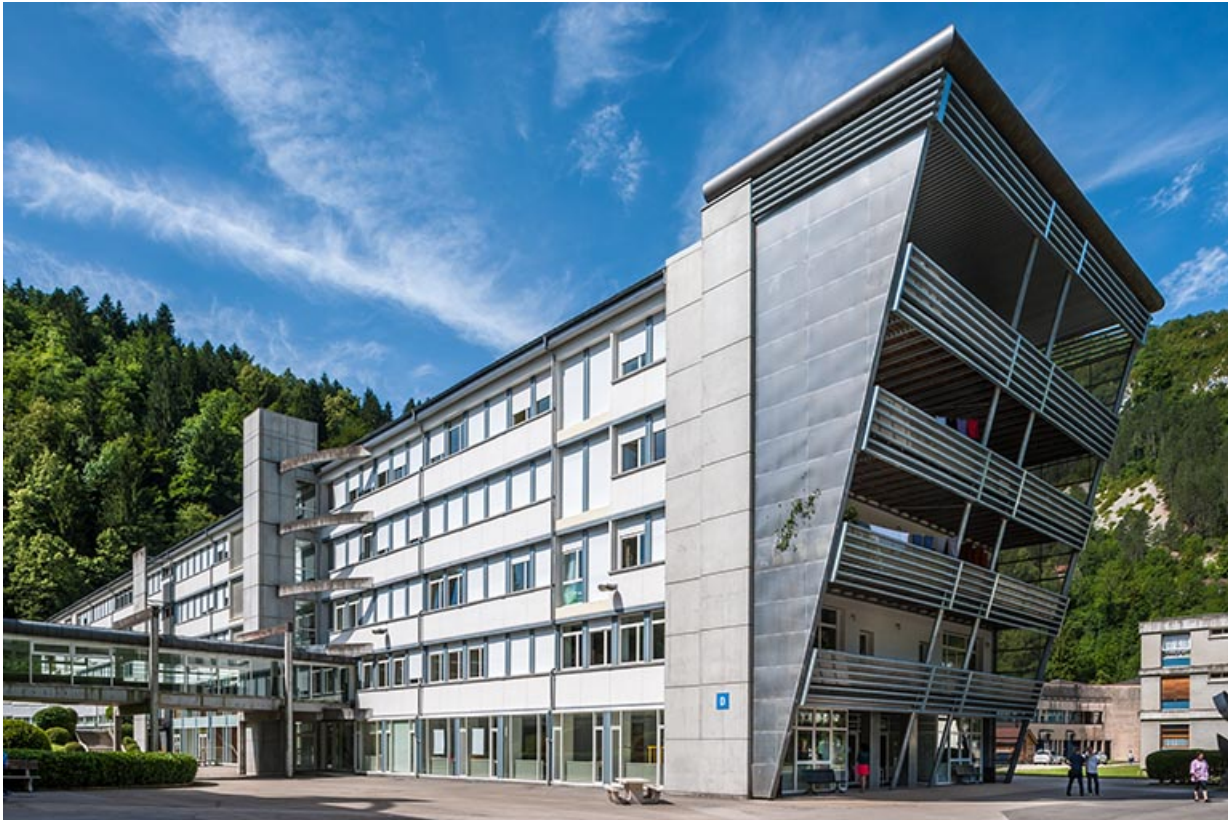
Internat : façade Est avec accroche du passage couvert vers l'externat et pignon nord avec extension.