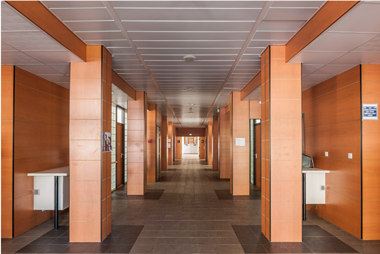
Internat : couloir du rez-de -chaussée restructuré.