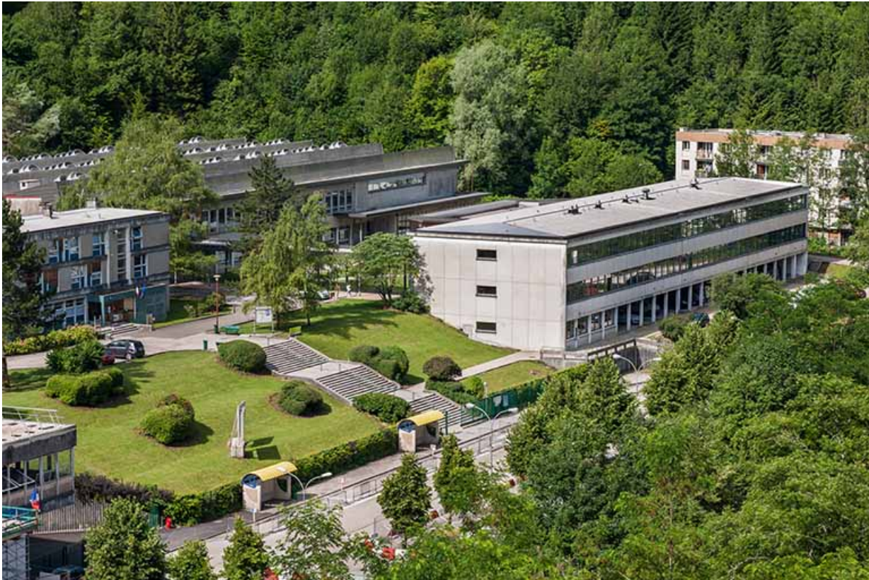
Vue de la cité scolaire : externat tertiaire au 1er plan, ateliers au second plan, à droite restauration.