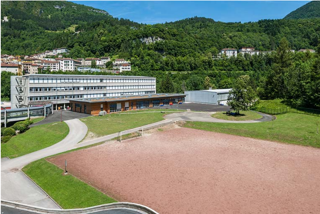
Externat : vue d'ensemble.