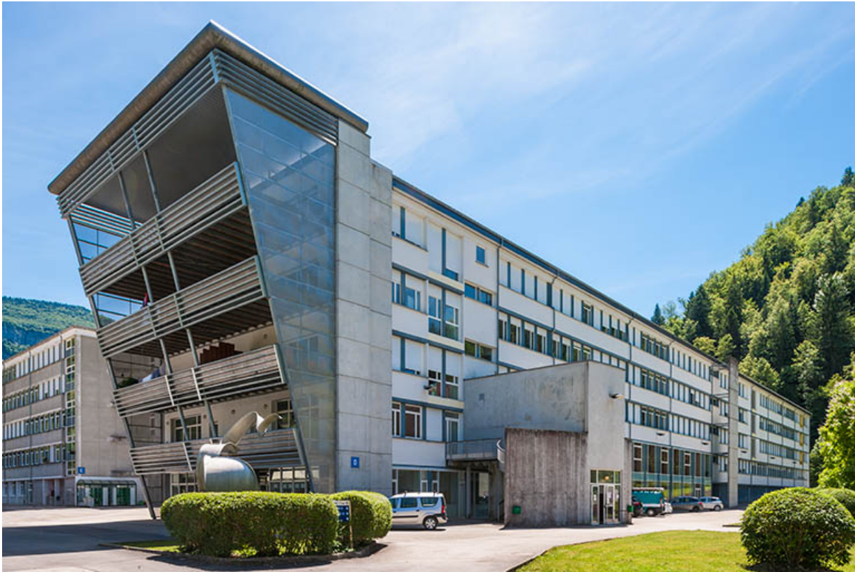
Internat : extension pignon Nord et façade postérieure Ouest.