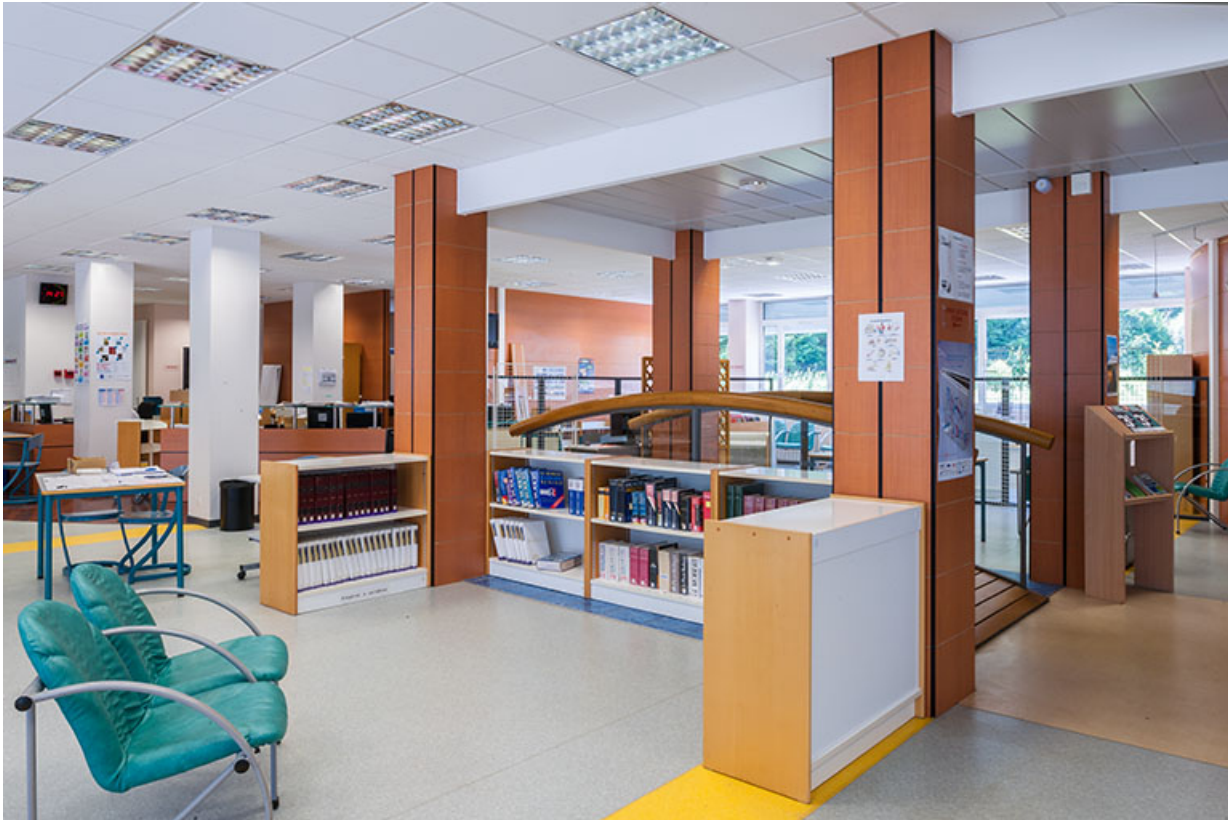
Centre de documentation (bâtiment de l'internat).