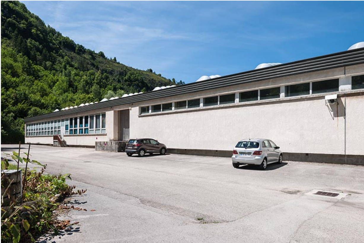
Atelier : façade postérieure.