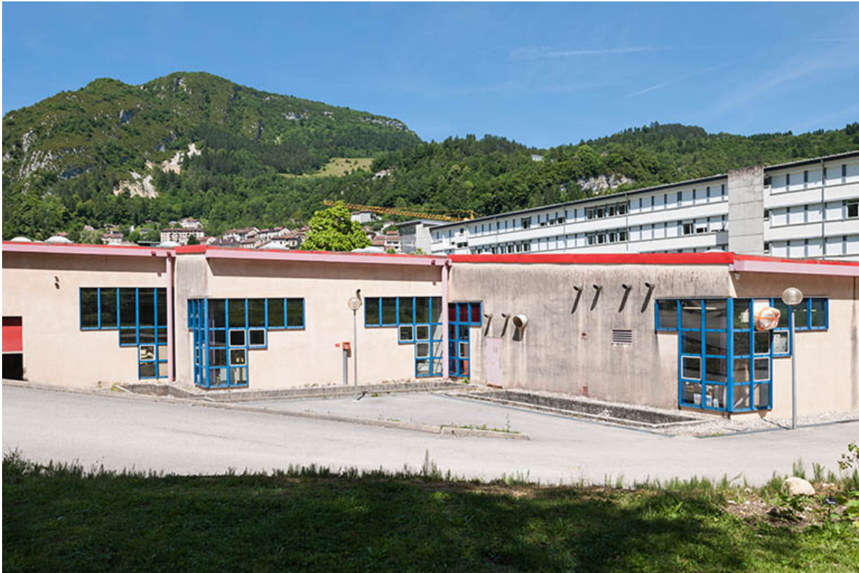
Atelier, ancien atelier mécanique : façade latérale Sud.