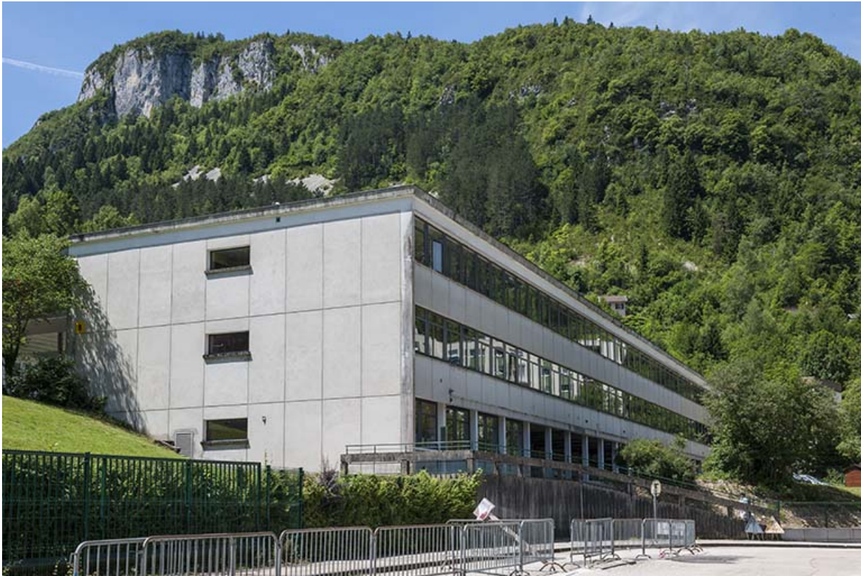
Externat : façade postérieure.