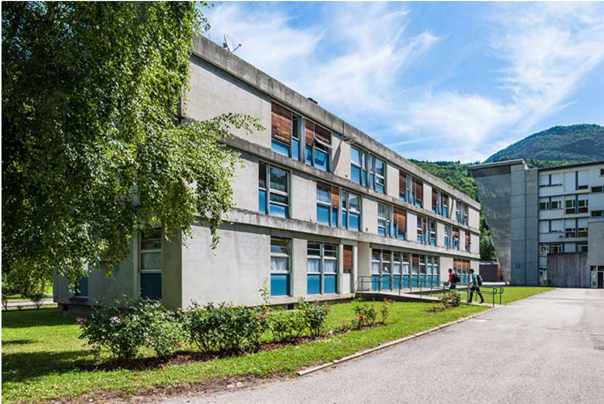
Administration : façade postérieure.