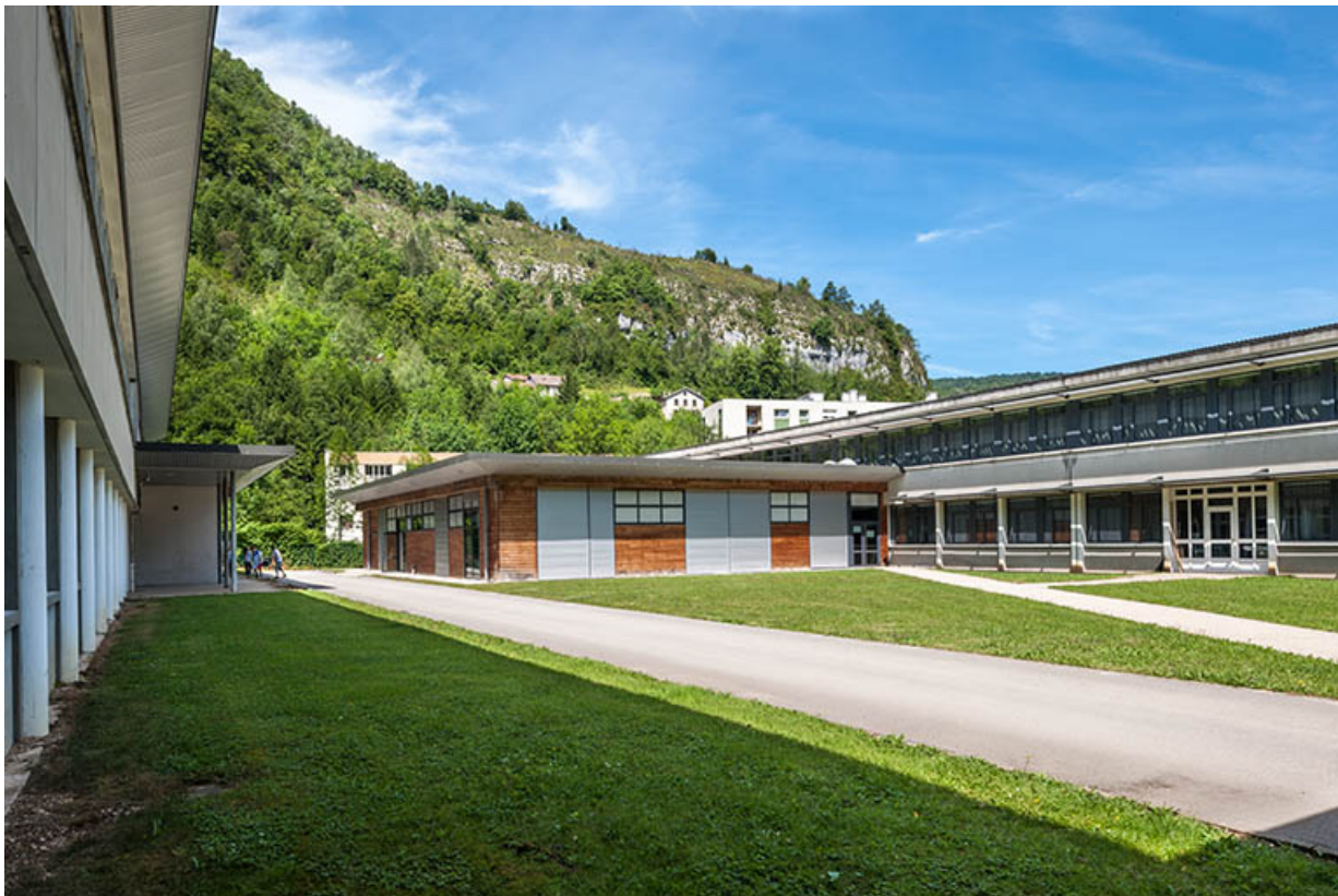
Cour entre ateliers et externat tertiaire. Au fond, l'extension du bâtiment d'externat.