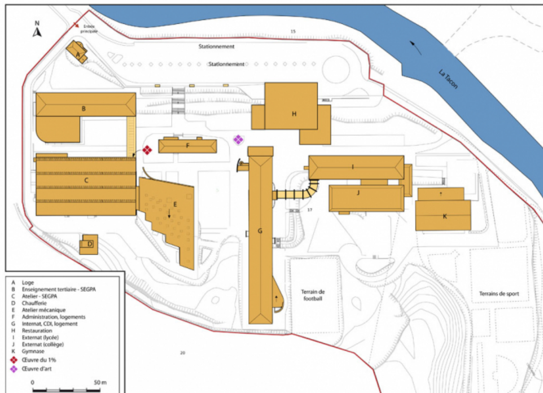
Plan-masse et de situation. Extrait du plan cadastral numérisé 2011, section AW, échelle 1/1 500. 39, Saint-Claude rue du Tomachon