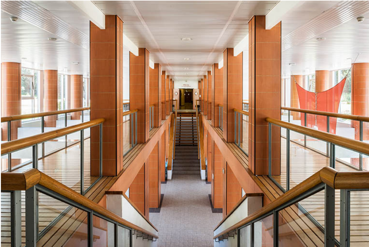
Internat : coursives et escaliers du 1er étage.