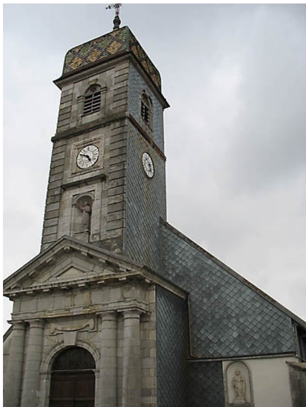
vue de trois quarts sur le clocher, le bas-côté sud-ouest essenté et le fronton de la porte d'entrée. 39, La Chaux-du-Dombief Grande Rue