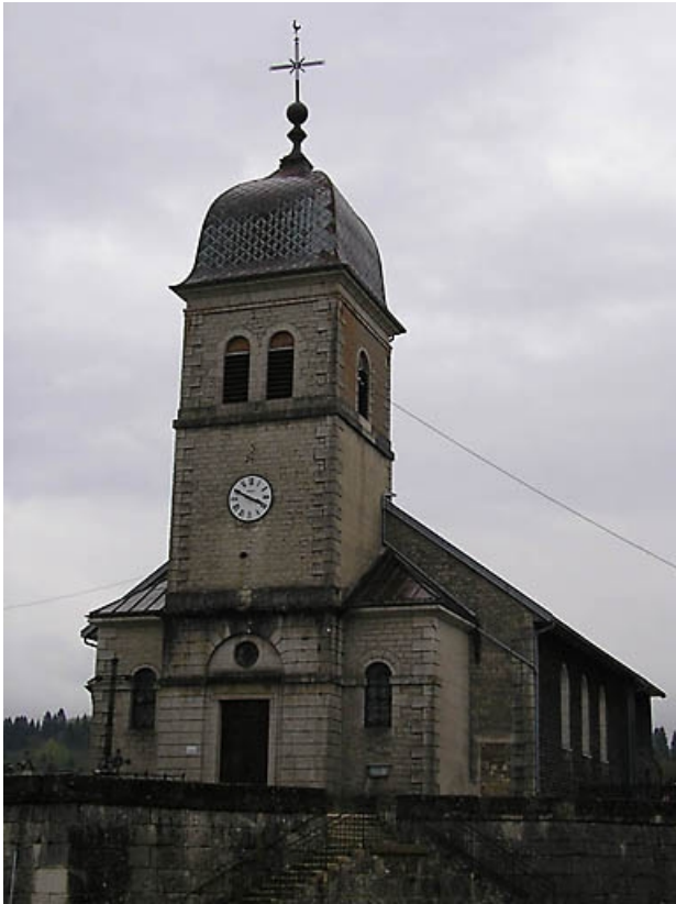
vue de trois quarts.