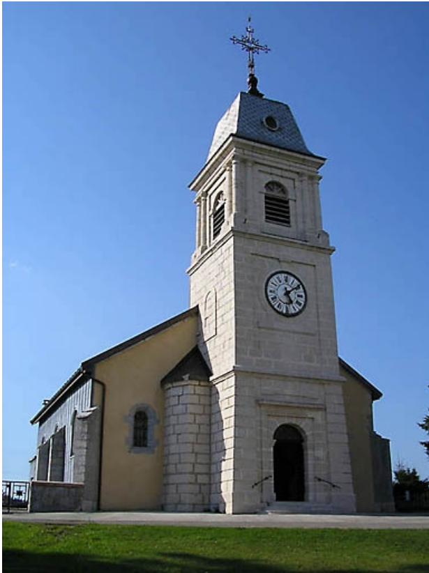
Vue générale de la la façade antérieure, des bas-côtés et du clocher.