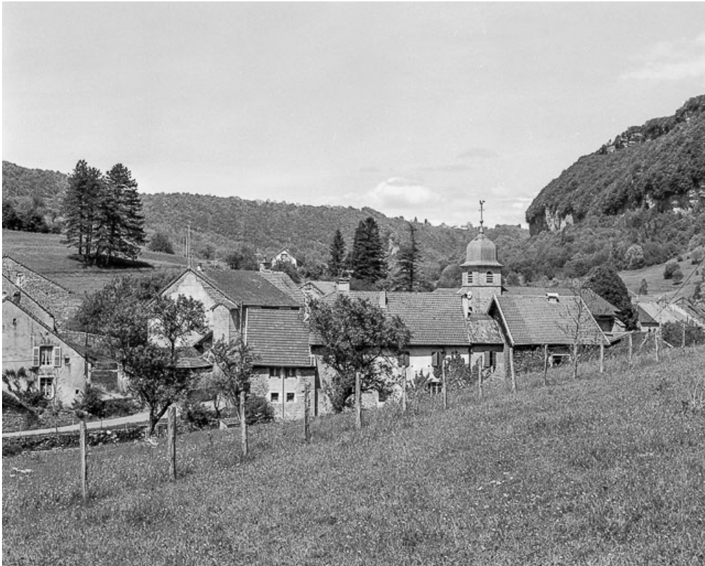
Vue d'une partie du village.