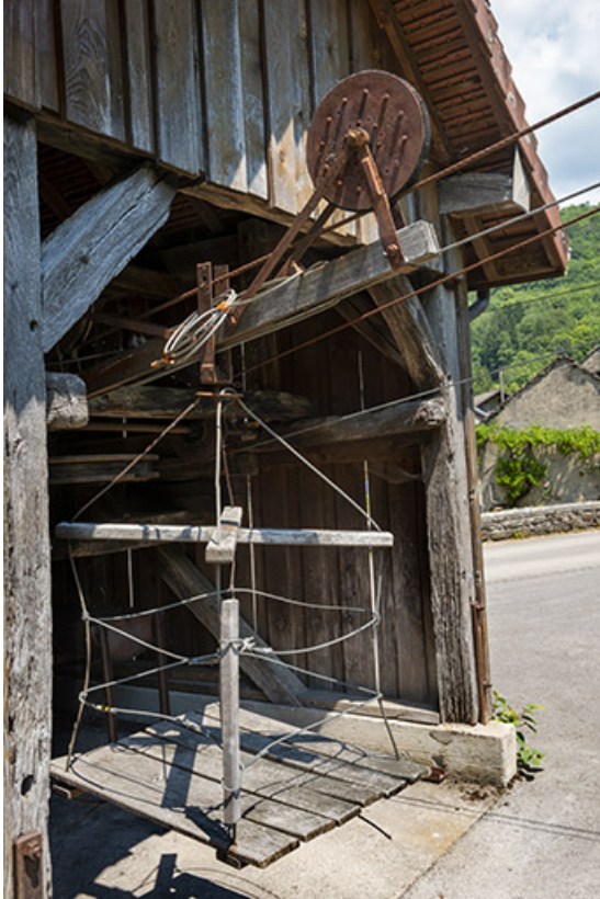
2020. Transporteur automatique par cables : vue de la cage de dépôt des bidons. 39, Blois-sur-Seille