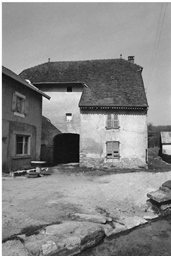
Maison cadastrée 1964 AB 106 : façade antérieure. 39, Blois-sur-Seille