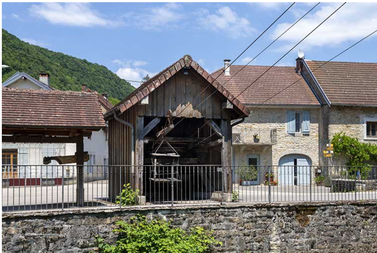
2020. Vue d'ensemble du transporteur automatique par câbles. 39, Blois-sur-Seille