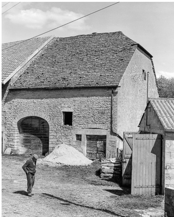
Façade antérieure. 39, Blois-sur-Seille