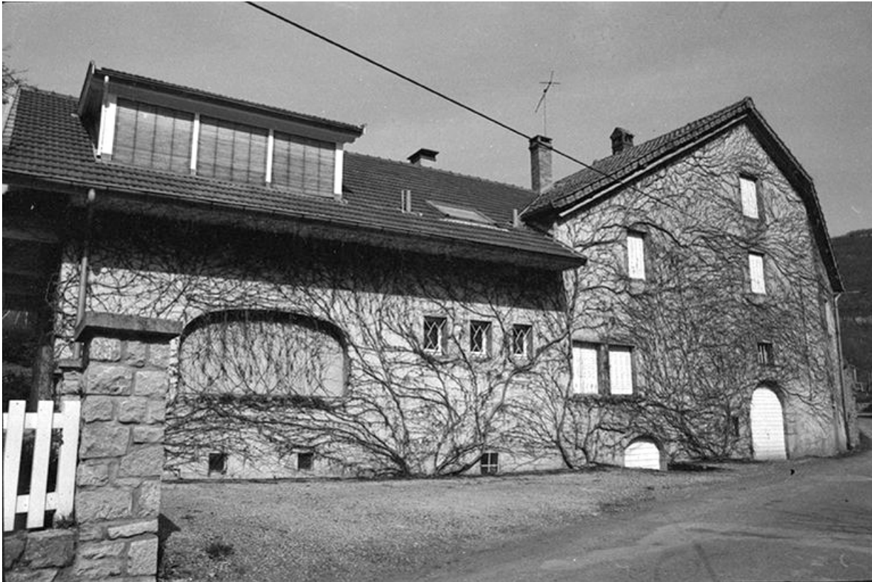
Maison cadastrée 1964 AB 13 : façade antérieure. 39, Blois-sur-Seille