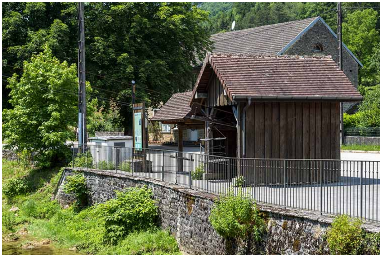
2020. Vue du transporteur automatique par câbles, de trois quarts droit. 39, Blois-sur-Seille