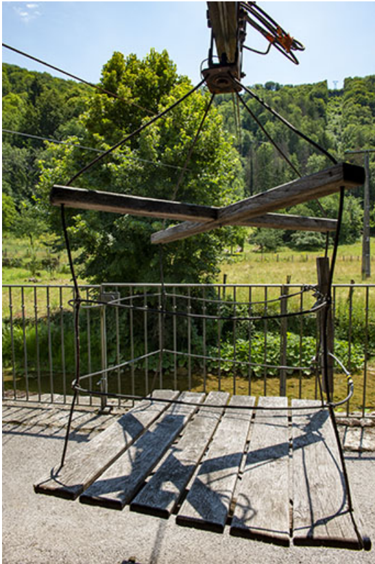
2020. Vue du treuil du transporteur automatique par cables. 39, Blois-sur-Seille