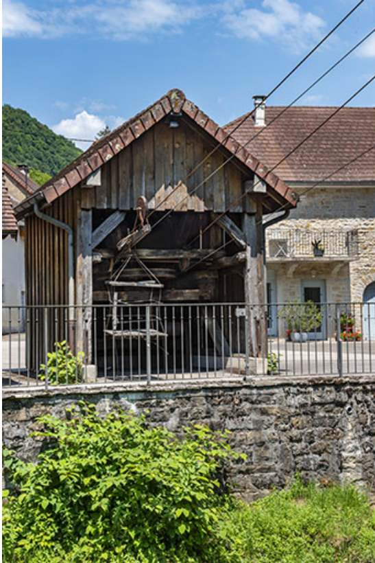
2020. Vue rapprochée du transporteur automatique par câbles.