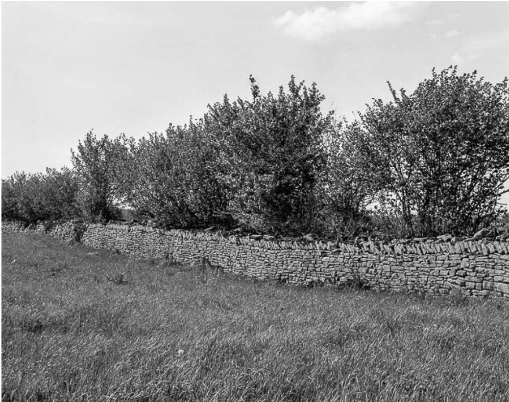
Mur en pierre sèche au lieudit Chaumois-Boivin.