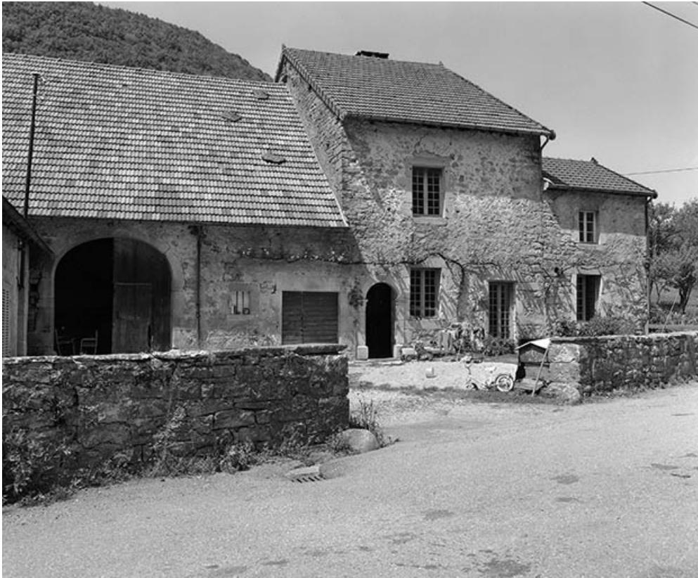
Façade antérieure vue de trois quarts gauche.