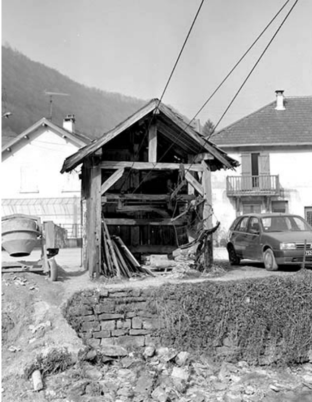
Vue d'ensemble du transporteur automatique par câble. Le local abrite un treuil permettant d'acheminer le lait, collecté sur le plateau, à la fromagerie du village.