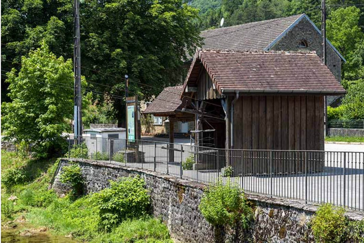
2020. Vue du transporteur automatique par câbles, de trois quarts droit. 39, Blois-sur-Seille