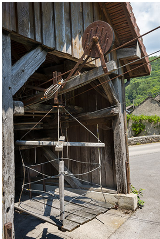
2020. Transporteur automatique par câbles : vue de la cage de dépôt des bidons. 39, Blois-sur-Seille