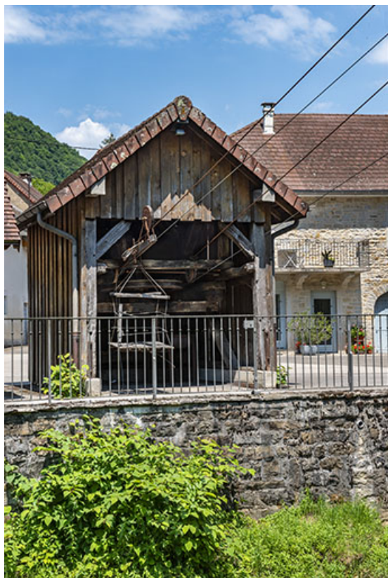
2020. Vue rapprochée du transporteur automatique par câbles. 39, Blois-sur-Seille