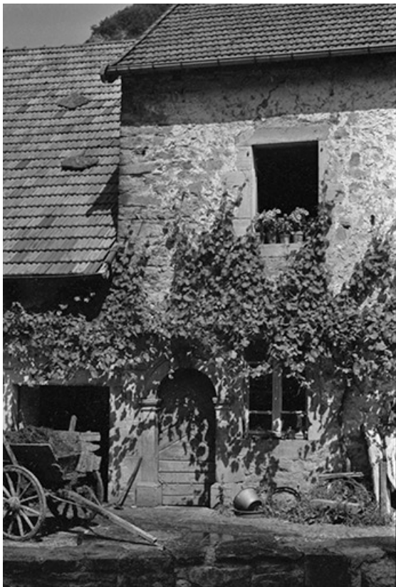
Ancien presbytère. 39, Blois-sur-Seille