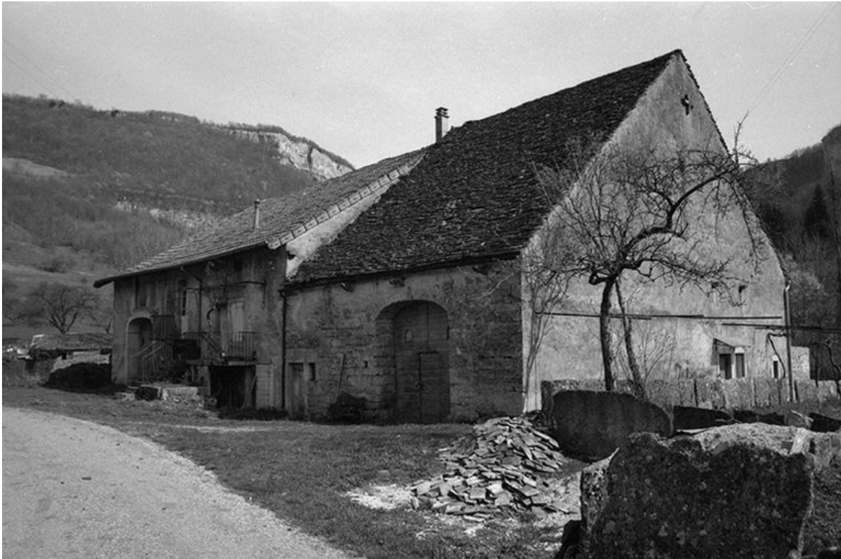
Façades antérieure et latérale droite en 1974.