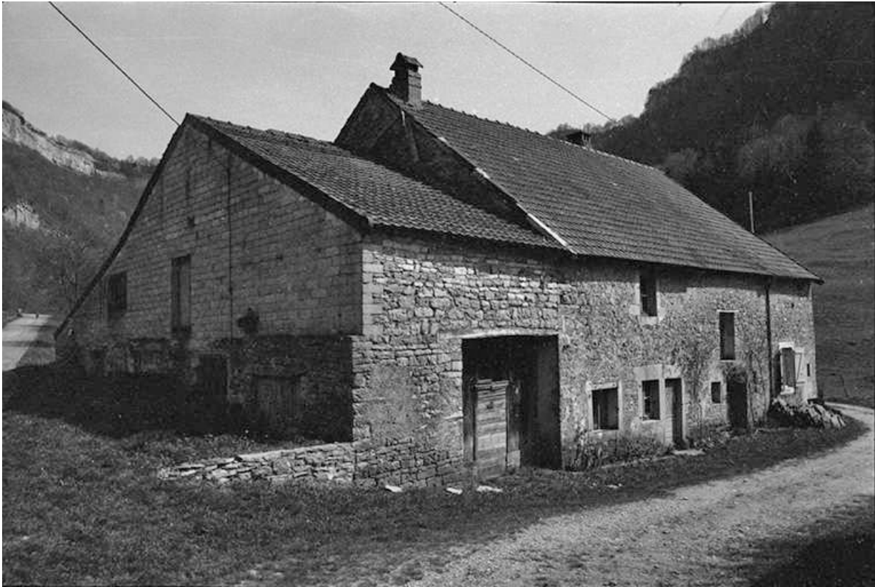
Ferme cadastrée 1964 AB 145 située le long du chemin communal du Mont de Blois à La Marre : façades antérieure et latérale gauche.