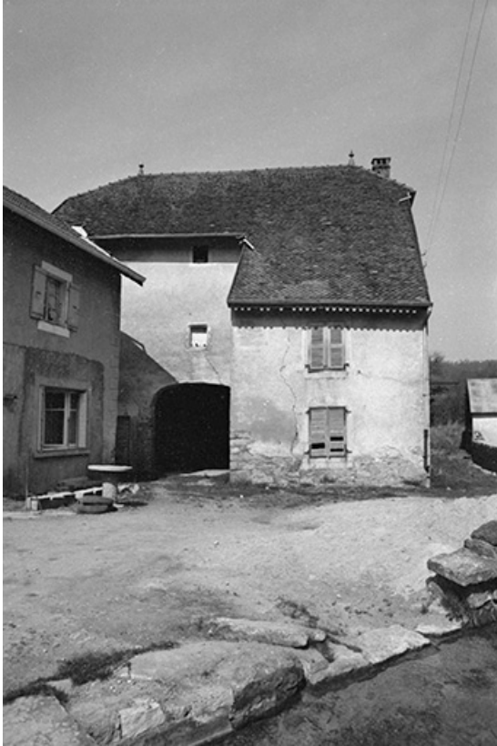
Maison cadastrée 1964 AB 106 : façade antérieure. 39, Blois-sur-Seille