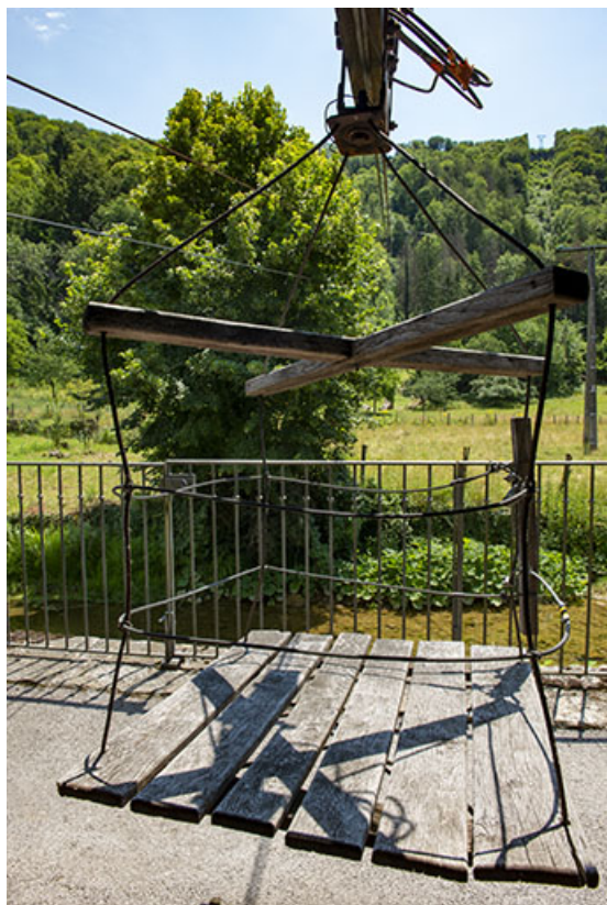
2020. Vue du treuil du transporteur automatique par cables. 39, Blois-sur-Seille