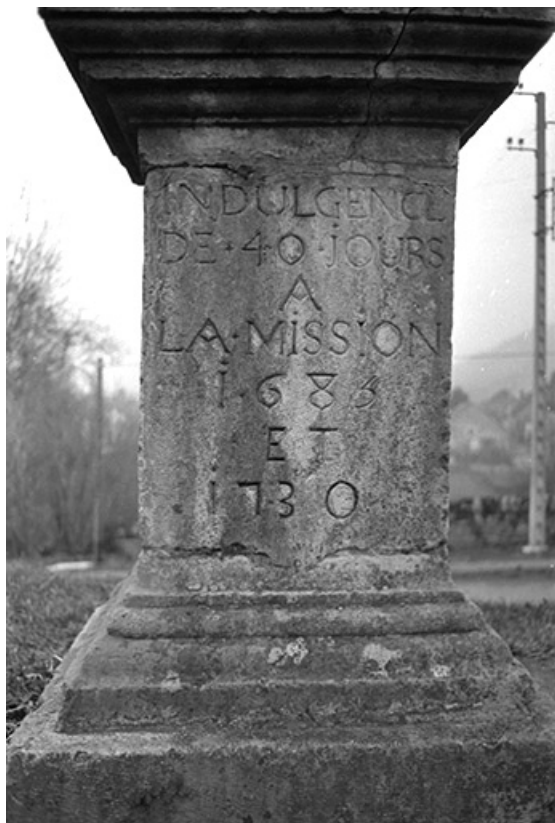
Croix de mission, pierre et fer forgé : détail de la base et de son inscription "Indulgence à la mission 1683 et 1730". 39, Voiteur