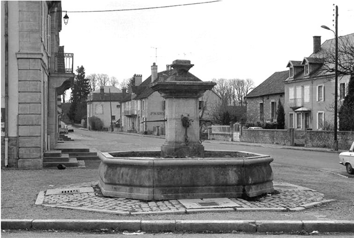
Fontaine, 19ème siècle : vue d'ensemble 39, Voiteur