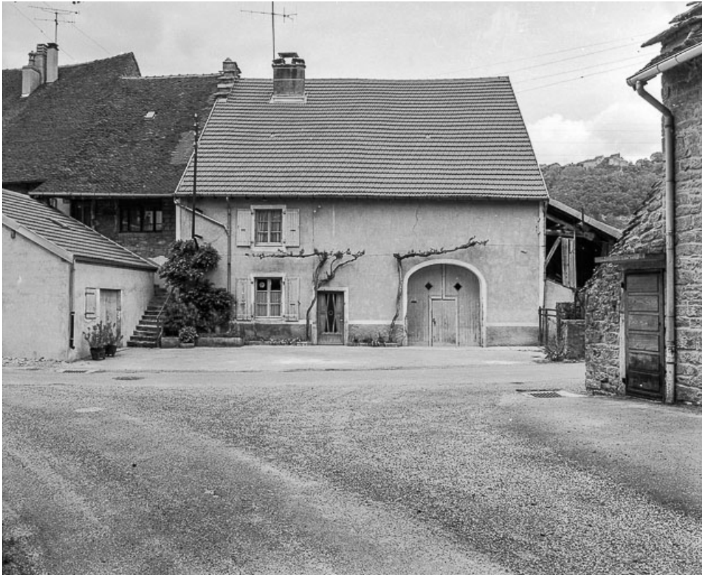
Ferme cadastrée 1961 AH 116, située rue du Chalet : façade sur rue. 39, Voiteur