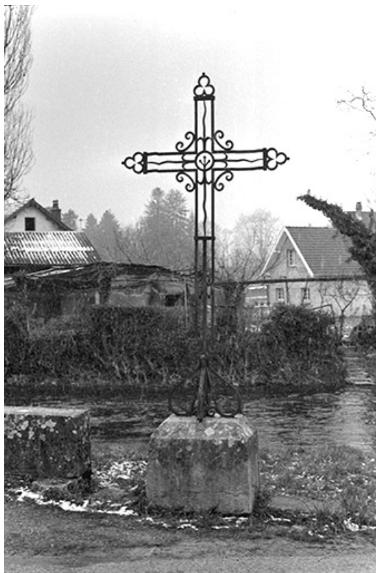
Croix de chemin, 19e siècle : vue d'ensemble 39, Voiteur