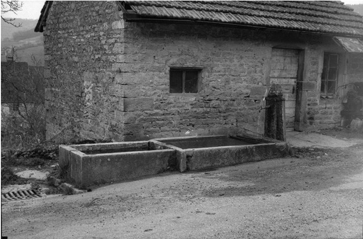
Fontaine : vue d'ensemble.