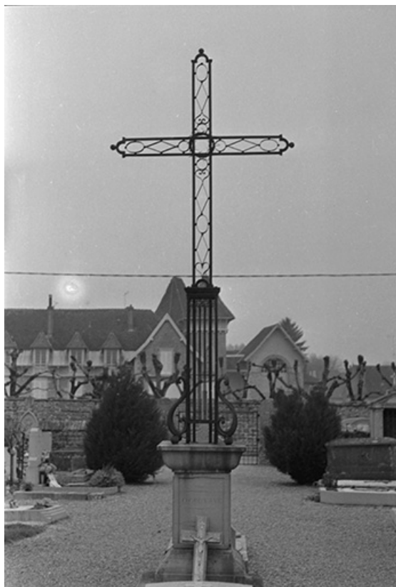
Croix de cimetière, 19ème siècle : vue d'ensemble 39, Voiteur