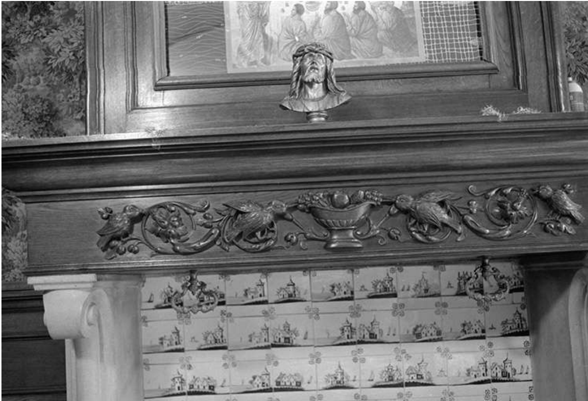
Foyer sainte Marthe : linteau de cheminée en bois sculpté.