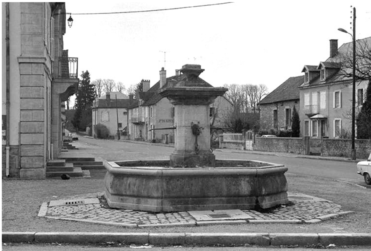
Fontaine, 19ème siècle : vue d'ensemble 39, Voiteur