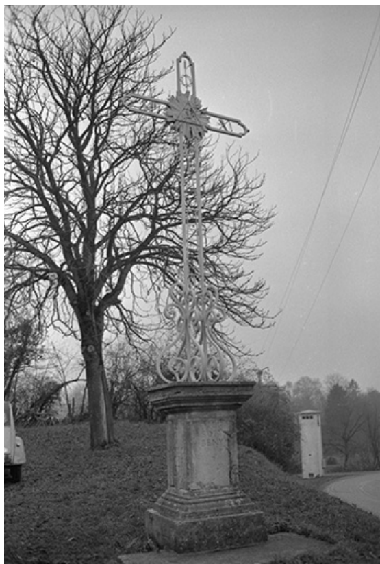
Croix de mission, pierre et fer forgé : vue d'ensemble 39, Voiteur