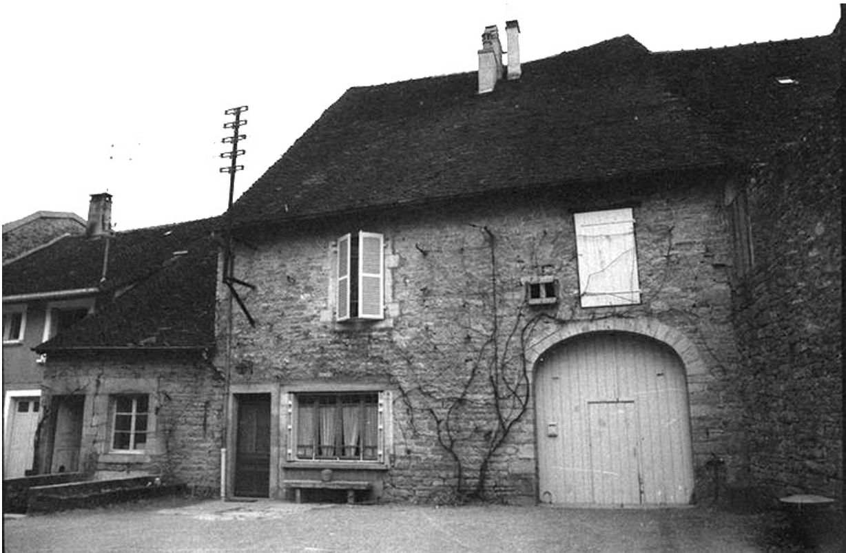
Ferme cadastrée 1961 AH 115, située rue du Presbytère : façade antérieure. 39, Voiteur