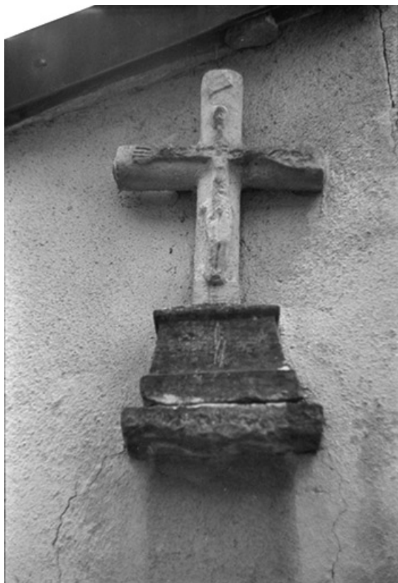
Fragment de calvaire encastré dans une façade : Christ en croix 39, Voiteur