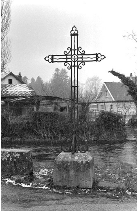
Croix de chemin, 19e siècle : vue d'ensemble 39, Voiteur