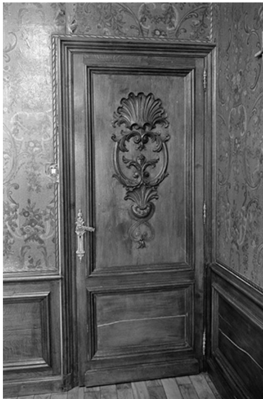
Foyer sainte Marthe : porte en bois sculpté, 20ème siècle. 39, Voiteur