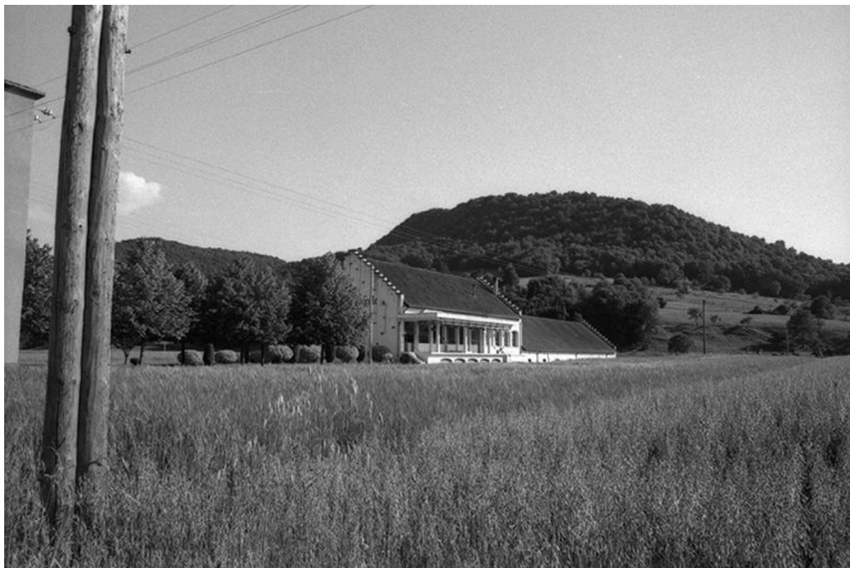
Coopérative vinicole située le long du chemin départemental n° 70 de Lons-le-Saunier à Voiteur : vue d'ensemble. 39, Voiteur