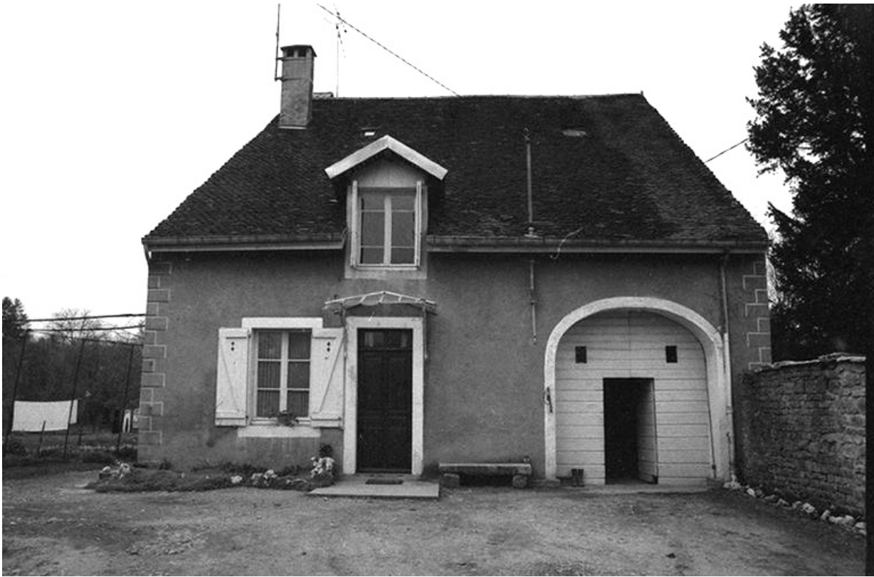
Maison cadastrée 1961 AH 56, située rue du Presbytère : façade antérieure.