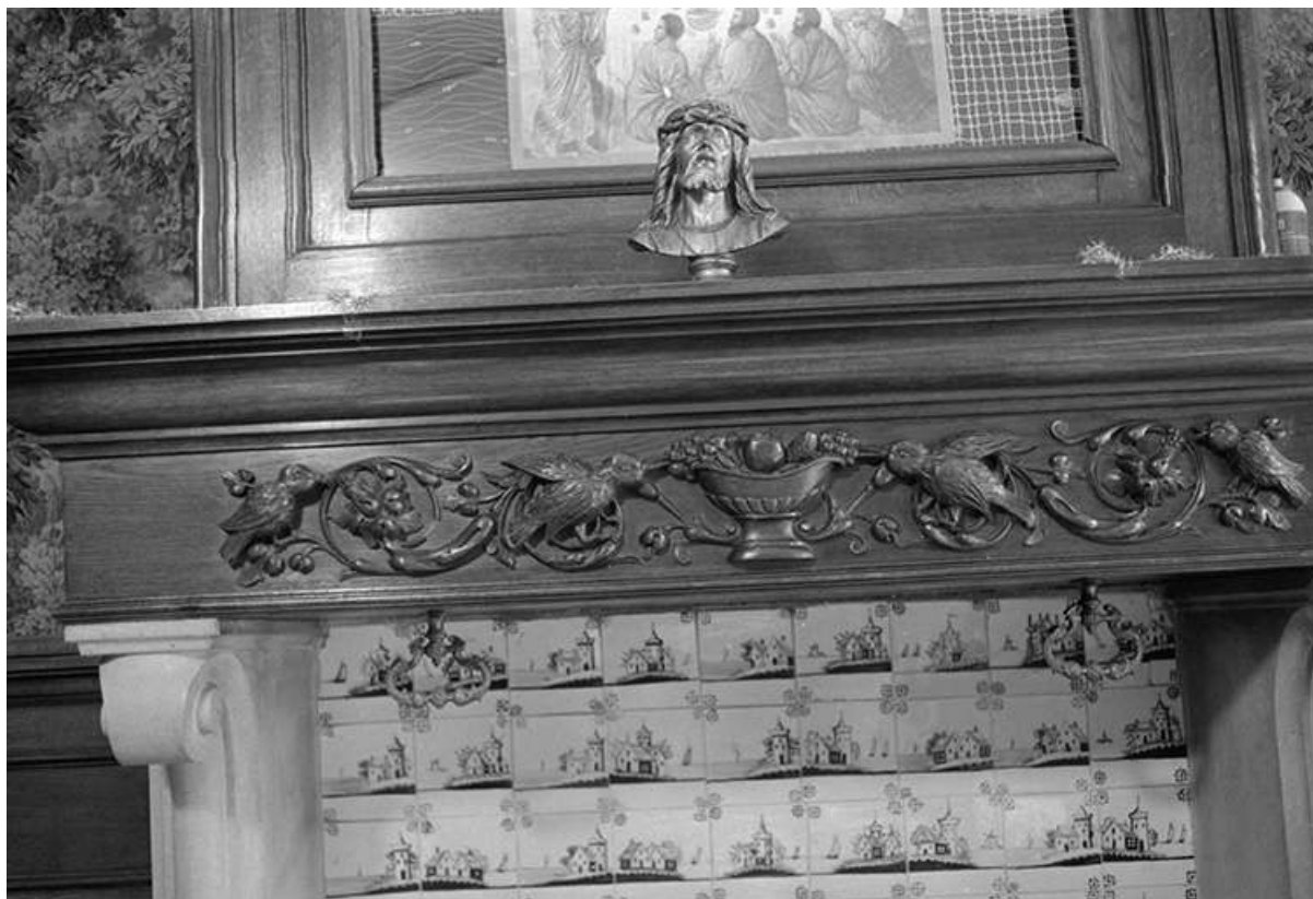
Foyer sainte Marthe : linteau de cheminée en bois sculpté. 39, Voiteur