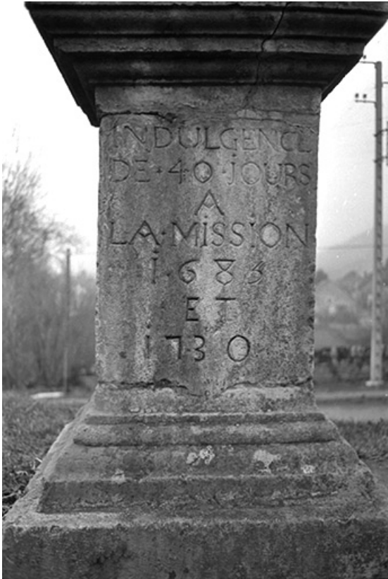
Croix de mission, pierre et fer forgé : détail de la base et de son inscription "Indulgence à la mission 1683 et 1730". 39, Voiteur