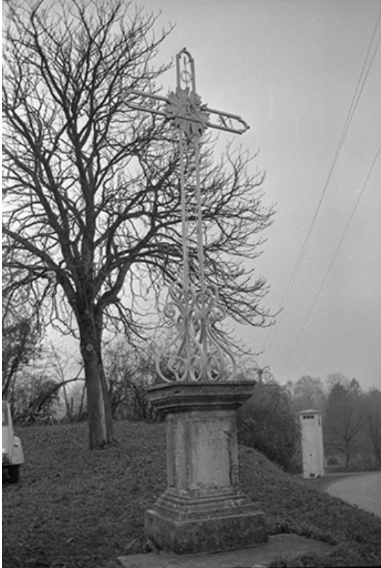
Croix de mission, pierre et fer forgé : vue d'ensemble 39, Voiteur