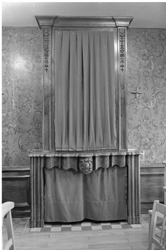
Foyer sainte Marthe : cheminée en bois sculpté et pierre. 39, Voiteur