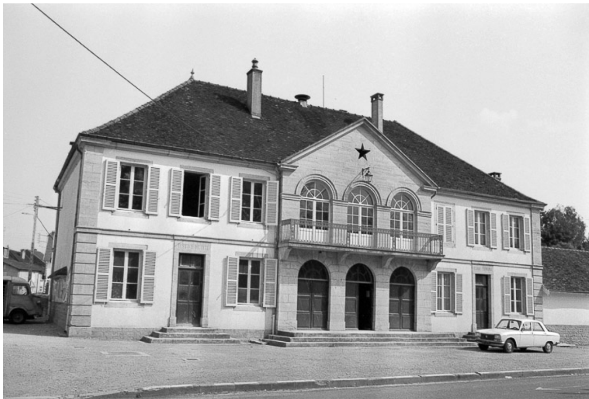
Façade sur rue.