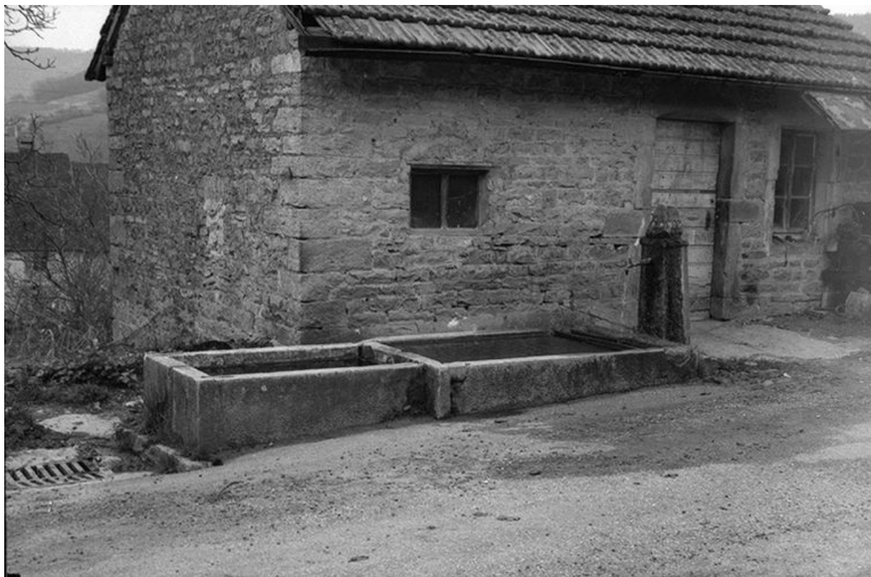
Fontaine : vue d'ensemble.