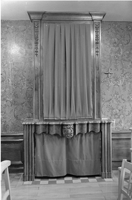
Foyer sainte Marthe : cheminée en bois sculpté et pierre. 39, Voiteur