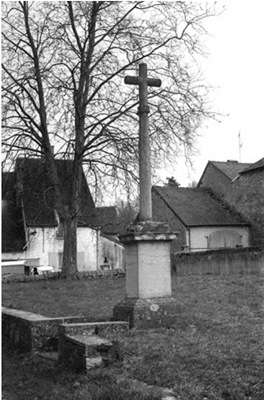
Croix monumentale, pierre, 18ème siècle : vue d'ensemble 39, Saint-Germain-lès-Arlay