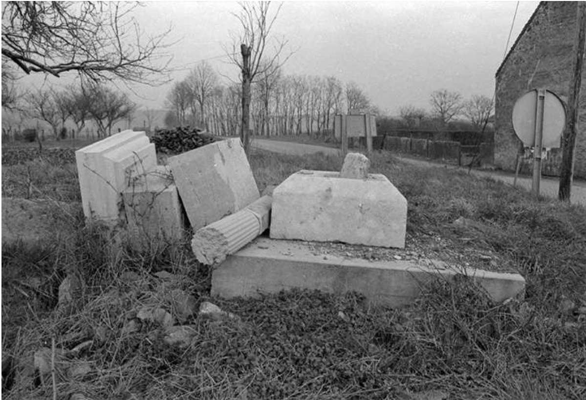
Croix de mission, calcaire, 16-19ème siècles : vue des fragments à terre 39, Saint-Germain-lès-Arlay