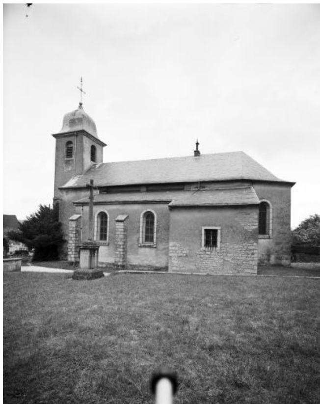
Façade latérale droite.