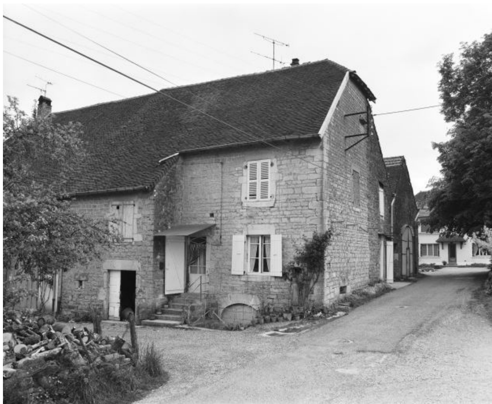
Façade antérieure et latérale droite.