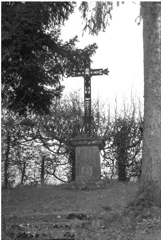
Croix de chemin, calcaire, fer forgé et fonte, 1888 : vue d'ensemble 39, Saint-Germain-lès-Arlay