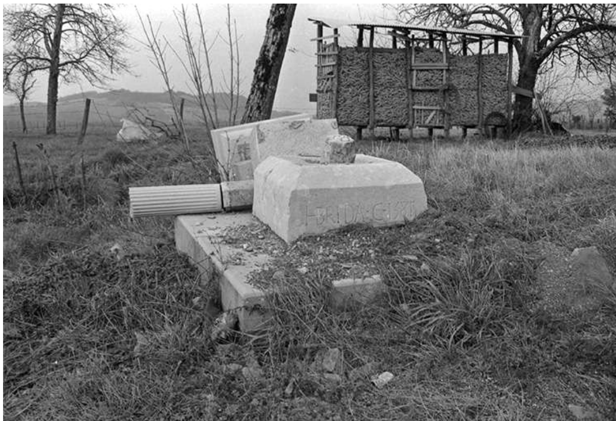
Croix de mission, calcaire, 16-19ème siècles : vue des fragments à terre 39, Saint-Germain-lès-Arlay