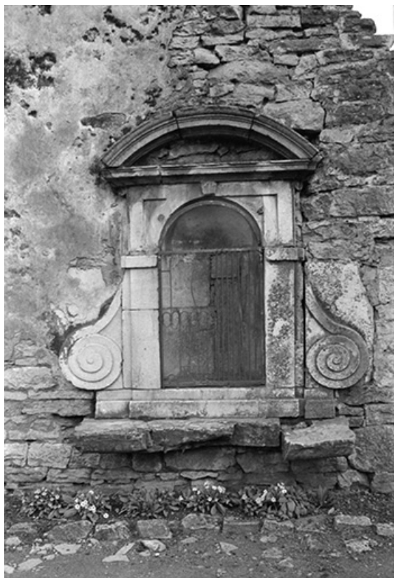
Oratoire de saint Claude, pierre, 17ème siècle : vue de face 39, Saint-Germain-lès-Arlay