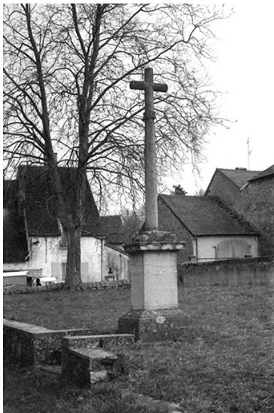
Croix monumentale, pierre, 18ème siècle : vue d'ensemble 39, Saint-Germain-lès-Arlay