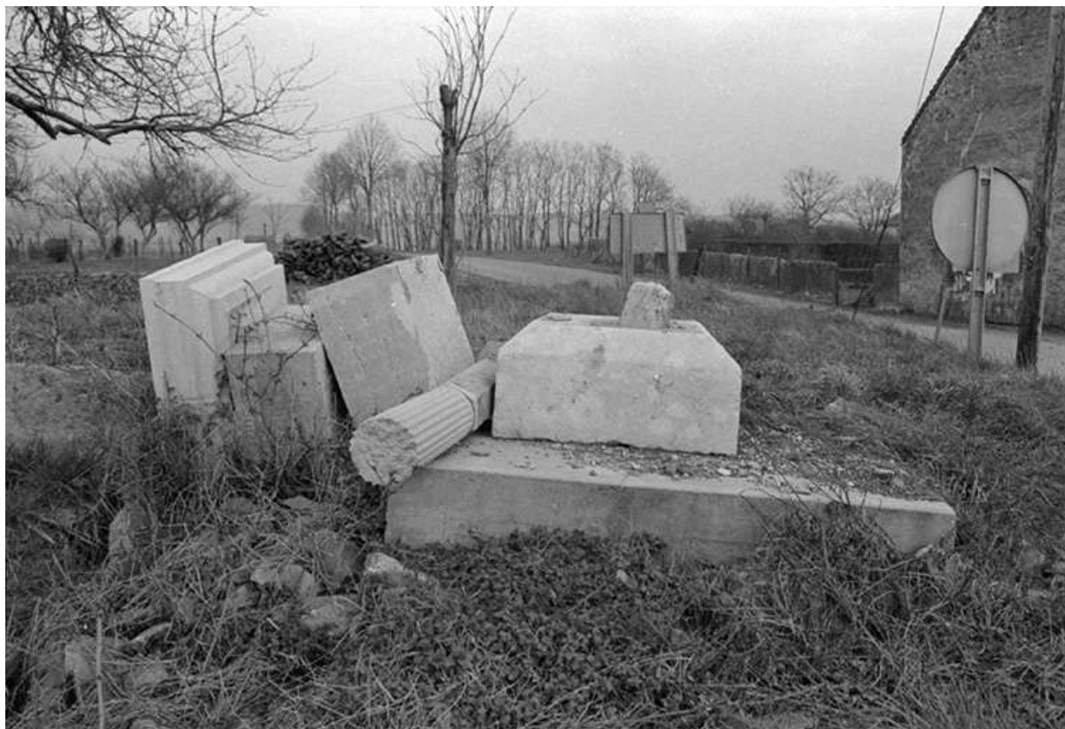
Croix de mission, calcaire, 16-19ème siècles : vue des fragments à terre 39, Saint-Germain-lès-Arlay