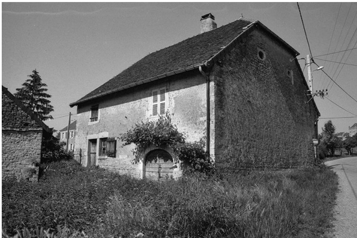
Ferme cadastrée 1951 A3 242 située le long du chemin vicinal ordinaire du Pin à Montain : façade antérieure. 39, Le Pin