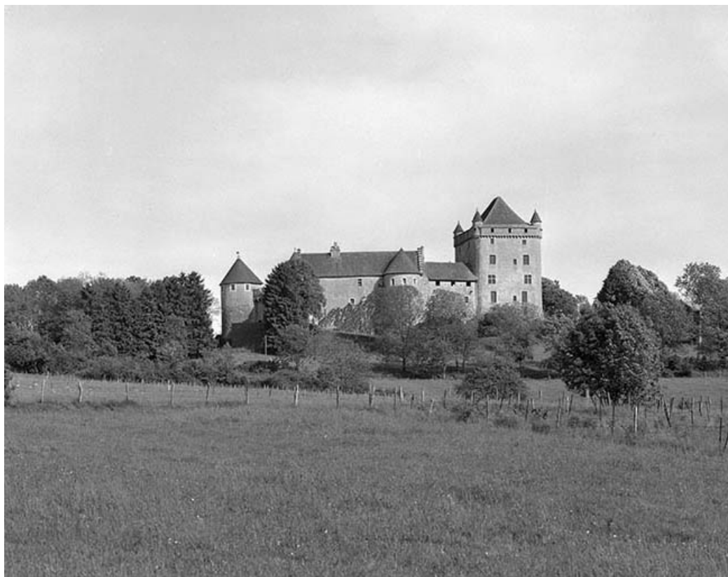
Façade ouest : vue éloignée.