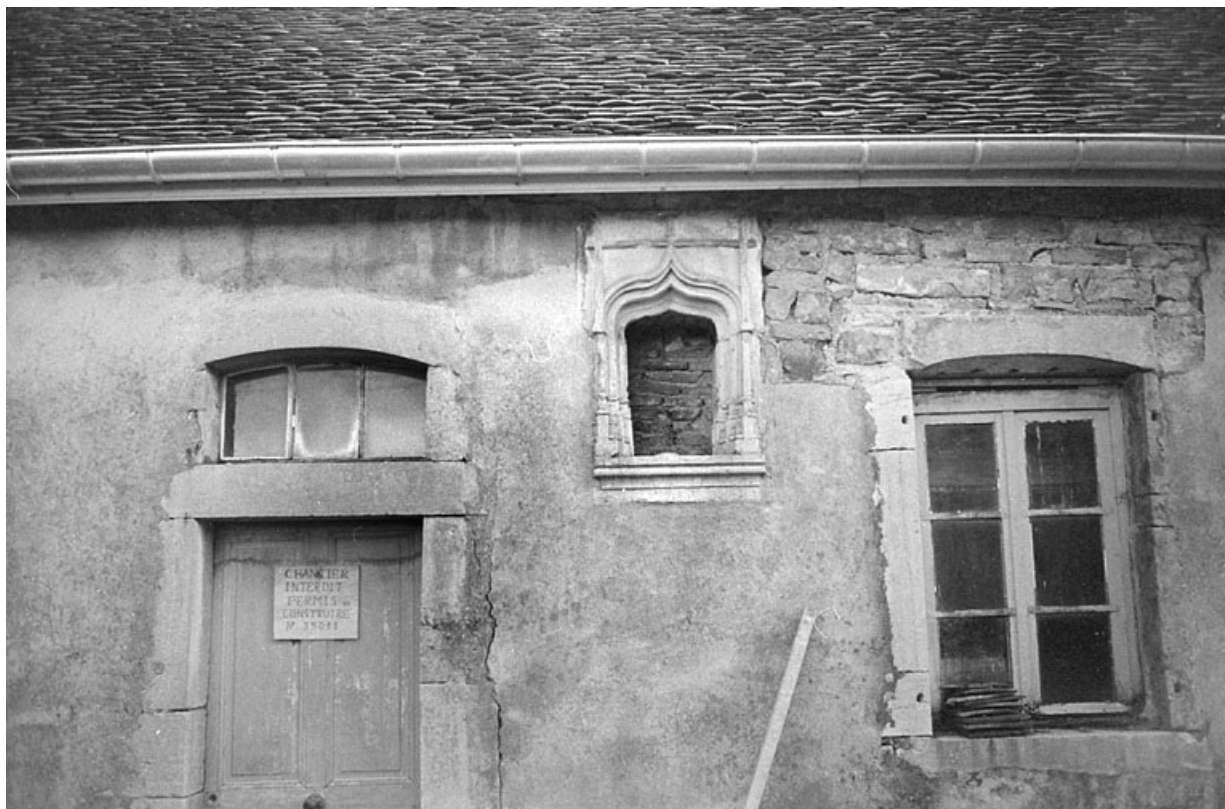
Maison : niche en façade.