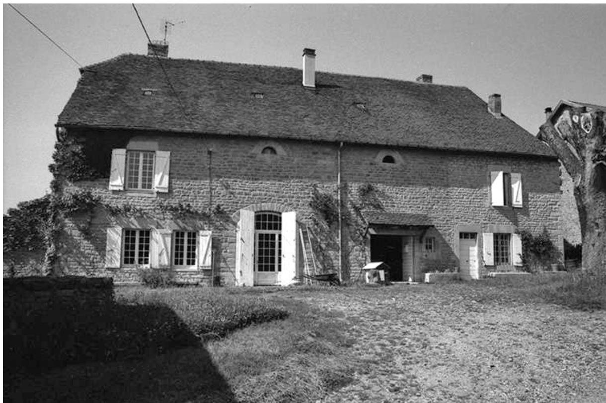
Ferme cadastrée 1951 B1 située le long du chemin départemental n° 208 du Pin à Lons-le-Saunier : façade antérieure. 39, Le Pin