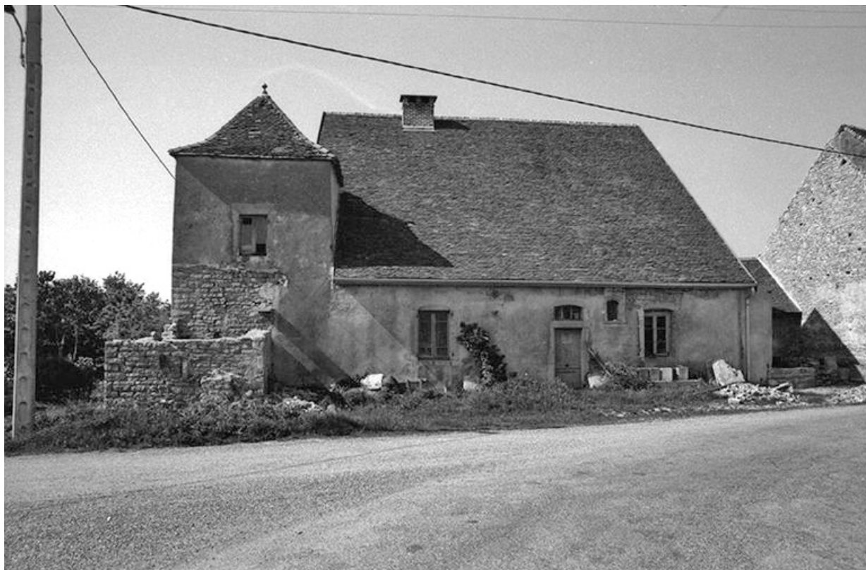
Ferme cadastrée 1951 A3 280 située le long du chemin départemental n° 208 du Pin à Lons-le-Saunier : façade antérieure. 39, Le Pin