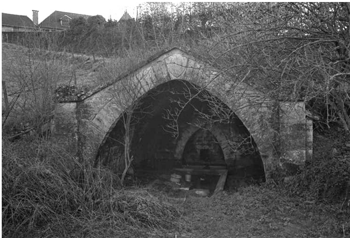
Vue rapprochée en 1974