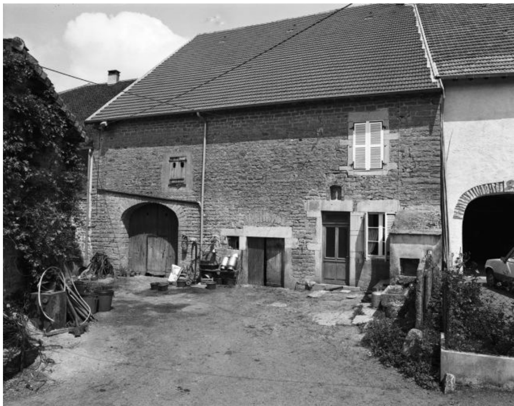
Façade antérieure. 39, Montain