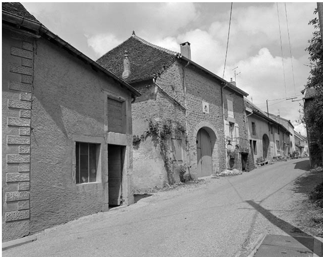
Façade antérieure, vue de trois quarts gauche. 39, Montain