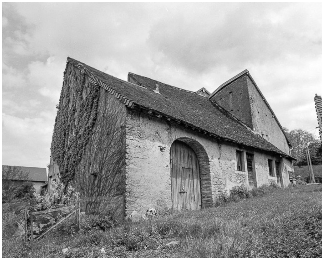
Ferme cadastrée 1952 U2 363, située rue Chateraine : vue d'ensemble. 39, Montain