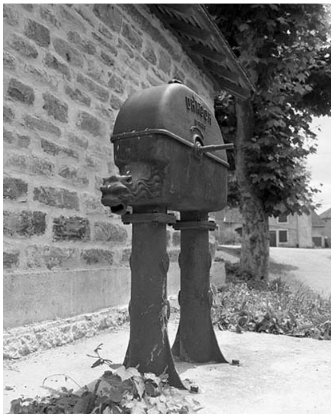
Pompe en 1982. 39, Montain