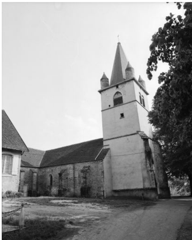
Tour-clocher et façade latérale gauche. 39, Montain