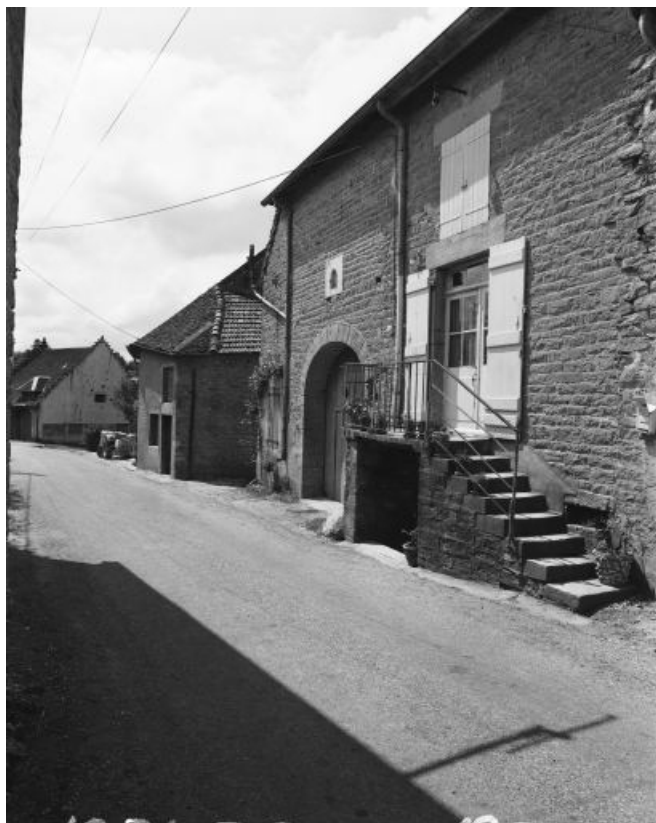
Façade antérieure. 39, Montain