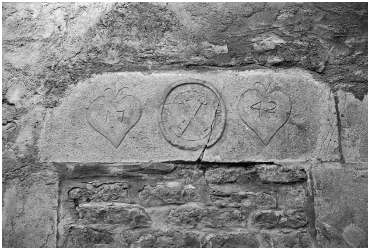
Linteau représentant deux coeurs et deux clefs croisées, 1742 : vue de face 39, Montain