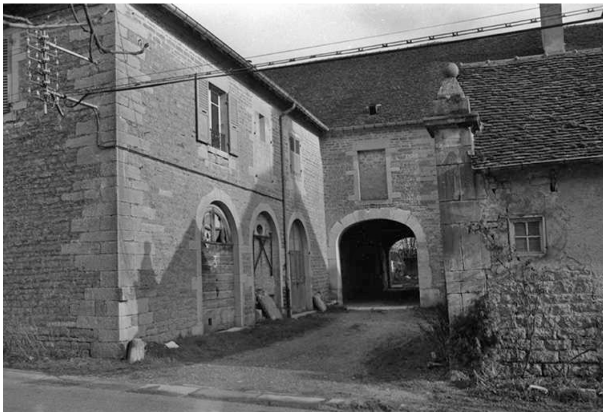
Relais de poste, 1699 : vue du porche d'entrée depuis la rue. 39, Montain