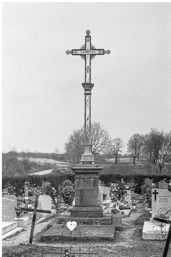
Croix cimetière en calcaire, fer forgé et tôle, XIXe siècle : vue générale. 39, La Marre