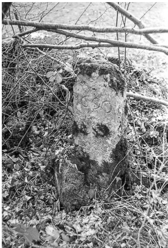
Borne en calcaire, 1690 : vue générale. 39, La Marre