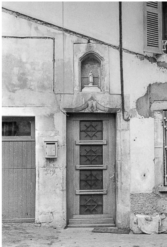
Maison, XVIe siècle : porte surmontée d'une niche avec une Vierge 39, La Marre