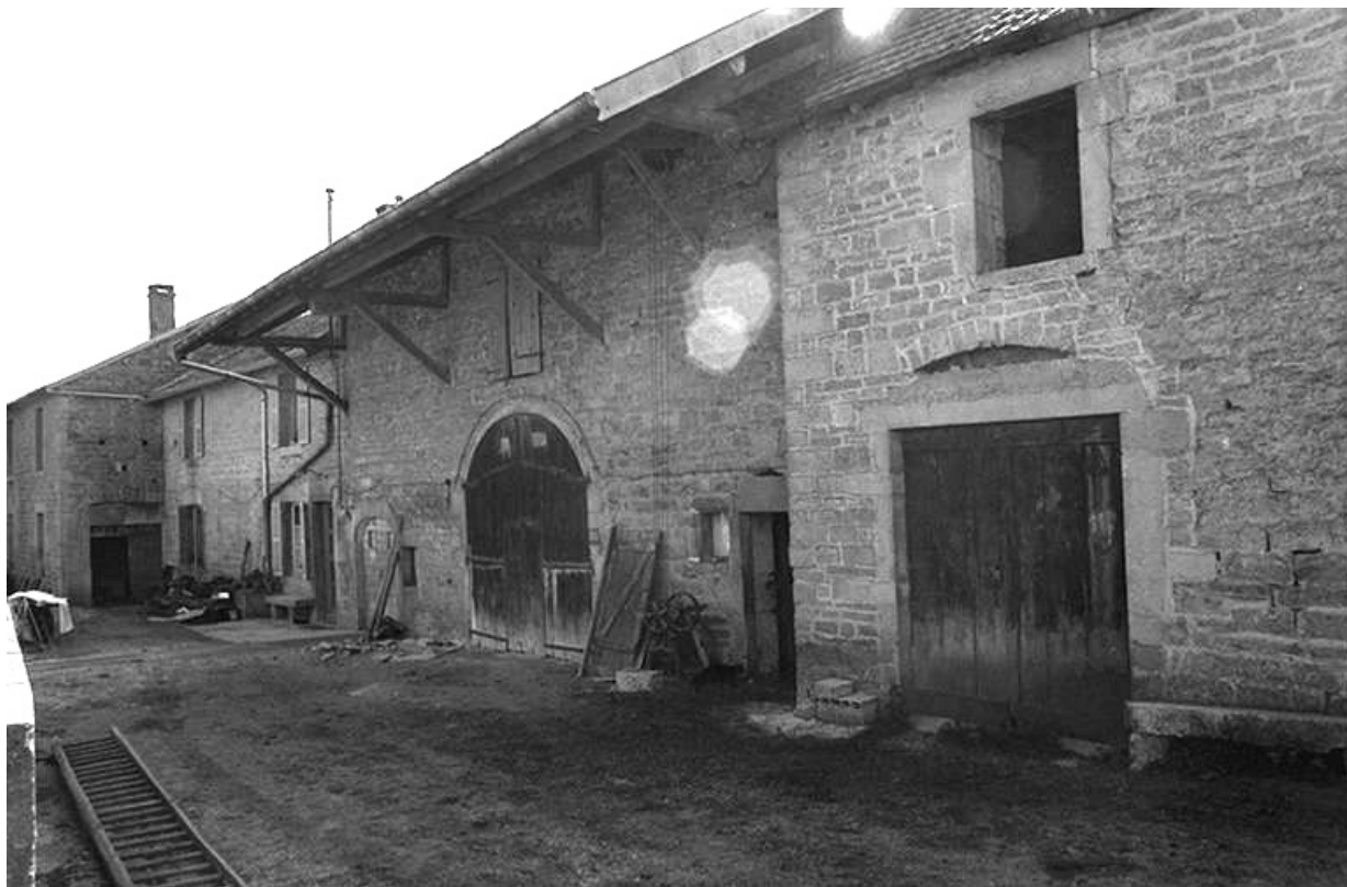
Ferme cadastrée 1957 A1 116, située le long du chemin de grande communication n° 96 de Plasne à Mirebel : façade antérieure. 39, La Marre