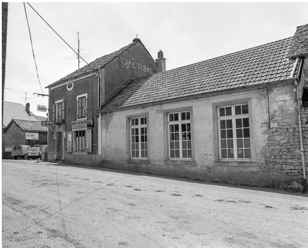
Ecole située route de Mirebel : façade antérieure. 39, La Marre