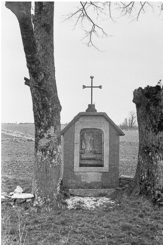
Oratoire de chemin, 1883 : vue générale. 39, La Marre