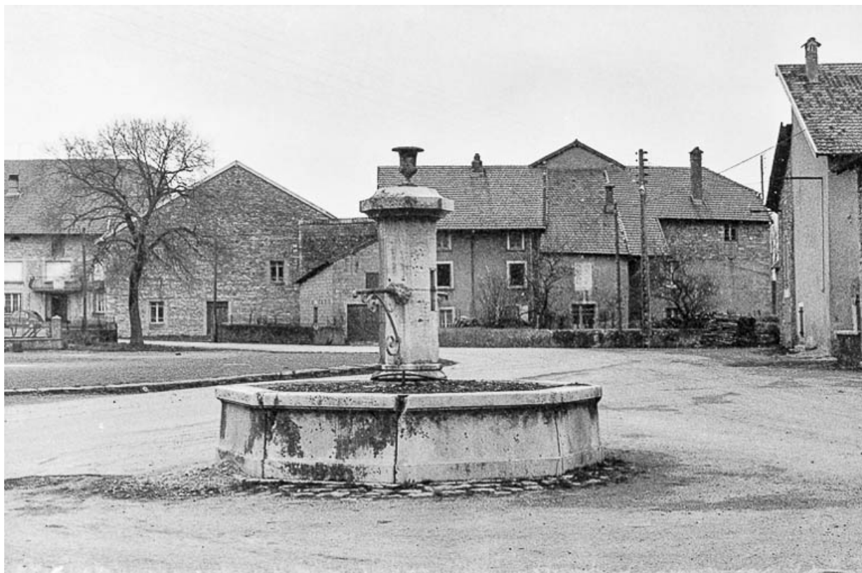
Fontaine en calcaire, XIXe siècle : vue d'ensemble