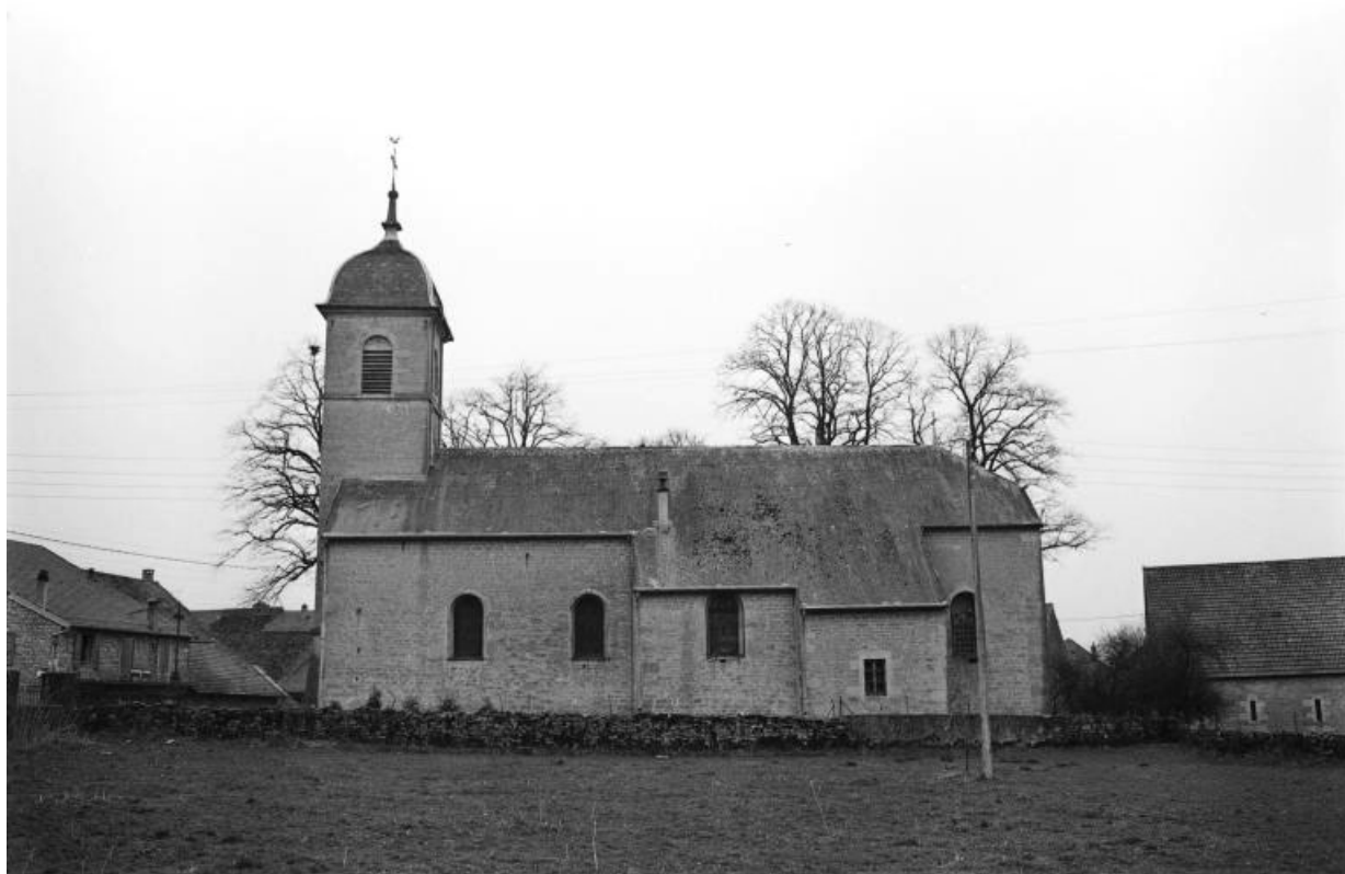
Façade latérale droite.