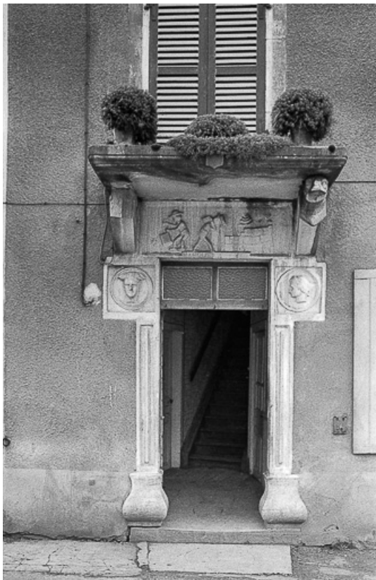
Maison : porte surmontée d'un linteau en bas-relief et d'un auvent, XIXe siècle 39, La Marre