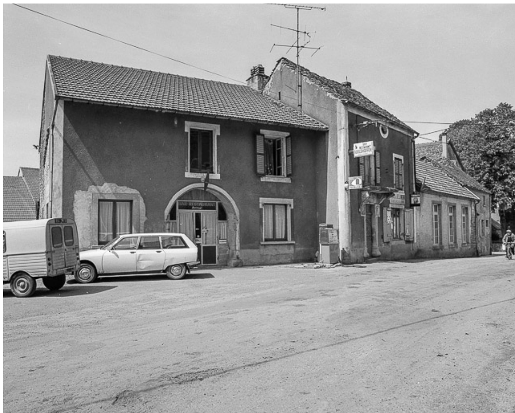
Café-restaurant cadastré 1957 A1 132 situé route de Mirebel : vue d'ensemble. 39, La Marre