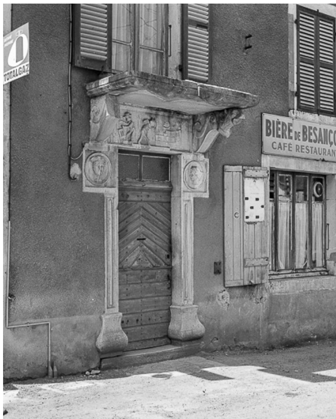
Café-restaurant cadastré 1957 A1 132 situé route de Mirebel : porte d'entrée avec décor en bas-relief et colonnes. 39, La Marre