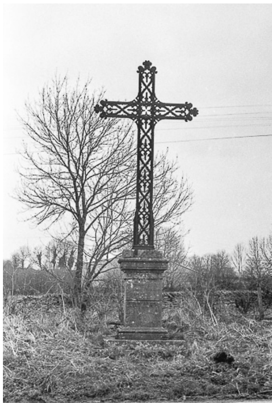
Croix de chemin en calcaire, fer forgé et fonte, 1852 : vue générale. 39, La Marre