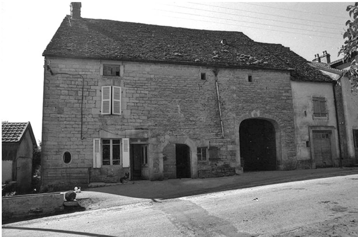
Façade antérieure vue de face en 1974.