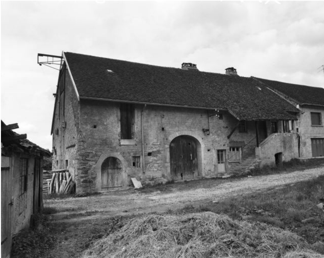
Façade antérieure, vue de trois quarts gauche.