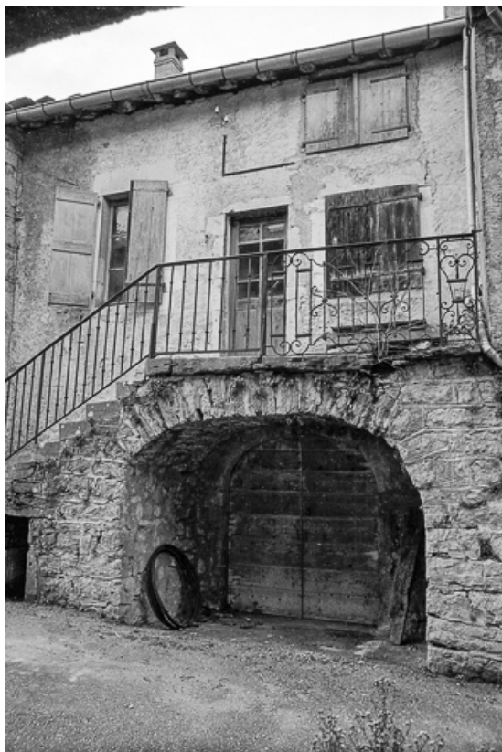
Façade antérieure en 1974.