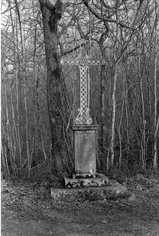
Croix de mission en pierre, fer forgé et fonte, 1875 : vue de face. 39, Lavigny