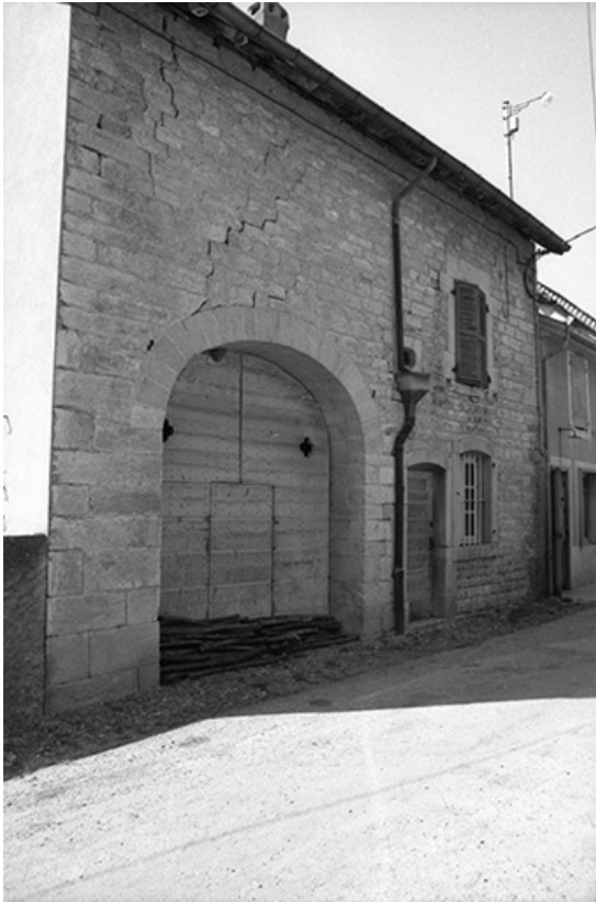
Ferme cadastrée 1967 AH 87, située le long du chemin départemental n° 209 E : façade antérieure vue de trois-quarts gauche. 39, Lavigny