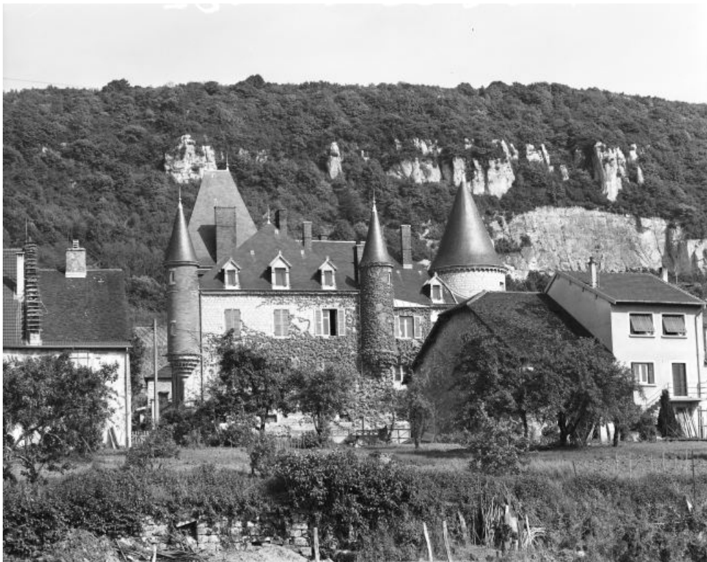
Vue de situation en 1981.