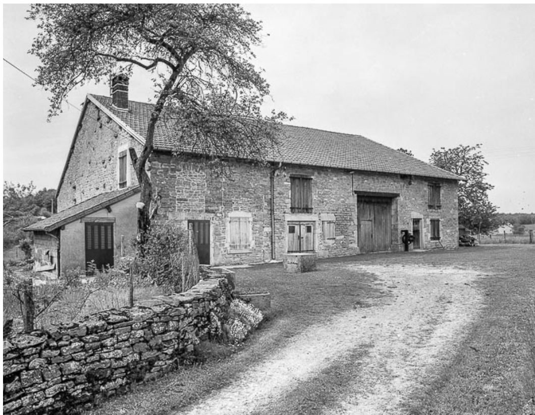
Ferme : façade antérieure.