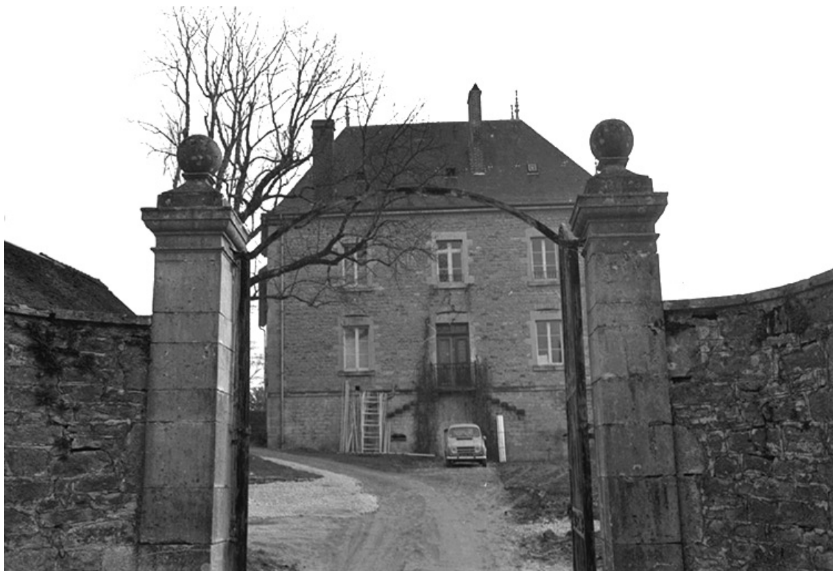
Demeure, XIXe siècle : vue du portail et de la façade 39, Lavigny