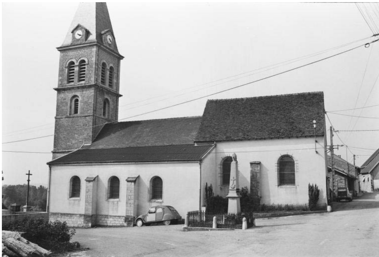
Façade latérale droite.