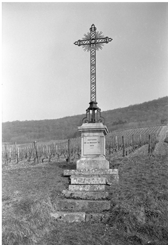
Croix de mission en pierre, fer forgé et fonte, 1874 : vue de face. 39, Lavigny