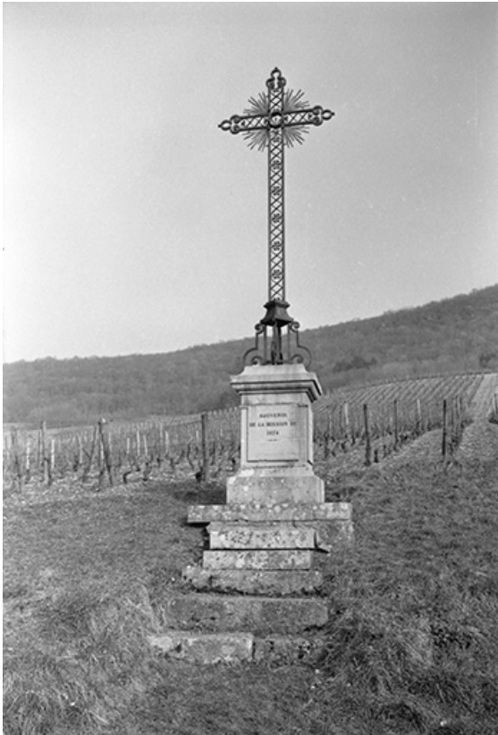
Croix de mission en pierre, fer forgé et fonte, 1874 : vue de face. 39, Lavigny