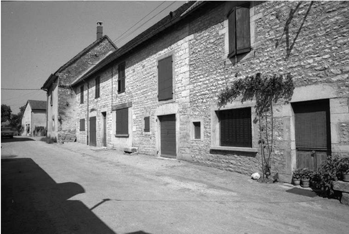
Maisons cadastrées 1967 AH 71-74, situées le long du chemin départemental n° 209 E : façades antérieures vues de trois-quarts droit.