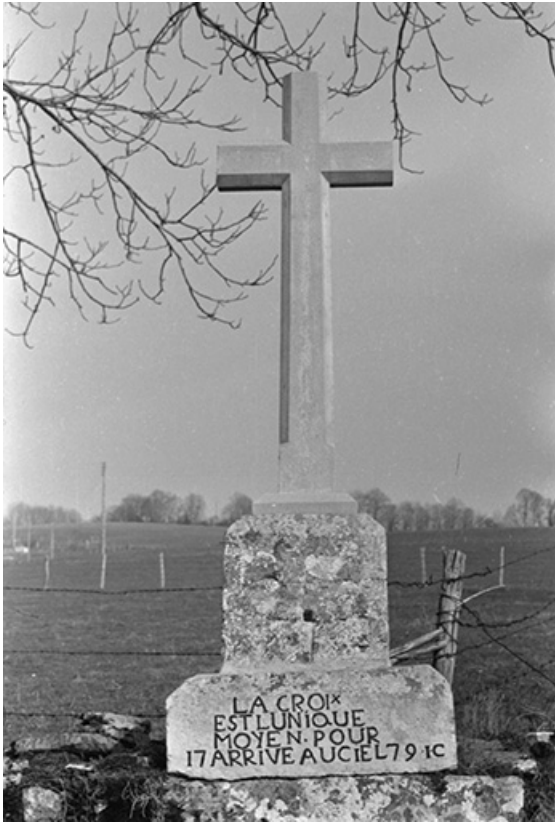
Croix de chemin en pierre, 1779 : vue de face.