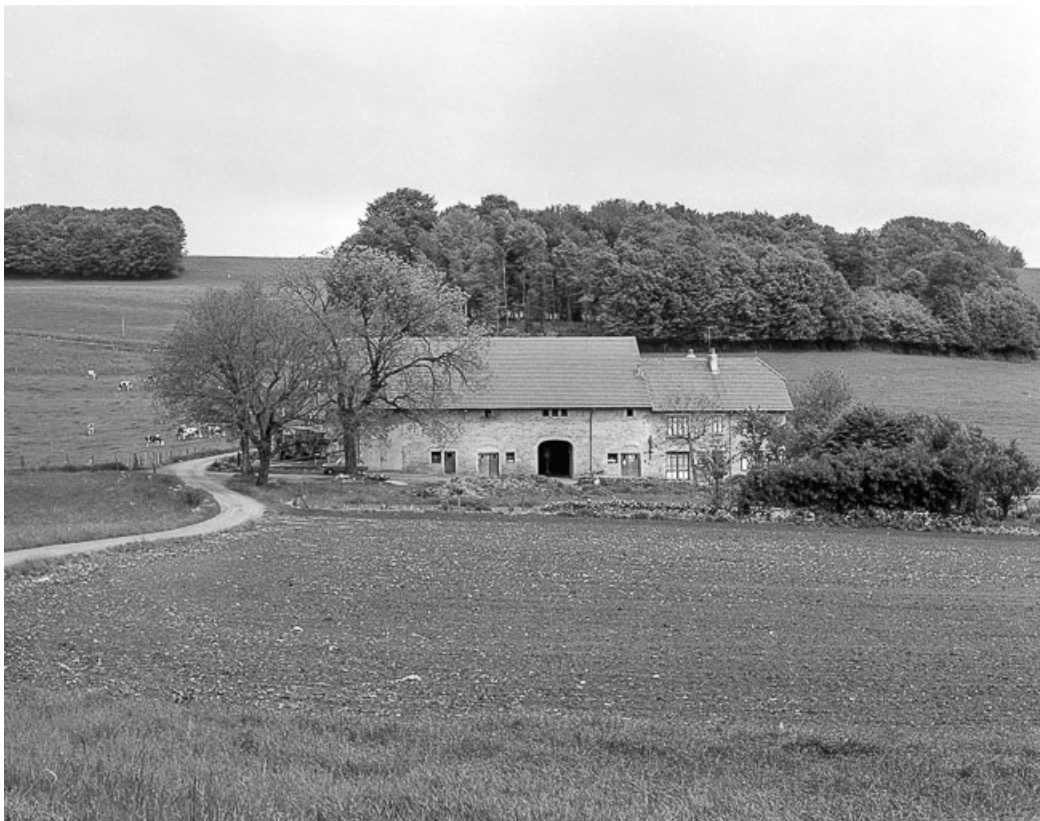
Ferme isolée : vue de situation.