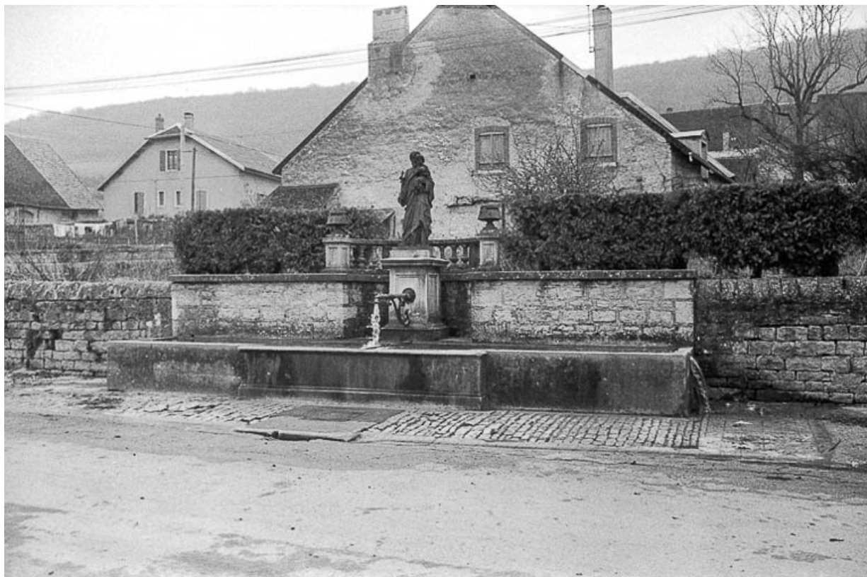
Fontaine publique, calcaire, 1895 : vue de face.