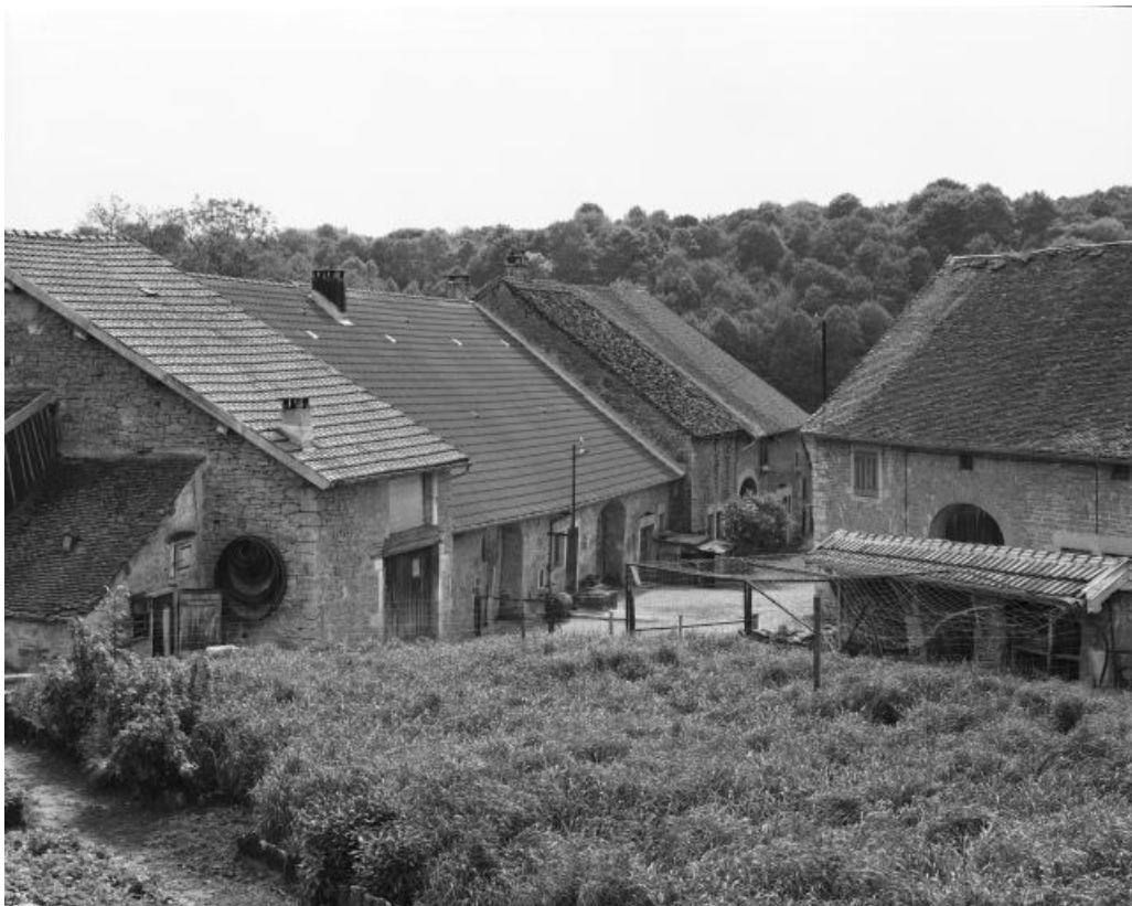
Vue générale du hameau.