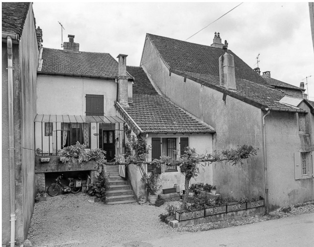
Maison de vigneron située rue de la Forge (?) : façade antérieure. 39, Lavigny