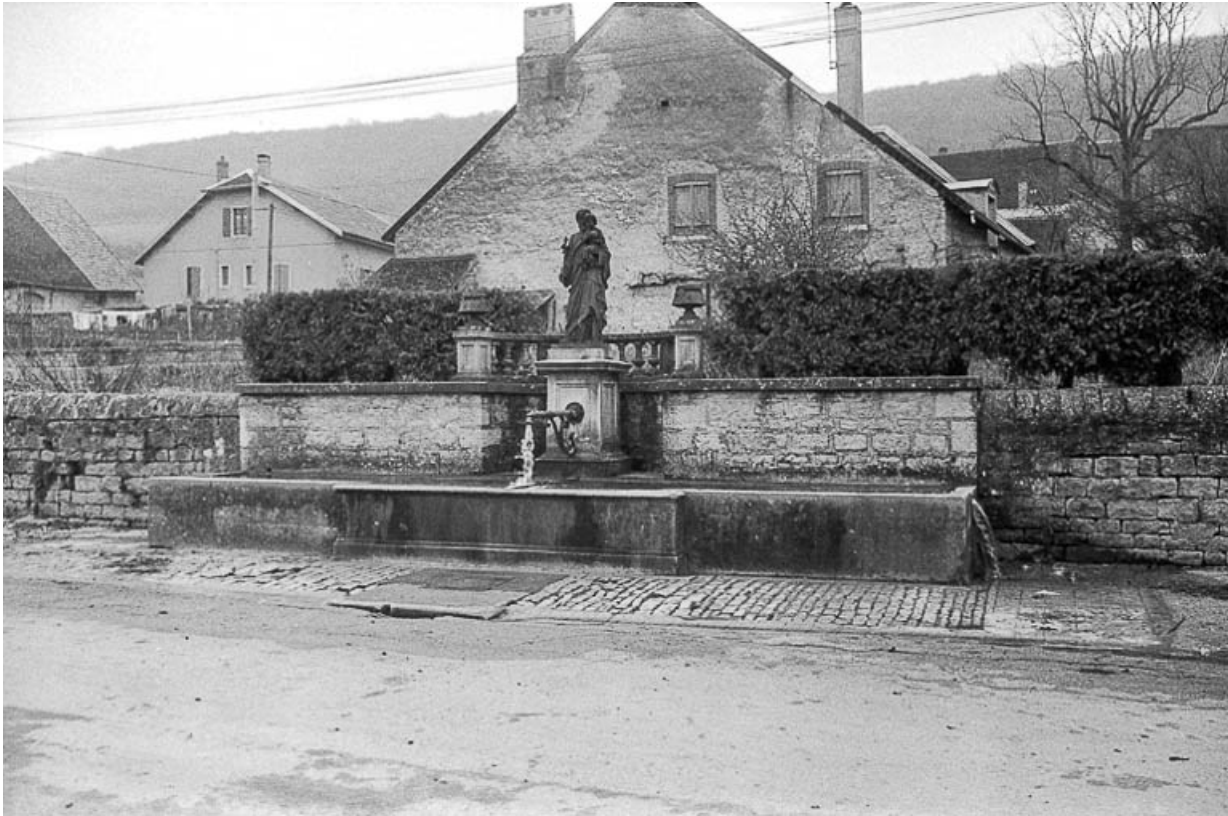
Fontaine publique, calcaire, 1895 : vue de face. 39, Lavigny