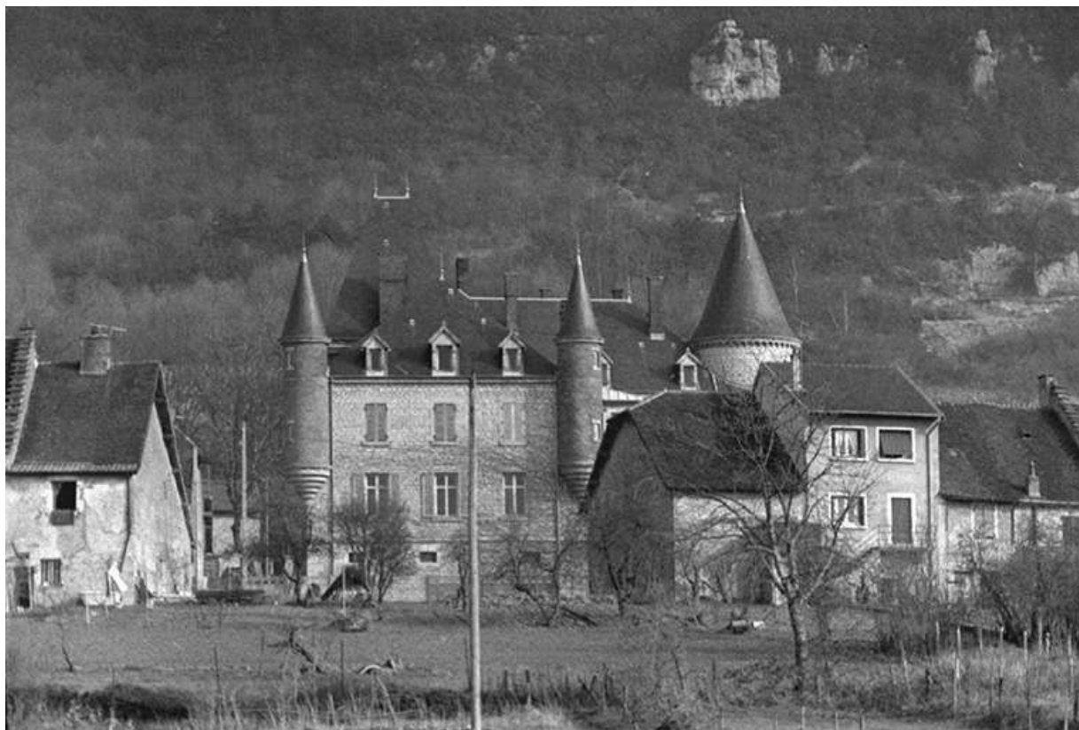
Vue de situation en 1974.