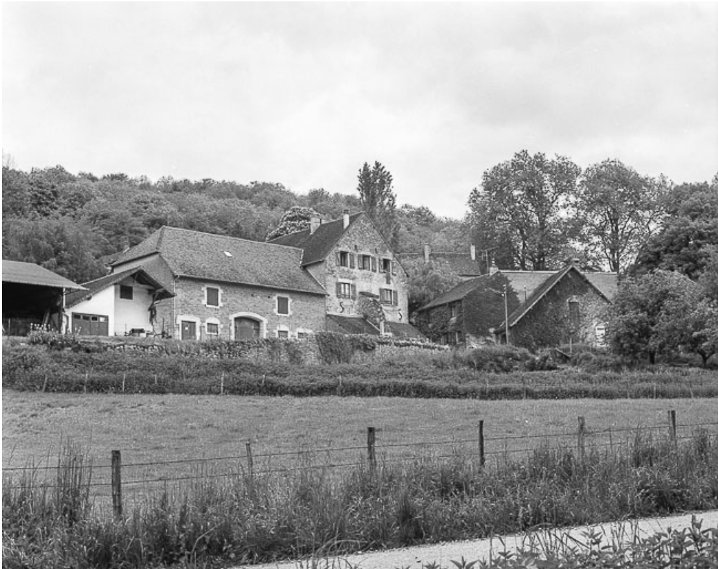
Maisons et fermes situées à Blandans : façades antérieures.