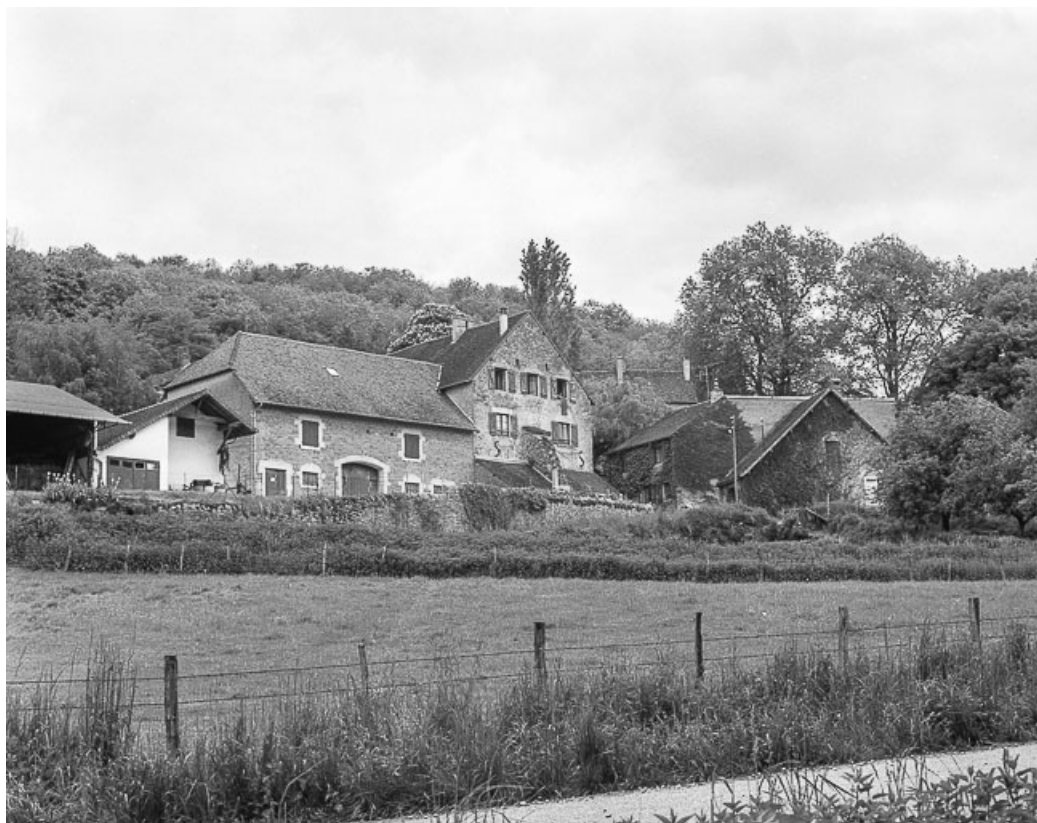
Maisons et fermes situées à Blandans : façades antérieures.