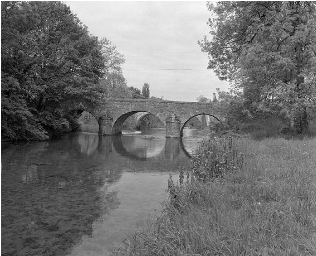
Face amont, vue de face.