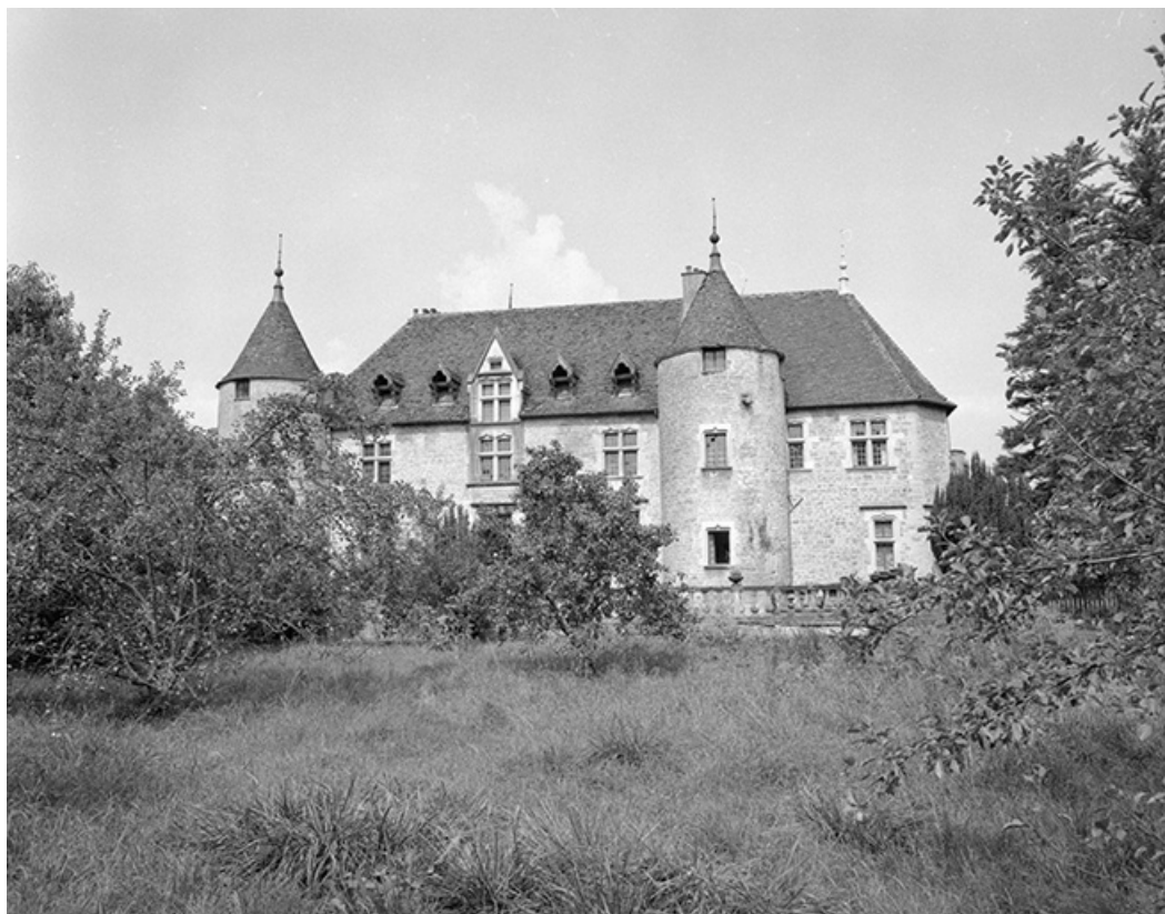
Façade est. 39, Domblans