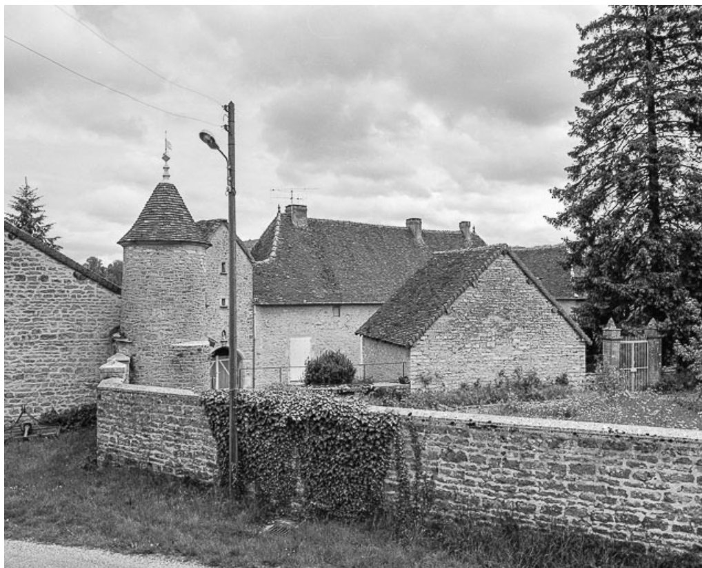
Demeure située chemin du Prélot : vue d'ensemble.