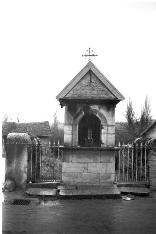
Vue de face.