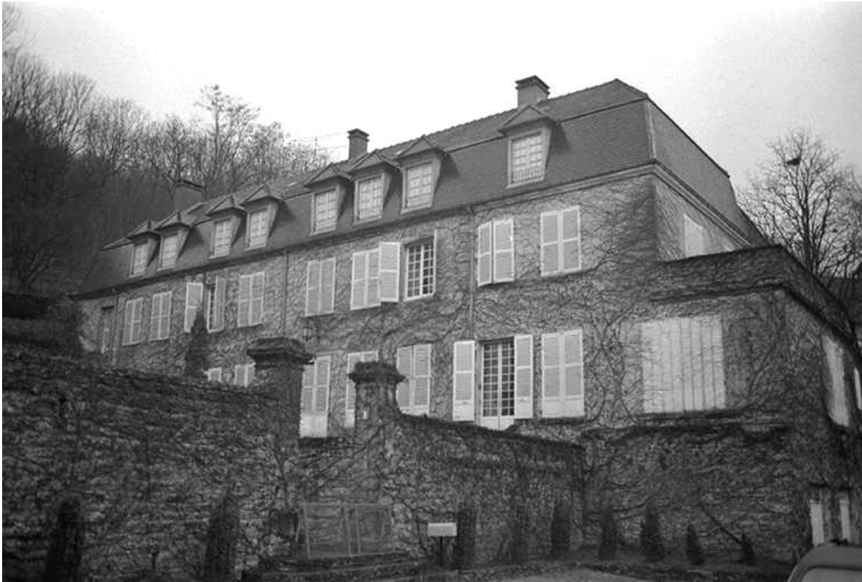
Vue du château depuis la cour.