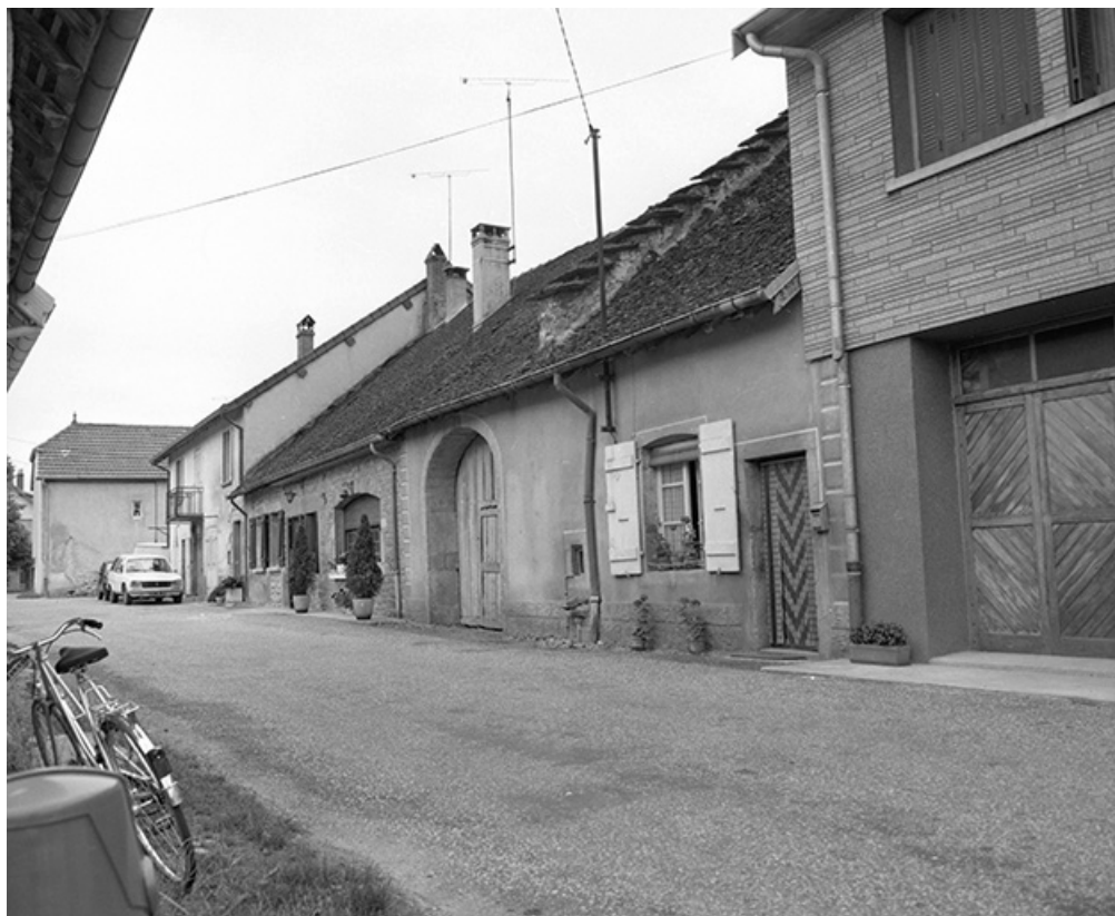
Vue de trois-quarts droit. 39, Domblans