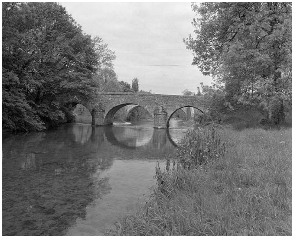
Face amont, vue de face.