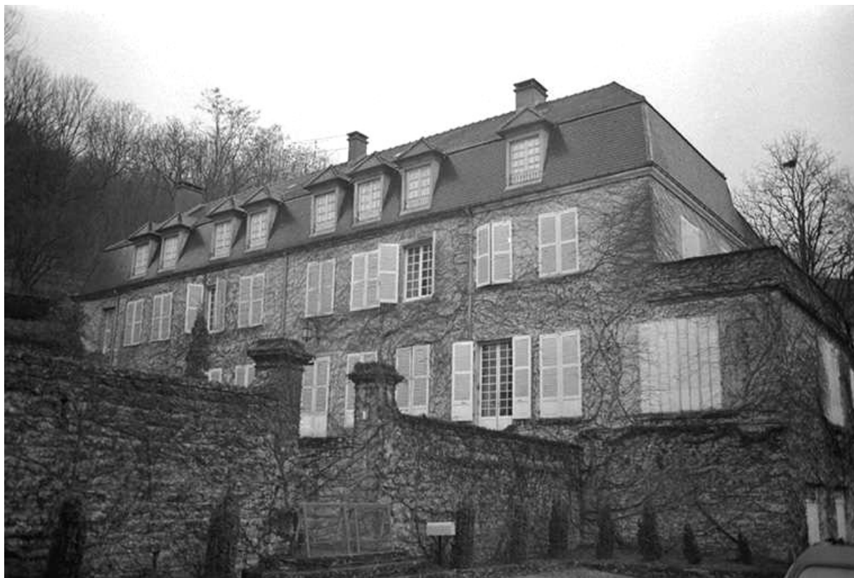
Vue du château depuis la cour.