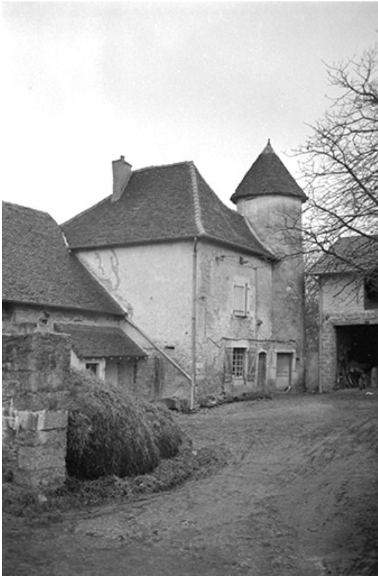
Ferme à tourelle : vue de la façade sur cour.