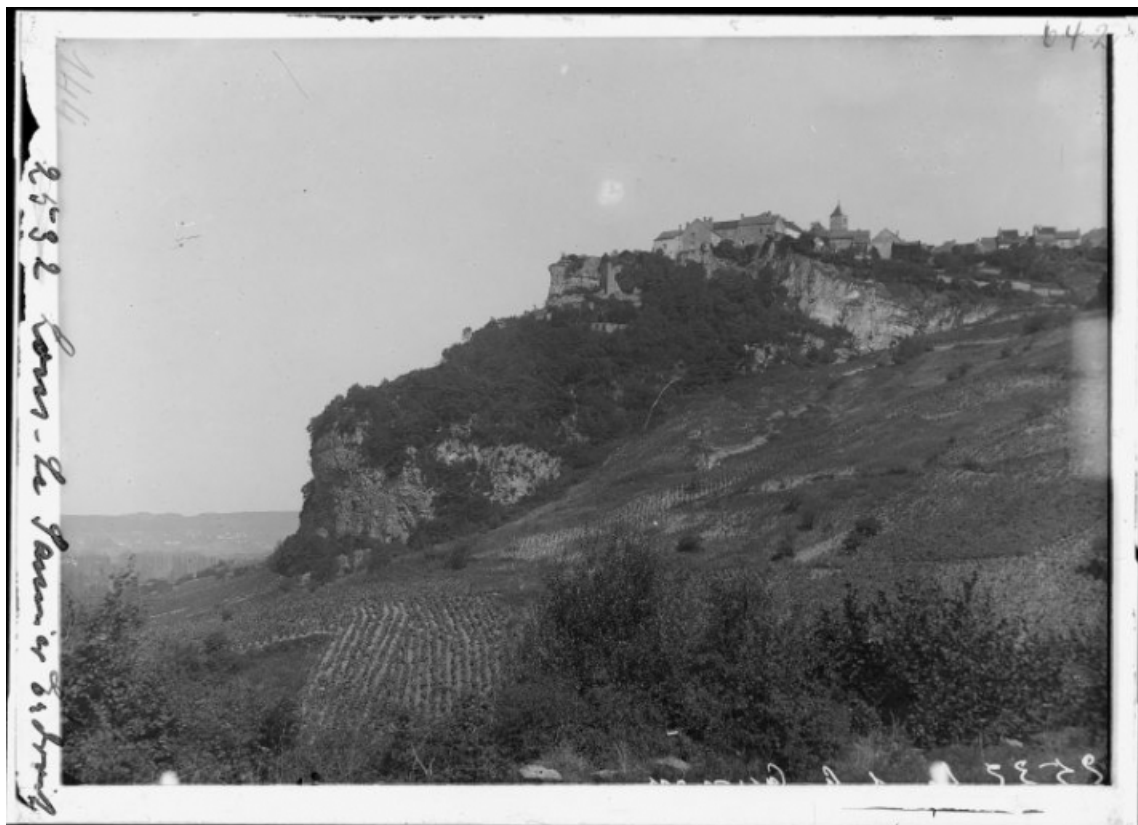
Vue du village depuis les vignes en contrebas.