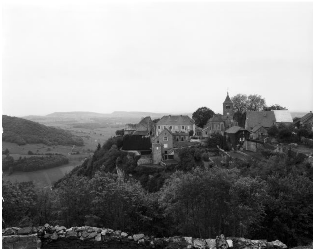
Vue de l'emplacement de l'abbaye.