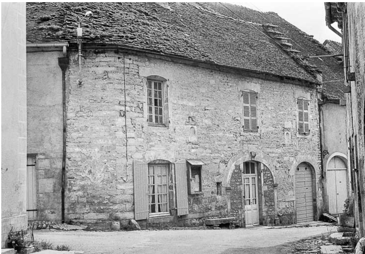
Maison à deux niveaux située rue de l'Eglise. 39, Château-Chalon