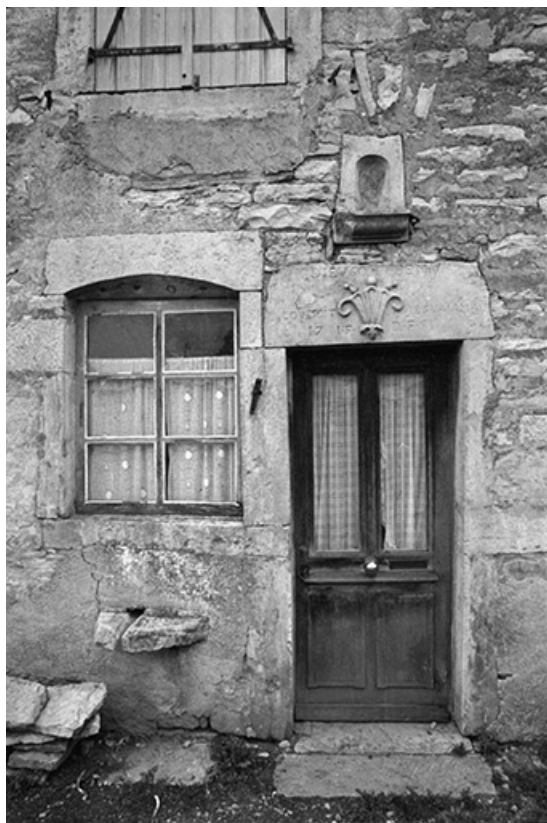
Ferme cadastrée 1965 AB 253, située rue de la Roche : porte de la partie habitation. 39, Château-Chalon