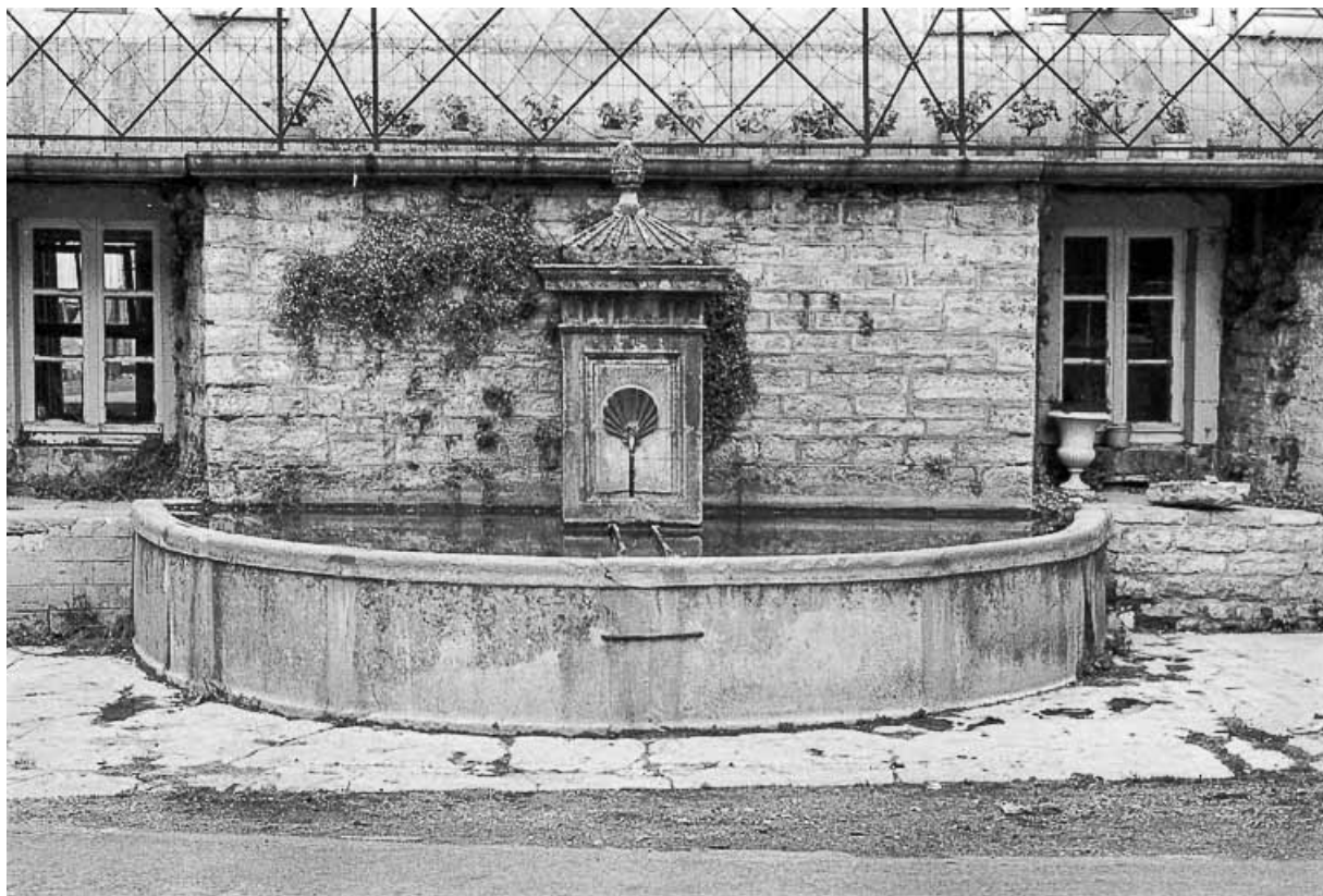
Fontaine publique du milieu du 19e siècle. 39, Château-Chalon