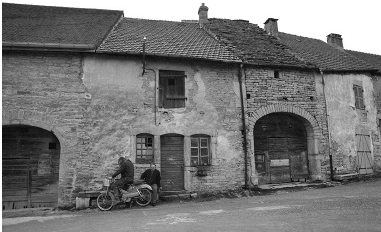
Ferme cadastrée 1965 AB 249 et 252 : façade antérieure. 39, Château-Chalon