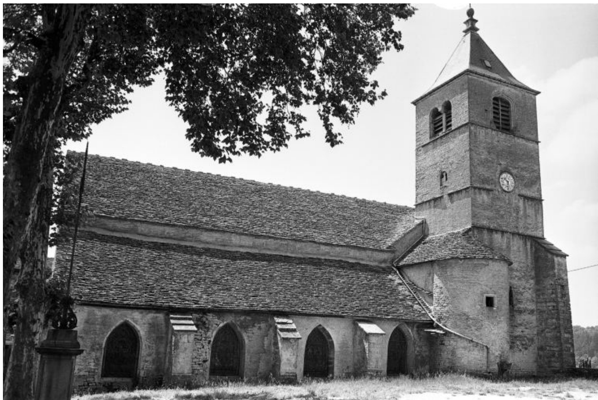
Façade latérale gauche. 39, Château-Chalon