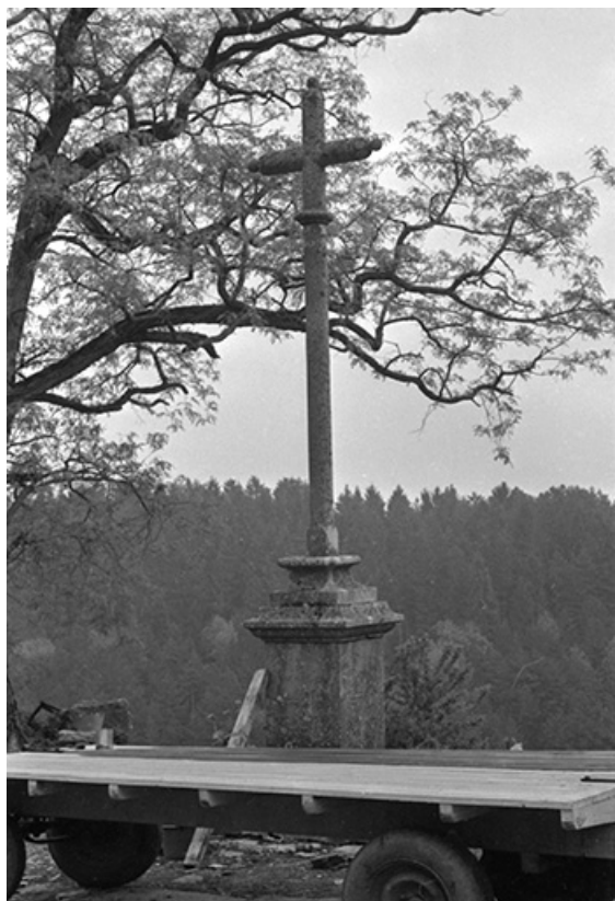
Croix de mission portant l'inscription 1877 : vue d'ensemble. 39, Château-Chalon