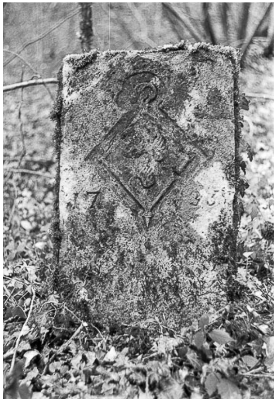
Borne en pierre de 1735 édifée par Anne Marie II Desle de Wattewille, abbesse de Château-Chalon. 39, Château-Chalon