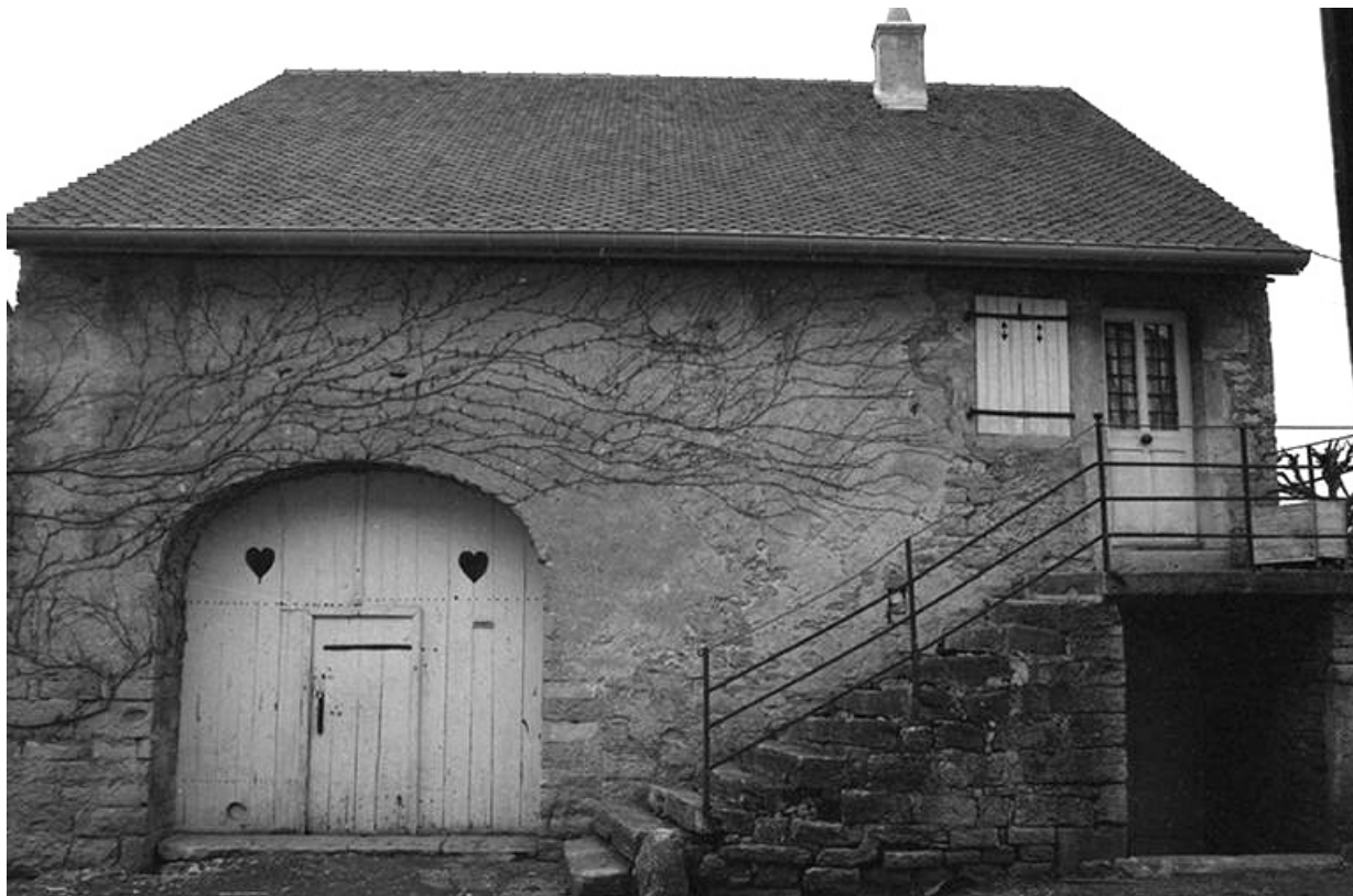
Maison de vigneron (?) cadastrée 1965 AB 186, située rue de la Roche : façade antérieure. 39, Château-Chalon