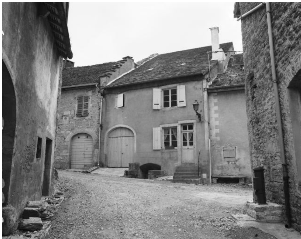
Façade antérieure. 39, Château-Chalon