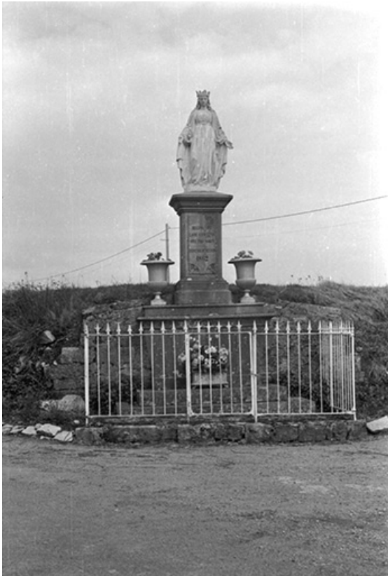
Statue de la Vierge : vue d'ensemble.