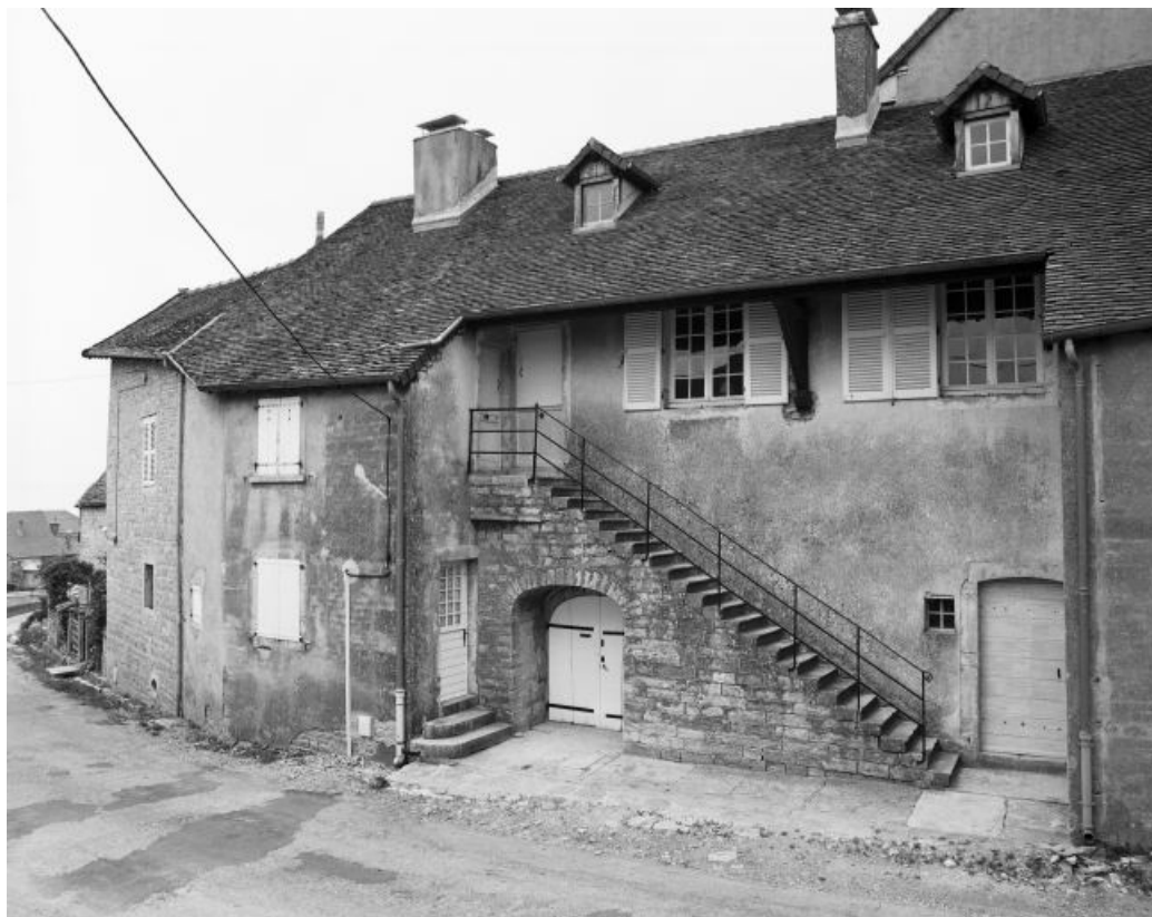
Façade antérieure. 39, Château-Chalon