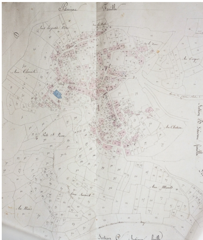
Plan cadastral. 39, Château-Chalon