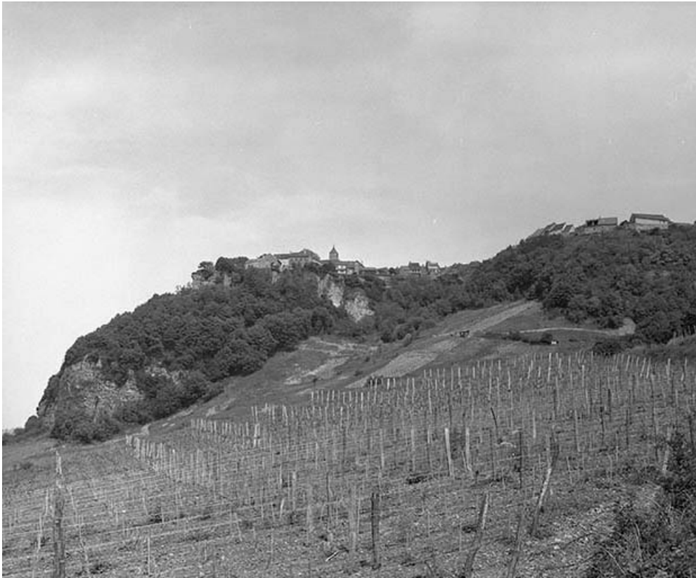
Vue générale depuis la vallée de la Seille.