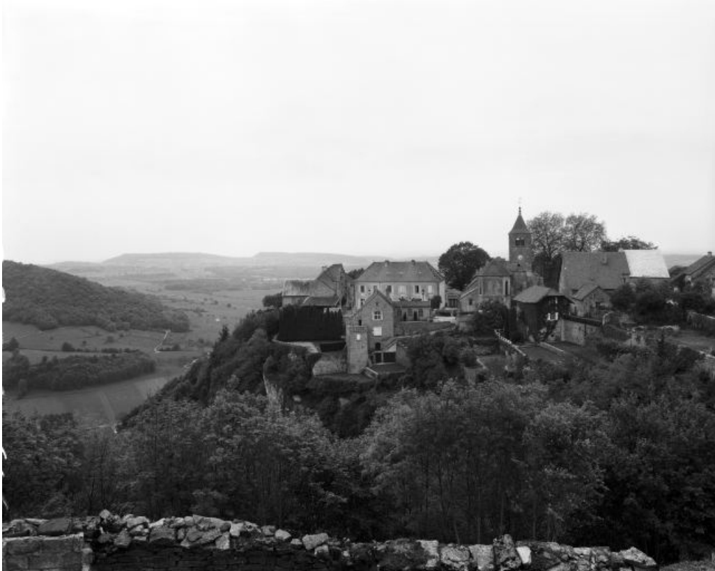
Vue de l'emplacement de l'abbaye.