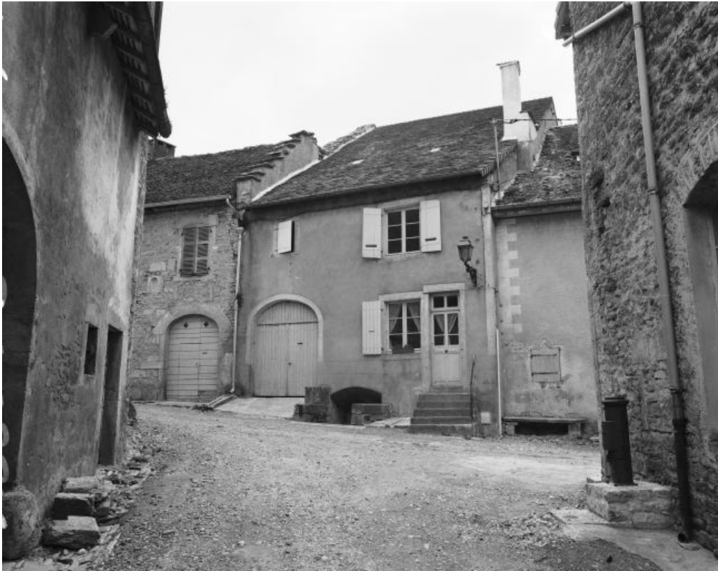
Façade antérieure. 39, Château-Chalon