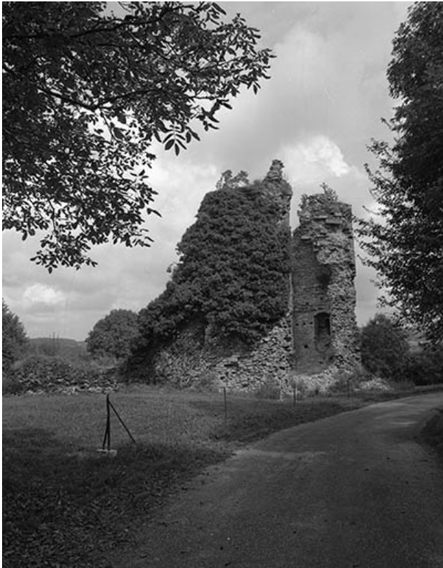
Le château-fort, vu depuis le sud.