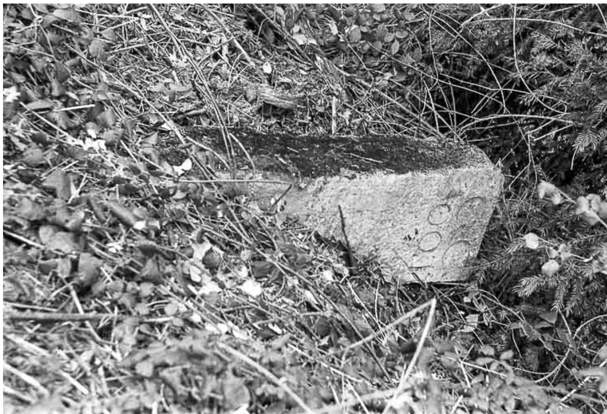
Borne en pierre du 18e siècle ou du début du 19e siècle avec inscription. 39, Château-Chalon