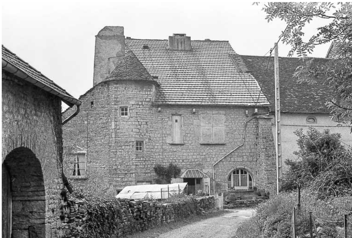
Maison avec tour d'angle située rue de la Roche. 39, Château-Chalon