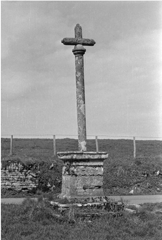
Croix de carrefour sud est du village : vue d'ensemble. 39, Château-Chalon