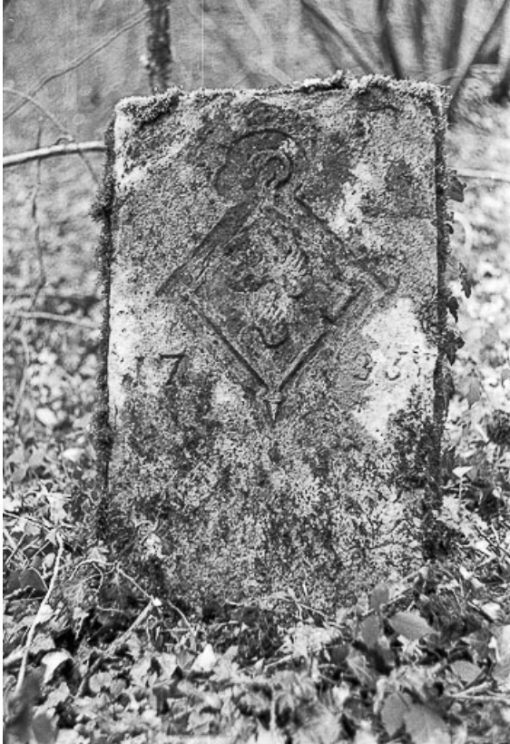
Borne en pierre de 1735 édifée par Anne Marie II Desle de Wattewille, abbesse de Château-Chalon. 39, Château-Chalon