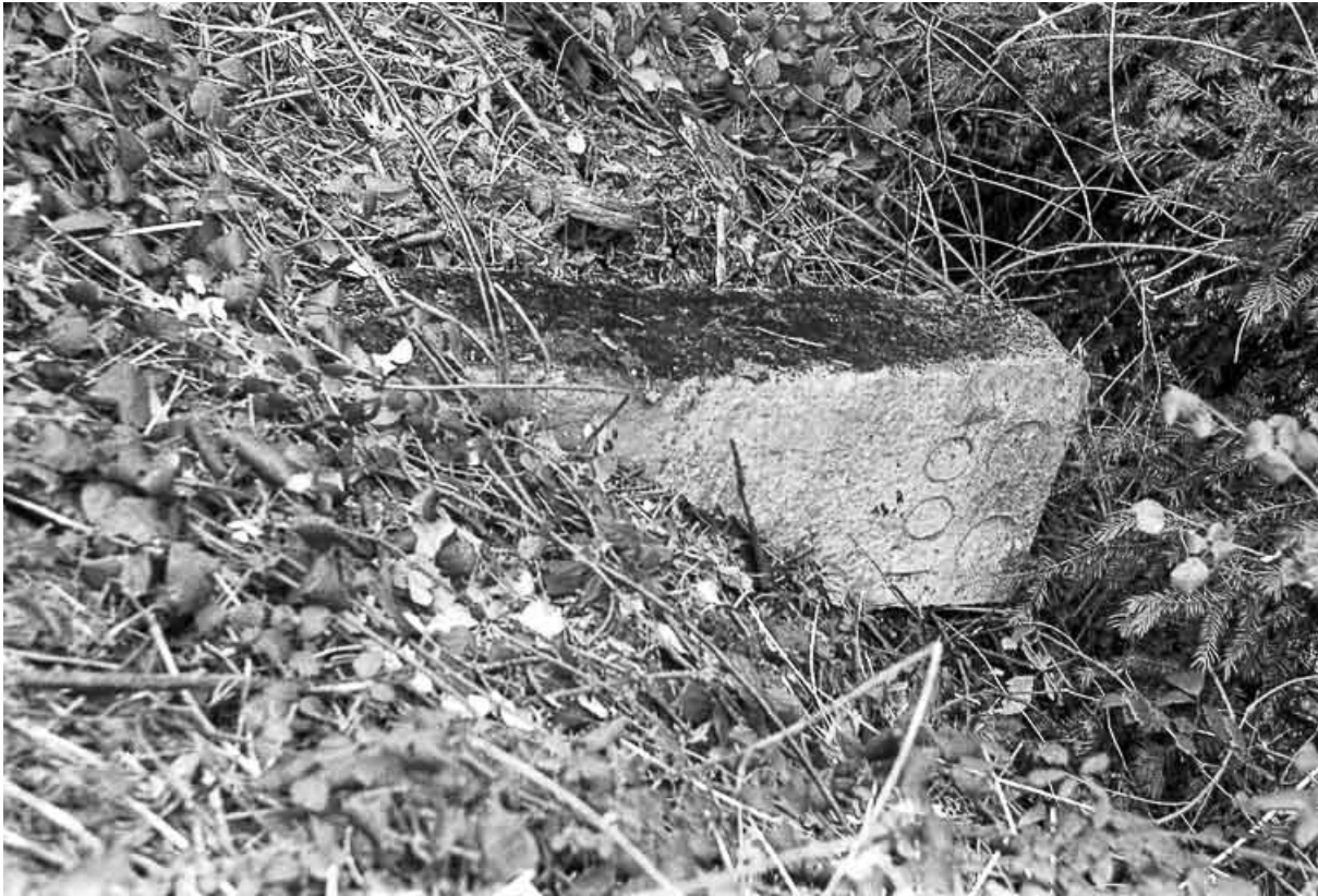
Borne en pierre du 18e siècle ou du début du 19e siècle avec inscription. 39, Château-Chalon