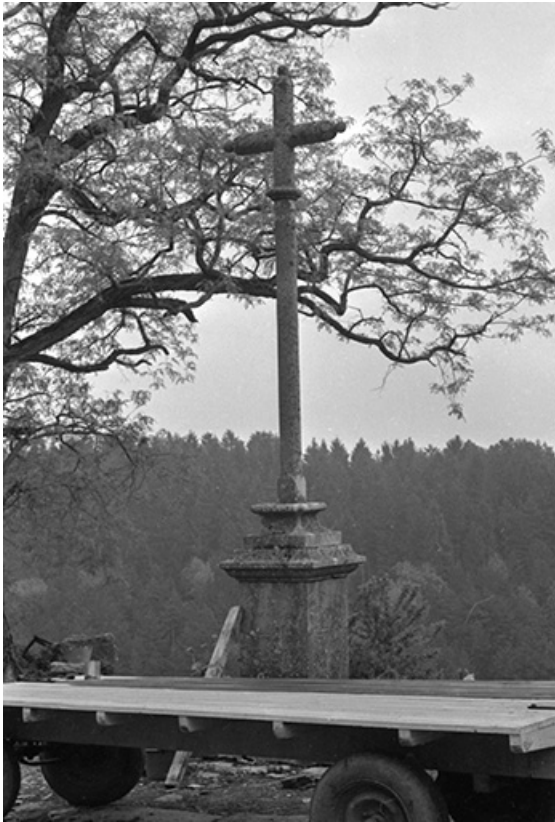
Croix de mission portant l' inscription 1877 : vue d'ensemble. 39, Château-Chalon