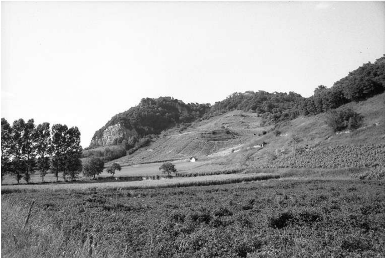
Village vu depuis Nevy-sur-Seille.