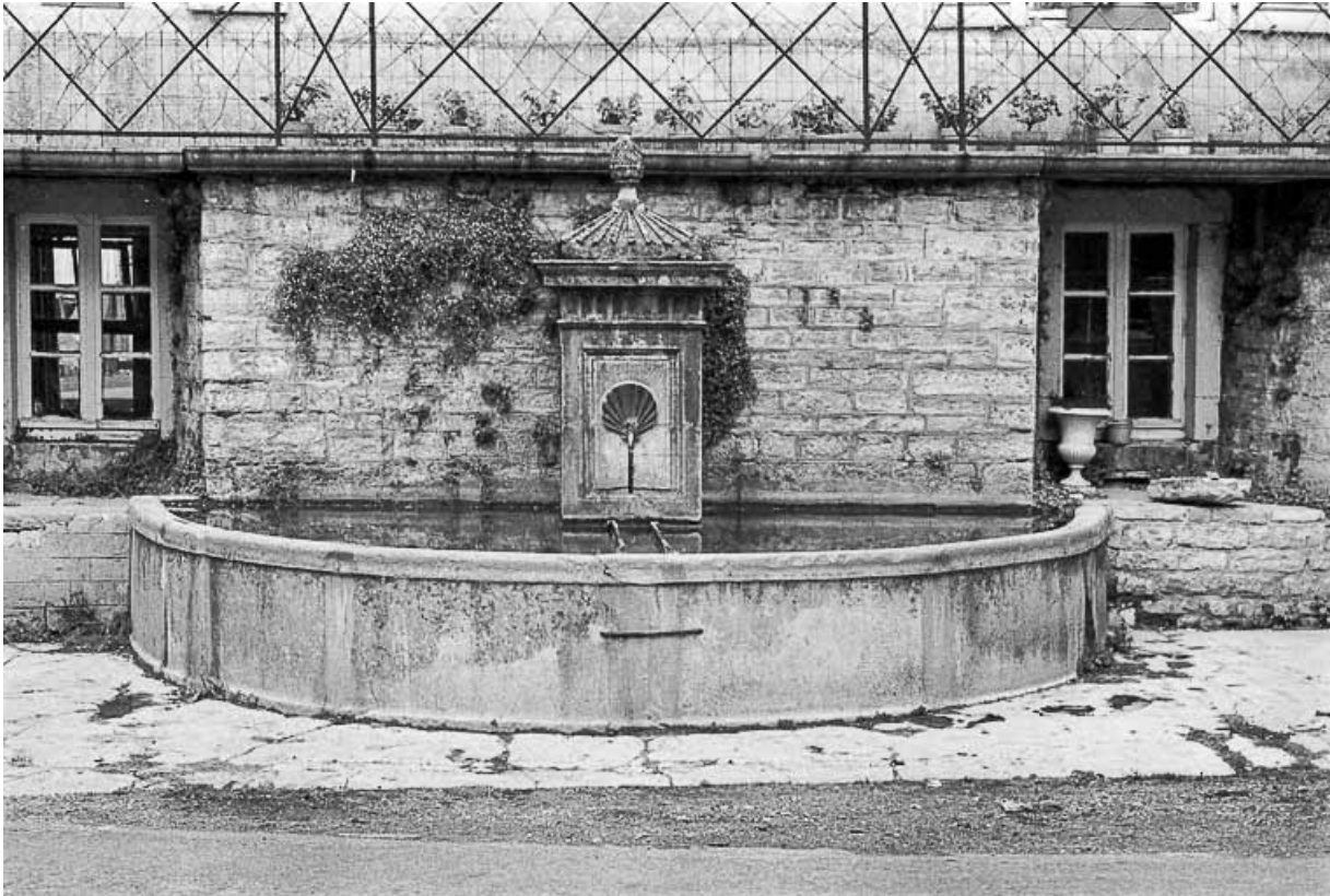
Fontaine publique du milieu du 19e siècle. 39, Château-Chalon