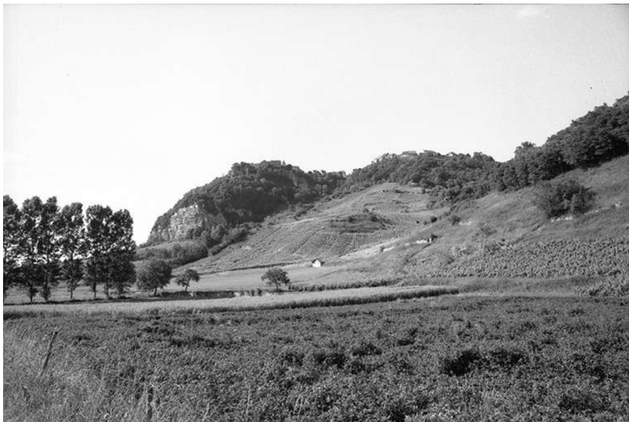
Village vu depuis Nevy-sur-Seille.