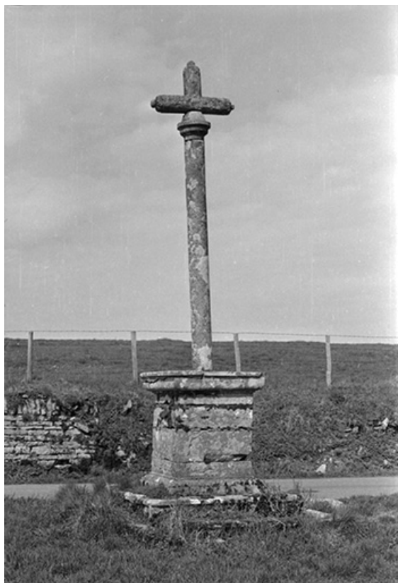
Croix de carrefour sud est du village : vue d'ensemble. 39, Château-Chalon