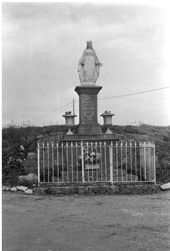
Statue de la Vierge : vue d'ensemble.