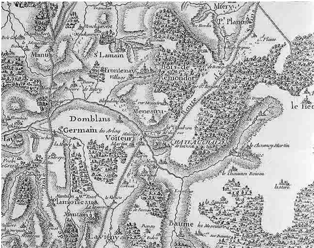
Extrait de la carte de Cassini.