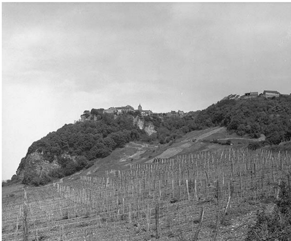
Vue générale depuis la vallée de la Seille. 39, Château-Chalon