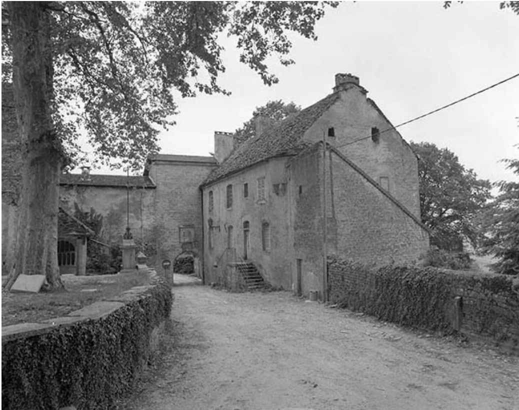
La maison canoniale.