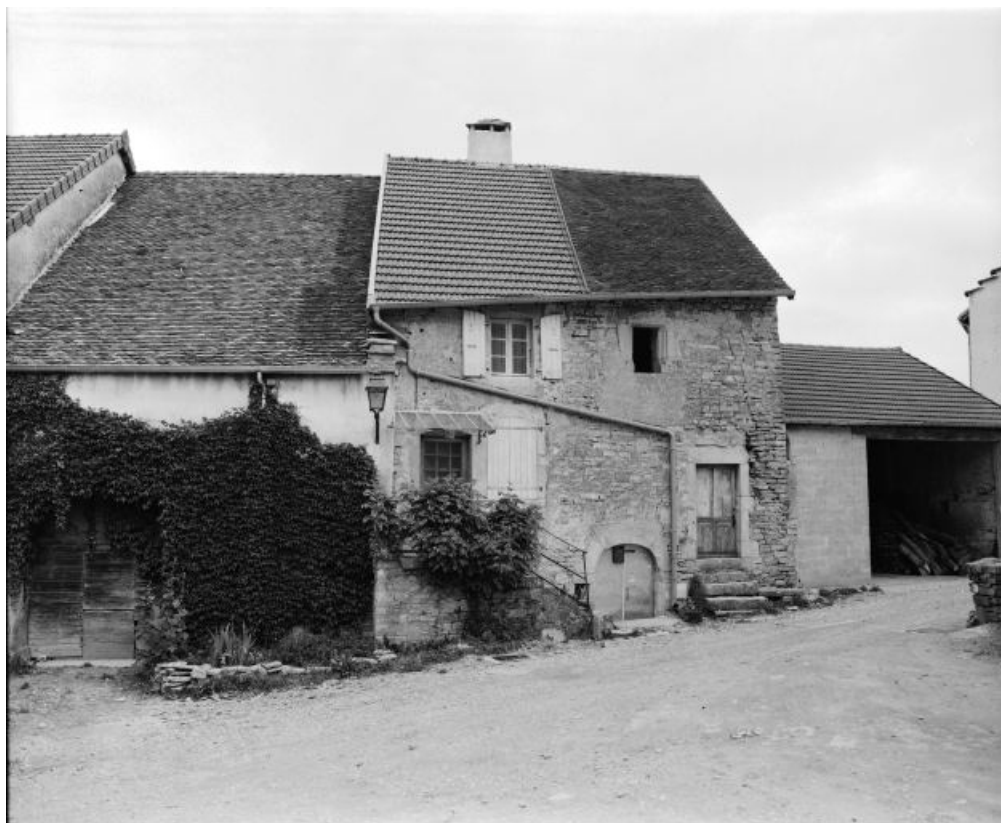
Façade antérieure. 39, Château-Chalon