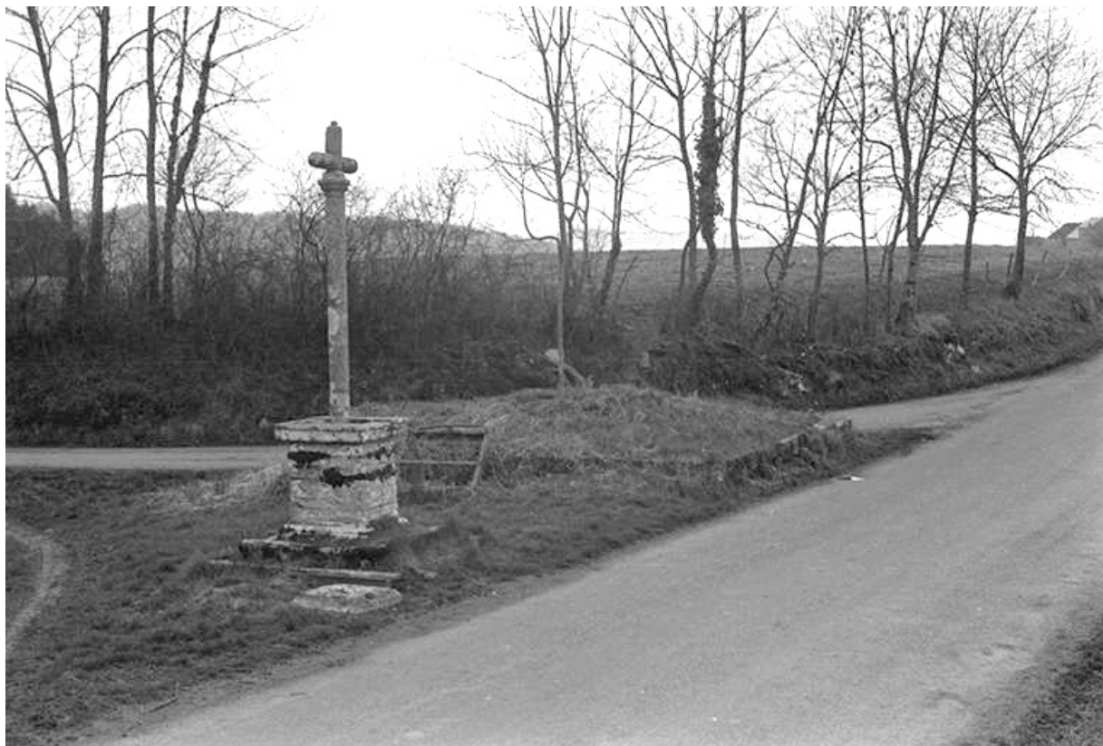
Croix de carrefour sud est du village : vue de situation..