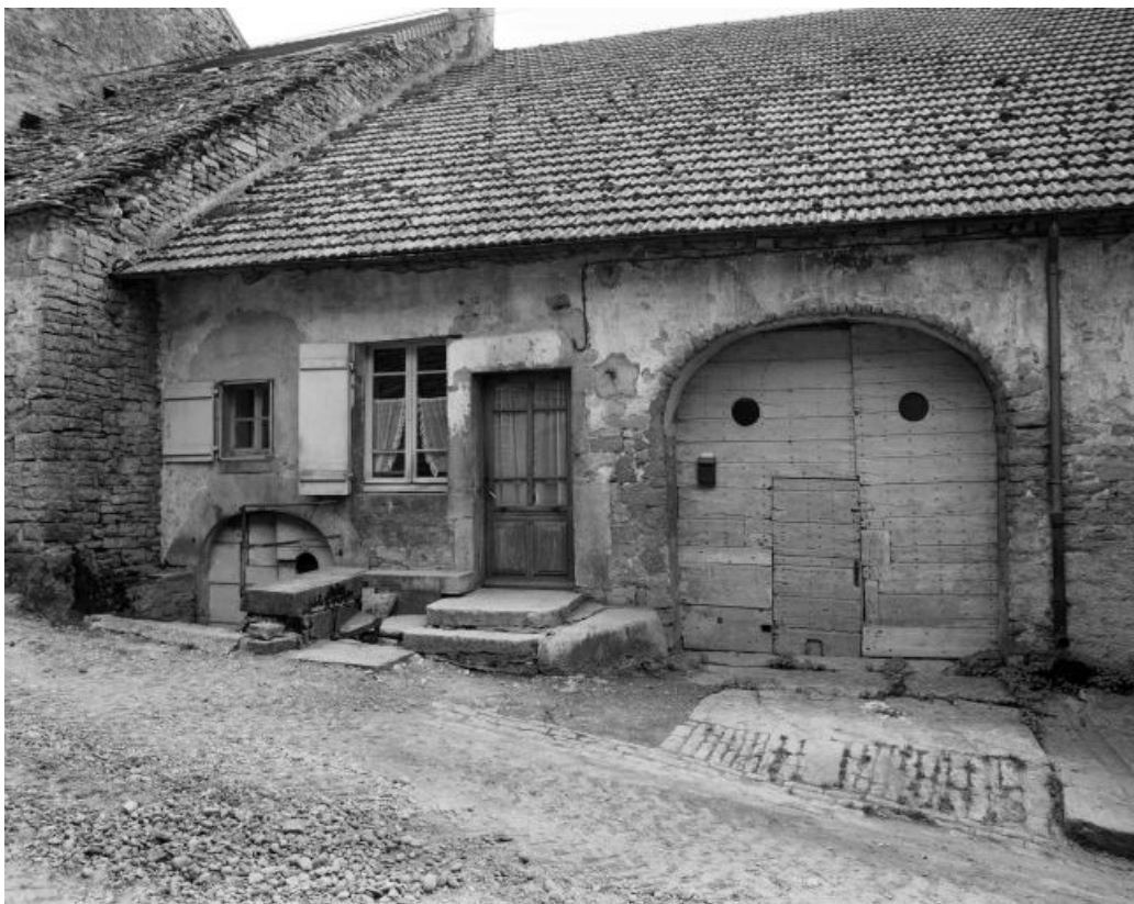
Façade antérieure, vue de face. 39, Château-Chalon