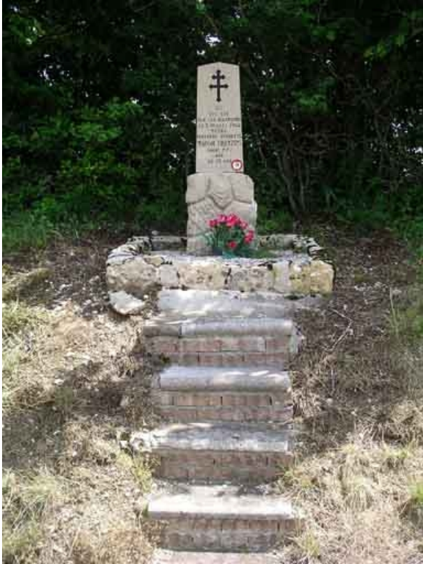
monument à la mémoire de Marcel Franzini, FFI, tué par les Allemands le 3 juillet 1944. 39, Saint-Pierre