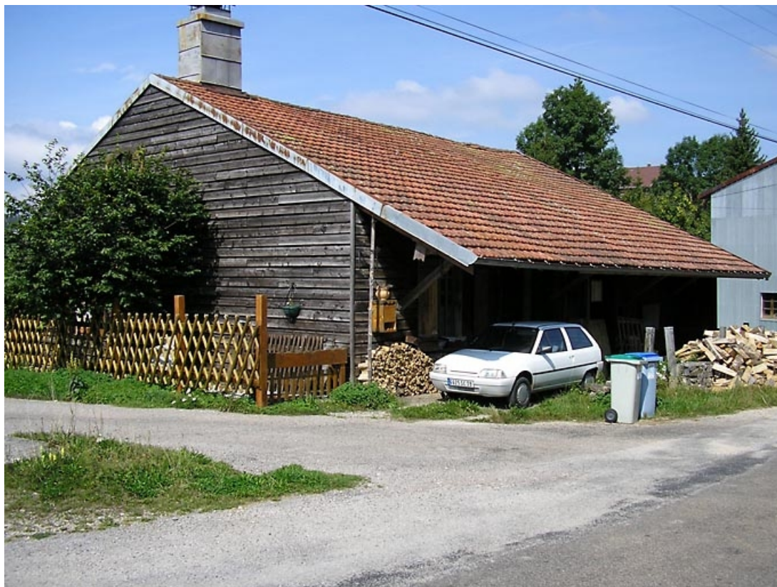
Pignon sud-ouest et façade antérieure vus de trois quarts. 39, Saint-Pierre