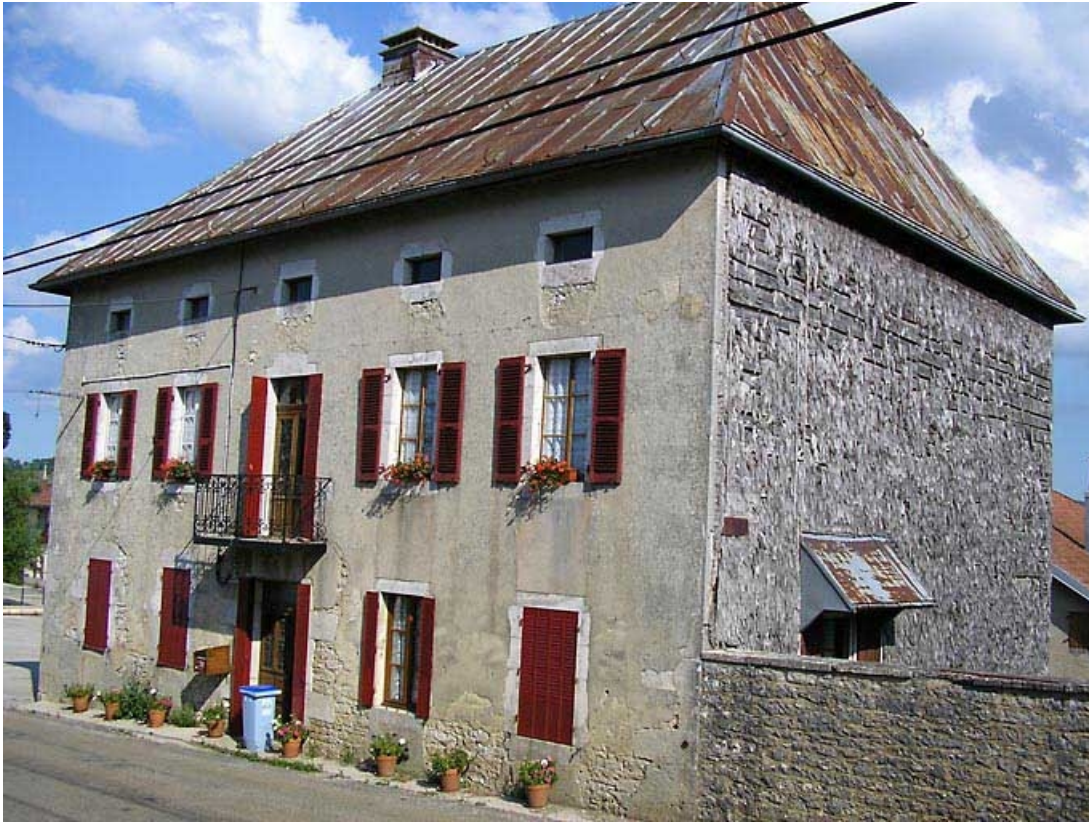
Façade antérieure et pignon sud-ouest vus de trois quarts. 39, Saint-Pierre