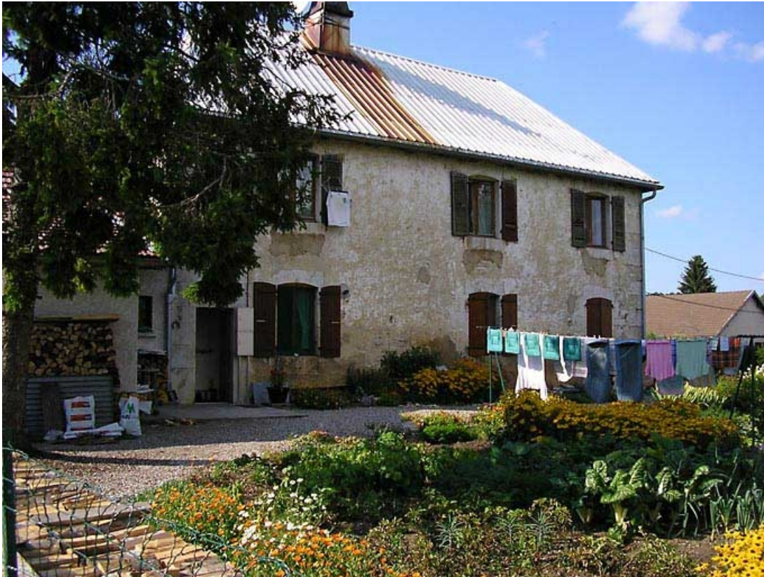
Façade antérieure vue de trois quarts.