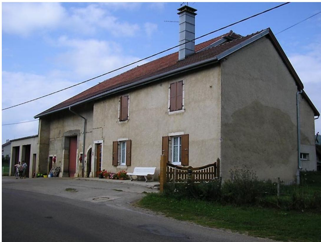
Façade antérieure et pignon nord-est vus de trois quarts. 39, Saint-Pierre