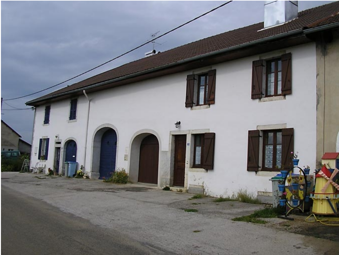
Façade antérieure vue de trois quarts.