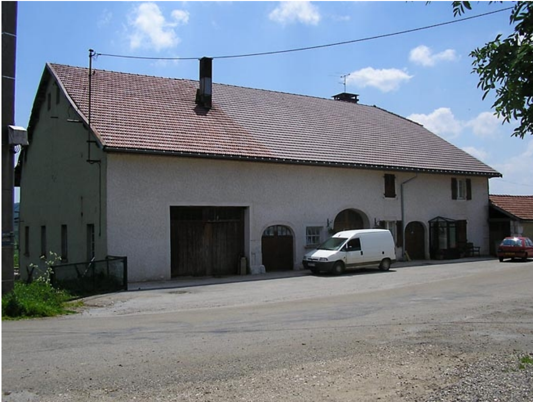
Façade antérieure vue de trois quarts.