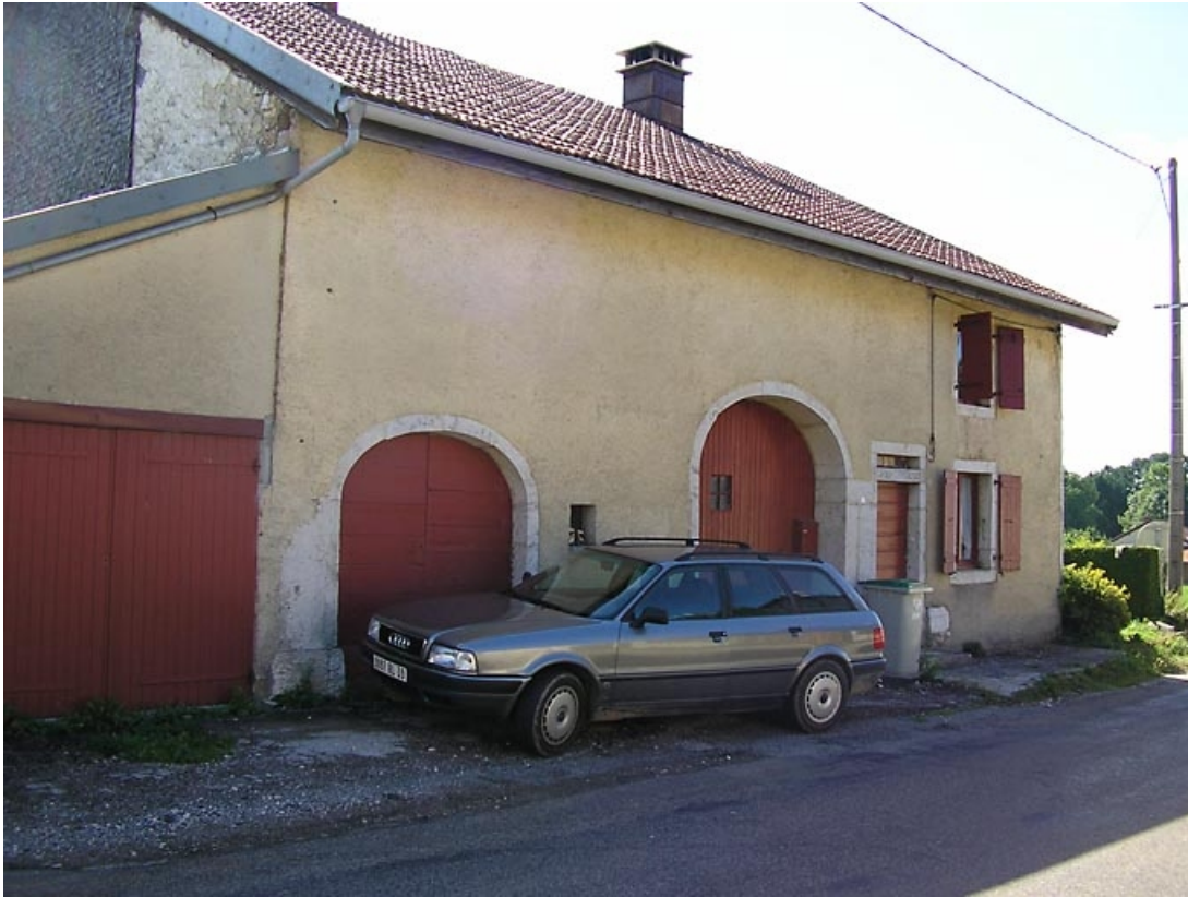
Façade antérieure vue de trois quarts.