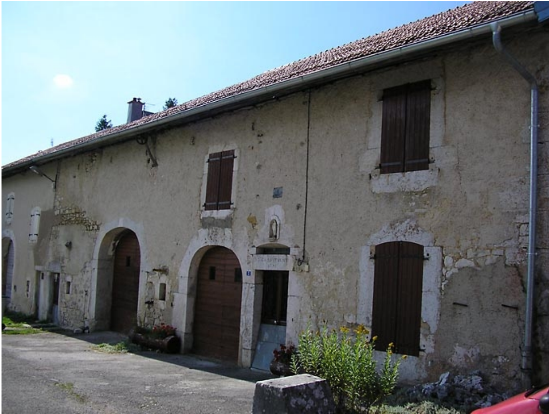
Façade antérieure vue de trois quarts.