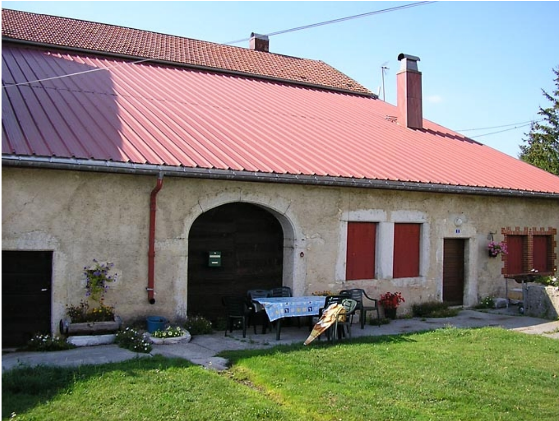
Vue de la façade antérieure.