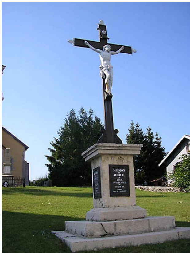
Vue générale de la croix de mission.