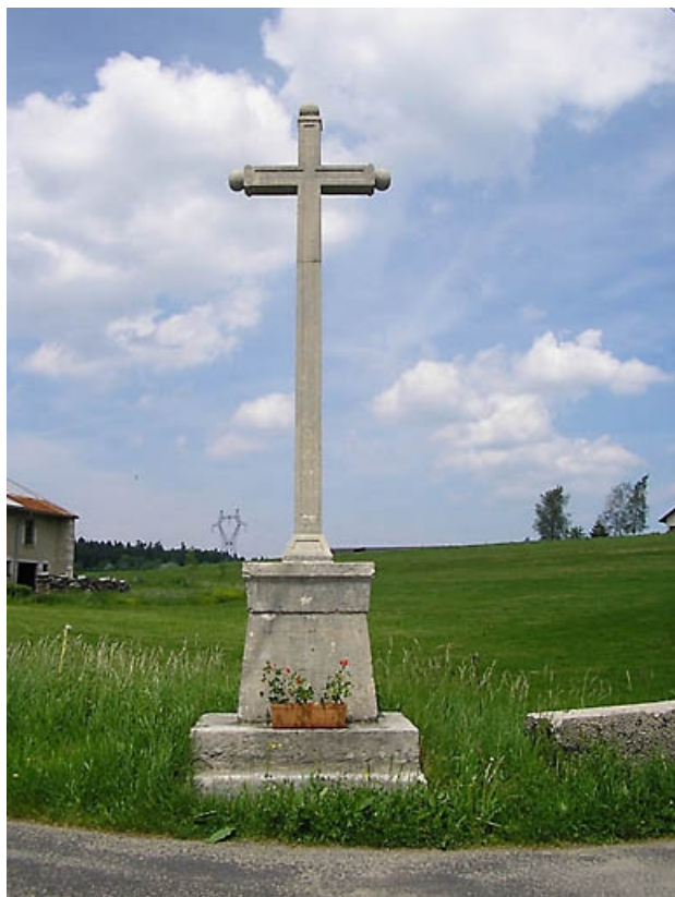
Vue générale. 39, Saint-Pierre