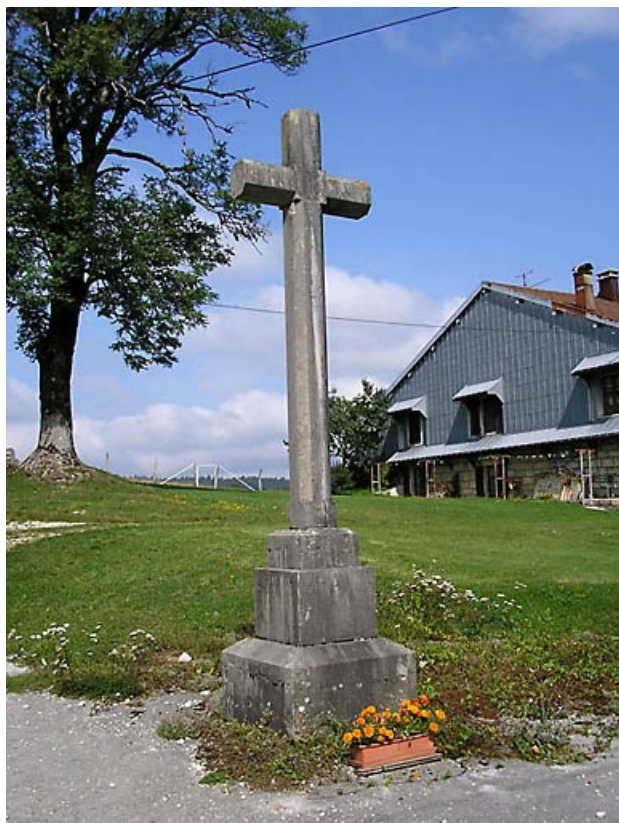
Vue générale. 39, Saint-Pierre