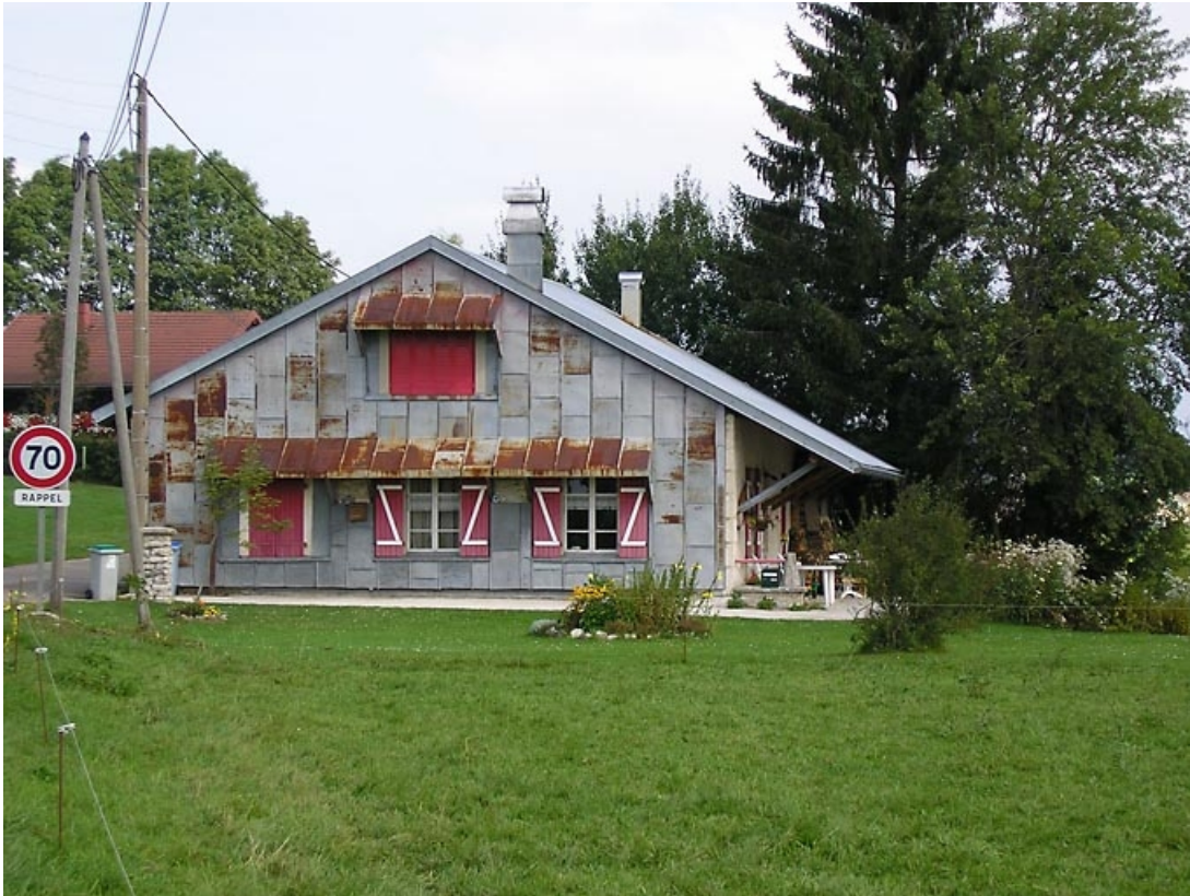
Vue de la façade sud-ouest.