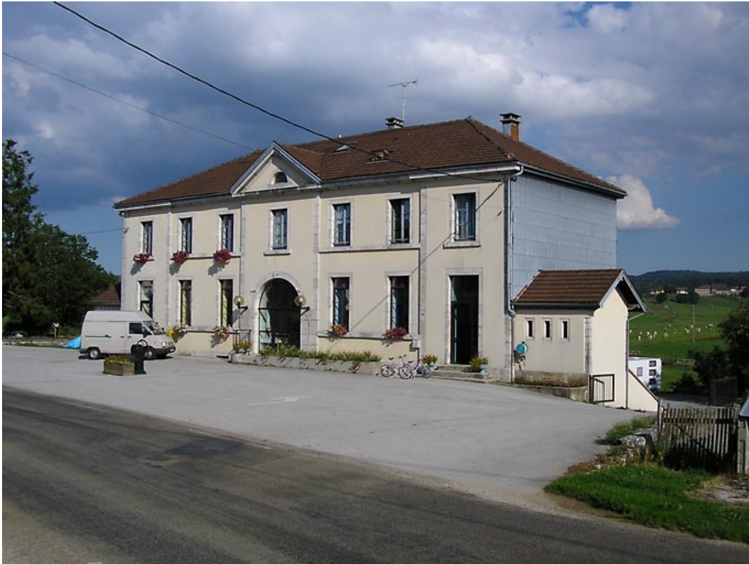
Façade antérieure vue de trois quarts.