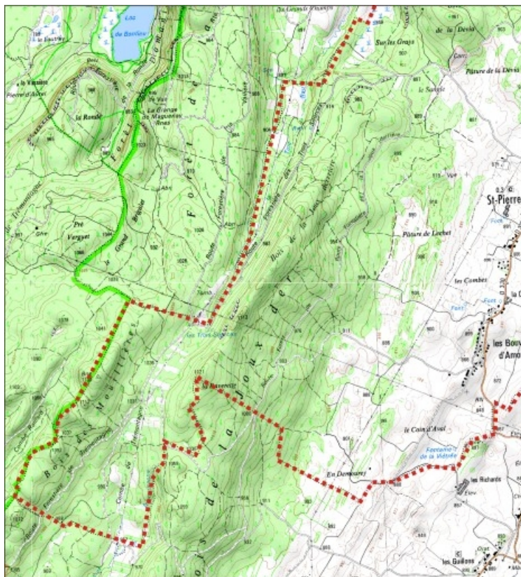
Carte des limites de la commune, partie sud. Extrait de la carte IGN, échelle 1/25 000 ; SCAN 25 (c) IGN - 2008, Licence n° 2008CISE29-68.