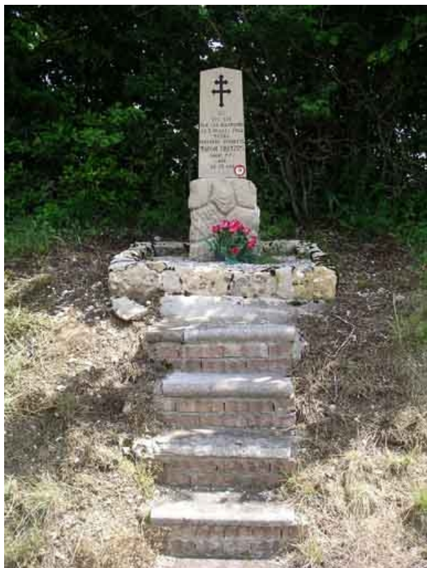
monument à la mémoire de Marcel Franzini, FFI, tué par les Allemands le 3 juillet 1944. 39, Saint-Pierre