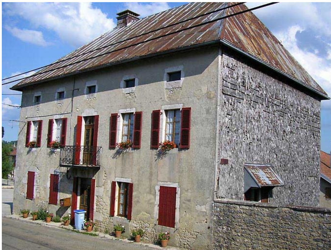
Façade antérieure et pignon sud-ouest vus de trois quarts. 39, Saint-Pierre