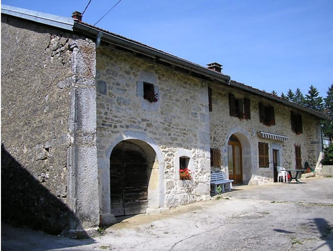
Façade antérieure et pignon nord-est vus de trois quarts.