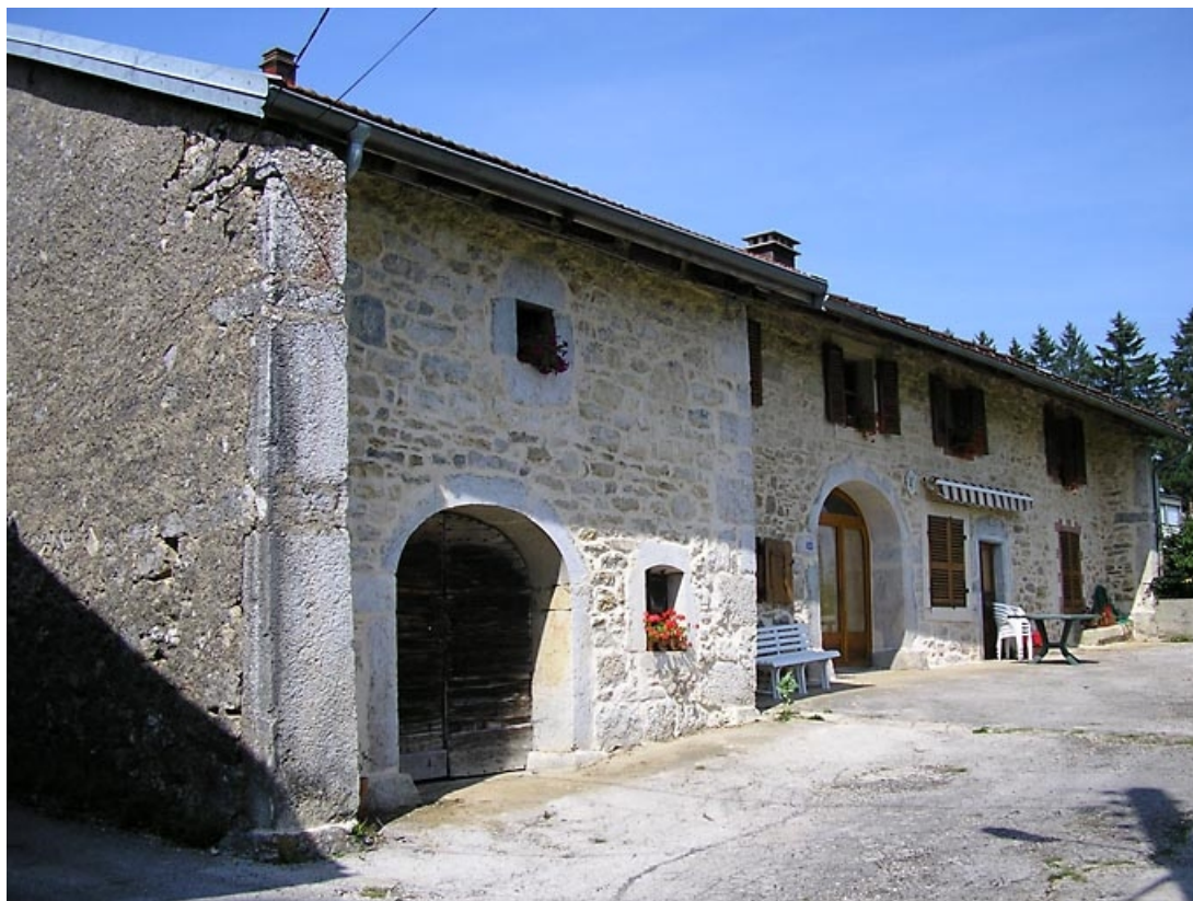
Façade antérieure et pignon nord-est vus de trois quarts. 39, Saint-Pierre