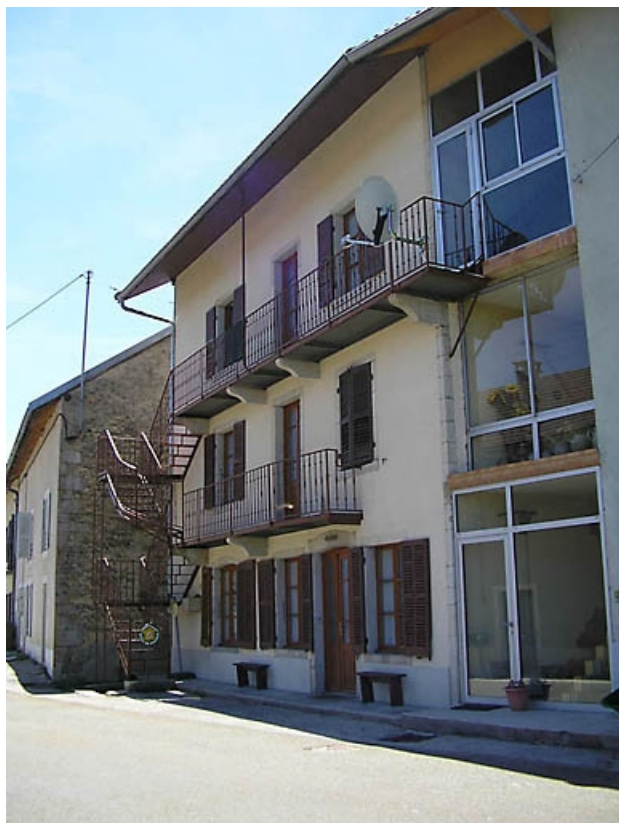
Façade antérieure vue de trois quarts.