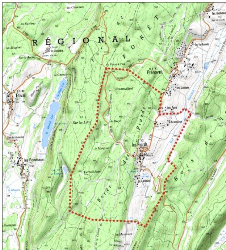
Carte des limites de la commune. Extrait de la carte IGN, échelle 1/25 000 ; Licence n° 2008CISE29-68. 39, Les Piards