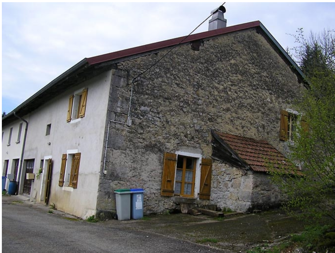
Façade antérieure et pignon avec four accolé vus de trois quarts. 39, Les Piards