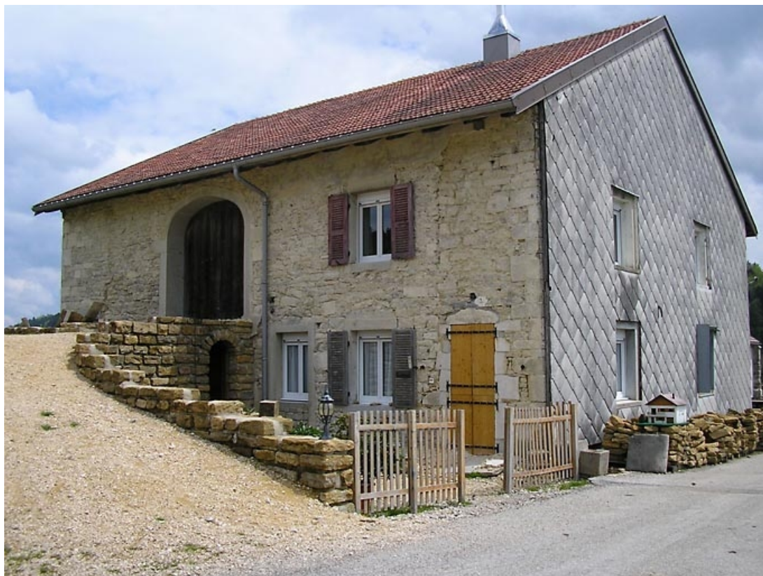
Façade antérieure et pignon sud-ouest vus de trois quarts.