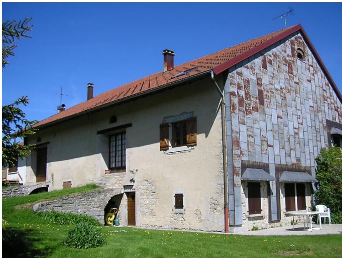
Pignon sud-ouest et façade postérieure avec pont de grange vus de trois quarts.

39, Les Piards, 14 rue du Cressamoiron, lieudit : le Cramoiron