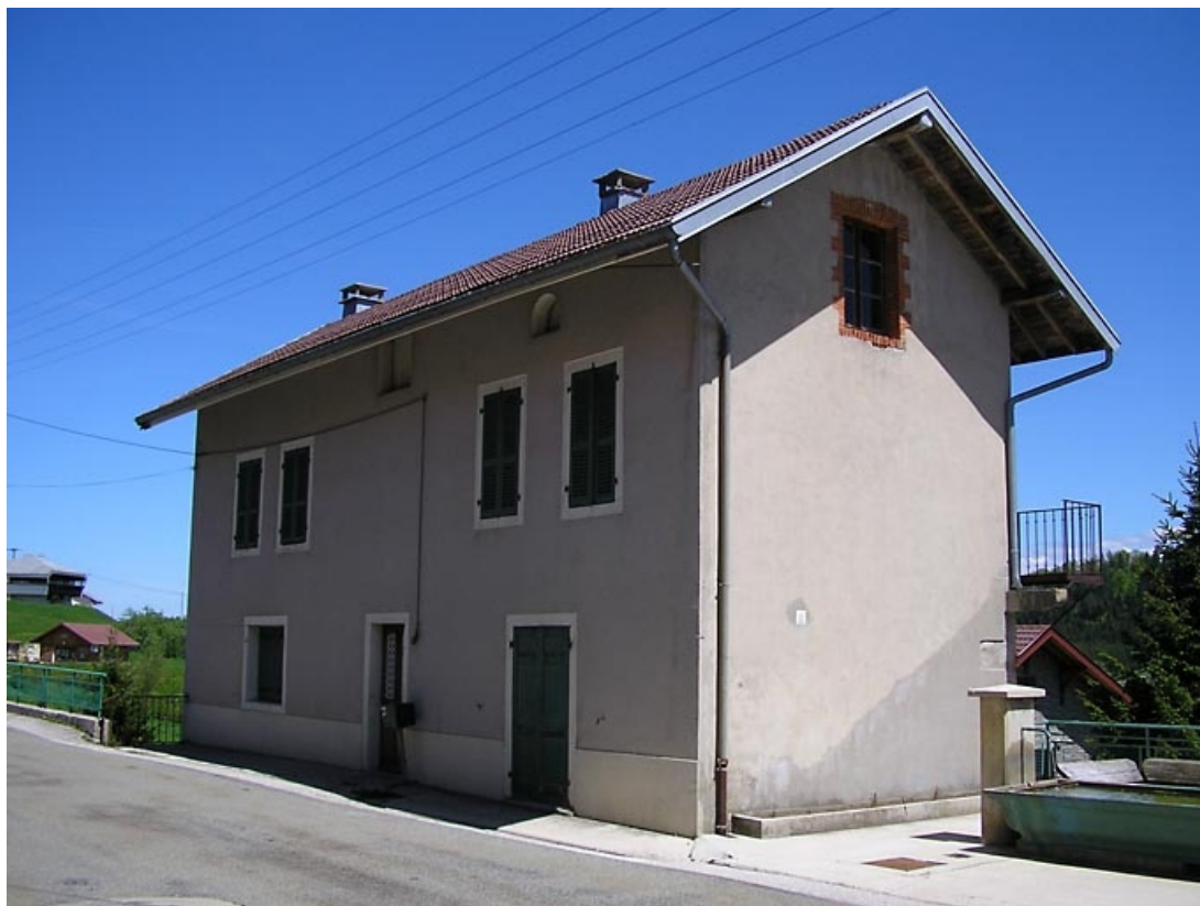
Façade antérieure vue de trois quarts.