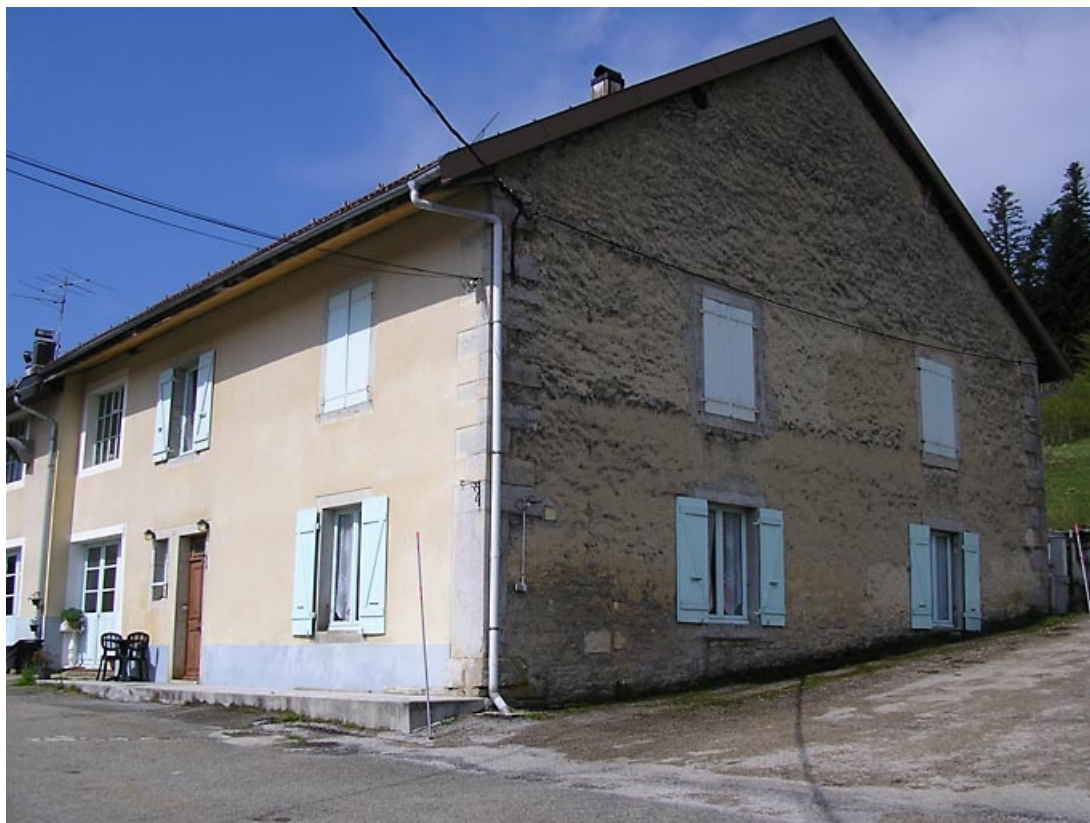
Façade antérieure et pignon nord vus de trois quarts.

39, Les Piards, 35 chemin de Ladaval, lieudit : Ladaval