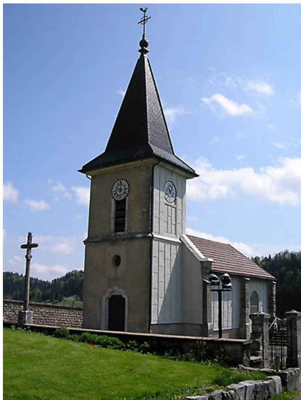
Vue générale du clocher, de l'entrée et du bas-côté.