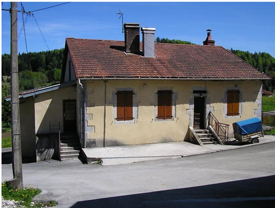
Façade postérieure et appentis vus de trois quarts.