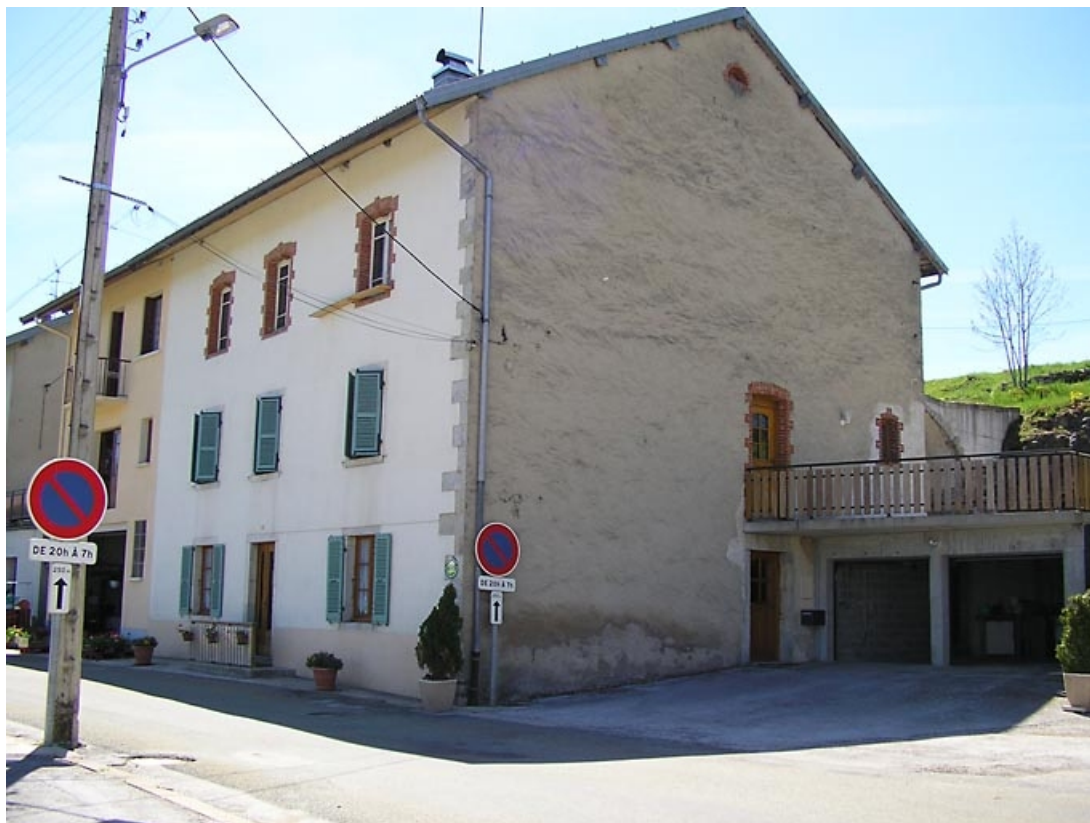
Façade antérieure et pignon nord-est vus de trois quarts.