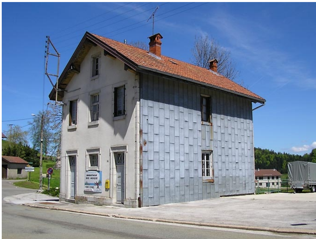
Façade antérieure et pignon sud-ouest vus de trois quarts.