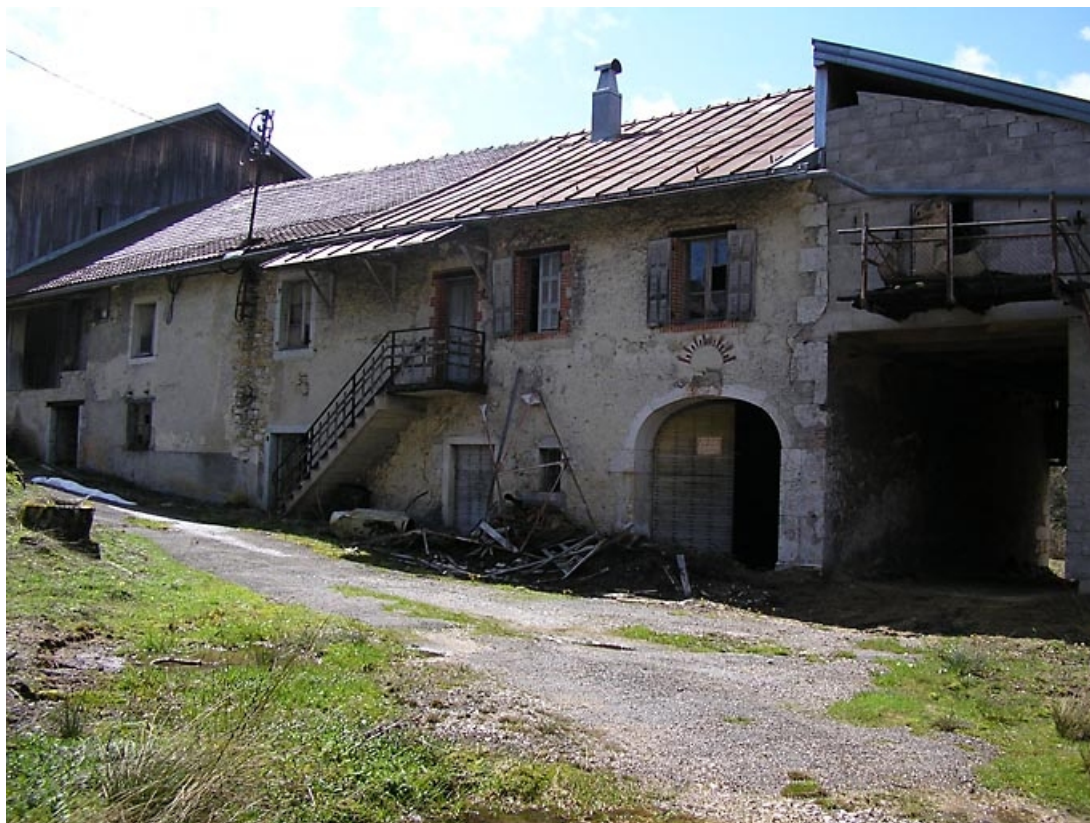
Façade antérieure vue de trois quarts.