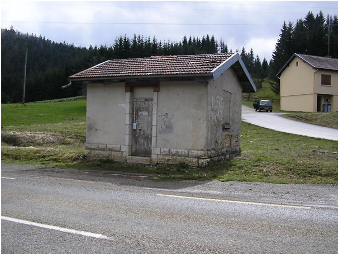
Façades antérieure et latérale vues de trois quarts.

39, Lac-des-Rouges-Truites C.D. 437, lieudit : les Martins