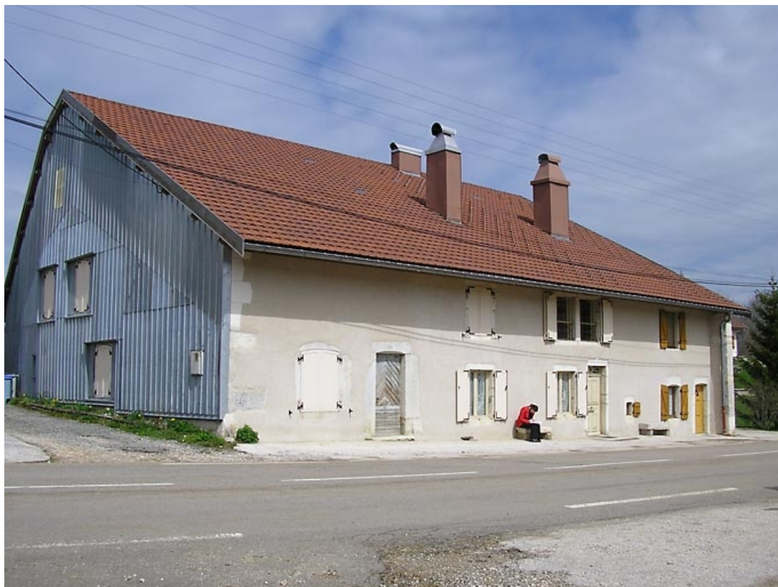
Façade antérieure et pignon sud-ouest vues de trois quarts.