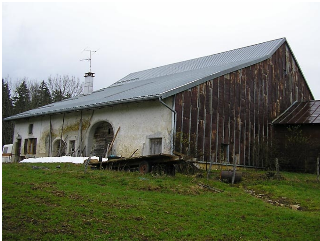
Pignon sud-ouest et façade postérieure vus de trois quarts.