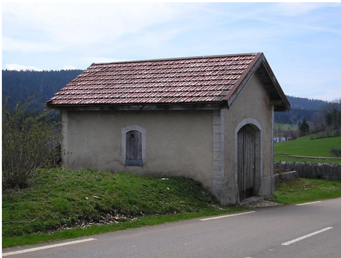
vue de trois quarts sur façades latérale et antérieure.

39, Lac-des-Rouges-Truites C.D. 437, lieudit : le Crétêt