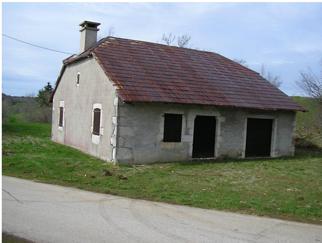
Pignon sud et façade antérieure vus de trois quarts.