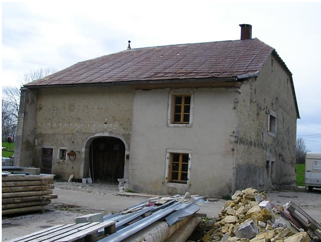
Pignon nord et façade antérieure vus de trois quarts.