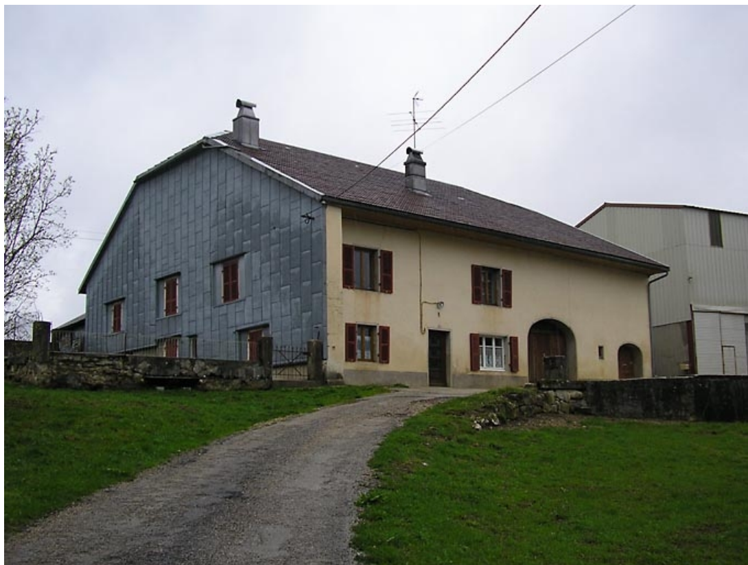
Façade antérieure et pignon sud-ouest vus de trois quarts.