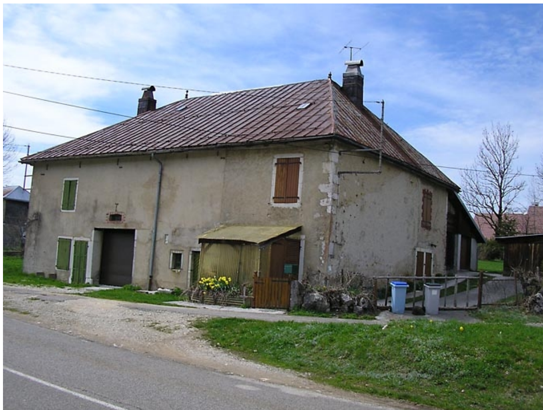
Façades antérieure et latérale vues de trois quarts.