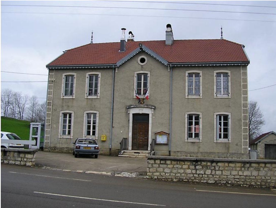
Vue générale de la façade antérieure.

39, Lac-des-Rouges-Truites C.D. 437 157, lieudit : les Thévenins