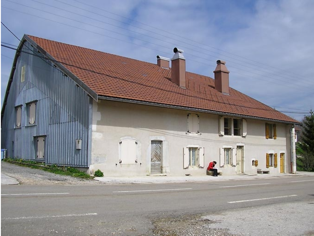
Façade antérieure et pignon sud-ouest vues de trois quarts.