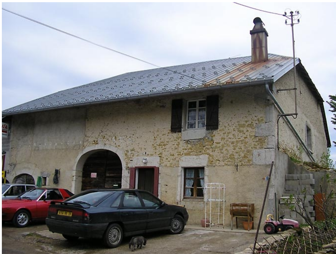
Façade antérieure vue de trois quarts.