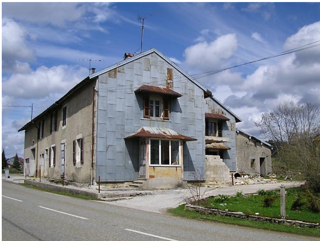
Pignon sud-ouest et façade antérieure vus de trois quarts.