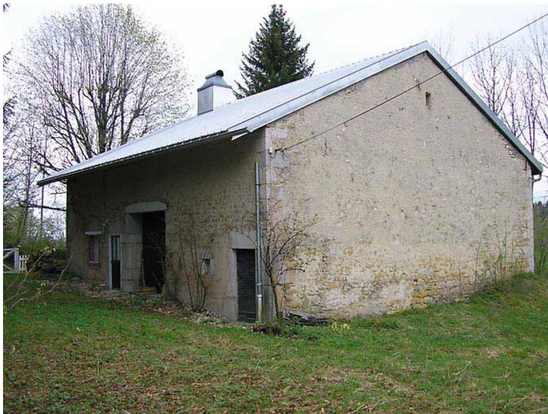
Pignon nord et façade postérieure vus de trois quarts.