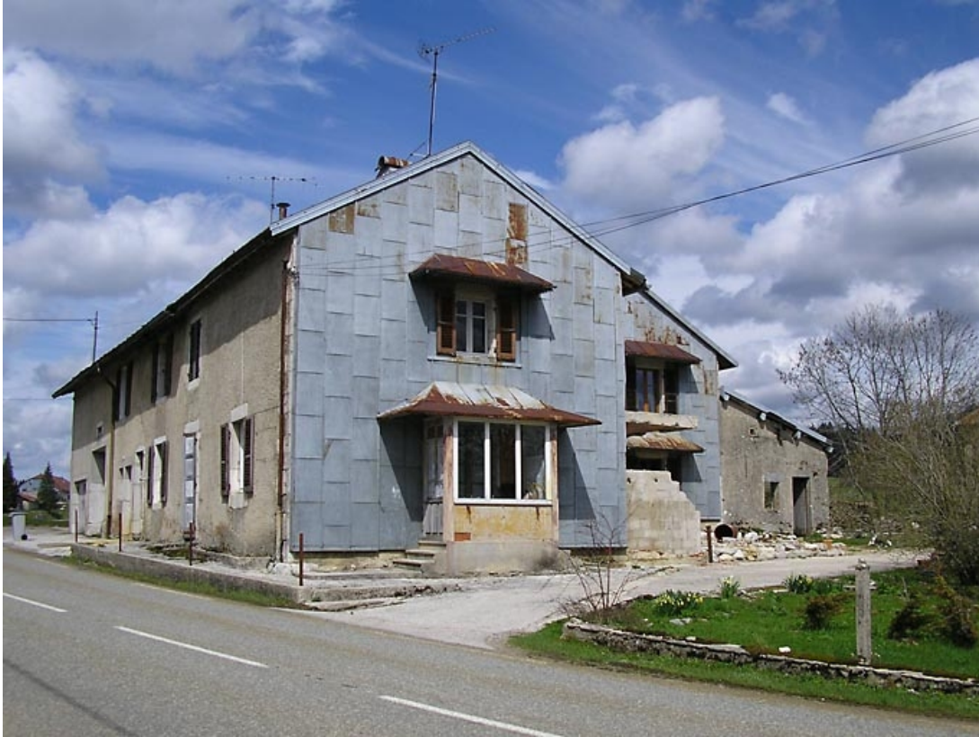
Pignon sud-ouest et façade antérieure vus de trois quarts.