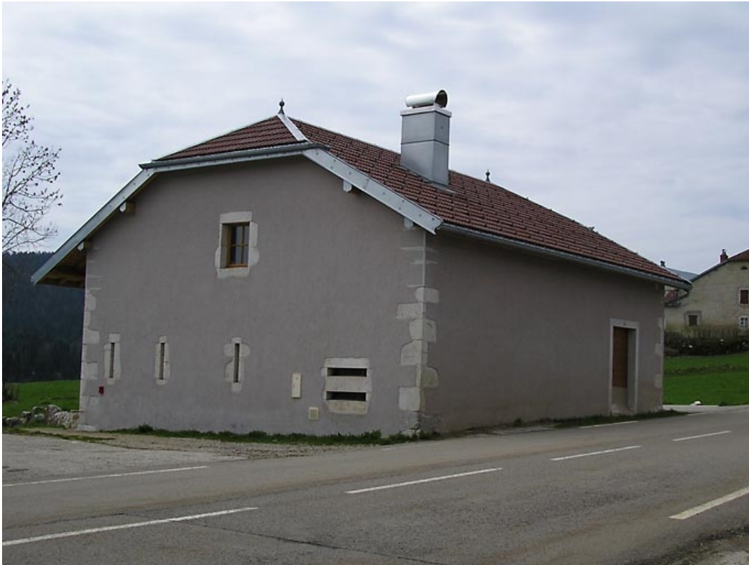
Pignon nord-est et façade antérieure vus de trois quarts.