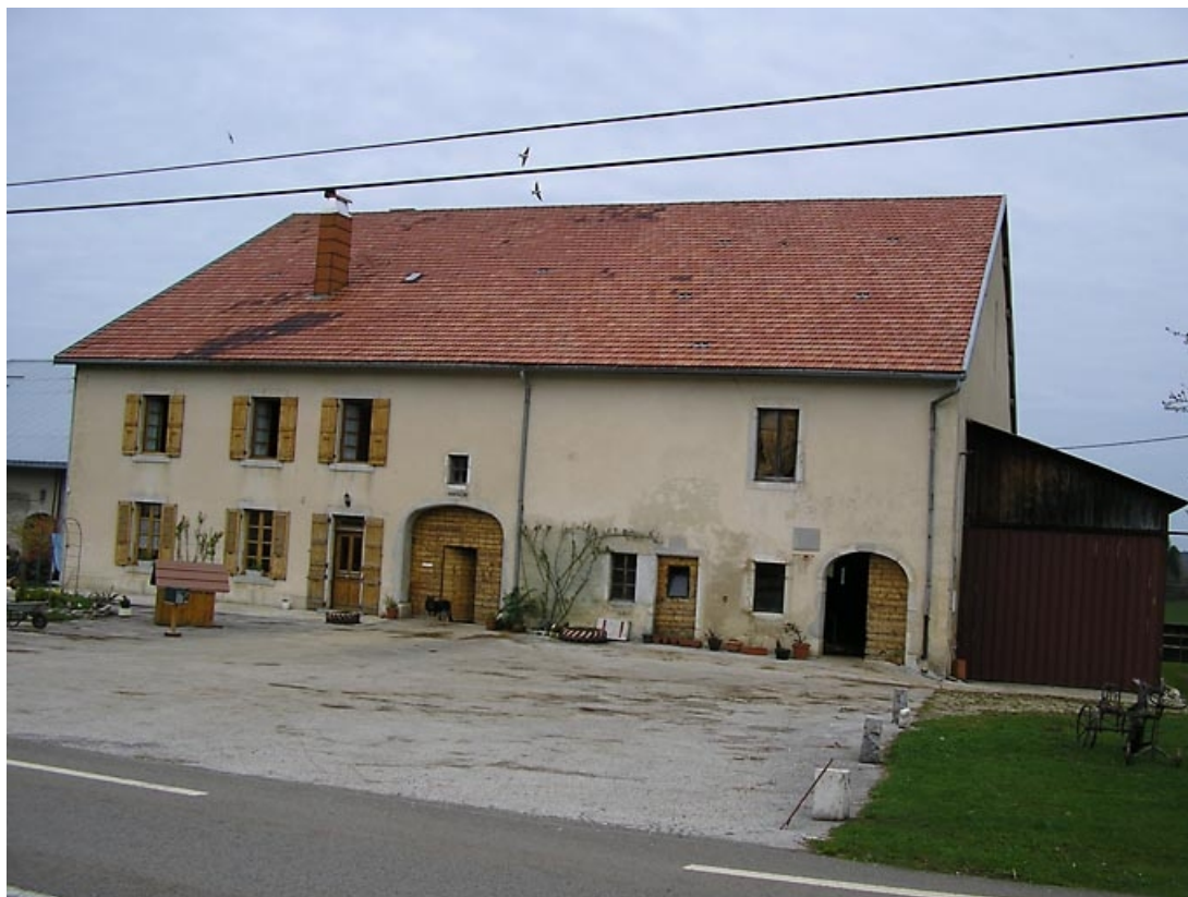
Vue générale de la façade antérieure et de l'appentis.