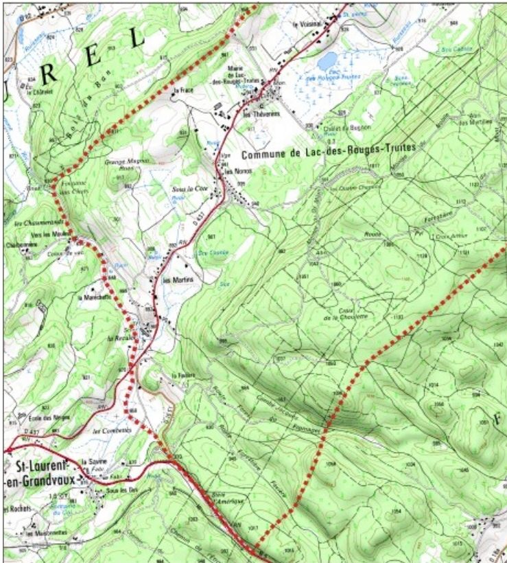
Carte des limites de la commune, partie sud-ouest. Extrait de la carte IGN, échelle 1/25 000 ; SCAN 25 (c) IGN - 2008, Licence n° 2008CISE29-68.