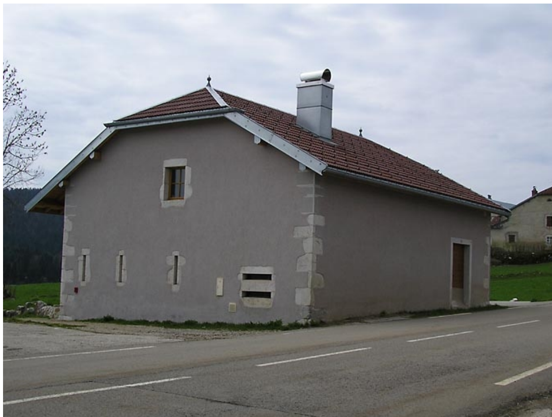
Pignon nord-est et façade antérieure vus de trois quarts.