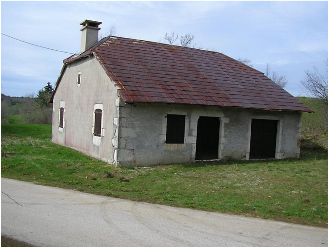
Pignon sud et façade antérieure vus de trois quarts.