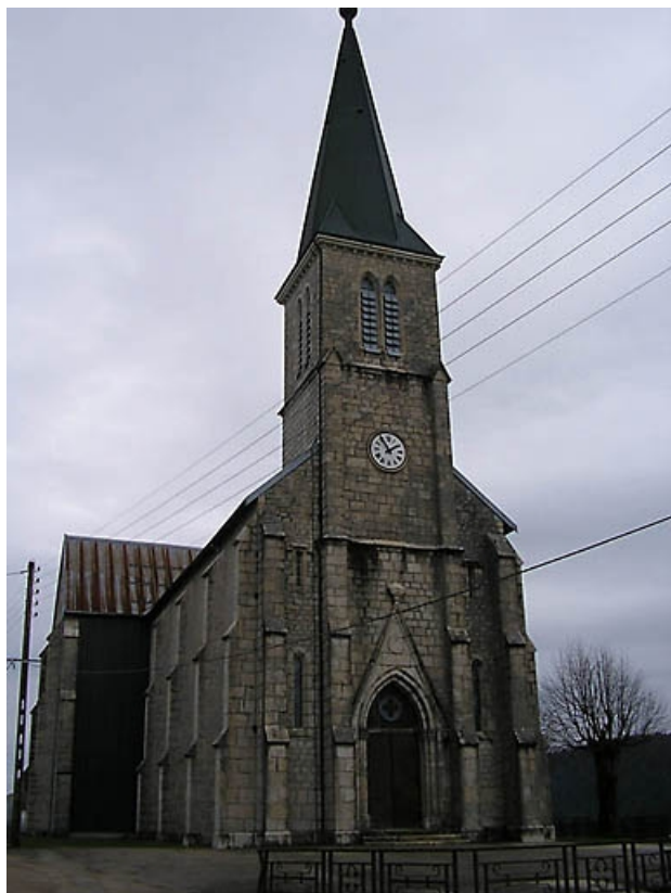
Façade antérieure et clocher.