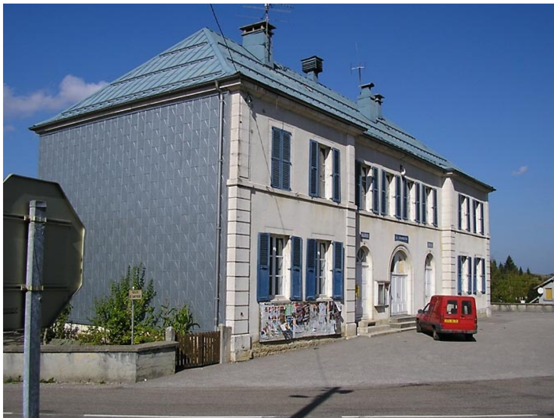
Façade antérieure et pignon sud-ouest vus de trois quarts. 39, La Chaumusse