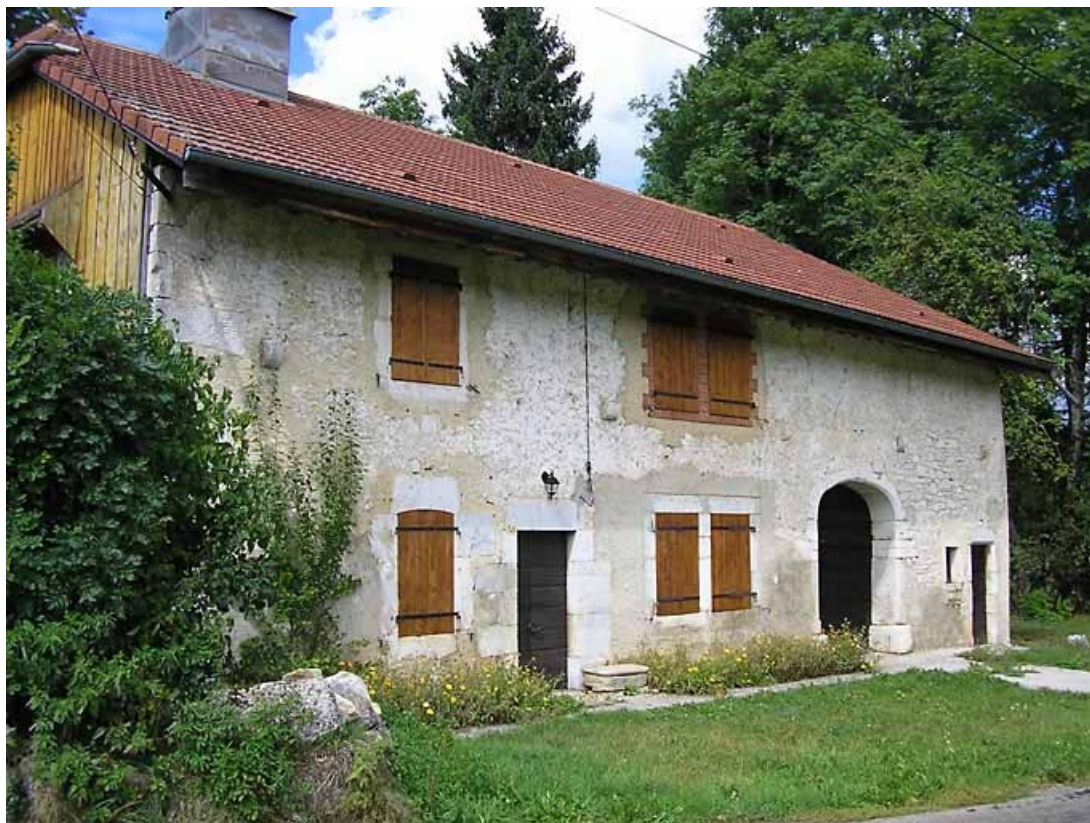
Vue de la façade antérieure.