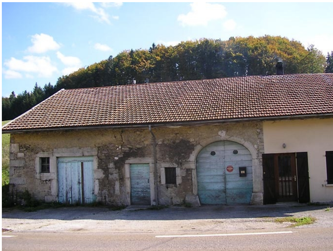
Vue générale de la façade antérieure.