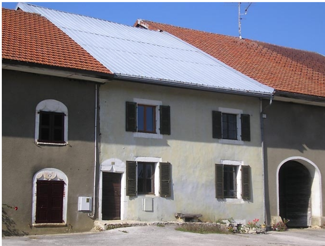
Vue de la façade antérieure.

39, La Chaumusse, 18 route de Genève, lieudit : Pont de Lemme