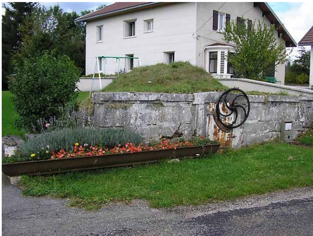
Vue générale, maison en arrière-plan.