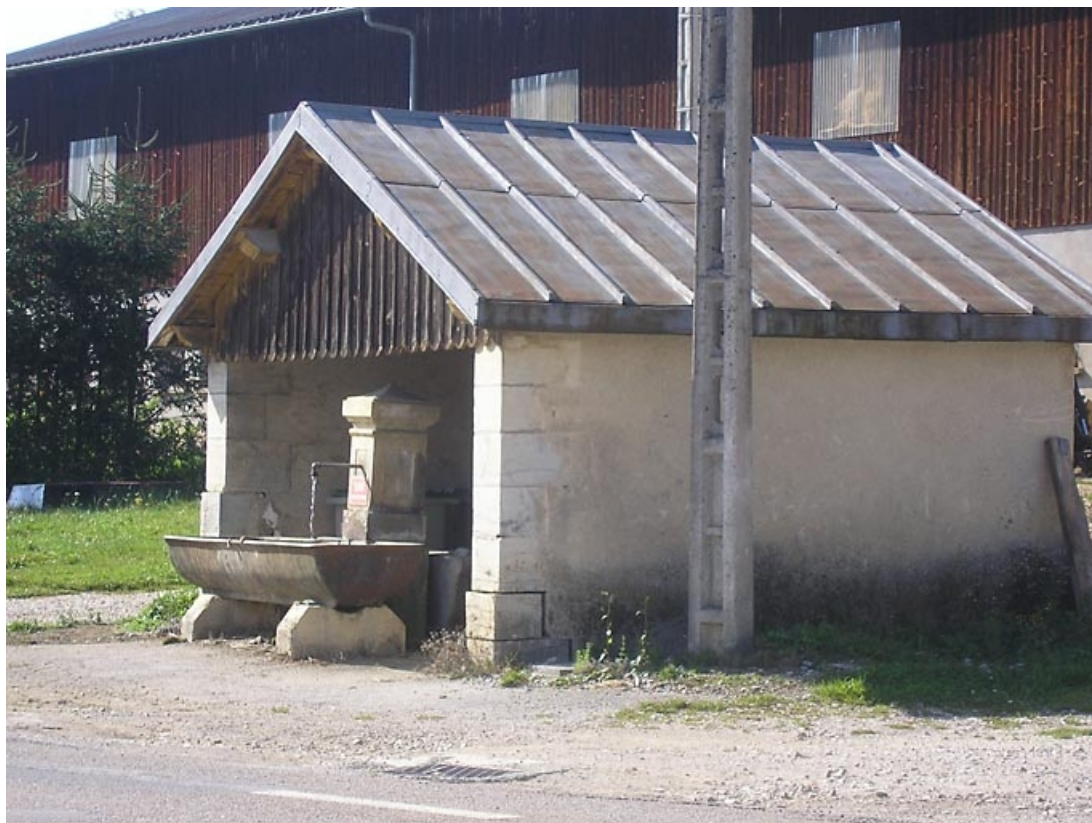
Vue générale de trois quarts.