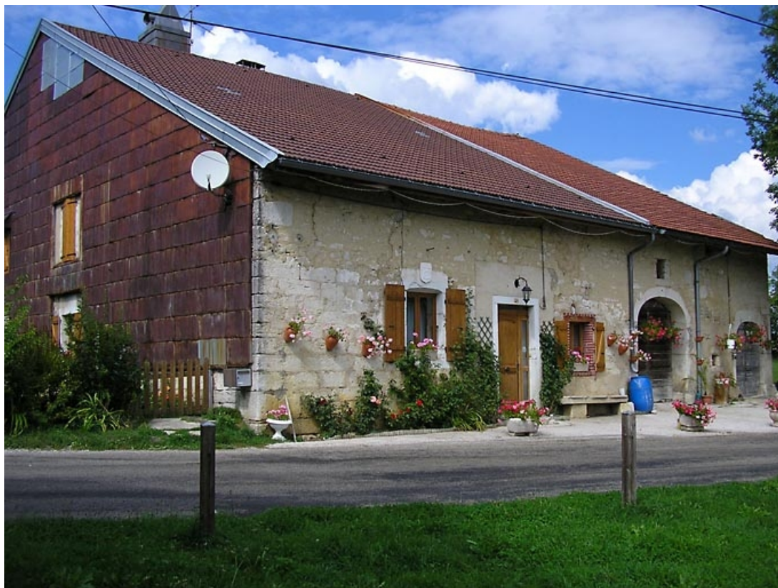
Façade antérieure et pignon sud-ouest vus de trois quarts. 39, La Chaumusse