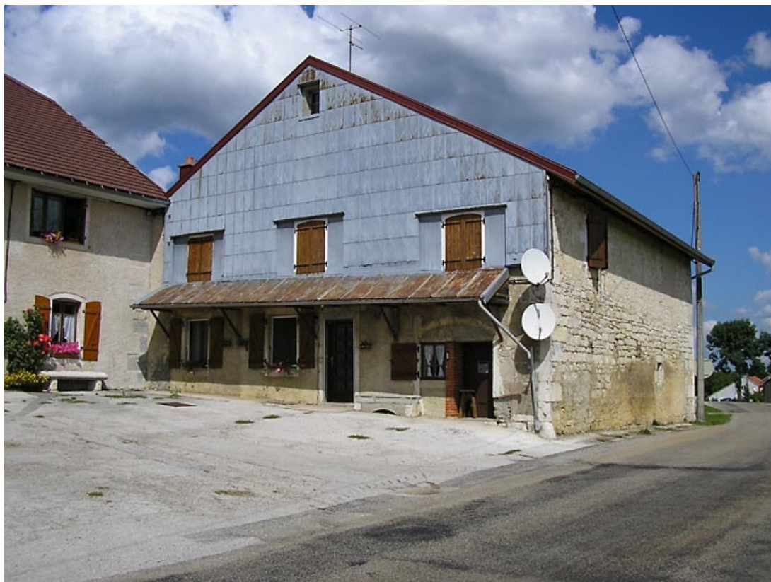
Pignon sud-ouest et façade latérale vus de trois quarts.

39, La Chaumusse, 50 route de Saint-Pierre