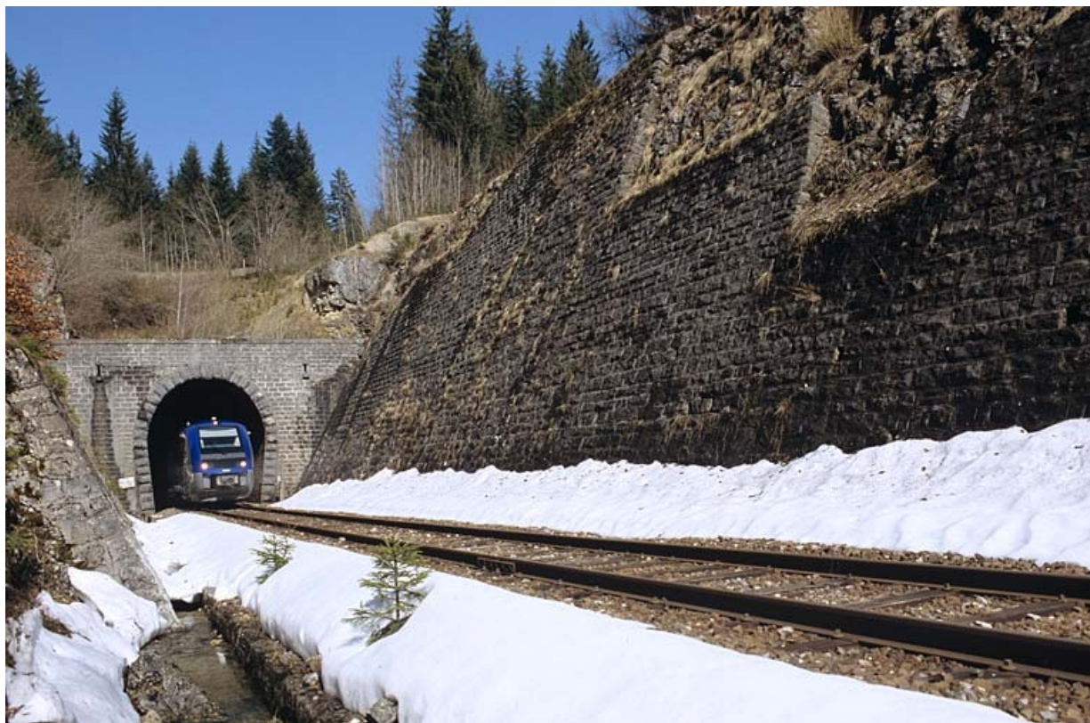
Vue d'ensemble de la tête côté La Cluse, avec autorail X 73500.

39, La Chaumusse, lieudit : la Vie de la Serre