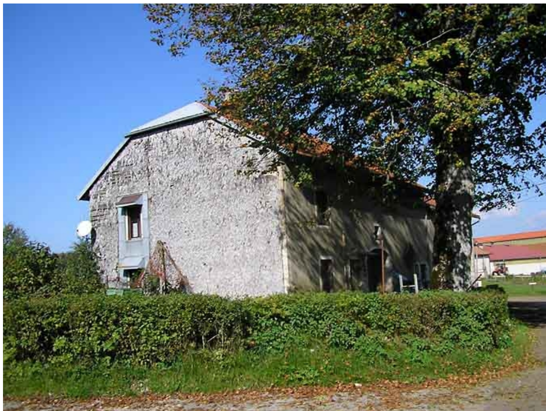
Pignon sud-ouest vu de trois quarts.