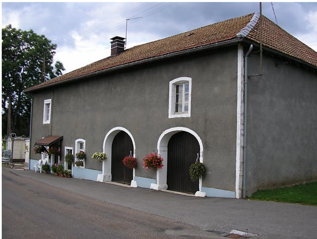
Façade antérieure et pignon nord-est vues de trois quarts. 39, La Chaumusse