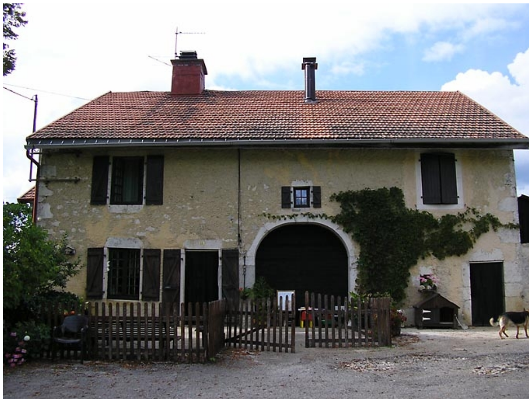
Vue générale de la façade antérieure.