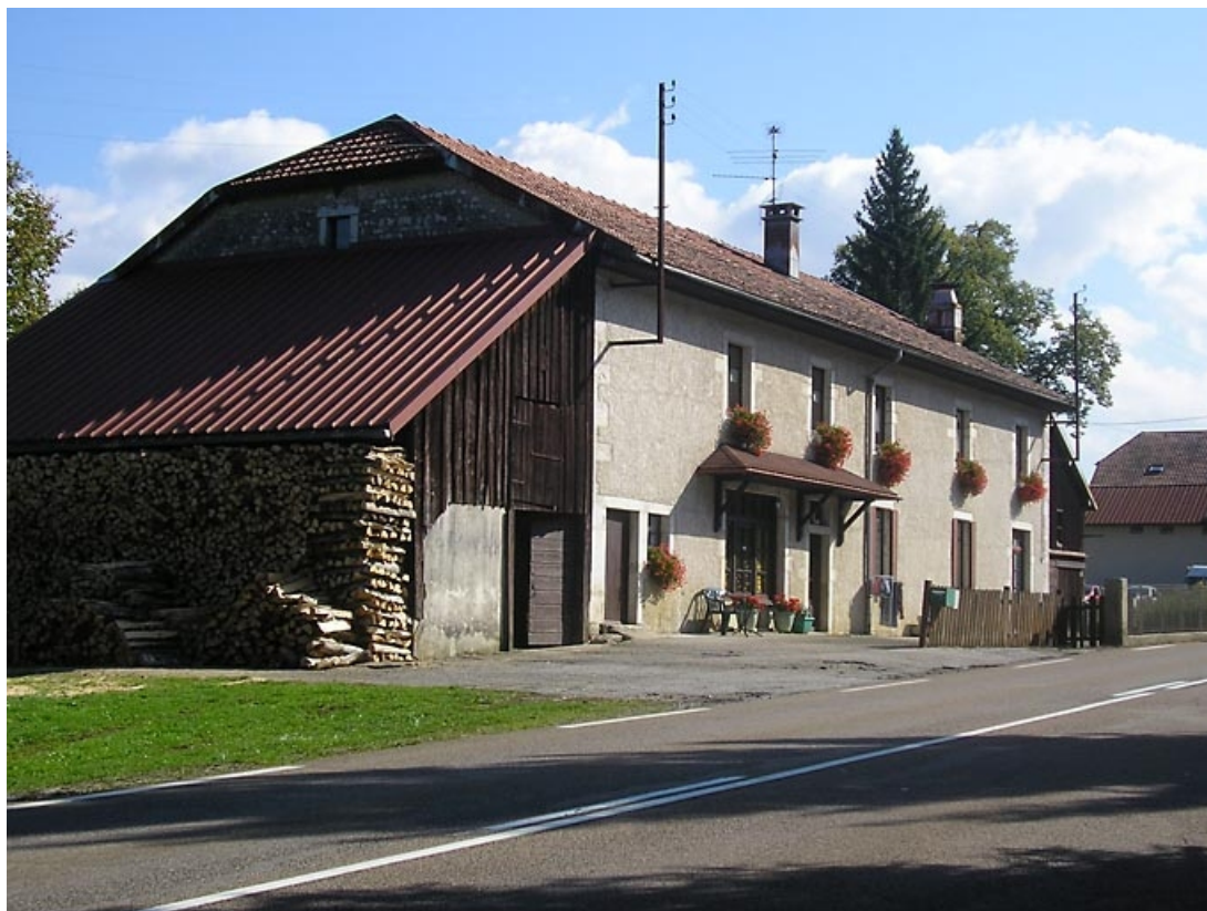
Vue de la façade antérieure et de la remise à l'ouest. 39, La Chaumusse