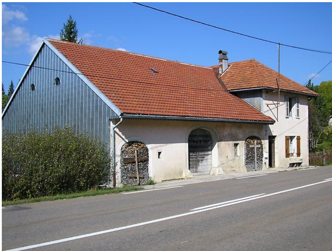
Façade antérieure et pignon sud-ouest vus de trois quarts. 39, La Chaumusse