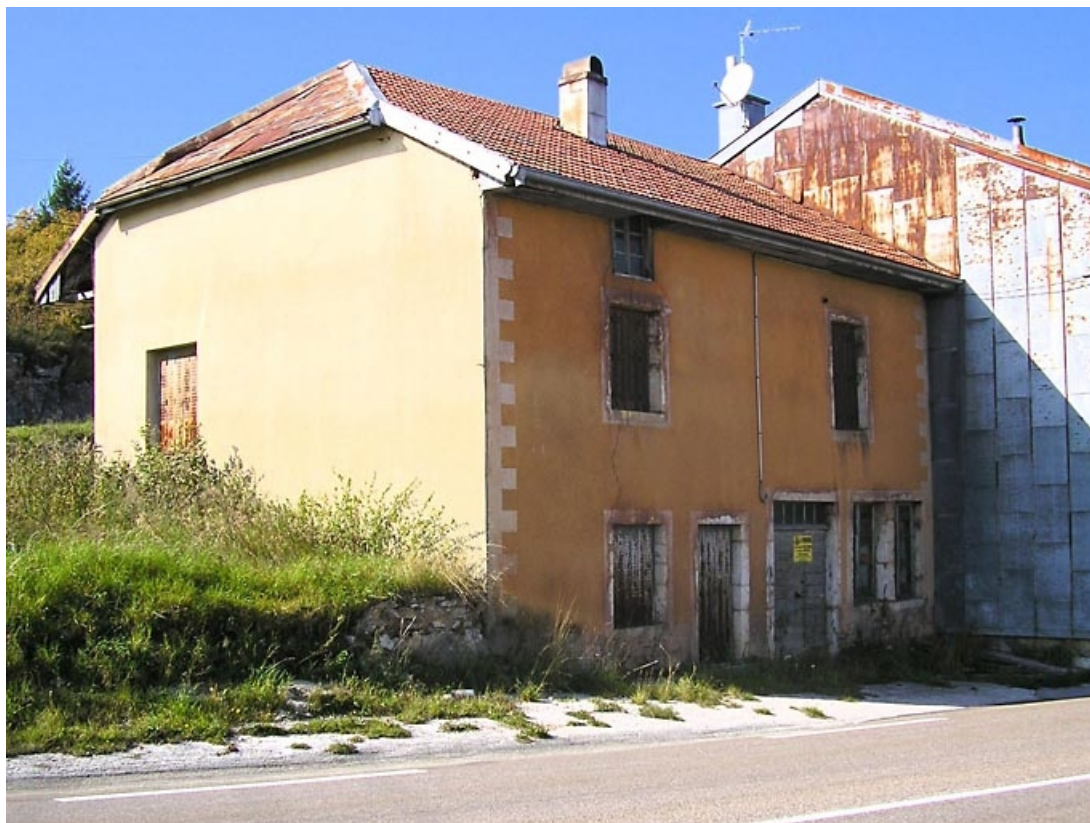
Façade antérieure et pignon est vues de trois quarts.