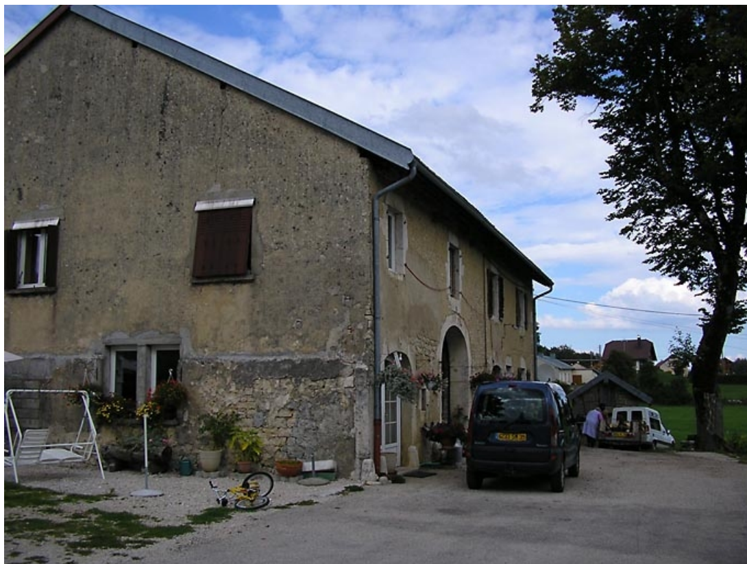
Pignon et façade antérieure vus de trois quarts.

39, La Chaumusse, 23 route de Saint-Pierre