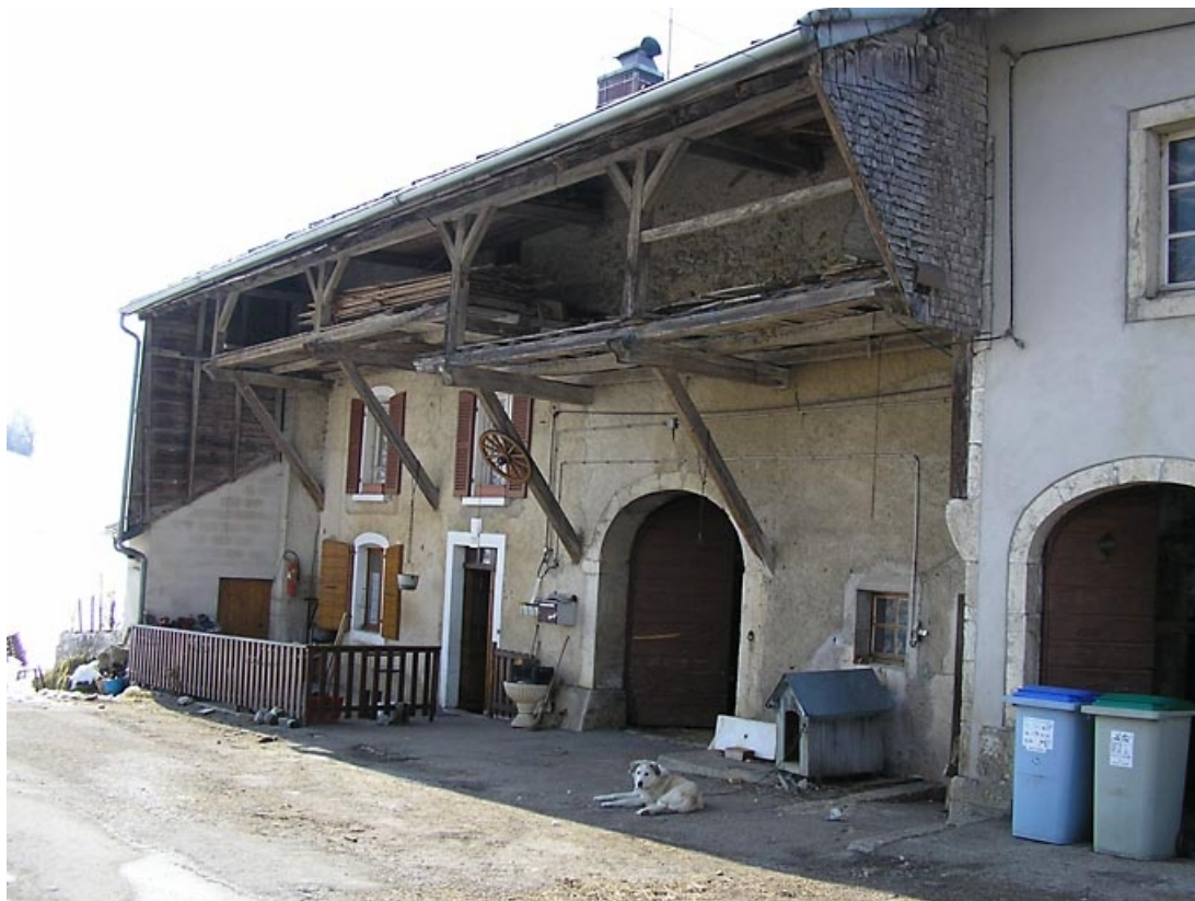
Façade antérieure vue de trois quarts. 39, Grande-Rivière