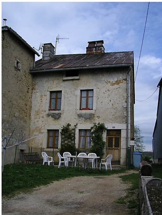
Façade antérieure. 39, Fort-du-Plasne