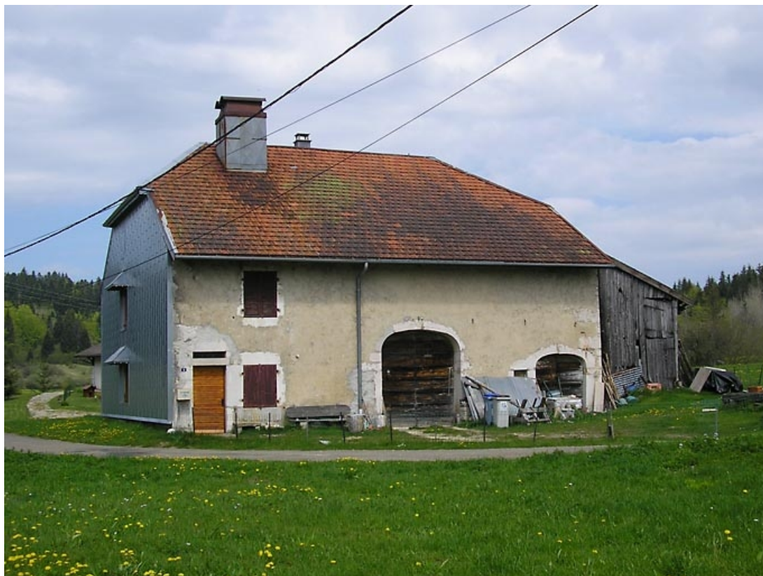
Façade antérieure et pignon sud-ouest vus de trois quarts. 39, Fort-du-Plasne