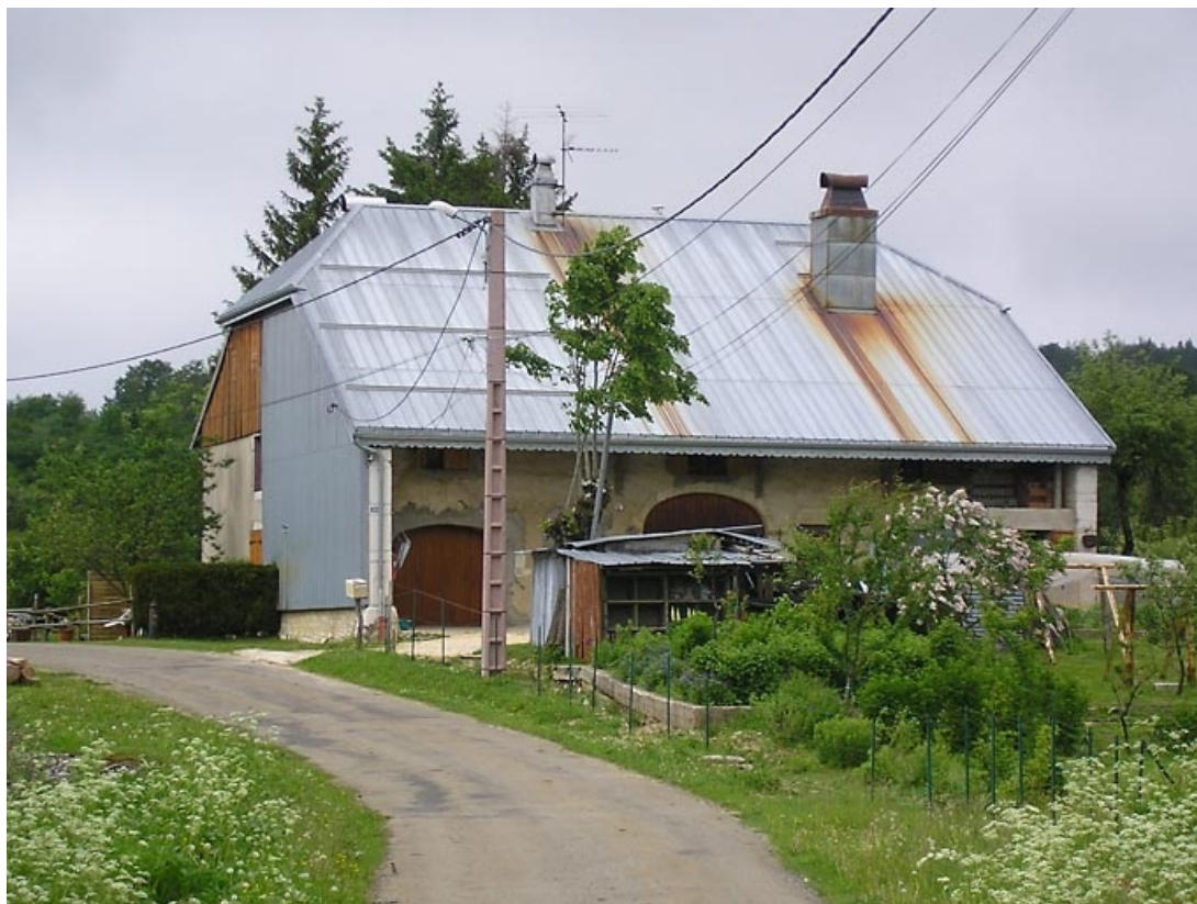
Façade antérieure et pignon sud-ouest vus de trois quarts. 39, Fort-du-Plasne