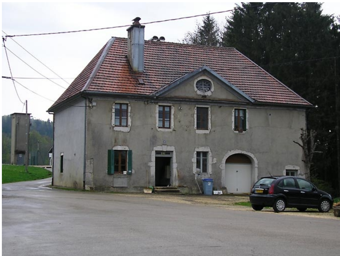
Façade antérieure et pignon nord vus de trois quarts. 39, Fort-du-Plasne