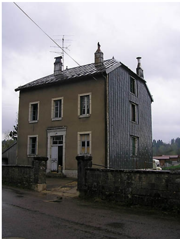
Façade antérieure et pignon sud-ouest vus de trois quarts. 39, Fort-du-Plasne