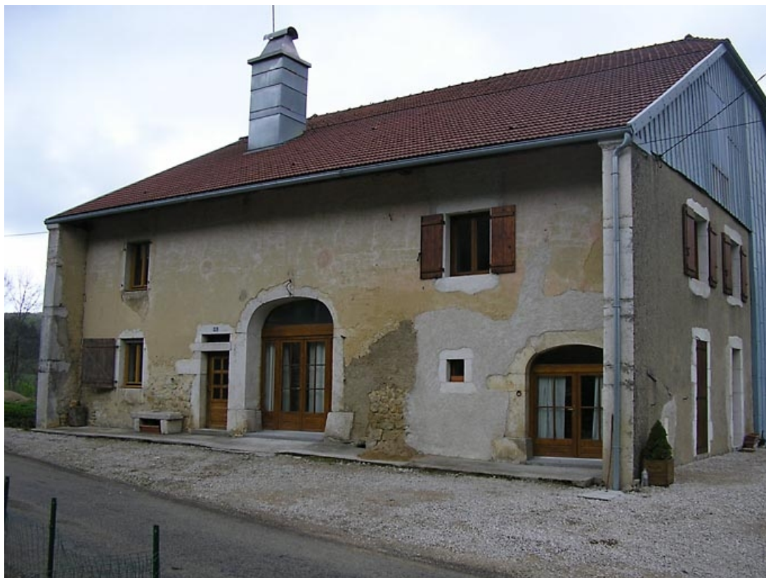
Façade antérieure et pignon sud-ouest vus de trois quarts.

39, Fort-du-Plasne, 62 rue la Ruine, lieudit : la Ruine