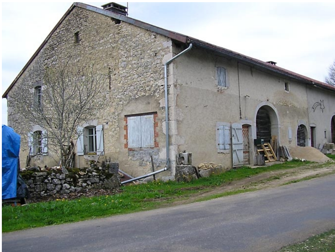
Façade antérieure et pignon nord-est vus de trois quarts. 39, Fort-du-Plasne