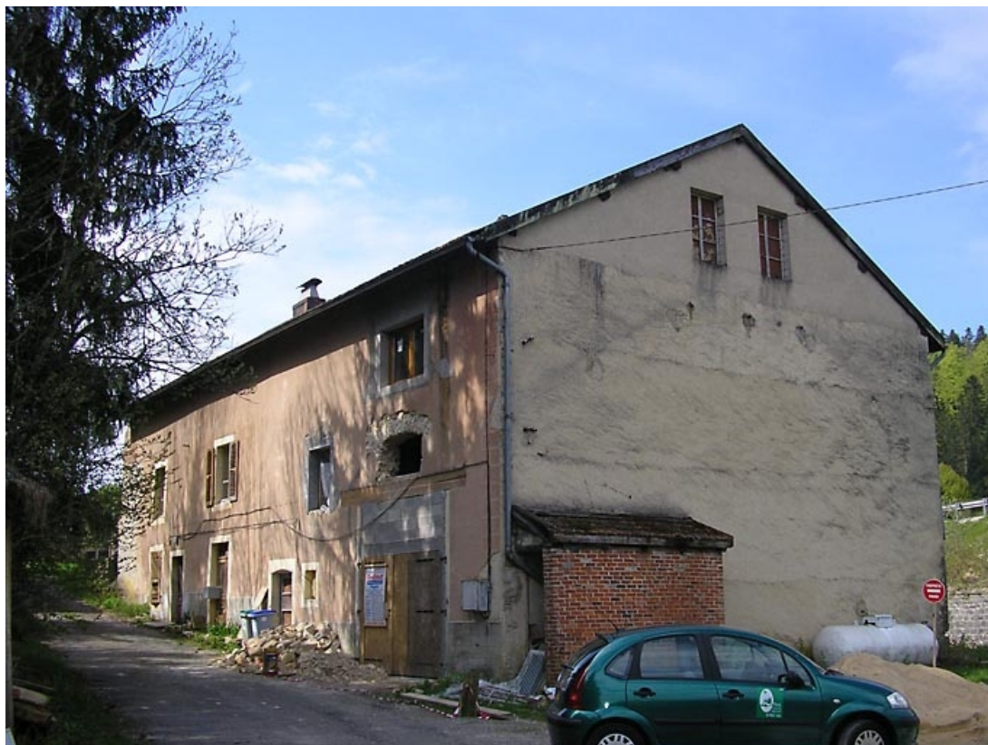
Vue générale de trois quarts.