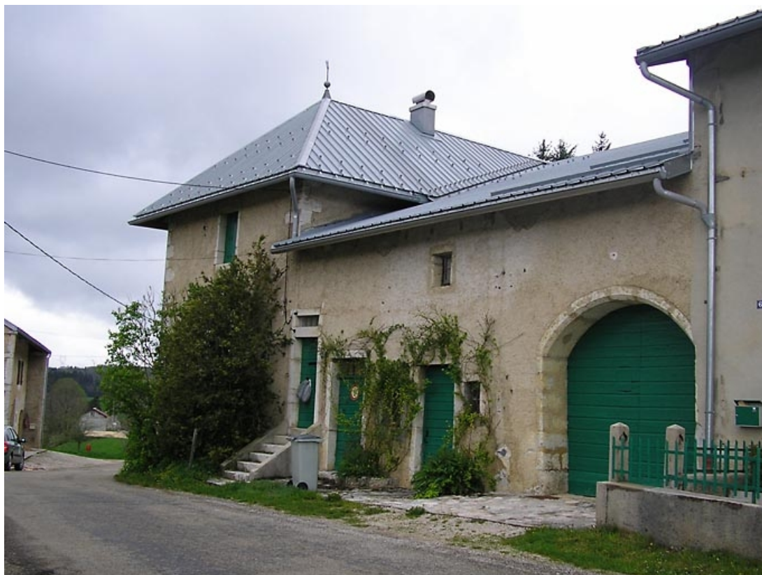
Façade antérieure vue de trois quarts.