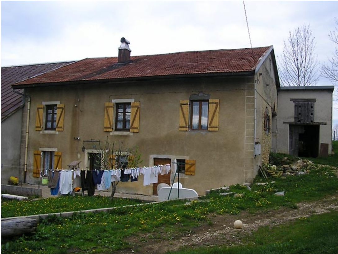
Façade postérieure vue de trois quarts.

39, Fort-du-Plasne, 172 les Monnets, lieudit : les Monnets