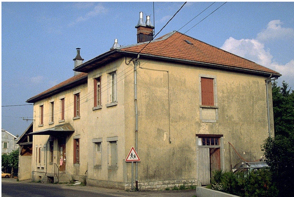
Façades antérieure et latérale droite. 39, Fort-du-Plasne