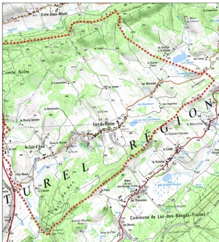
Carte des limites de la commune, partie est. Extrait de la carte IGN, échelle 1/25 000 ; SCAN 25 (c) IGN - 2008, Licence n° 2008CISE29-68.