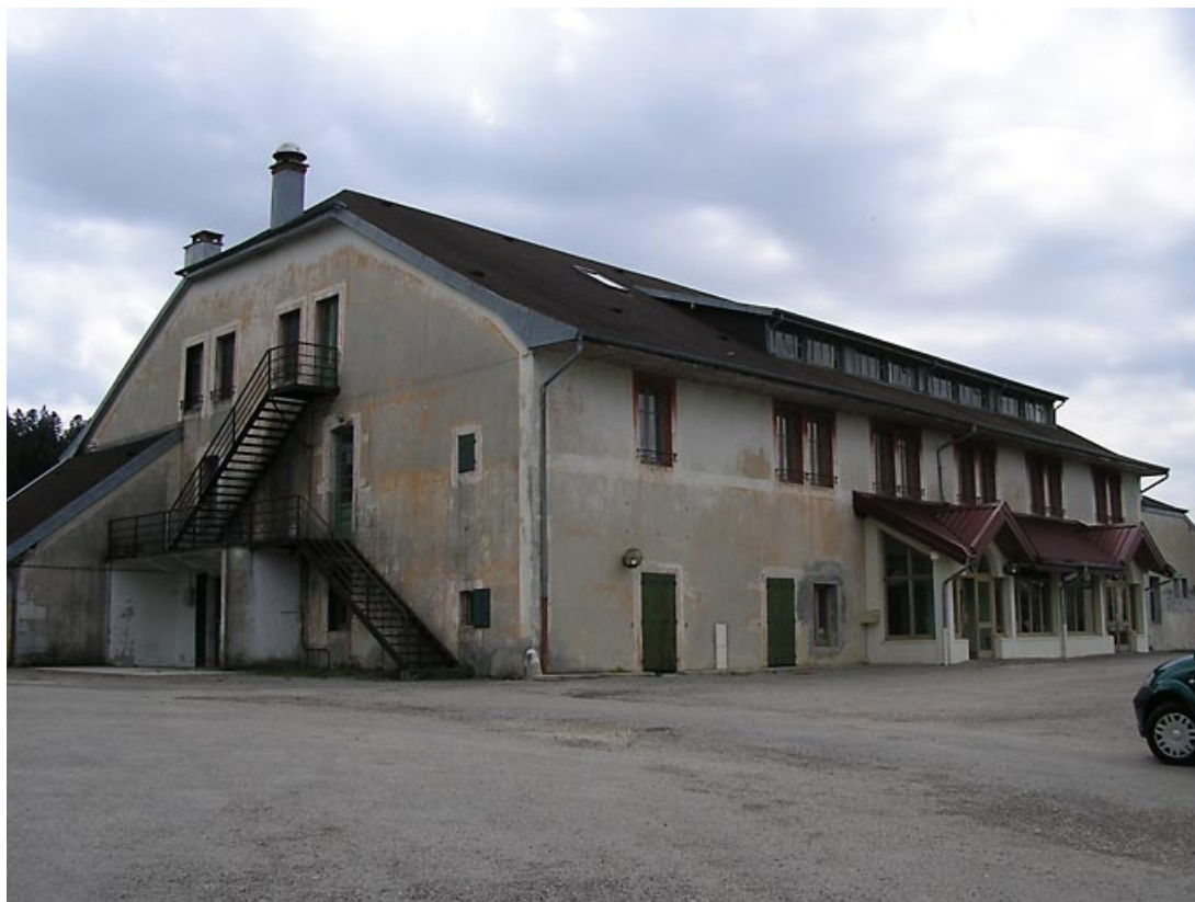
Façade antérieure et pignon nord-est vus de trois quarts. 39, Fort-du-Plasne