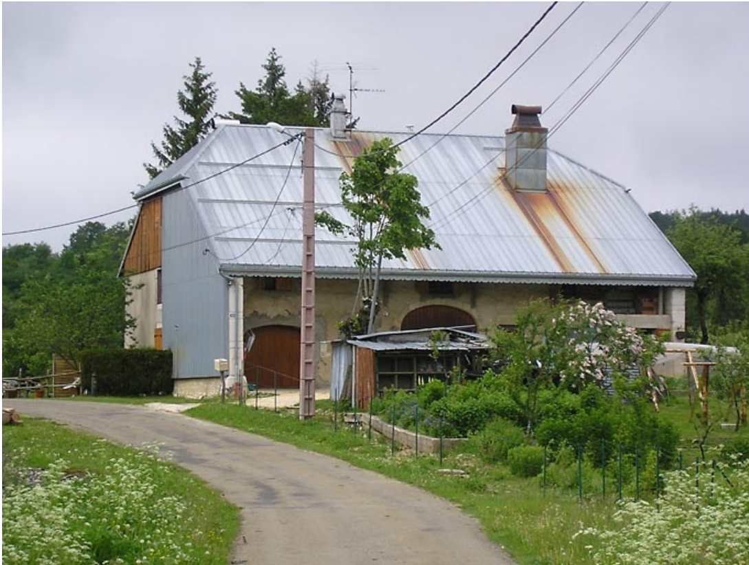
Façade antérieure et pignon sud-ouest vus de trois quarts.