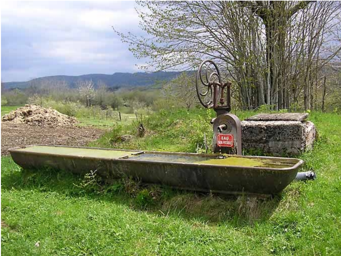
Vue générale de l'ensemble fontaine, abreuvoir et puits.

39, Fort-du-Plasne V.C. 7, lieudit : les Vernes