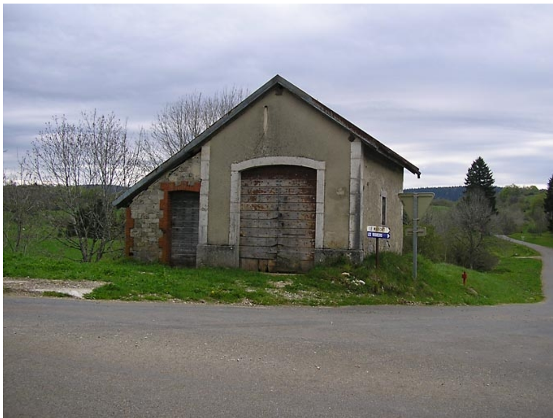
Façade antérieure et appentis.