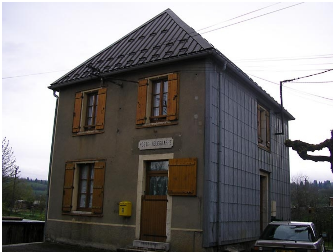
Façade antérieure et pignon sud-ouest vus de trois quarts. 39, Fort-du-Plasne