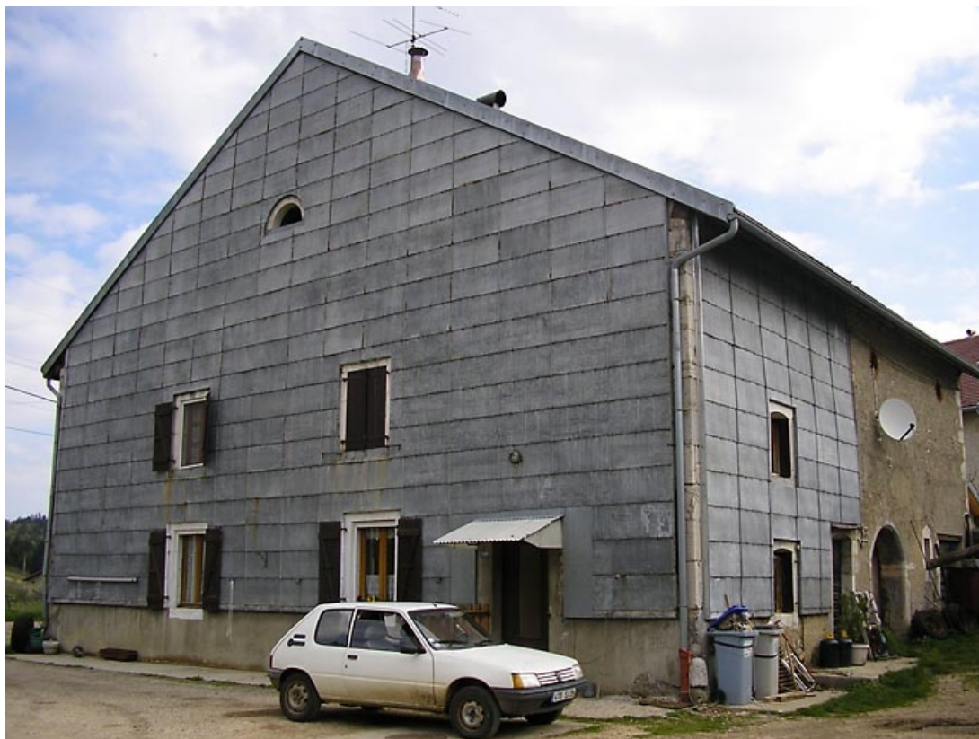
Pignon sud-ouest et façade antérieure vus de trois quarts. 39, Fort-du-Plasne