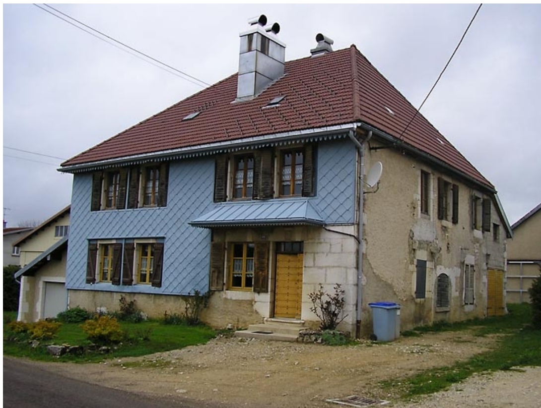
Pignon sud-ouest et façade antérieure vus de trois quarts.