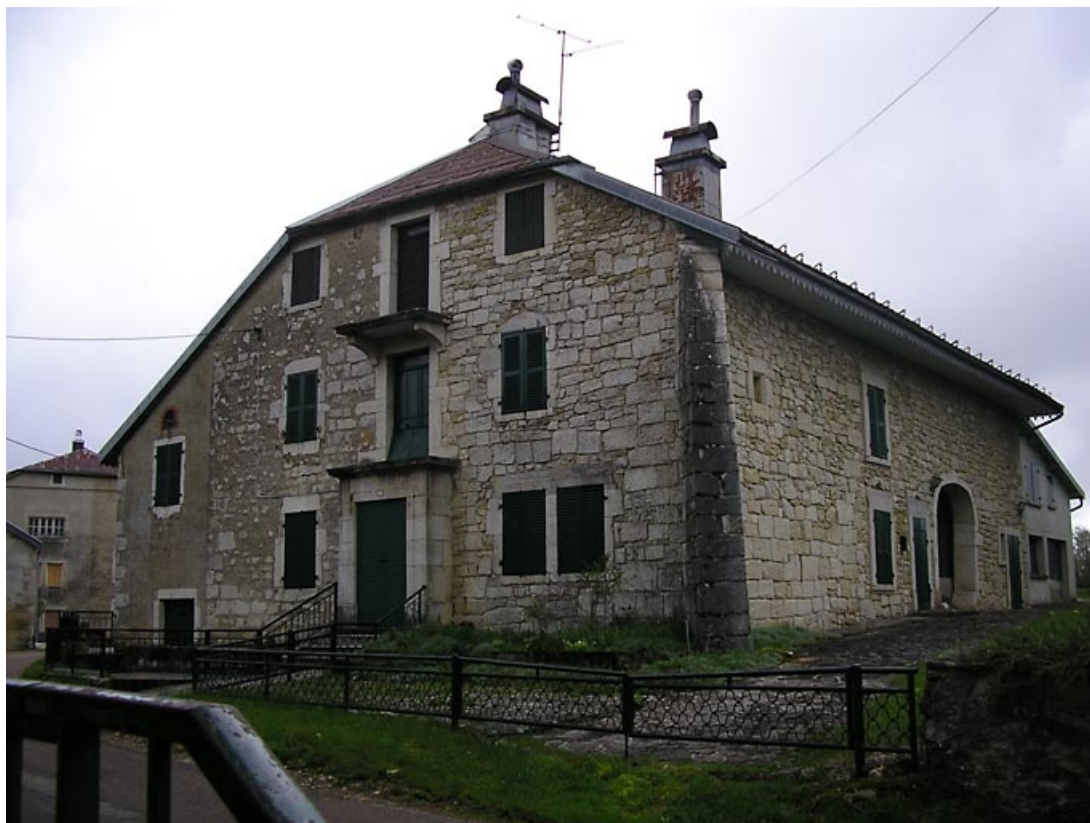
Façades antérieure et latérale vues de trois quarts. 39, Fort-du-Plasne