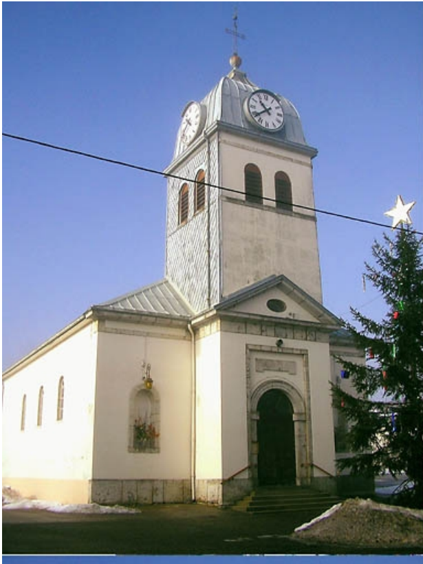
Clocher et façade latérale vus de trois quarts.

39, Château-des-Prés place Saint-Georges