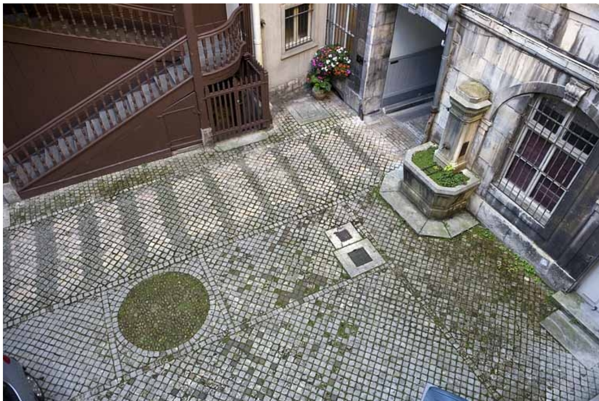
Détail du pavage de la première cour depuis l'escalier droit.

25, Besançon, 64 Grande Rue, lieudit : îlot Terrier de Santans