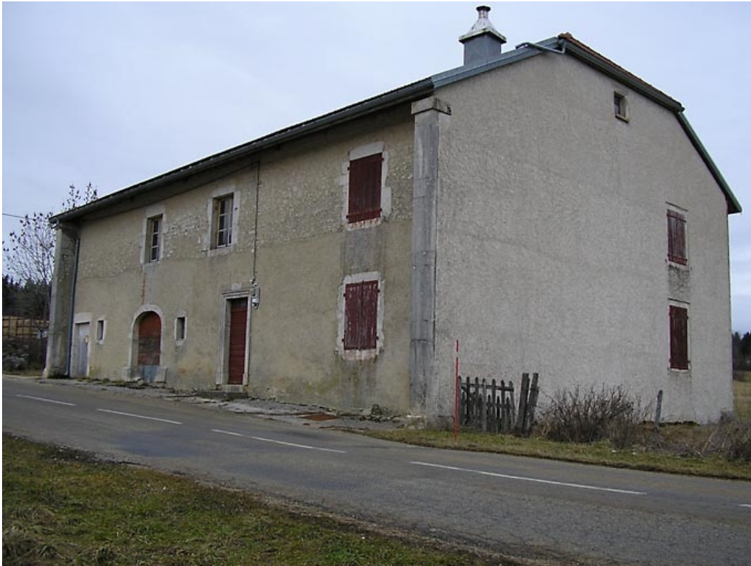
Façade antérieure vue de trois quarts.

39, Château-des-Prés, 10 rue des Lavoires, lieudit : la Loye