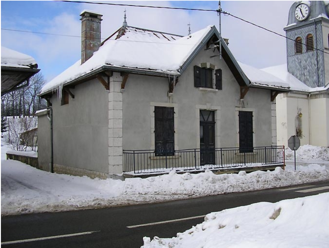
Façade antérieure vue de trois quarts.