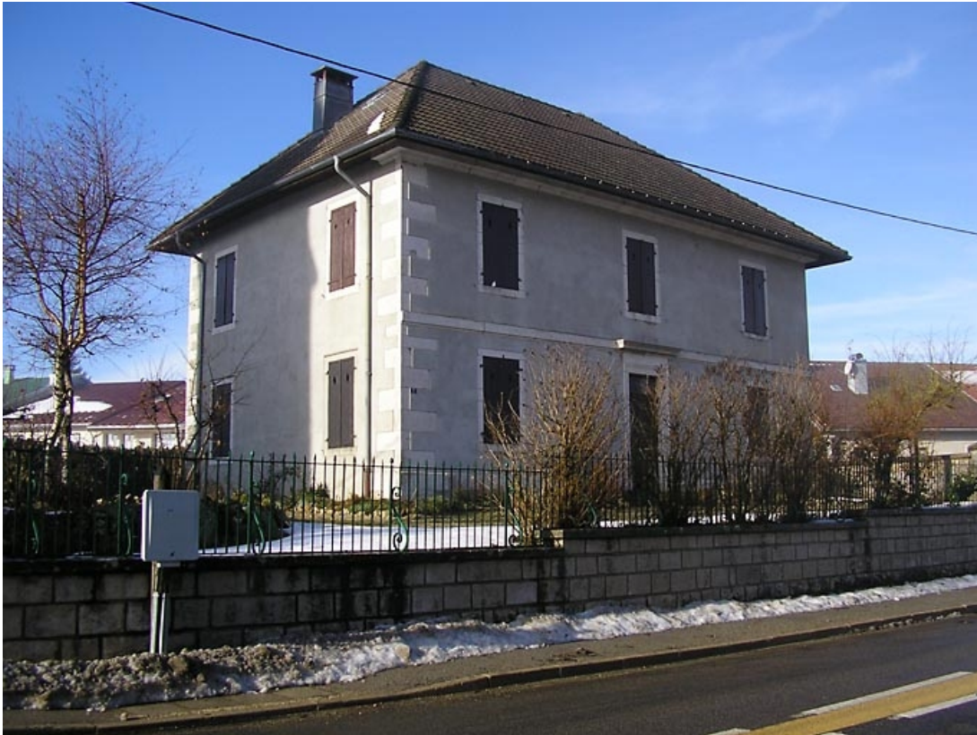
Façade antérieure vue de trois quarts.