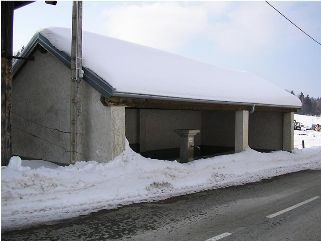
Vue générale trois quarts.