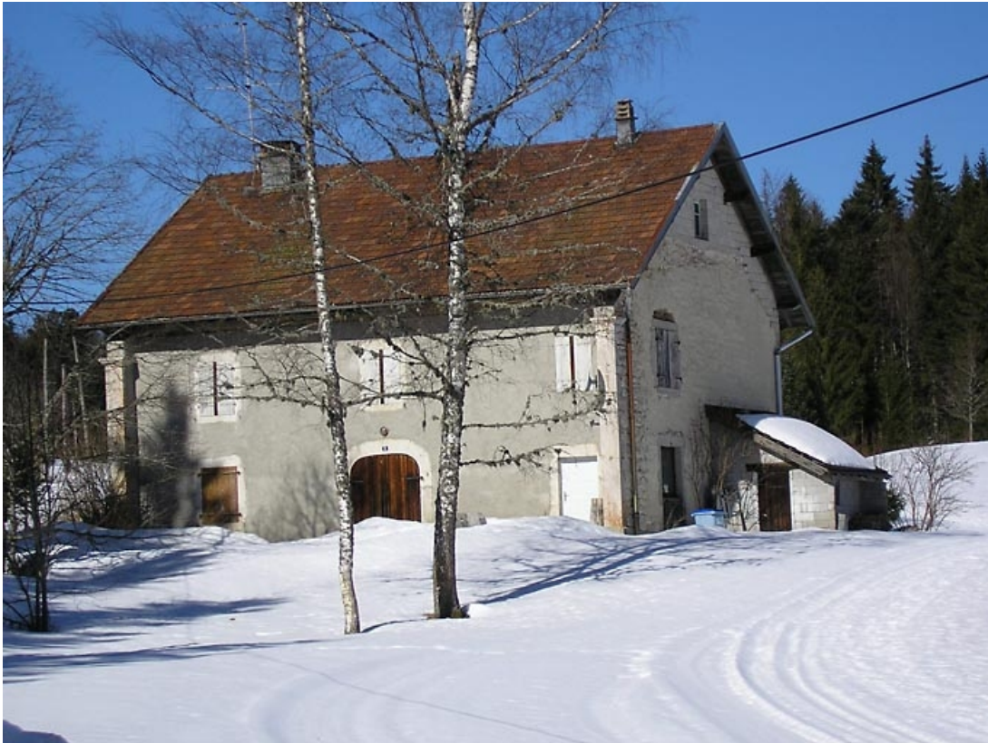
Façade antérieure et pignon sud-ouest vus de trois quarts.

39, Château-des-Prés, lieudit : les Frasses en Bas