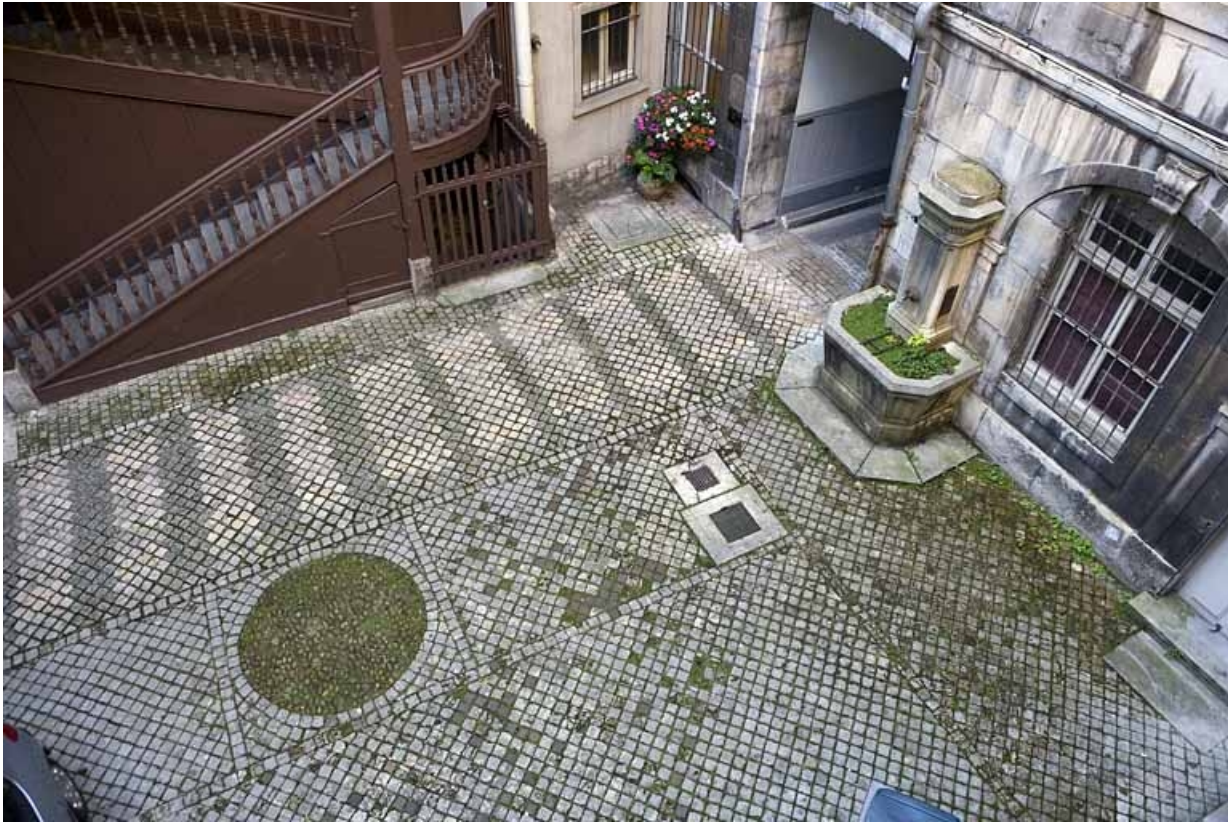
Détail du pavage de la première cour depuis l'escalier droit.

25, Besançon, 64 Grande Rue, lieudit : îlot Terrier de Santans