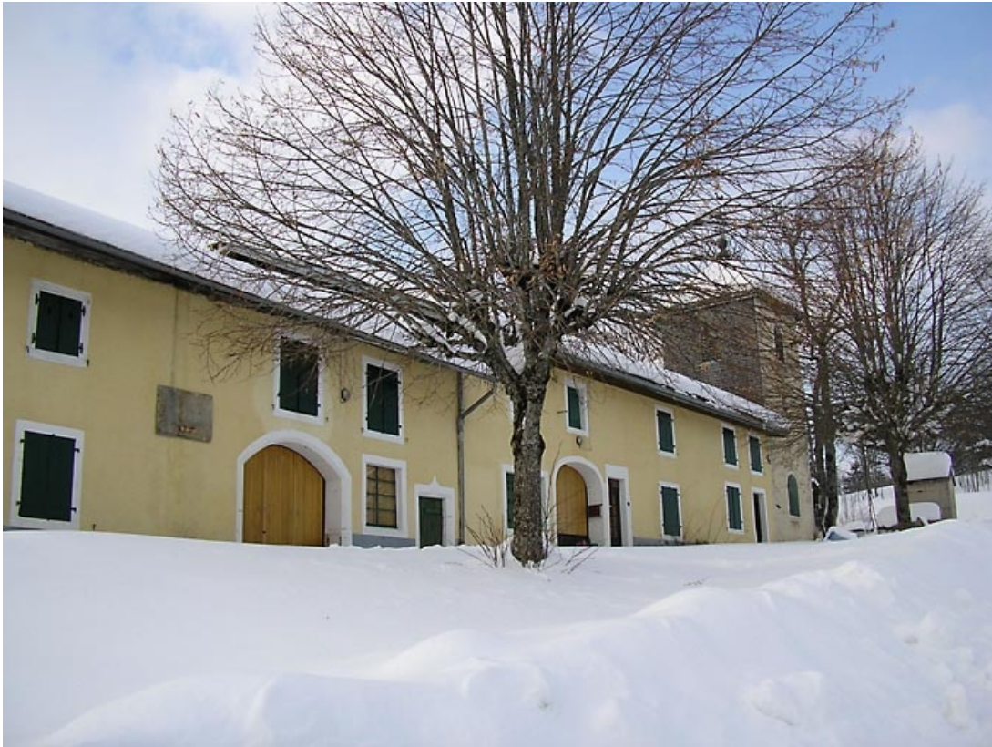
Vue de trois quarts de la face latérale.

39, Château-des-Prés, 6 les Frasses-en-Haut, lieudit : les Frasses