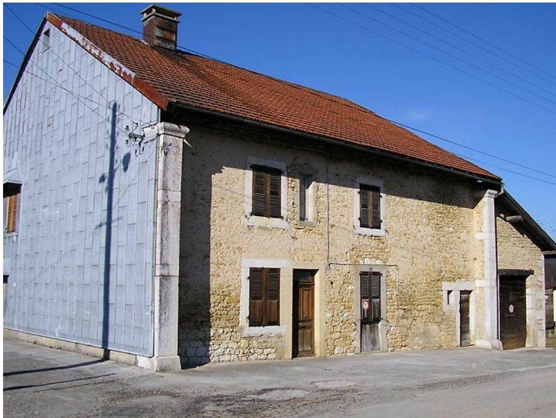
Façade antérieure et pignon sud-ouest vus de trois quarts.

39, Chaux-des-Prés, 6 chemin communal du Culoche, lieudit : les Chaumiers