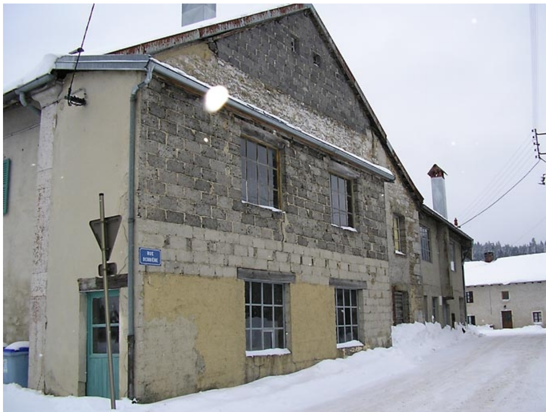
Façade latérale vue de trois quarts.