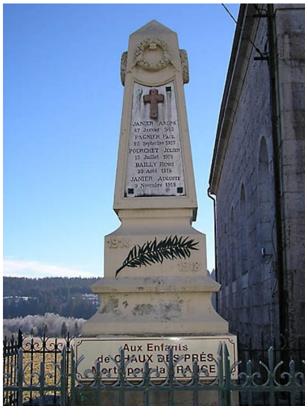
Vue de la partie du monument dédié à 1914-1918. 39, Chaux-des-Prés