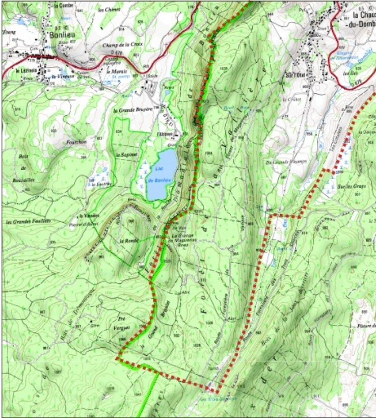
Carte des limites de la commune, partie sud. Extrait de la carte IGN, échelle 1/25 000 ; SCAN 25 (c) IGN - 2008, Licence n° 2008CISE29-68.