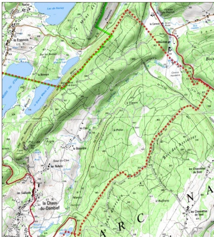
Carte des limites de la commune, partie nord-est. Extrait de la carte IGN, échelle 1/25 000 ; SCAN 25 (c) IGN - 2008, Licence n° 2008CISE29-68.