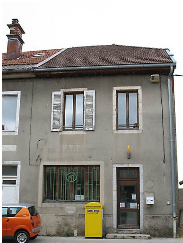
Vue générale de la façade antérieure.