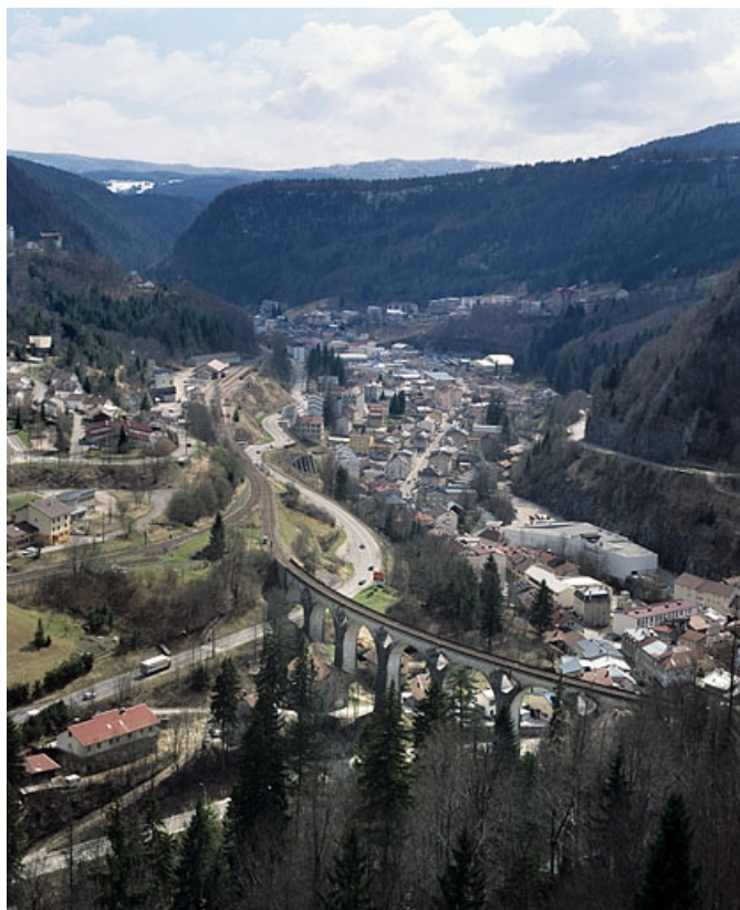
La vallée depuis le viaduc des Crottes, au nord. 39, Morez