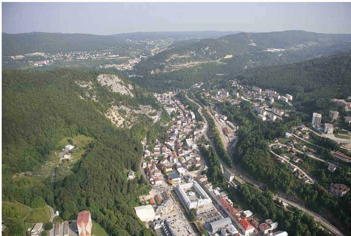
Vue aérienne du centre et du bas de la ville, depuis le sud. 39, Morez