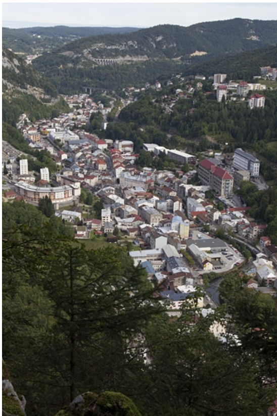
La vallée, depuis le belvédère du Béchet, au sud. 39, Morez